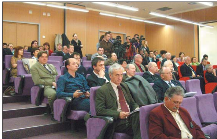
A magyar oktatók nem vettek részt a közmeghallgatáson