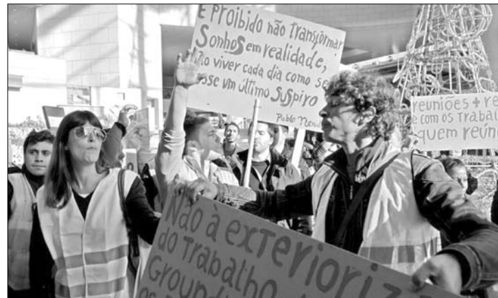
Sztrájkoltak tegnap Portugáliában. Nem akarnak Görögország sorsára jutni

Közben június végéig leállította az európai uniós támogatási pénzek lehívását a cseh kormány, hogy addigra megszüntesse a nemzeti ellenőrzési rendszer hiányosságait – jelentette be a napokban a regionális fejlesztési miniszterium. A tárca közleménye szerint konkrétan az európai regionális fejlesztési és a kohéziós alapról van szó. Brüsszel már korábban figyelmeztette Csehországot: ha nem lép időben, akkor könnyen Magyarország sorsára juthat, és az unió júliustól általánosan felfüggesztheti a támogatások kifizetését. ◀