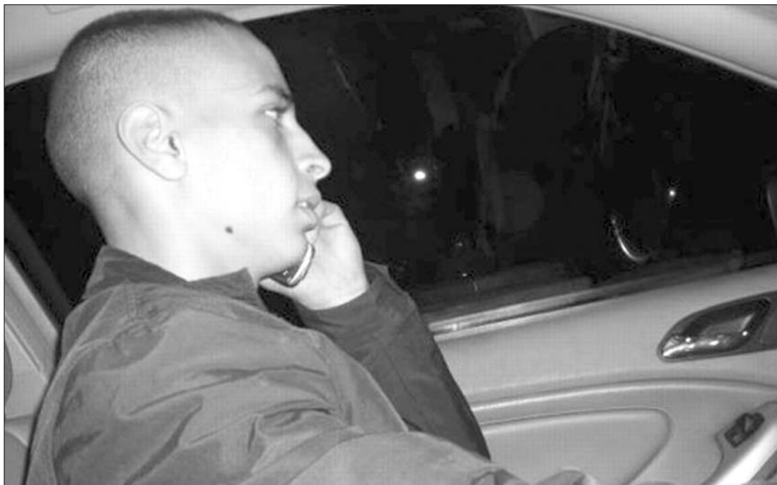
Kevés fénykép készült a terroristáról. Mohammed Merah imádta a gyors kocsikat, szerettt túraautózni

A magát az al-Kaida terror-szervezet tagjának mondó, radikális iszlamista nézeteket valló Mohammed Merah a kommandósokkal folytatott tárgyalásai során mind a három merénylet elkövetését magára vállalta, s azt állította, hogy egyedül hajtotta végre. ◀