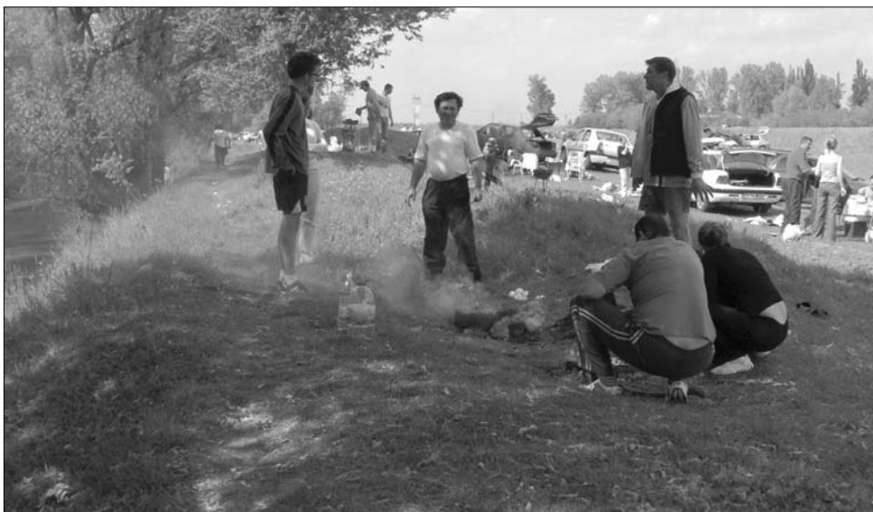
Idén május 1-jén még szabadon lehet „garázdálkodni” a szabadban, a hatóságok nem büntetnek