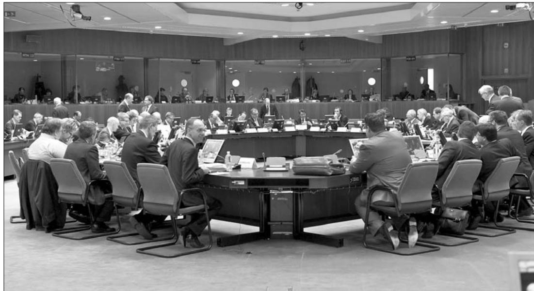
Üléseznek a pénzügyminiszterek. A hosszú vita miatt arra lehetett számítani, hogy szeptemberre halasztják a döntést

Diplomáciai források szerint négy tagállam – állítólag Nagy-Britannia, Lengyelország, Ausztria és Csehország – azt szeretné elérni, hogy a felfüggesztésről szeptemberre halasszák a döntést; más források szerint Németország is hajlott erre a megoldásra, míg az Európai Bizottság kártartott a javaslat mellett. ◀