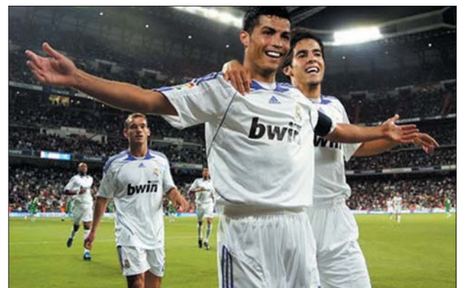
Cristiano Ronaldo Realjának a gólnélküli döntetlen is megfelelő

A londoni Stamford Bridge-stadionból a TVR 1 , a madridi Santiago Bérnabeus-stadionból pedig a Dolce Sport sugároz élőben, egyformán 21.40 órai kezdettel. ◀