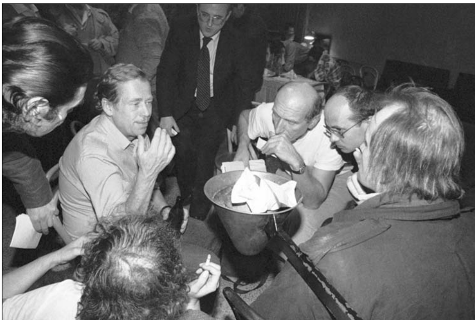
A színházak sztrájkoltak. Előadás helyett polgári fórumokat tartottak, amelyeken részt vett Václav Havel is Helsinki folyamat

őket. Ez az aláírási akció volt a Kádár-rendszer első igazán komoly és nemzetközileg nagy visszhangot kiváltó alternatív értelmiségi megmozdulása. Ezen az aláírói színpadon együtt először azoknak a neve, akik a későbbiekben főként a „demokratikus ellenzék” nevű mozgalom prominens képviselői lesznek. A Charta '77 nevű szervezet megalakulása lényegében egybeesett a lengyelországi Munkásvédelmi Bizottság (KOR) létrejöttével is. E két mozgalom megszerveződése belső korszakhatár a kelet-közép-európai állam szocialista rendszerek történetében. Jelzés arról, hogy ezekben az országokban az értelmiség egy kisebbsége fel kívánja mondani azt a hallgatolagos közmegegyezést, amely megkötötte a hatalom és az értelmiség egyes csoportjai között. A Charta '77 voltaképpen ebben a két országban – Magyarországon és Lengyelországban – talált a legnagyobb visszhangra.