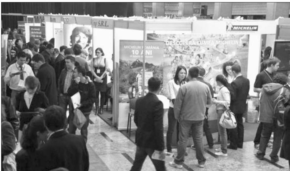
Az elkövetkező napokban, hetekben országszerte megnyílnak a munkaerőpiaci vásárok

A Manpower adatai szerint az elkövetkező negyedévben a hazai cégek 9 százaléka kívánja munkái körét bővíteni – ez az arány statisztikailag úgy jött létre, hogy az alkalmazásra készülő válaszadók számából, (ez esetben 20 százalékból) kivonták az alkalmazni nem akarókat (11 százalékat). Bármennyire is szerénynek tűnik ez az arány, a vén kontinens egyéb gazdaságaiban sokkal inkább pang a toborzási kedv: ez Görögországban, Spanyolországban, Írországban és Olaszországban például mínusz tartományban van – tehát inkább az elbocsátási hullámot