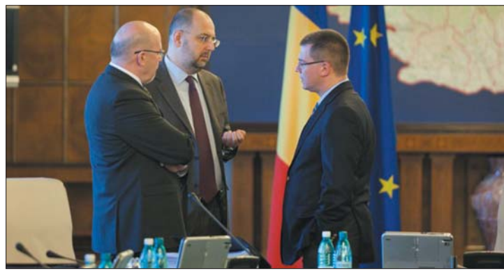
Markó Béla, Kelemen Hunor és Mihai-Răzvan Ungureanu kormányfő

amely egy új, magyar és angol tannyelvű kart hoz létre a Marosvásárhelyi Orvosi és Gyógyszerészeti Egyetemen. 3. oldal ▶