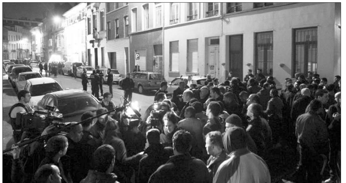
Gyülekeznek a környékeliek. Anderlechtben, a brüsszeli Gare du Midi pályaudvar közelében sok az iszlám bevándorló

► Lángba borította Brüsszel egyik mecsetét hétfő este egy férfi. A Joelle Milquet belga belügyminiszter szerint iszlámradikális, szunnita merénylő benzines palackot hajított a belga főváros Anderlecht nevű negyedében lévő muzulmán templomra. Az épületben jelentős károk keletkeztek, szinte teljes egészében a tűz martaléka lett, és füstmérgezésben meghalt a mecset 46 éves imámja, aki 4 gyermek apja. Könnyebben megsebesült egy másik ember, aki az imámmal együtt próbálta meg eloltani a felcsapó lángokat. A gyújtogatót a rendőrség a helyszínen elfogta, aki egyelőre csak annyit vallott be, hogy tette összefüggésben áll a Szíriában tapasztalható erőszakkal. Egy helyi síita vezető azt hangoztatta,