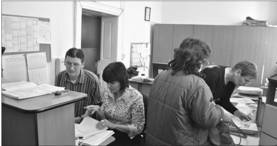
Beiratkozás a kolozsvári Báthory-liceumba. Többen a központba „költöztek” gyermekük jövőjéért

„Számomra felfoghatatlan, hogy miért kell ezt így csinálni. Mindenképp azt szeretném, ha az első osztályba induló gyerekek egy jó hírű iskolában kezdenék a tanévet, ezért ideiglenes tartózkodási engedélyt kérünk az iskola körzetébe. Felháborítónak és feleslegesnek tartom, hogy ezt mostantól így lehet megoldani” – fejezte ki felháborodását lapunknak egy kolozsvári apuka, aki maga is lépéseket tett annak érdekében, hogy jó iskolába járathassa gyerekeit. Egy sepsiszentgyörgyi szülő elmondása szerint nem az iskola vagy a pedagógusok, hanem az oktatási módszer miatt választotta ki az egyik iskolát. Azért volt kénytelen személyazonosságát cserélni, mert az elmúlt évekkel ellen-