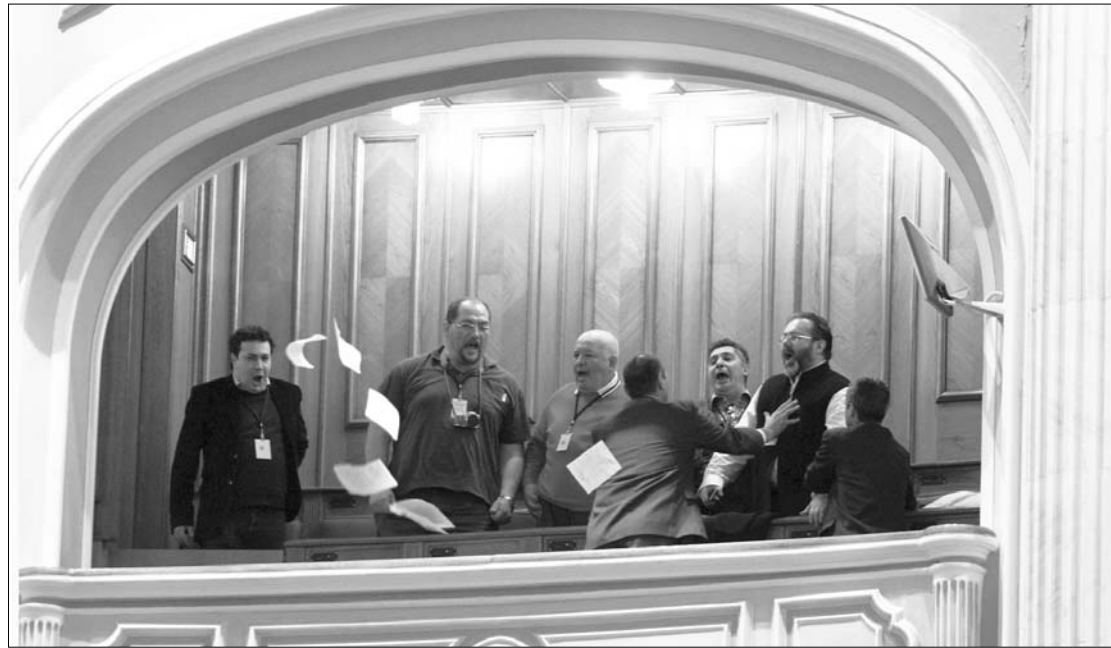
A plénum erkélyéről eltávolították a Traian Bănescu államfő lemondását kérő polgárokat