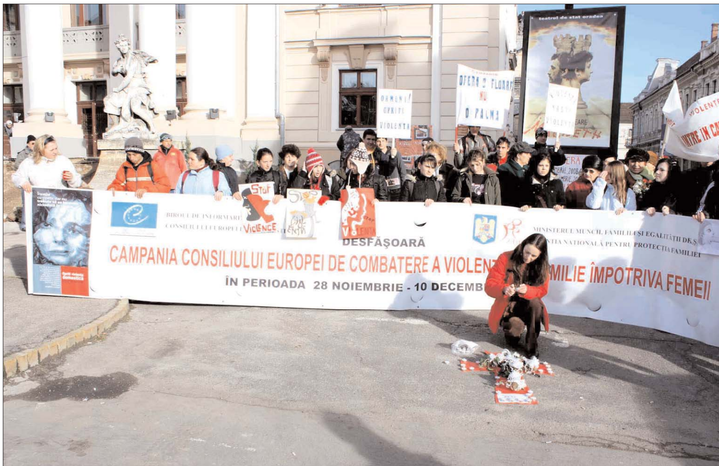
Március 8. tüntetésekkel. A nők egyenjogúságért fellépő szervezetek a nők nemzetközi napjára demonstrációt terveznek Bukarestben

A jogvédők szerint a hatóságok tehetetlenek a családon belüli erőszakkal szemben