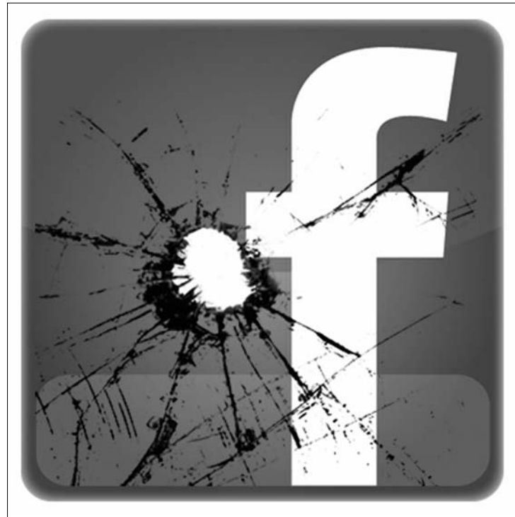
Órákig szünetelt a Facebook

A PC World informatikai magazin online kiadása elképzelhetőnek tartja, hogy a hibát a közösségi oldal két frissen üzembe állított szerverének (a glb1.facebook.com és a glb2.facebook.com) megbénulása okozta. Lehetséges verzióként felmerült az Anonymus közismert hacker csoport támadásának lehetősége is, hiszen korábban a csapat már többször jelentett be akciót a közösségi oldal ellen. Arra azonban, hogy a mostani leállás hátterében az Anonymus állna, semmi jel nem utal. A leállásban Románián kívül érintett volt Magyarország és több más európai ország is. ◀