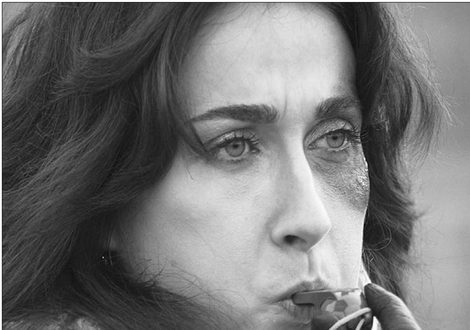
A jogvédő szervezetek szerint a hatóságok tehetetlenek a nők elleni erőszakkal szemben