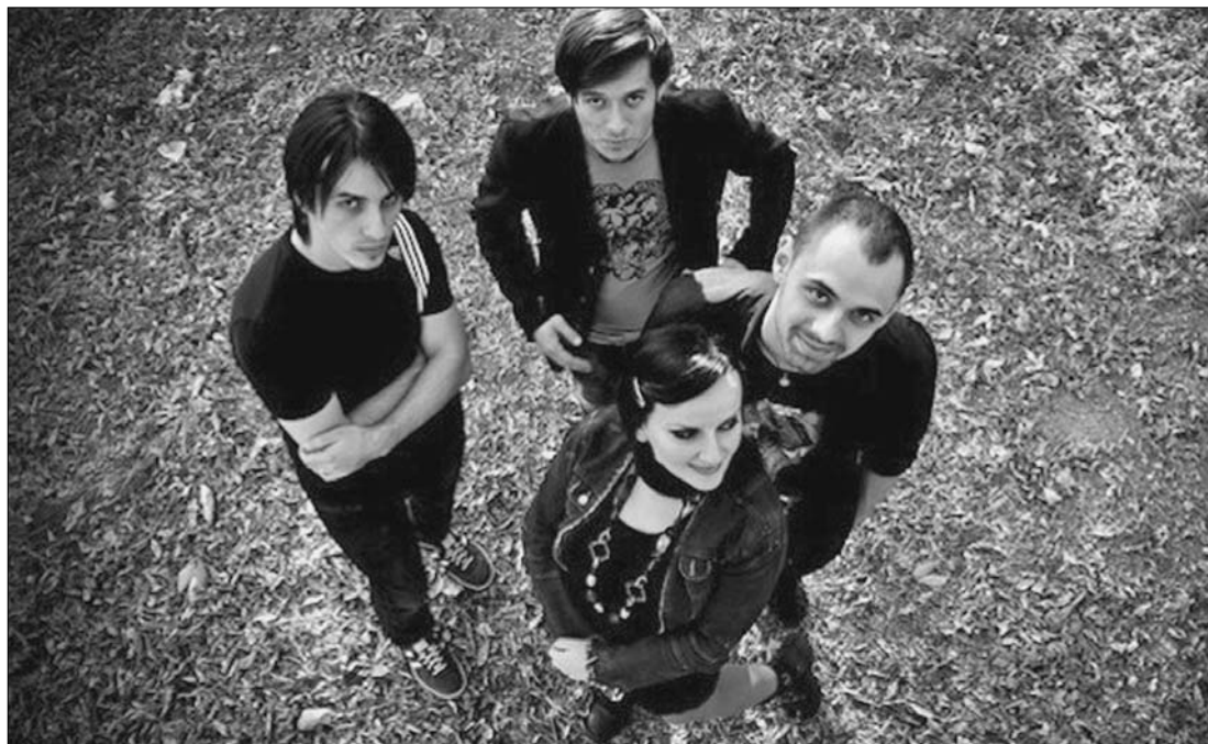
Az Electric Fence együttes roma nyelven előadott dala, a Șun-ta nem úszta meg a rasszista beütésű bírálatokat