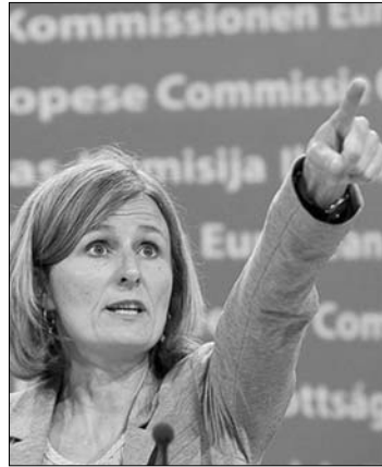
Pia Ahrenkilde Hansen

Az Európai Bizottság tegnapi ülésén döntött arról, hogy két témában – az adatvédelmi hatóság függetlenségéről és a bírói tevékenység felső korhatáráról – folytatja Magyarország ellen a gyorsított kötelezettségszegési eljárást, a központi bank függetlenségével kapcsolatban pedig további tájékoztatást kér a magyar kormánytól. A bizottság „szakszerű és konkrét eszmecserét folytatott a Magyarország ellen indított kötelezettségszegési eljárásokról” – szögezte le tegnapi brüsszeli sajtótájékoztatóján a testület szóvivője. Pia Ahrenkilde Hansen elmondta, hogy a bizottság a kezdetektől fogva „szigorúan jogi és objektív alapon” kívánja tartani a kötelezettségszegési eljárások ügyét. Hangoztatta, hogy az uni-