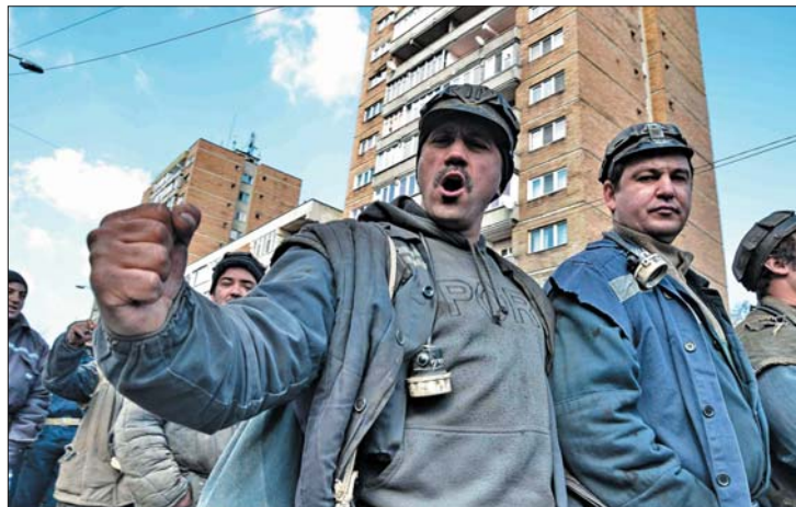
A tüntetők jelszavai a kormányt és az államfőt sem kímélték

januárban kapott ígéretet a gazdasági minisztériumtól. A vágárokat az államfő is védelmébe vette, kérve, hogy a kormány hagyjon fel a bányabezárási tervvel. 6. oldal ►