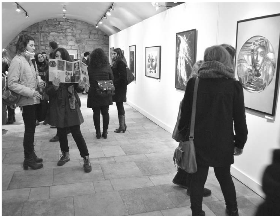
Több mint húsz olasz kortárs festő alkotásait ismerhetjük meg a Mátyás Házban

La Scuola Di Pittura , vagyis A festőiskola a címe annak a tegnap Kolozsváron megnyílt tárlatnak, amelyet a képzőművészeti egyetem szervezett közösen a milánói Brera Szépművészeti Akadémiával (Accademia di Belle Arti di Brera – Milano). A festmények március 14-éig tekinthetők meg a Mátyás-ház galériájában és a két művészeti intézmény közti együttműködési megállapodás révén érkeztek Kolozsvárra. A kiállítás átfogó képet nyújt az olasz kortárs festészetéről. Tegnap a milánói intézmény professzora, Renato Galbusera nyitotta meg a tárlatot, amely a kolozsvári képzőművészeti egyetem vezetésének reményei szerint „új szintet hoz a város művészeti életébe”. ◀