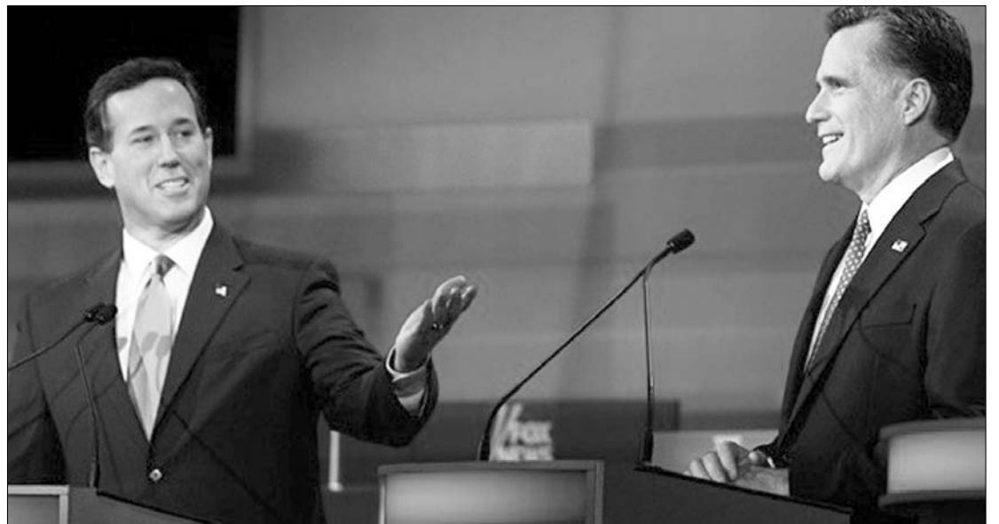
Santorum (balra) és Romney „iszapbirkózása”. Bár utóbbi fölényesen vezet, előbbinek sem szálltak el a reményei

A megrendítő győzelem elmaradása nyomán a republikánusoknak nagy valószínűséggel elhúzódo előválasztási küzde-