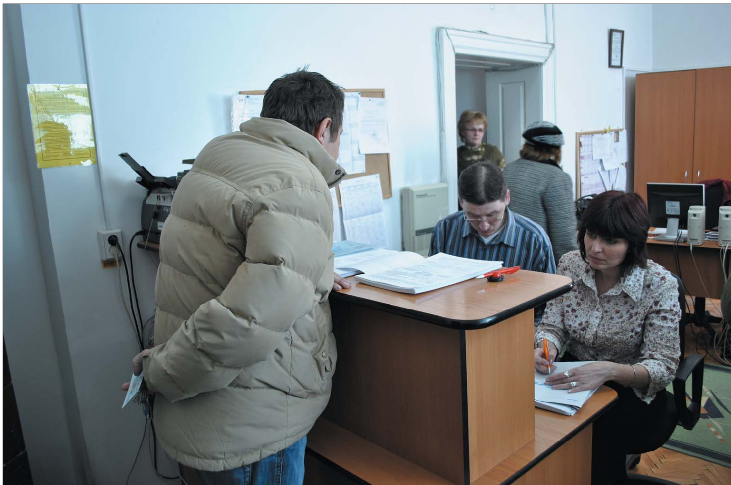
Gyermekeit beiratató szülő a kolozsvári Báthory István Elméleti Liceumban. A nagy múltú iskolákban túljelentkezés várható

Akadozva kezdődött meg tegnap a beiratkozás a nulladik és az első osztályokba