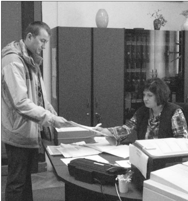
Gyermekeit beirató szülő a Bolyai Farkas Líceumban