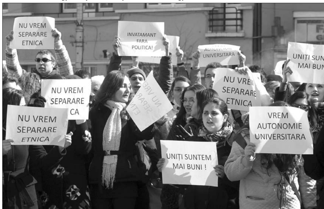
A román diákok a bukaresti tárgyalásokkal egy időben tiltakoztak a magyarok „elkülönülése” ellen