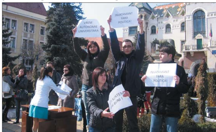
A MOGYE román diákjai az egyetem autonómiáját követelték

tak dűlőre jutni, és azzal az elhatározással álltak fel az asztaltól, hogy ma ismét egyeztetnek a kérdésben. A MOGYE román diákjai ismét utcára vonultak a „szeparatizmus” ellen. 3. oldal ▶