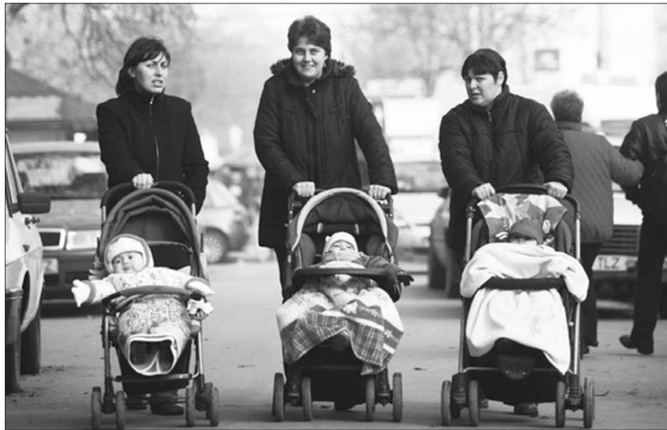
Az anyukák helyett ezentúl évente egy hónapig az apukáknak kell majd tolniuk a gyerekkocsit

Derzsi Ákos, a képviselőház egészségügyi és családvédelmi bizottságának tagja szerint az lett volna jó, ha a kormány nem kötelezővé, hanem opcionálissá teszi a dolgozó szülő számára az