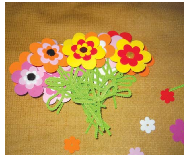
Hétfégi mellékletünk Életmód és Csodavár oldalait Orosz Anna szerkesztette