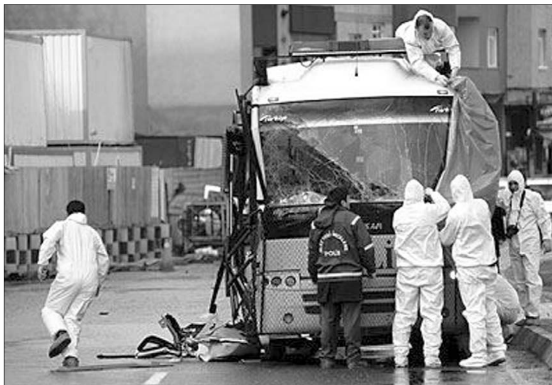
Kiégett rendőrségi busz. Egyelőre senki nem vállalta a felelősséget a tegnap hajnali merényletért

vettek el hasonló terrortámadásokat Törökországban. Ugyancsak robbantások rázkódtatták meg az iraki fővárost: Bagdadban tegnap két pokolgép összesen 60 személyt ölt meg. Az országban egyre jobban eluralkodik az etnikai-vallási konfliktus a szunniták és a siiták között, ami egyértelműen a politikások hatalmi csatározására vezethető vissza. ◀