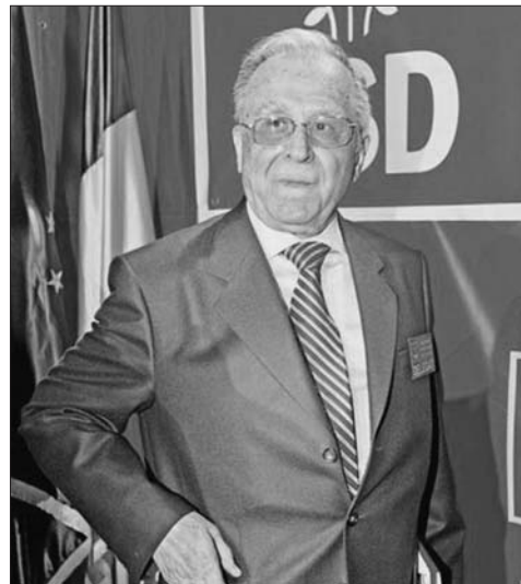
Ion Iliescu – megyei elsőből harminc-negyen év múlva letiltható