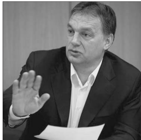
Orbán Viktor – de bizony diktálnak!

bik is támogatta. Ugyanakkor a kormánypártok, vagyis a Fidesz és a KDNP képviselői az „ügyben” nem szó-láltak meg, viszont az ügynök-lista nyilvánosságra hozat-lát egyhangú többséggel le-szavazták. Hivatalos magya-rázat azóta sincs a magukat jobboldali-konzervatív-pol-gári erőknök tartó pártok ré-széről.