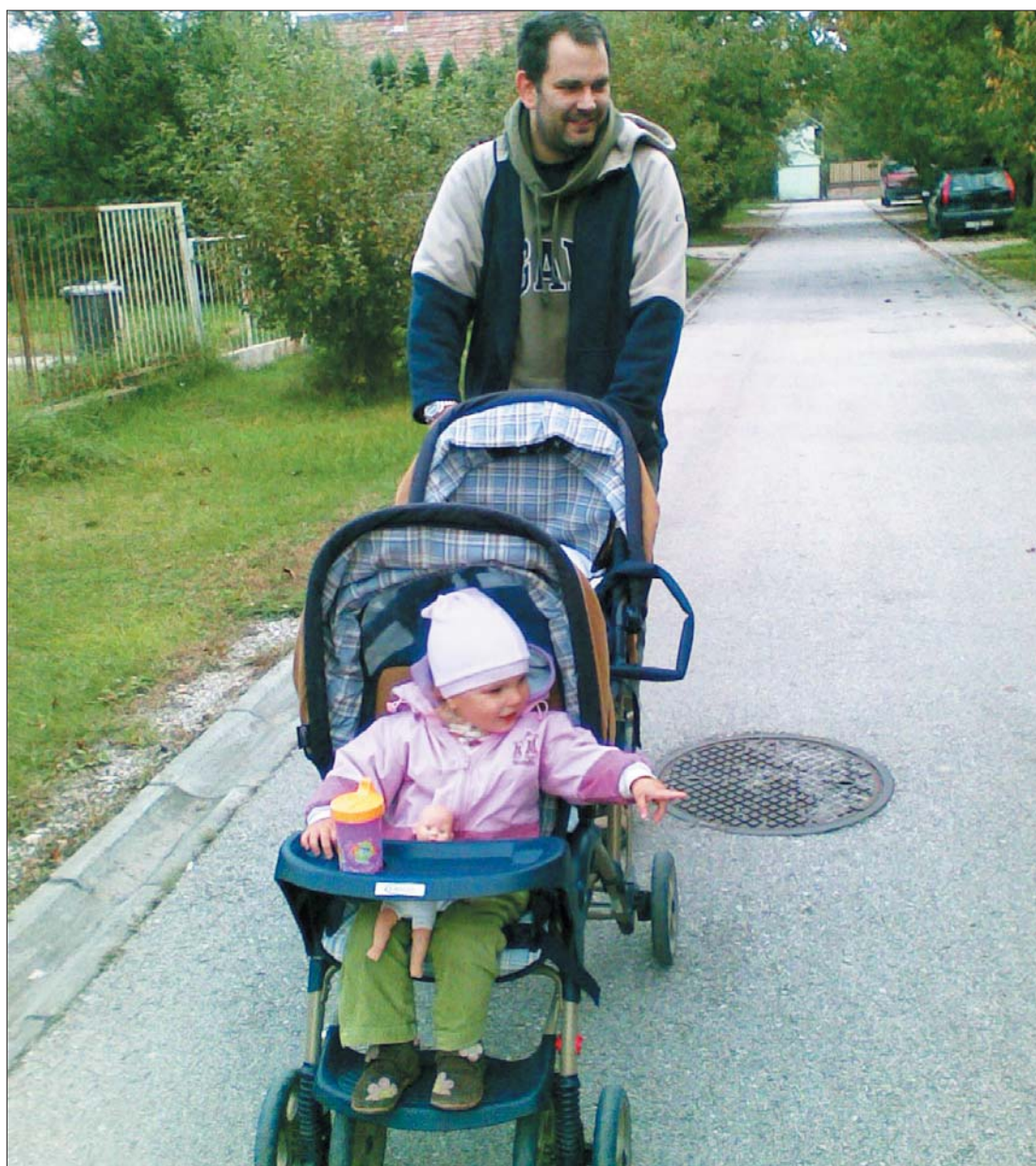
Kötelező apaság? Nyárára mehetnek a parkok kisgyermeküket sétáltató férfiakkal

A tegnapi dátum után született babák állásban maradó szülőjének 12 hónap alatt kötelezően egy hónapot a gyermek mellett kell otthon töltenie egy uniós irányelvet rögzítő kormányrendelet értelmében. Ha ezt a dolgozó szülő (rendszerint az apa) elmulasztja megtenni, az otthon maradt házastársa egyhavi gyesről esik el. Az uniós irányelv a nők munkaerő-piaci helyzetét hivatott erősíteni, ám Derzsi Ákos képviselő, a családvédelmi bizottság tagja szerint Romániában nem éri el a célját. A kötelező gyes ellen tiltakoznak az érintettek is. 7. oldal ▶