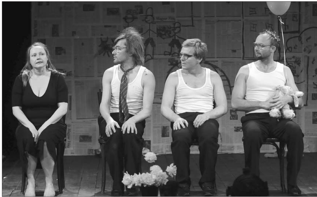
A debreceni Csokonai Színház orosz Fodrásznője a boldogságvágy groteszk ábrázolását nyújtja (jelenet az előadásból)

Shakespeare több változatban is szerepel sztárként az idei biennálén: a litván