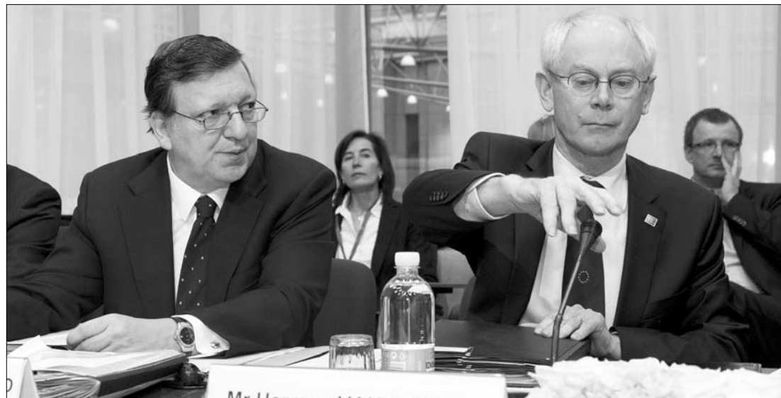
Barroso és van Rompuy. Nehéz meneten vannak túl: elhárult az akadály Szerbia tagjelöltsége előtt

Fordulópontra ért az Európai Unió a nemzetközi válság elleni fellépésben, eljött az ideje, hogy kiemelt figyelmet szenteljen a