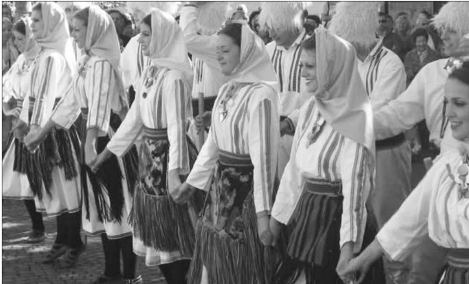
Timok-völgyi vlachok – hagyományos népi öltözkedésükben

A román szerint a szerb illetékesek igyekeznek mesterségesen különbséget tenni románok és vlachok között. A Szerbia által hivatalosan románoknak elismert, mintegy 31 ezres népcsoport az ország észak-keleti felében, a Bán-