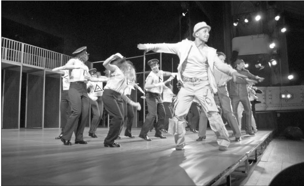
Az Óz, a nagy varázsló című musicalt Puskás Zoltán korábban már színre vitte Újvidéken is.