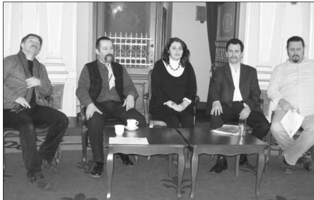
A műsorral a 820 éve szentté avatott László királyra emlékeznek