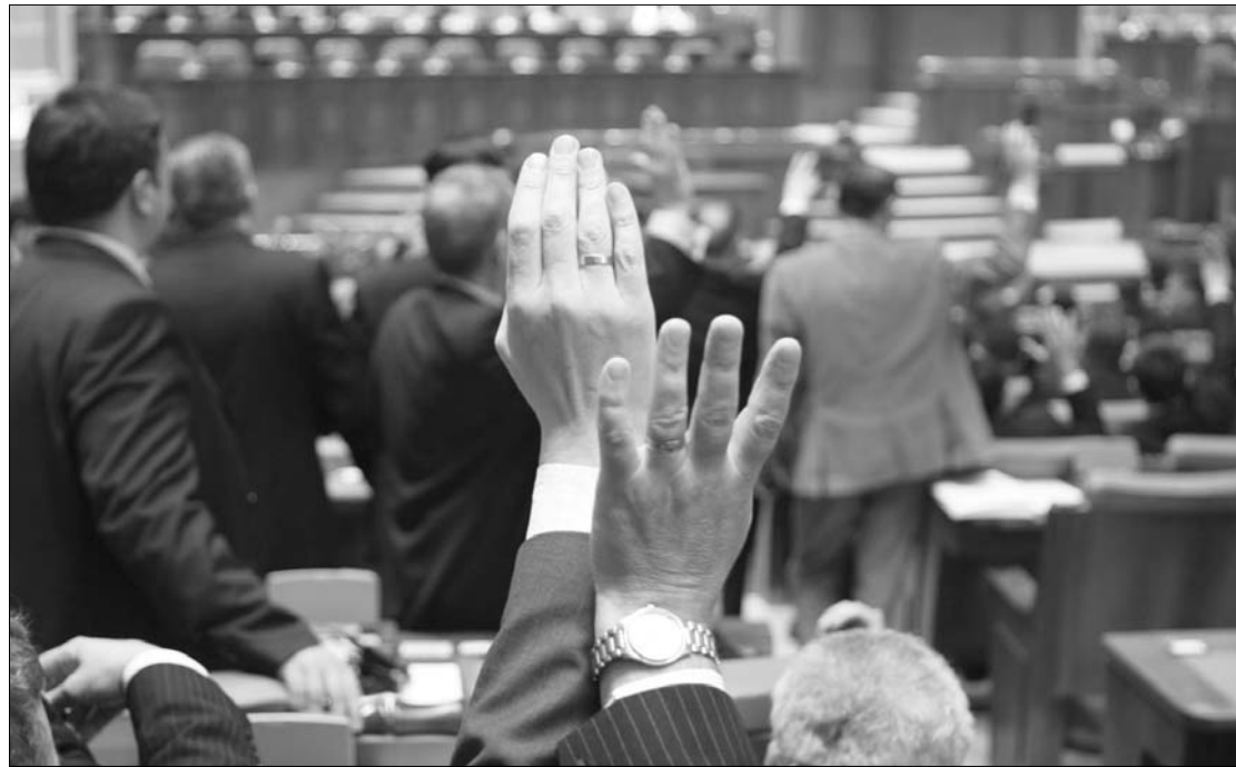
Az akkreditációról szóló tervezet mellett 161 képviselő szavazott, ellene heten, ketten pedig tartózkodtak.

A Sapientia EMTE 2001. október 3-án nyitotta meg kapuit a magyar kormány támogatásával, a felsőoktatási intézménynek Kolozsváron, Marosvásárhelyen és Csíkszeredában is vannak karai. A magyar kormány és az Országgyűlés 1999-ben döntött úgy, hogy támogatja az önálló erdélyi magyar egyetemi oktatást, és létrehozta a magyar tudományegyetemet. Az ehhez szükséges forrásokat a Magyar Köztársaság 2000. évi költségvetéséből különítették el. ◀