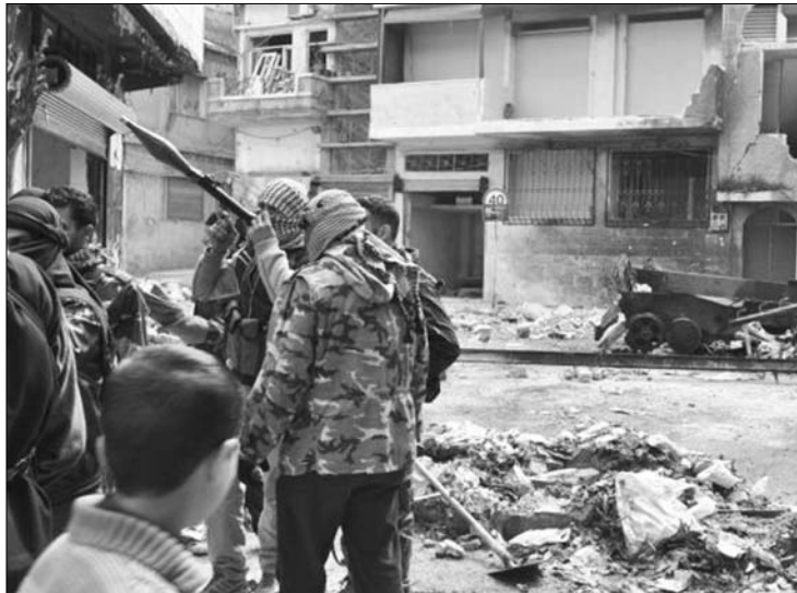
Vérfürdő Damaszkusz utcáin. Aszad szíriai elnök nem enged a felkelőknek

megfigyelők érkezését az országba, és a segélyszervezeteknek tegye lehetővé az akadálytalan bejutást Homszba, valamint a harctól sújtott többi városba. A szír nagykövet kivonult a tanácskozásról, de előtte még dühös hangvételű beszédben válaszolt, felpanaszolva, hogy külföldről fegyvereket juttatnak az ellenzéknek. Azt állította, hogy az egyes államok által Szíriával szemben hozott szankciók megakadályozzák a gyógyszerek és az üzemanyag beszerzését. ◀