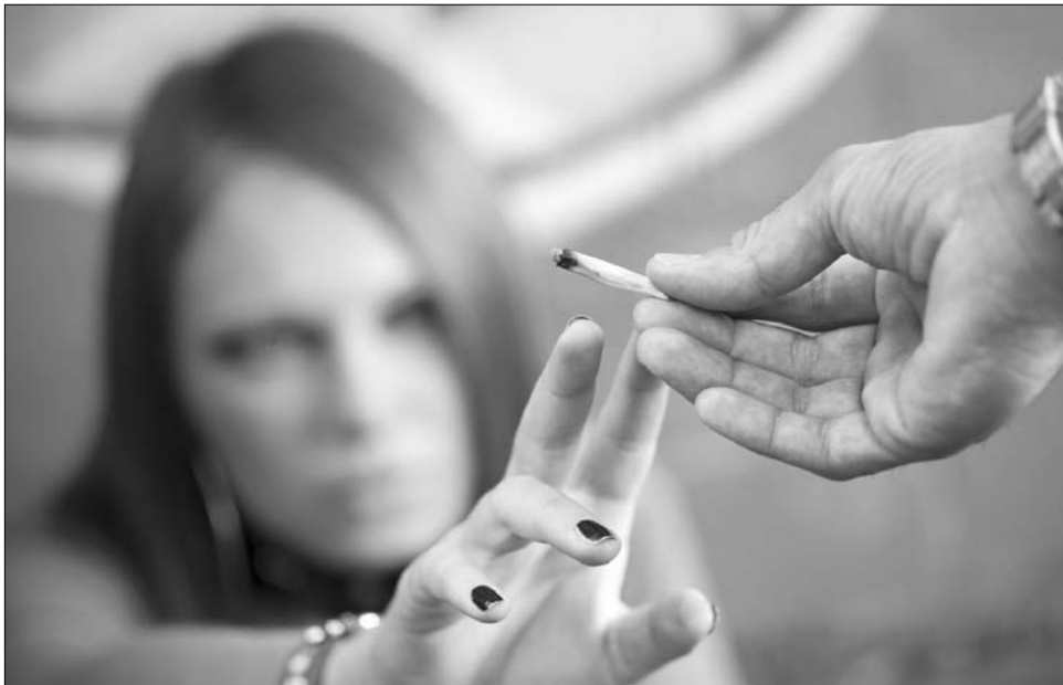
A felmérés szerint a legismertebb drog a diákok körében a marihuánás cigaretta

Az Udvarhelyi Fiatal Fórum megrendelésre tavaly ősszel készített, a 17 és 19