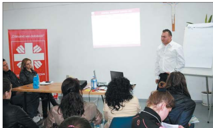
A Caritas szervezet megelőző programot hirdetett az iskolákban

felmérésből. A szakértők szerint a családban látott minta, az internet és a baráti társaság készíteti a fiatalokat drogfogyasztásra. 7. oldal ▶