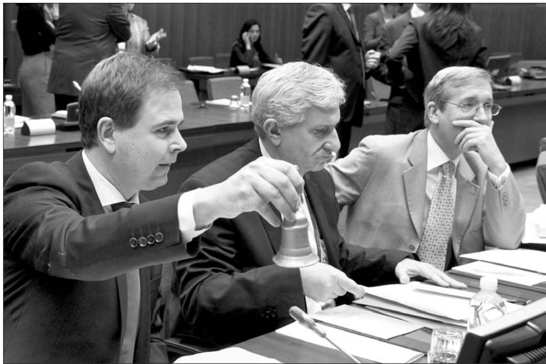
Csengettek? A dán Európa-ügyi miniszter jelzi az ülés kezdetét – ekkor még volt remény

A vlachok a Balkán-félsziget különböző országaiban – Albániában, Bulgáriában, Görögországban, Horvátországban, Macedóniában, Romániában és Szerbiában – élő népcsoportok, amelyek a latinból kialakult származó nyelveket beszélnek. Jelentősebb etnikai kisebbséget alkotnak Romániában (Dobruzsza tartományban). Saját magukat Görögországban, Romániában, Macedóniában és Albániában arománoknak nevezik, és csak a többi országban használják önmagukra a vlach nevet. A többi nép azonban mindenhol vlachoknak hívja őket. A dél-romániai románokat a 19. századig szintén vlachoknak hívták. Havasalföld román fejedelemség román neve Valachia, azaz Vlachföld volt. A vlach szó régi magyar változata egyébként a magyar nyelvben ma már csak gúnynévként használt „oláh” szó.