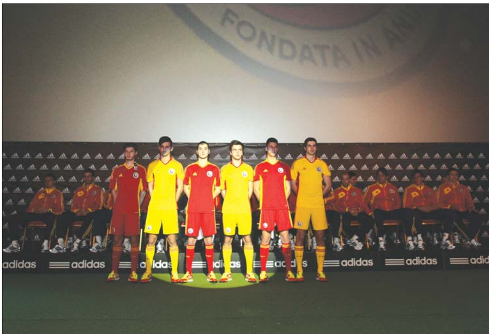
A román labdarúgó-válogatott sárgára cseréli vissza jelenlegi piros szerelését

két esztendőben, Răzvan Lucescu mandátuma idején. A FRF elnökhöz hasonlóan a báneasai mallban beöltöztetett játékosok is a szerencse forgandóságában bíznak és remélik: jobban megy majd sárgában. A román labdarúgó-válogatott második rend felszerelése piros marad. ◀