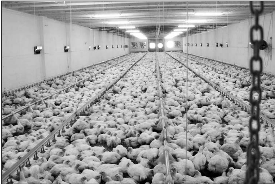
A „boldogabb” tyúkok tojásaiért egész Európában többet kell fizetniük a vásárlóknak

A „tojáskrizissel” Románia nincs egyedül, egész Európában megfigyelhető a jelenség, mivel ennek épp egy európai uniós törvény az oka, amely szigorúbb követelményeket támaszt a közösségen belüli baromfitartással szemben. Mint arról korábban beszámoltunk, az uniós szabály szerint 2012. január elsejétől tilos szűk ketrecben, mesterséges körülmények között és mesterséges táppal baromfit nevelni, illetve ezen tojók (korábban 3-as számmal jelzett) tojásait árusítani. A szigorodó törvénykezés két fronton is drágulásba torkollott: annak következtében, hogy a nem megfelelő