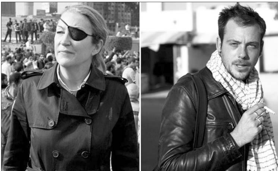
Marie Colvin, a brit Sunday Times újságírója és francia fotóriporter kollégája, Rémi Ochlik

Időközben azonban Franciaország is „biztosított bejutást” kért a katonai akciók áldozatainak szánt segélyek számára. „A Homszról érkező híreket követően, amelyek szerint nyugati újságírók tüzéségi akciók áldozatai lettek, a támadások azonnali le-