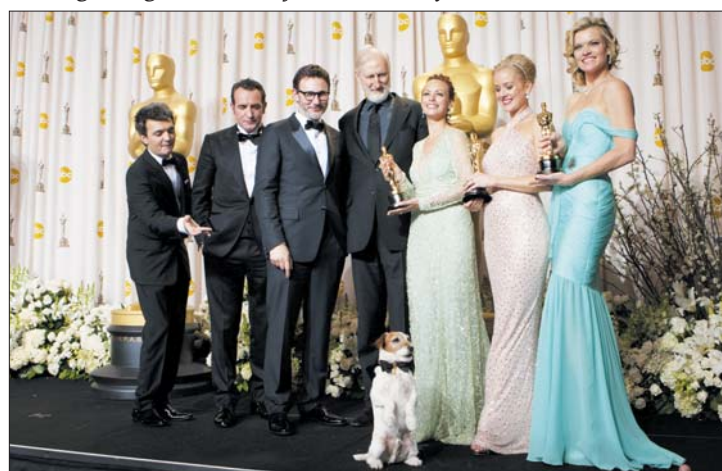
A francia csapat. A Némafilm tiz jelölésből ötöt váltott szoborra

francia produkció vitte el a legjobb filmnek, legjobb rendezőnek és legjobb férfi főszereplőnek járó aranyoszlopkáját. 9. oldal ▶