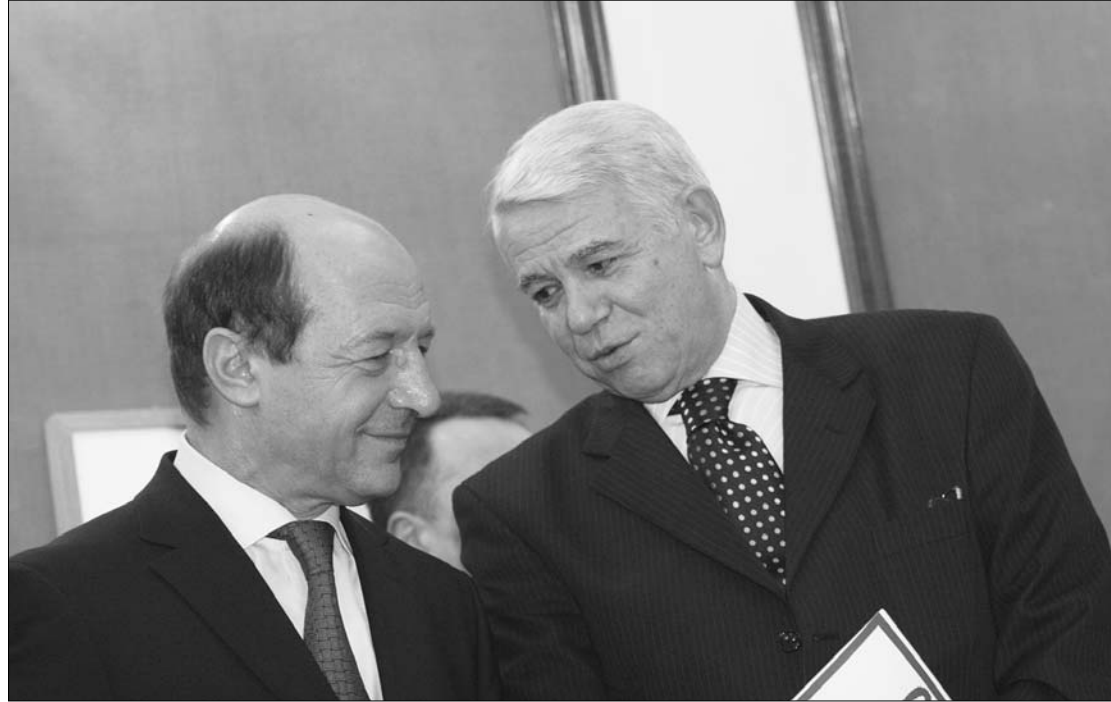
Bizalmasok? Traian Băsescu államfő Teodor Meleşcanut javasolja a Külügyi Hírszerző Szolgálat (SIE) élére Cs. P. T.

Teodor Meleşcanu karrierdiplomátát, a Nemzeti Liberális Párt (PNL) szenátorát javasolta tegnap Traian Băsescu államfő a Külügyi Hírszerző Szolgálat (SIE) élére. Meleşcanu bejelentette, hogy elfogadta a felkérést, és felfüggeszti párttagságát. A politikus korábban védelmi és külügyminiszter is volt.