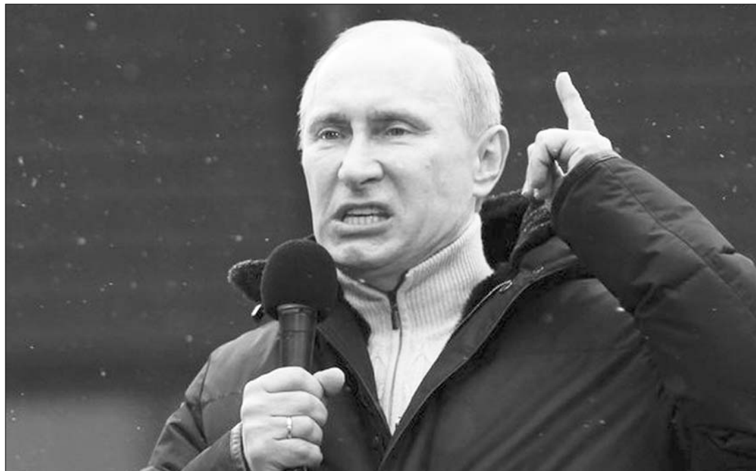
Putyin választási csele? Az ellenzék szerint az orosz kormányfő kampányfogásként vetette be a merénylet hírért

Az Interfax hírügynökség emlékeztet rá, hogy a négy évvel ezelőtti elnökválasztás előtt is hasonló merénylet megküldéséről röppentek fel hírek, de azok valódiságát akkor hivatalosan nem erősítették meg. ◀