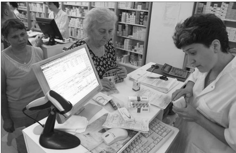
A morfiumhoz speciális recepttel lehet hozzájutni, egyszerre legtöbb csak háromnapi adaghoz