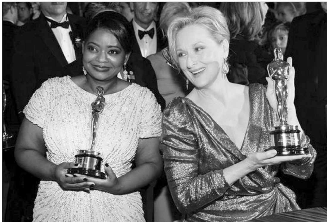
Octavia Spencer és Meryl Streep kapták az idei Oscar-gála legjobb színésznőinek járó szobrocskát