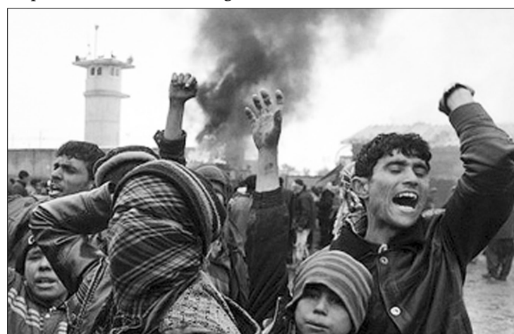
Afganisztánban már harmadik napja tartanak az Amerika-ellenes tüntetések

tartományban két tüntető veszítette életét a rendőrséggel kialakult tüzpárbajban, amelyben hat másik személy megsebesült. Hogy lecsendesítsék a kedélyeket Hamid Karzai afgán államfő levelet kapott Barack Obamától, amelyben az amerikai elnök bocsánatot kért, amiért koránt égettek a bagrami amerikai bázison. A levelet az Egyesült Államok kabuli nagykövete tegnap juttatta el a kabuli elnöki hivatalnak. Obama a levélben „mély sajnálatát fejezte ki az incidens miatt.” ◀