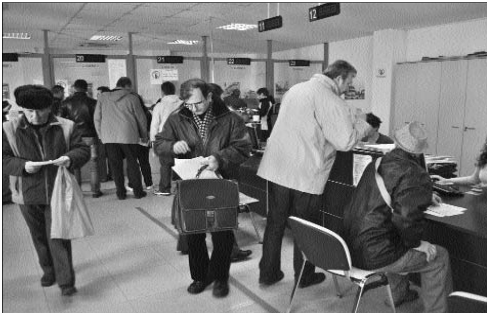
Kolozsváriak a városháza adóosztályán. Március végéig élhetnek a kedvezménnyel