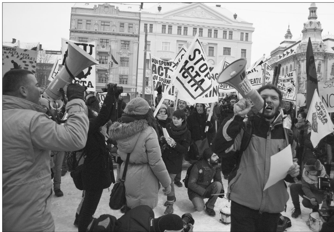
Tüntető Kolozsváron. A hamisítás elleni megállapodás ellen több romániai városban is tiltakoztak.

A megállapodás célja az internetes kalóz-letöltések megfékezése, ellenzői az internet szabadságát féltik. A belga biztos szerint fő célja, hogy nemzetközi normákat hozzon létre a szellemi tulajdonjogok megerősítésére, ami egyébként az uniós jogrendszerben már megtörtént. Az internetes kalózkodás és csalás 200 milliárd eurós veszteséget okoz világszerte, és