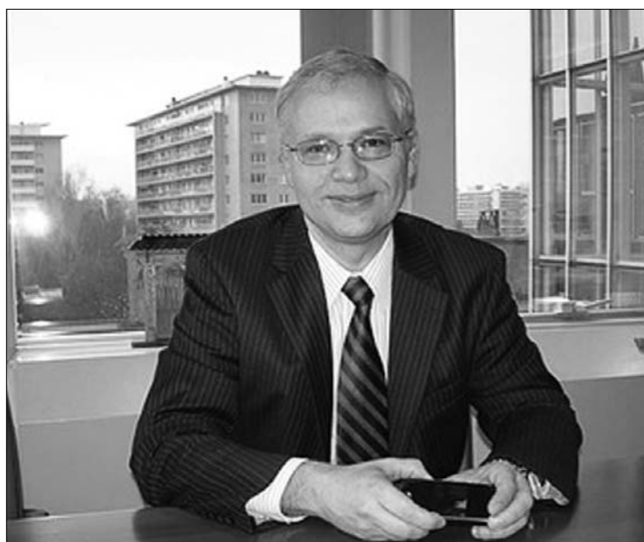
Székely P. István bukaresti látogatásakor adott interjút lapunknak.

▶ Elviekben sem a Nemzetközi Valutaalap, sem az Európai Bizottság nem kifogásolja, hogy növekedjen a közalkalmazottak bére, vagy a nyugdíjakat legalább az inflációhoz igazítsák – szögezte le lapunknak az Európai Bizottság gazdasági és pénzügyekért felelős főigazgatójának kutatási igazgatója, Székely P. István három hét leforgása alatt másodszor járt a Nemzetközi Valutaalap romániai küldöttségének vezetőjével, Jeffrey Franksszel együtt Bukarestben a Romániával kötött hitelmegállapodás programjáról tárgyalni, és kétnapos látogatása végeztével adott interjút az Új Magyar Szónak . Kérdésünkre elmondta, Románia hitelezőit csupán az érdekli, hogyan befolyásolja az esetleges bér- és nyugdíjemelés a romániai hitelprogra-