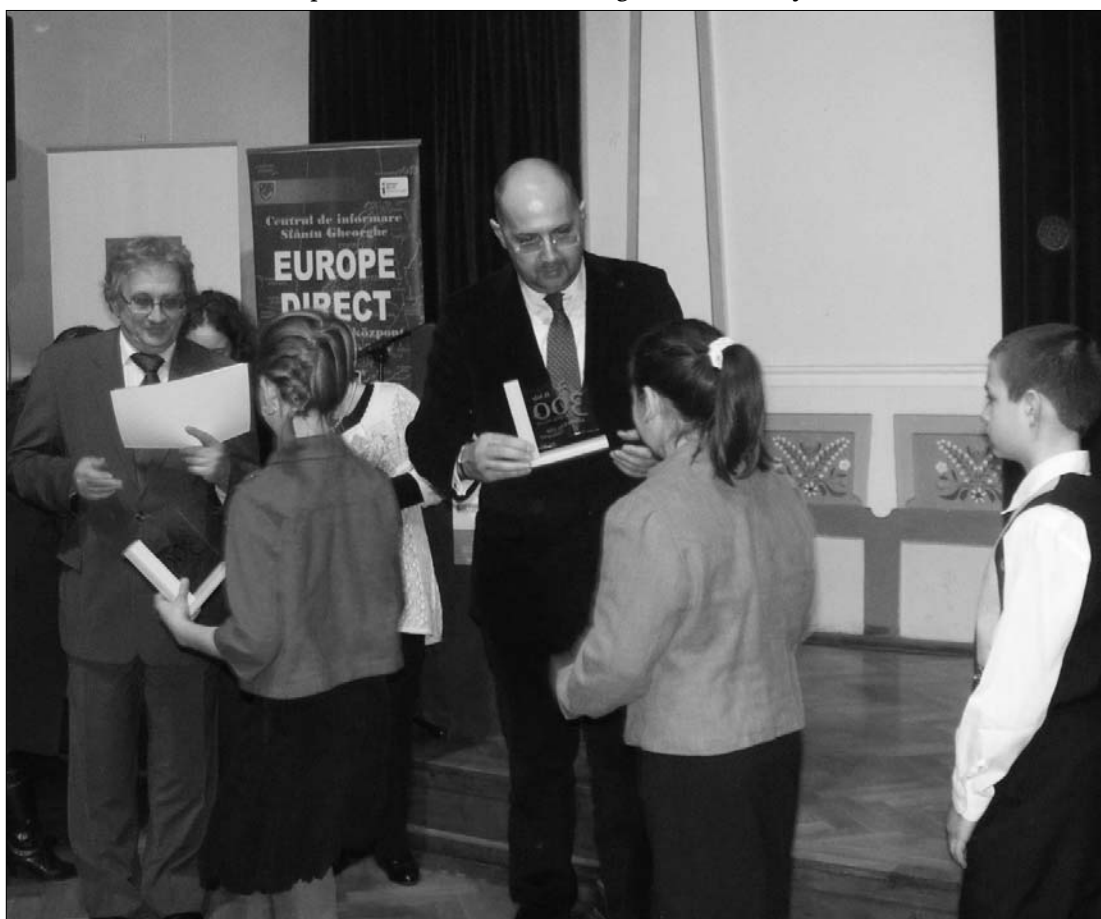
Füzes Oszkár nagykövet és Kelemen Hunor művelődési miniszter díjazta a nyertes diákokat

Lőrincz Zsigmond polgármester jelenlétében nyitották meg a kétmillió lejből felújított városi mozi épületét, amely Kulturális Központként működik ezentúl, hiszen a filmvetítések mellett alkalmas lesz színházi előadások és konferenciák megtartására is. Folytatása a 6 oldalon ▶