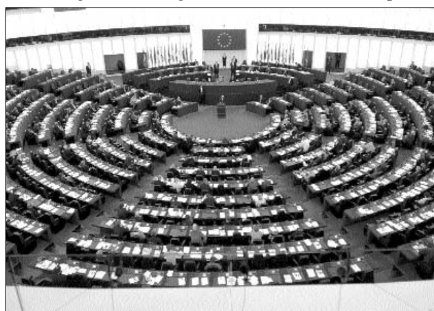
A strasbourgi plenüm – nagy többséggel

F. mivel az új alkotmányok és átmeneti rendelkezéseinek megfelelően a Legfel-