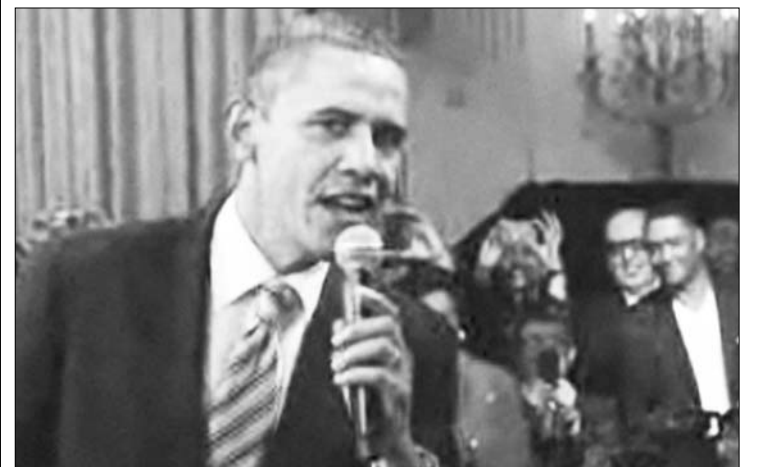
Az amerikai elnök a Sweet Home Chicago dalt énekelte