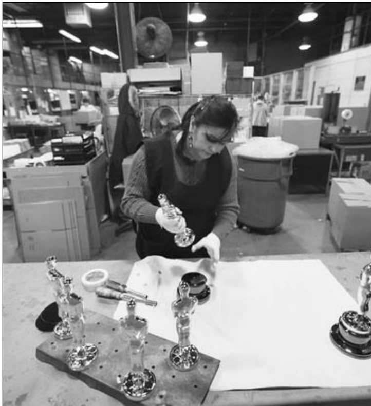
Készülnek az aranyozott szobrocskák a vasárnap esti díjátadásra

Az idei év legnagyobb esélyese a kritikusok szerint minden kétséget kizáróan A némafilm ( The Artist ) című alkotás, amely összesen 10 jelölést tudhat magának, köztük a legfontosabbakat: legjobb film, legjobb rendező, legjobb színész, legjobb eredeti forgatókönyv, legjobb fényképezés.