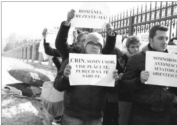
Ébresztő! Fiatalok „költögettek” tegnap a parlamentnél Crin Antonescut

Az IPP kimutatása Elena Udrea is meghihette, ugyanis a volt régiófejlesztési miniszter blogbejegyzésben szóvá tette, bár tárcavezetőként nem kapta meg a képviselőknek járó fizetést, mégis több végszavazáson vett részt, mint az ellenzéki Szociál-Liberális Szövetség (USL) két társelnöke. Victor Pontát és Crin Antonescut „az ország első két lógósának” nevezte. ◀