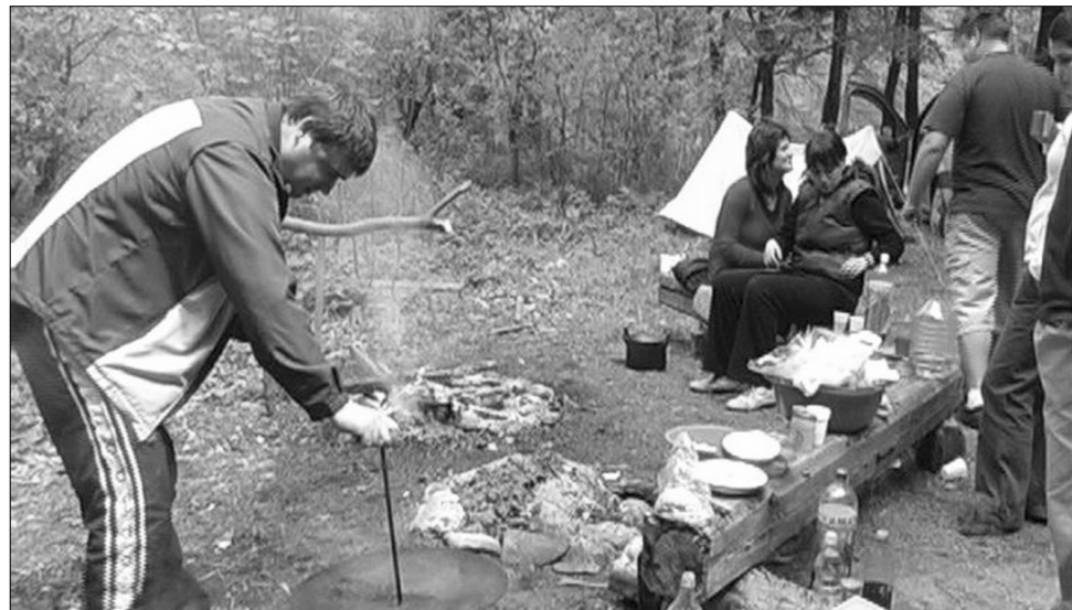
Csupán az célra kijelölt zöldövezetekben lehet majd ezentúl piknikezni.