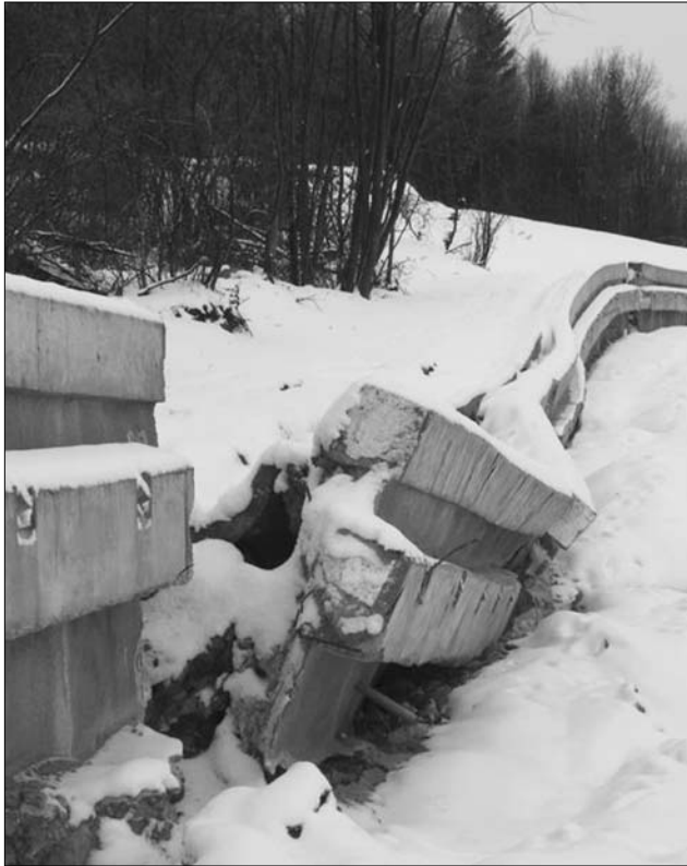
Minőségből elégtelen. A tavaly szeptemberben átadott kolozsvári körgyűrű védőfalainak egyes szakaszai már beszakadtak

A magyar társaság, amely jelenleg csődvédelem alatt áll, az elmúlt években több „zsíros” infrastruktúra-beruházásra szerződött Románi-