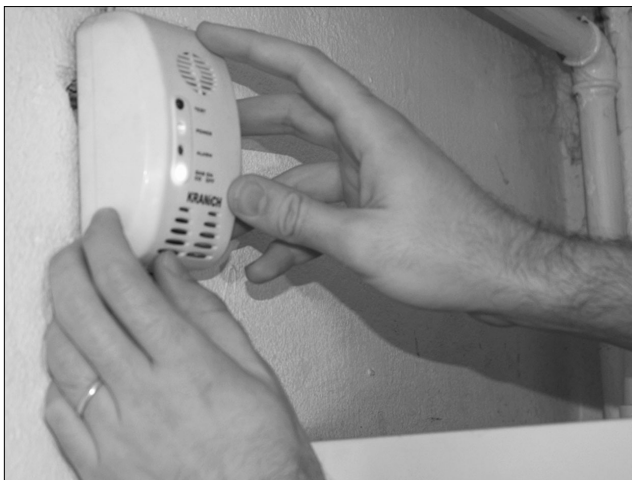
A gázdetektort egy óra alatt felszereli egy szakember.

A jelzőberendezés beszerelése többletbiztonságot jelent a fogyasztóknak – nyilatkozta lapunknak Adela Boțan, az E.ON Gaz sajtószóvivője, aki elmondta, a vonatkozó törvény szerint ott szükséges ennek a műszernek a használata, ahol hőszigetelő termopán ablak van. A gázjelző ára minőségtől függően, 90 és 200 lej között mozog, a műszer beszerelése – melyet csak engedéllyel rendelkező szakember végezhet – kevesebb mint egy órát vesz igénybe, és hozzávetőleg 100 lejbe kerül. A költségek a fogyasztót terhelik. A gázérzékelőnek rendelkeznie kell az EU-s szabványt igazoló irattal, használati utasítással, és a műszaki jellemzők leírásával. Az E.ON Gaz feladata ebben a procedúrában a műszaki terv ellenőrzése és