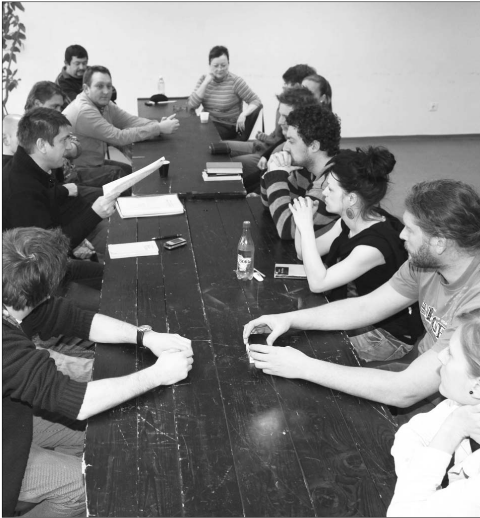
A darab bemutatóját áprilisban tartják a Marosvásárhelyi Nemzeti Színház Nagytermében.

▶ Gotthold Ephraim Lessing Bölcs Náthán című drámai költeményének premierjére készül a Marosvásárhelyi Nemzeti Színház Tompa Miklós Társulata. Az eredetileg ötfelvonásos drámai költemény 1779-ben jelent meg, és először 1783-ban mutatták be Berlinben. Gotthold Ephraim Lessing eme utolsó művében a vallási toleranciával foglalkozik, a felvilágosodással, az emberiséggel, a másság elfogadásával. A cselekmény háttérben az a vita áll, amelyet Lessing a hamburgi vezető lelkésszel, Johann Melchior Goezéval folytatott, és amely odáig fajult, hogy a szerzőt részleges publikációs tilalom fenyegette. A vita következtében Lessing a deizmussal kapcsolatos nézetét ebben a darabban fejezte ki, vagyis azt, hogy elismeri ugyan Isten létezését, de a szükségességét nem, nézete szerint ugyanis a teremtést követően az Isten magára hagyta a világot, amivel a háborúkat és egyéb katasztrófákat is magyaráz. A darab cselekménye a keresztes háborúk idején játszódik, és a kereszténység, zsidóság, iszlám egyenjogúságát hangsúlyozza. Főhőse az okos Náthán, akit Lessing barátjáról és filozófustársáról Mendelssohn Mózesről mintázott. A darab bemutatójára a tervek szerint áprilisban kerül sor, a Marosvásárhelyi Nemzeti Színház Nagytermében. ◀