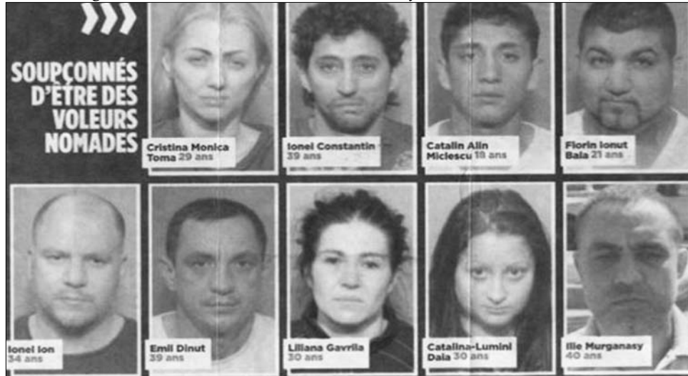
Letartóztatott román bűnözők „arcképcsarnoka” egy kanadai lapban

A holland bűnüldözők nagyrészt tehetetlenek velük szemben, a bankbetéteket lenyúlók módszerén ugyanis rendkívül leleményesek, a bűncselekmények elkövetői pedig rendszerint hamarosan