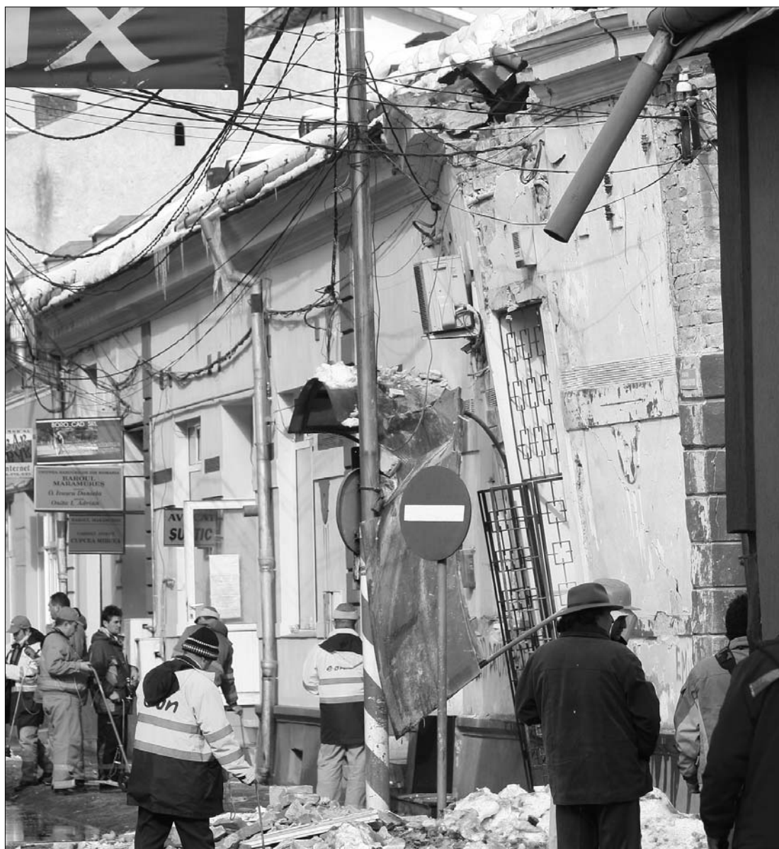
Lebontásra ítélték a megrongált máramarosszigeti épületet, amelyben tegnap még szivárgott a gáz

Kiseb pánikot keltett, főként az erdélyi megyék gázalapú fűtést vagy tűzhelyet használó lakosaiban a máramarosszigeti tragédia híre: két nap alatt elkapkodták a szivárgásjelző berendezéseket a szaküzletekből. A lapunknak nyilatkozó szakemberek elmondták: ott szükséges a műszer használata, ahol hőszigetelő termopán ablak van, a hagyományos nyílászárókkal rendelkező lakásban jobb a szellőzés. Tudósítónk elkísérte az E.ON munkatársát egy ellenőrzésre is. A vizsgált lépcsőházban a lakók mintegy fele rendelkezett gázérzékelővel. 7. oldal ▶