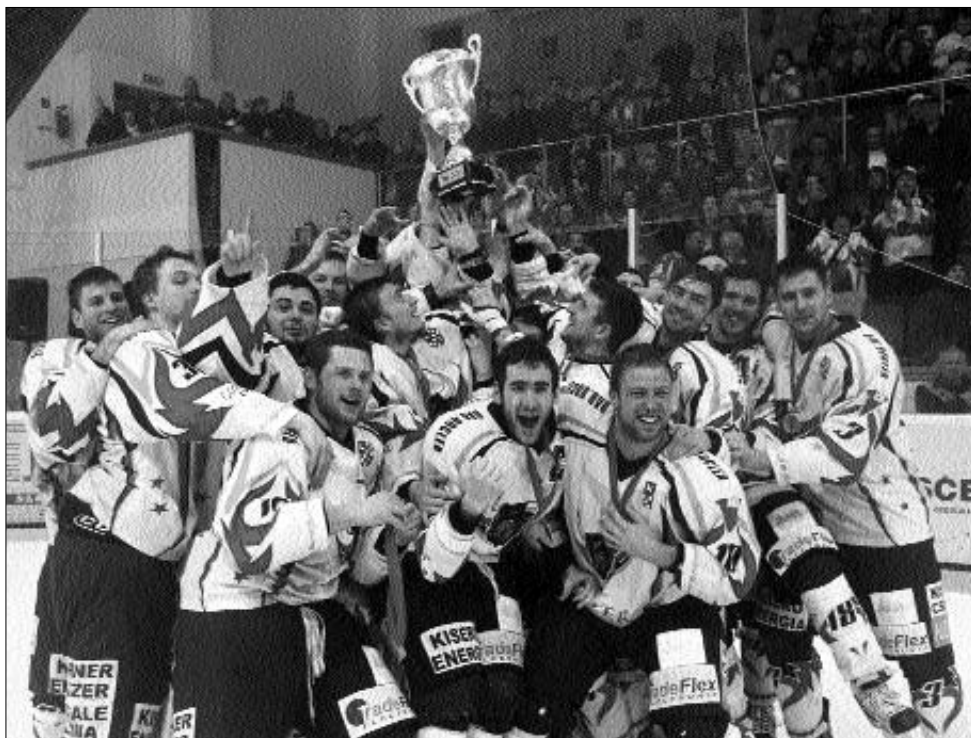
Az Acélbikák a lehető legkevesebb próbálkozásból győzték le a Jegesmedvéket a MOL Liga döntőjében