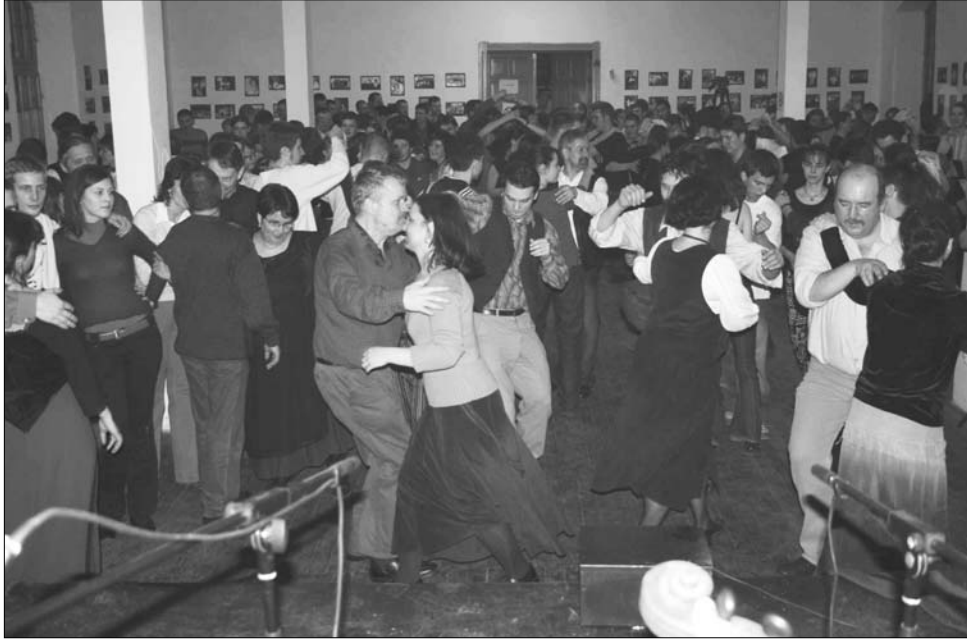
Régi táncházasok a mozgalom harmincadik születésnapján. A szervezők most is nagy ünnepre készülnek