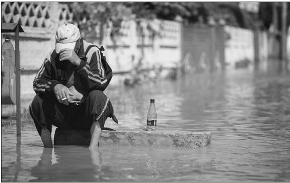
Valahol Romániában: árvíz és keserűség. Bármikor, bármely ország részben megismétlődhet

A településeket jelenleg országos szinten közel 10 ezer kilométer kitevő gátrendszer védi, 6300 kilométer folyószakaszon végeztek meder-szabályozási munkákat, összesen közel 900 millió köbméter kapacitással 217 idényjellegű vízgyűjtő tavat létesítettek valamennyi vízgyűjtő medencében, az állandó víztározók száma meghaladja az 1200-at, összkapacitásuk több mint 2000 köbméter. ◀