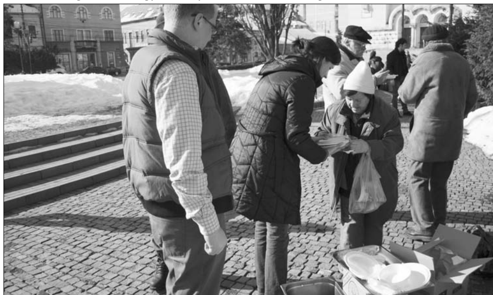
Meleg ételt osztanak a rászorulóknak Kolozsvár központjában a református teológusok

A közvitára bocsátott dokumentumról a későbbiekben határozatot fogad el a kormány. A parlament a kormányhatározat kibocsátása után módosítja a közlekedésrendészeti szabályozáson. ◀