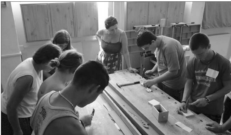
Asztalosinasok. A szakmunkásképzésben nagy hangsúlyt fektetnek a gyakorlati képzésre