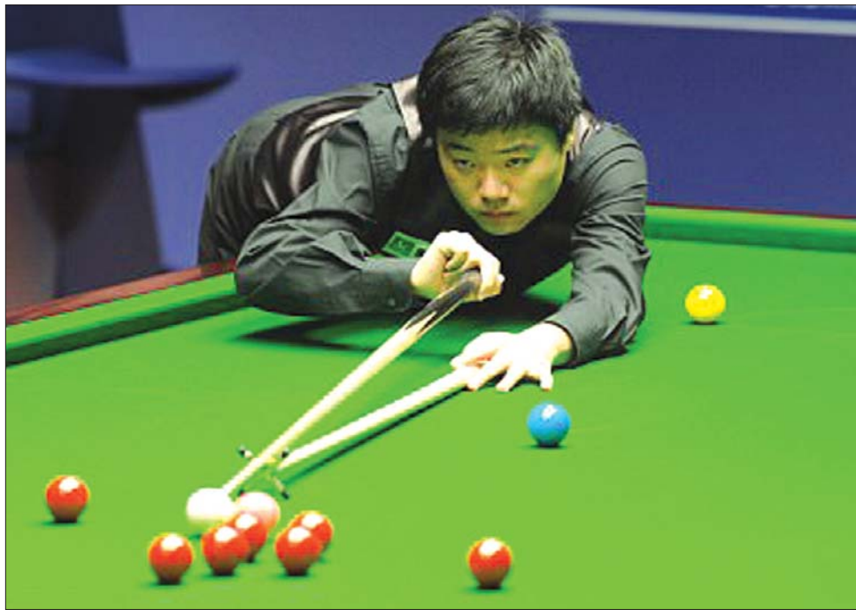
A kínai Ting Csün-huj legjobb napjaira emlékeztető formában kezdett a Newport-i viadalon

Ma zárul az első forduló és már a legjobb nyolc közé jutásért játszanak. Csütörtökön fejeződik be a nyolcaddöntő, pénteken délutántól pedig már a legjobb négy közé jutásért játszanak. Az Eurosport követi figyelemmel a newporti eseményeket, az élő közvetítések naponta 16.15, illetve 21 órakor kezdődnek. ◀