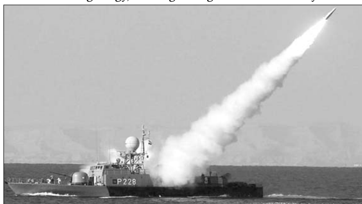
Iráni rakétateszt január 1-jén. Veszélyessé vált a Hormuzi-szoros

Az amerikai egységek soraiban jelenleg rendkívül nagy az idegesség, már csak azért is, mert a feszült helyzet nagymértékben emlékeztet 2000-re: akkoriban a USS Cole amerikai romboló legénységének tizenhét tagját gyilkolták meg az al-Kaida merénylői. ◀