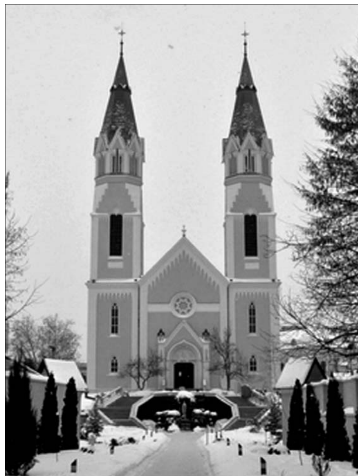
Ez a hely évszázadok óta kulcsfontosságú a szatmáriak életében.

Felszentelése óta többször javították, köztük a háborús rongálásokat is, de repedező, súlygyedő falait, értékes faragásait és freskóit csak egy uniós pályázat menthette meg a jövőnek. A teljes (külső és belső) felújítás 6,5 millió lejbe került, ebből csaknem 5,5 millió a vissza nem térítendő támogatás. A jól előkészített pályázat nyomán futotta belőle az alap és a tornyok meg-