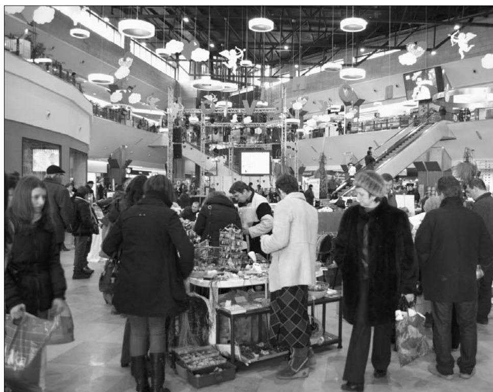
Kolozsváron tegnap több bevásárlóközpontban is Bálint-napi vásárokat szerveztek