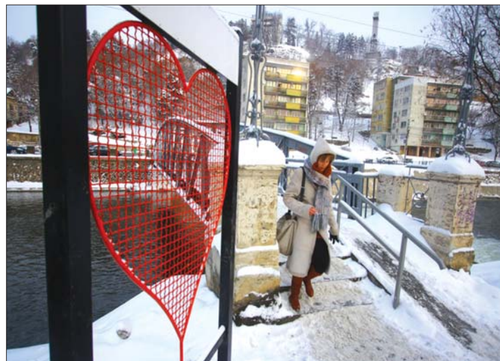
Szerlemlakat-állvány a kolozsvári Erzsébet hídnál

bet híd két végénél elhelyezett, szív alakú állványokkal népszerűsítette a szerelemlakatok felakasztásának hagyományát. 7. oldal ▶