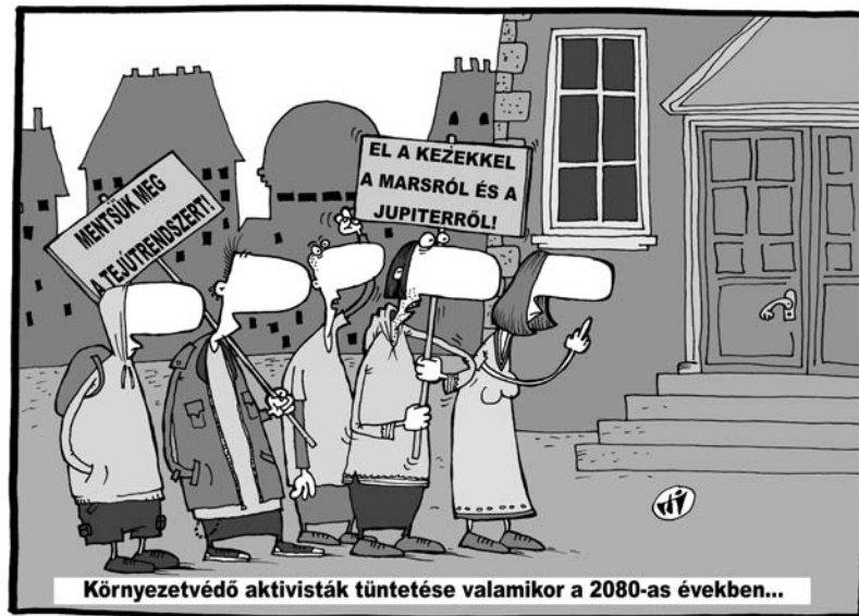
Környezetvédő aktivisták tüntetése valamikor a 2080-as években...