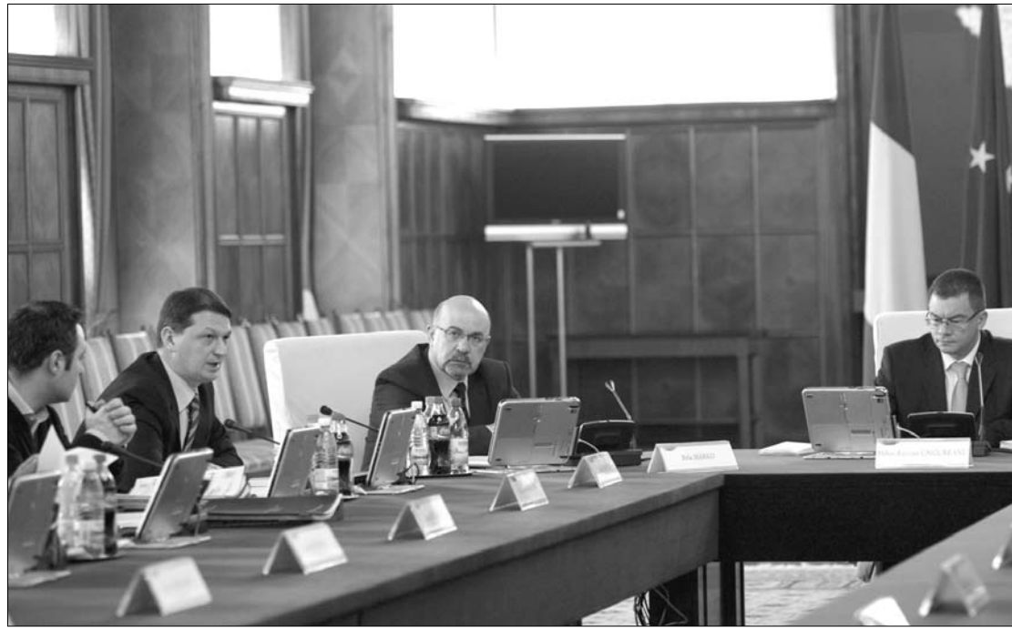
Az Ungureanu-kabinet tegnapi ülésén felhatalmazta a Transelectricát a villamosenergia-export felfüggesztésére.

A tárca röviddel azután tette ezt a bejelentést, hogy Traian Băsescu államfő egy délutáni sajtónyil-