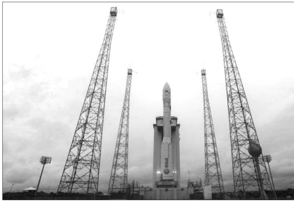
A Vega hordozórakéta Kouroun. Kilenc műholdat – köztük egy-egy magyart és románt – állított pályára

Ezért szívet melengető a hétfői hír, amely arról tudósít: pályára állt hétfőn az első magyar műhold, a MaSat-1, amelyet nyolc másik – köztük egy román – szatellittel együtt az Európai Űrügynökség (ESA)