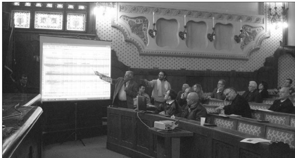
A Maros megyei tanácsban kétszer is megdöntötték a repülőtér büdzséjének elfogadását.

A vidrászegi repülőtér költségvetése már nem első alkalommal kerül a figyelem középpontjába, igaz, legutóbb épp ellenkező okból, a „túl bő” büdzsé miatt. Január folyamán Kolozs Megye Tanácsa és a kolozsvári repülőtér szakszervezete jelezte, hogy bíróságon pereli be Maros Megye Tanácsát amiatt, hogy indokolatlanul sok támogatásban részesítette a légitársaságot, így az a fejlesztések révén előnyösebb piaci helyzetbe került Kolozs megyei vetélytársával szemben. ◀