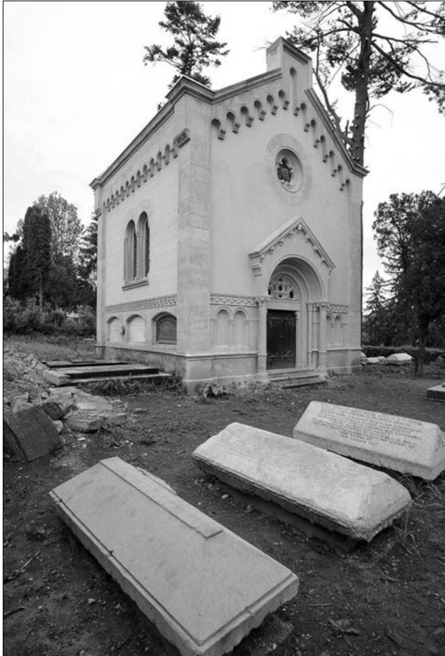
A Bánffy-kripta és többszáz éves sírok az „erdélyi Pantheonban”

Mint ismeretes, a kolozsvári Házsongárdi temető B kategóriás műemlékként szerepel az Országos Műemlékvédelmi Listán, ám az általános keret nem jelentett egyéni, kiemelt védettséget egy-egy síremlék számára. Az elmúlt évben tapasztalt sirrongások miatt Kelemen Hunor kulturális és örökségvédelmi miniszter felkérésére