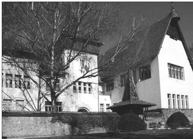
A Székely Nemzeti Múzeum mellé épülne fel az új intézmény