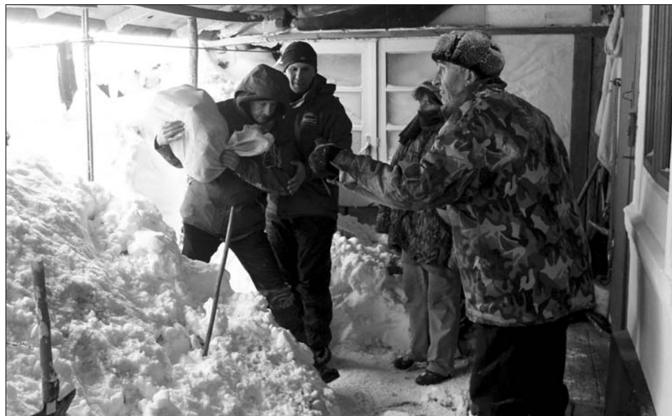
A Buzău megyei elszigetelt településekre a hadsereg juttatott el élelmiszer-csomagokat