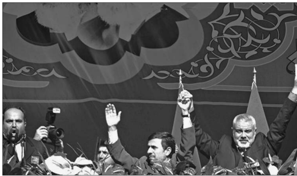
Az iráni forradalom 33. évfordulóján. Ahmadinezsád (középen) Haníje kezét rázza: biztos a győzelemben

Nyugat és a gyarmatosítók teremtettek”, hogy ezzel indokolják a zsidó állam létrehozását – mondta, hozzátéve: Teherán ezzel „előkészítette a nyugati népek felszabadítását”. Ahmadinezsád – heves nemzetközi bírálatokat kiváltva – már a múltban is többször tagadta, „mitosznak” minősítette a holokausztot. Irán nem ismeri el Izraelt, amelyet a „Közel-Kelet daganatos sejtjének” mond, s rendszeresen a zsidó állam elpusztítására szólít fel. Ugyanezen a tömeggyűlésen, még Ahmadinezsád előtt szólalt fel az akkor hivatalos iráni látogatáson tartózkodó Iszmáil Haníje, a Hamász iszlamista palesztin szervezet által irányított Gázai övezet kormányfője is. Beszédében – amelyet szintén közvetített az iráni televízió – azt hangoztatta, hogy „küzdelmünk Palesztina és Jeruzsálem teljes területének felszabadításáig és az összes palesztin menekült visszatéréséig tart”. Kijelentéseinek különös súlyt ad, hogy a Hamász és a másik nagy palesztin csoportosulás, a Fatah néhány hónapja megállapodott egy egységkormány lét-