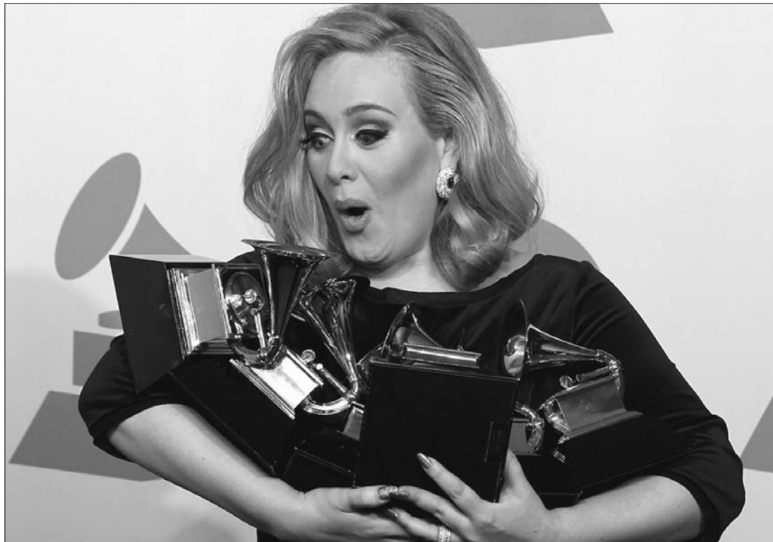
Adele, a brit soul-énekesnő összesen hat aranygramfont vitt haza az 54. Grammy-gáláról

A zenekar több mint két évtizede nem lépett fel. A Grammy közönsége előtt az eredeti együttes három alapítója, a 69 éves Brian Wilson, a 70 éves Mike Love és az ugyancsak 69 esztendőes Al Jardine játszott a Beach Boyshoz később csatlakozott Bruce Johnstonnal és David Marksszal. ◀