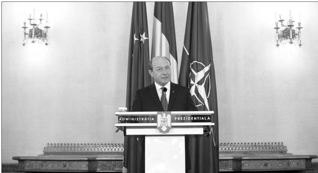
Traian Basescu államfő azt szeretné, ha március elsejéig a parlament ratifikálná az uniós szerződést.

olyan elvárást fogalmazott meg a kormánnyal szemben, amely a kormányprogramban is megtalálható. „Ez jó alapot kellene szolgáltatson ahhoz, hogy az ellenzék visszatérjen a parlamentbe” – fogalmazott az államfő. ◀