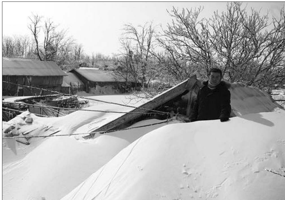
A kémény sem látszik. Hóba temetett házak a Vrancea megyei Dumbrăveni községben

A legválságosabb helyzetben a Vrancea megyeiek voltak, olyannyira, hogy Gabriel Berca frissen kinevezett belügyminiszter ma déltől holnap délig érvényes