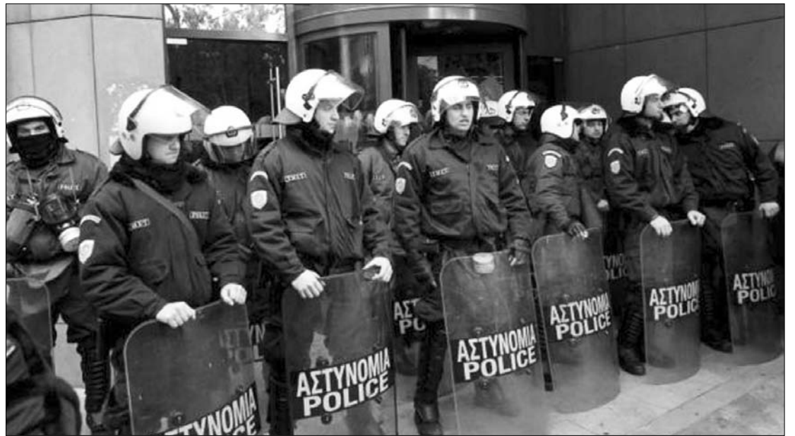
Rohamrendőrök a görög fejlesztési minisztérium bejáratánál. Az állami intézményeket fenyegette a tüntető tömeg

A hónapok óta tartó tiltakozó megmozdulások közül a tegnapi volt a legnagyobb. Résztvevői szerint a görög átlagpolgár elegendő fizetésmérséklést és adóemelési fogadott már el ahhoz, hogy ne sújtsák újabb terhekkel.