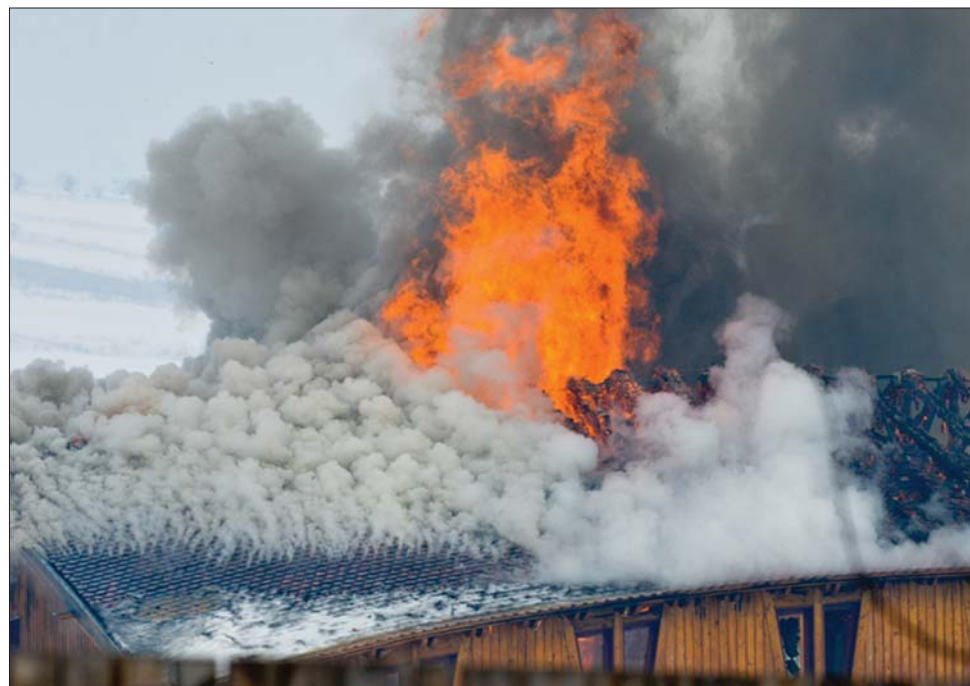
A csikmindszenti sportcsarnok felépítése hárommillió lejbe került, az épület biztosítva volt