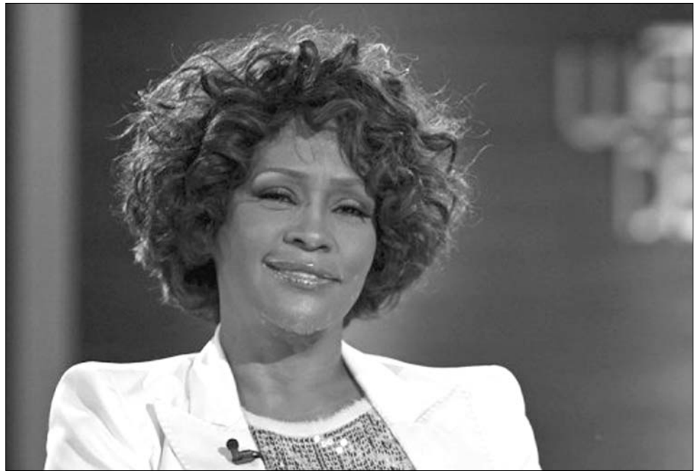
Mindig szeretni foglak – énekelte a tragikus körülmények között elhunyt diva, és így érez sok rajongó is

Nothing, I Wanna Dance With Somebody, When You Believe című számaival beírta magát a popzene halhatatlan művészei sorába. A Rekordok Könyvébe is bekerült: ő volt a legdíjazottabb nő a világon. ◀