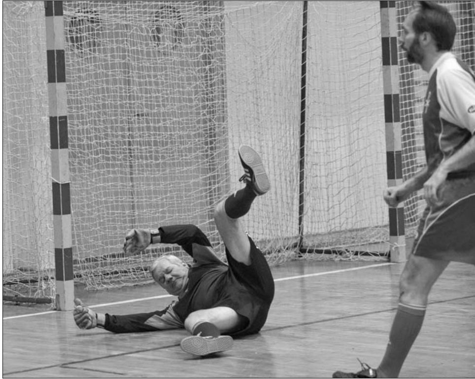
Gyulán a katolikus papok új megvilágításba helyezték az „ép testben ép lélek” mondást

Az első két kiírást a horvátok, a következő harmat pedig a lengyelek nyerték, most előbbieknél kellett érniük a második, utóbbiak pedig a harmadik helyet. A mostani, hatodik kiíráson összességében bejött a papírforma, ugyanis évek óta a lengyel, a portugál, a horvát és a bosnyák csapat kerül a legjobb négy közé, ami nem véletlen, hiszen ezekben a válogatottakban olyan papok is pályára léptek, akik