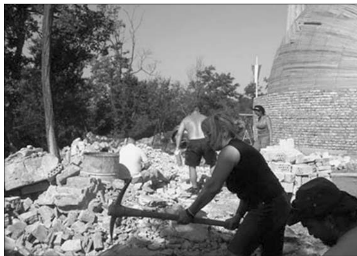
Templomot épít Verőcén az Erdélyi Gyülekezet. Egyházi státust kapnak

Ha a bizottság előterjesztésére a Magyar Országgyűlés módosítja a törvényt, akkor egyházként ismerik el a következő felekezeteiket: Magyarországi Metodista Egyház, Magyar Pünkösdi Egyház, Szent Margit Anglikán/Episzkopális Egyház, Erdélyi Gyülekezet, Hetednapos Adventista Egyház, Magyarországi Kopt Ortodox Egyház, Magyarországi Iszlám Közösség, Krisztusban Hívó Nazárenus Gyülekezetek, Magyarországi Krisna-tudatú Hívők Közössége, az Údvhadsereg