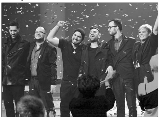
Május 22-én lép fel a Magyarországot képviselő együttes Bakuban

Idén 43 ország vesz részt az Európai Műsorszolgáltatók Szövetsége (EBU) által szervezett versenyen. A dalfesztivált ezúttal azért rendezik Bakuban, mert tavaly Düsseldorfban egy azeri duó, Ell és Niki nyert Running Scared című dalával. ◀