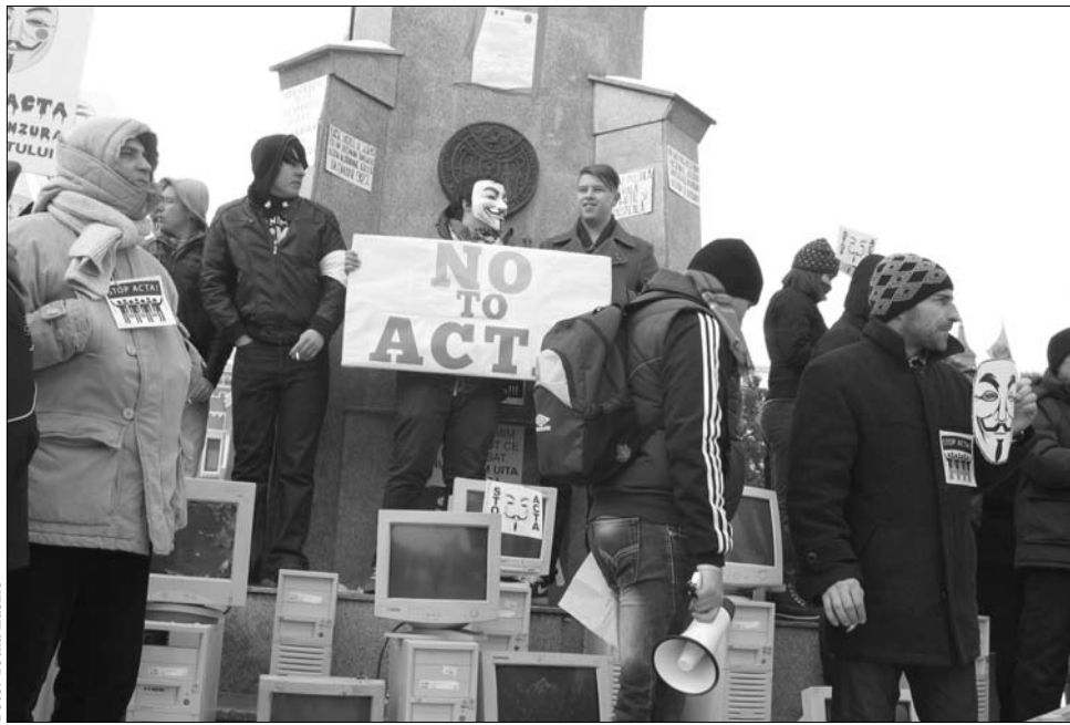
A szólásszabadságért harcoló több ezer tüntetőt a fagy sem riasztotta el az utcai tiltakozástól

Mint ismert, az ACTA a védjegyhamisítás és a szellemi tulajdon megvédését célzó termékek ellen kíván fellépni, ám kiterjed a digitális környezetben megosztott szellemi tulajdonokra is – így számos népszerű tartalommegosztó oldal létét peccsételheti meg. Kritikusai szerint a legaggasztóbb az előírása, hogy a csatlakozó országok internetszolgáltatóit kötelezi arra, hogy együttműködjenek a hatóságokkal, folyamatosan figyeljék az áramló tartalmakat, és kiadják azok elérhetőségét, akik esetleg jogsértő tartalmakat osztottak meg. Mindez azonban ellentmond a jelenleg hatályos adatvédelmi előírásoknak és EU-szinten tiltott. „Az ACTA-t 39 ország képviselői a nyilvánosság teljes kizárásával írták alá. A tör-