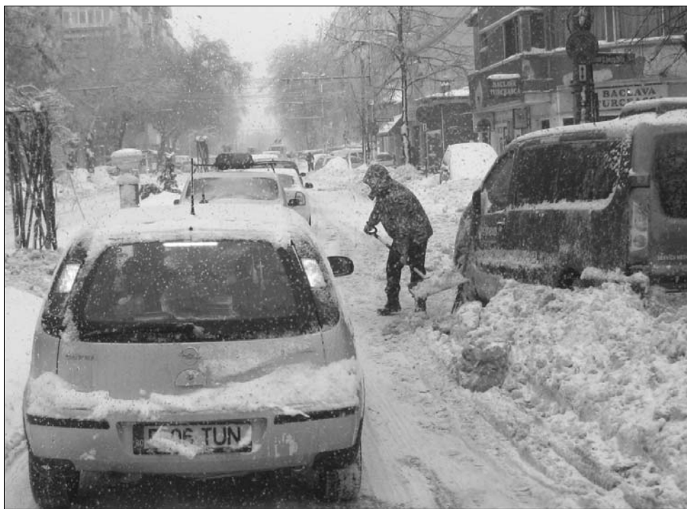
A szélsőséges időjárás megnehezíti a közlekedést, Bukarestben az oktatás is szünetel.

rium közleménye szerint eközben 39-re emelkedett a fagyhalálban elhunytak száma, naponta pedig több száz riasztják a mentőket, a legtöbbször szív és érrendszeri, légzési problémák és törések miatt. A fővárosban az elmúlt 24 órában 1300 alkalommal riasztották a mentőket, Kolozsváron a hétvégén közel 600 esethez hívták a mentőket, Marosvásárhelyen több mint száz személy szorult speciális orvosi ellátásra. ◀