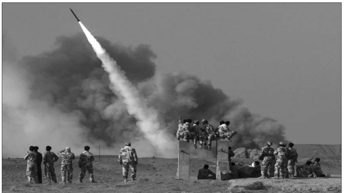
Iráni cirkálórakéta-kísérlet 2011 júniusában. Teherán Izrael megsemmisítésével fenyegetőzik, ha megtámadják

Előző nap este sugárzott tévéinterjújában Barack Obama amerikai elnök azt mondta: nem gondolja, hogy Izrael már eldöntötte volna, hogy katonai csapást mér Iránra, amiért az gyaníthatóan atomfegyverre akar szert tenni. Az elnök meg akarta nyugtatni mind az Egyesült Államok szövetségeseit, mind ellenségeit afelől, hogy Amerika nagyon szorosan együttműködik Izraellel a válság megoldásán, amely – mint