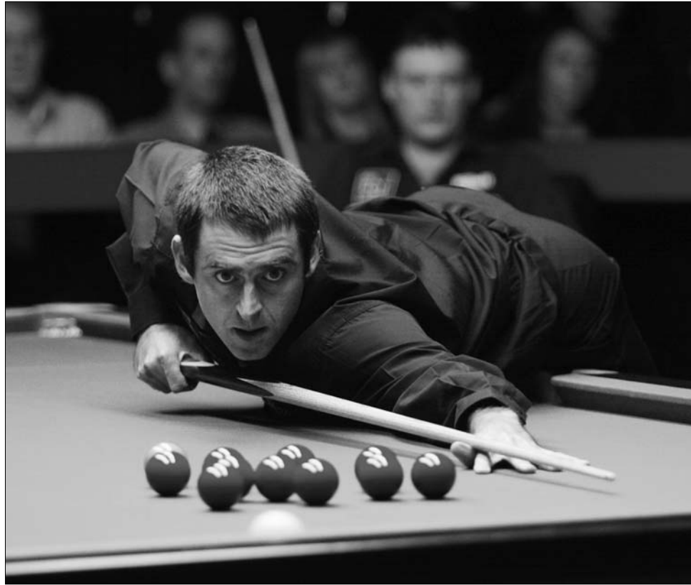
Ronnie O'Sullivan legjobb napjaira emlékeztető formában szerepelt a berlini teltház előtt

Bombaformája alátámasztotta feltámadását igazolandó O'Sullivan null-négyről fordítva győzte le az első körben Andrew Higginst (5-4), majd a másodikban 5-1-re a szintén honfitárs Joe Perryt. A legjobb nyolc között a walesi Matthew Stevenst (5-3), az elődöntőben pedig az angol Stephen Lee-t (6-