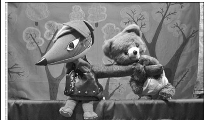
A magyar bábélművészetek az eldugott falvakba is eljutnak