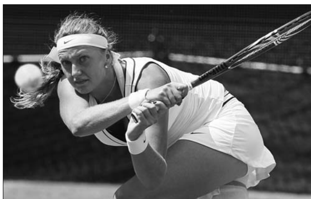
Kvitováék semmi esélyt nem hagytak a házigazda németeknek

Charleroi-ban a vendég szerbek a Bojana Jovanovskí, Aleksandra Krunić páros sikerével (7-6, 4-6, 6-1) a Yanina Wickmayer, Alison Van Uytvanck duóval) csikarták ki a döntést.