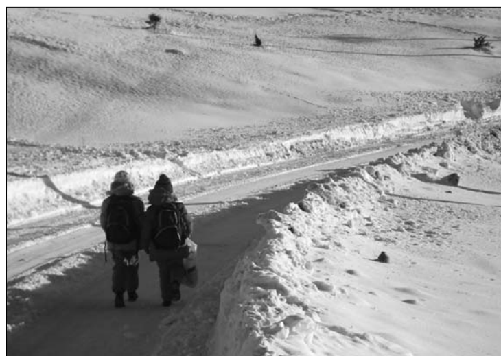
Útban az iskola felé – Szibériához illő körülmények között

▶ Szünetel az oktatás az ország összesen 2667 tanintézményében, több országos és megyei úton, illetve a vasutakon és a reptételeken akadozik a közlekedés a rendkívüli hideg és az erős hófúvások miatt. Holnap este hét óráig 19 megyében és a fővárosban narancssárga riadó, 17 megyében pedig sárga figyelmeztetés érvényes a nagy havazás és az erős szél miatt. 7. oldal ▶