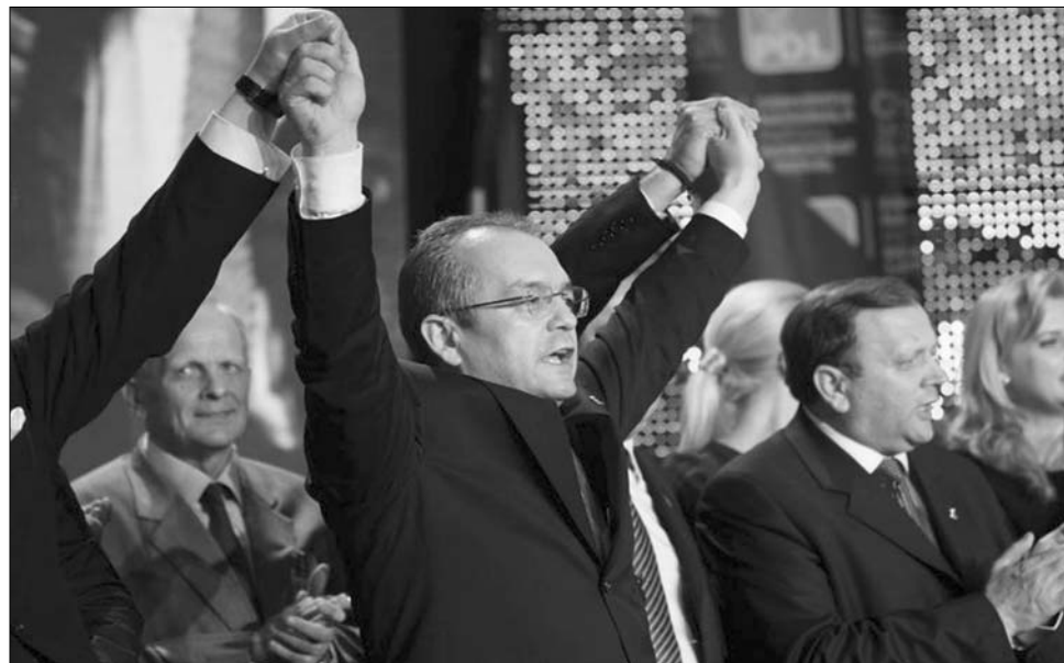
Emil Boc, győzelmi mámorban. Amikor még azt hitte, övé a világ – de legalábbis a hatalom

Most nagyrészt kormányának és pártjának a megszorító intézkedései nyomán bekövetkezett népszerűségvesztése miatt kellett távoznia. A demokrata liberálisok ugyanis joggal tartanak attól, hogy szavazóbázisuk rohamos csökkenése nyomán elveszíthetik a helyhatósági és parlamenti választásokat. Traian Băsescu és demokrata liberálisai abban reménykednek, hogy a kormányváltás lecsillapítja a háborgó közvéleményt. ◀