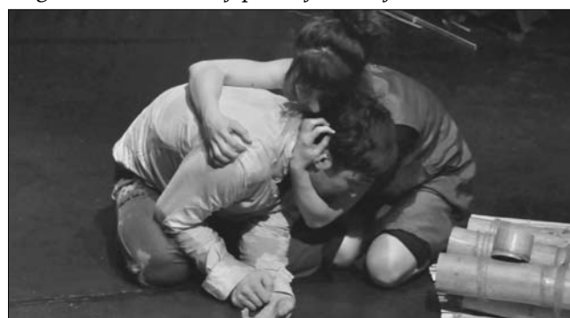
Gyűlöletből szeretet – erről (is) szól a japán regény