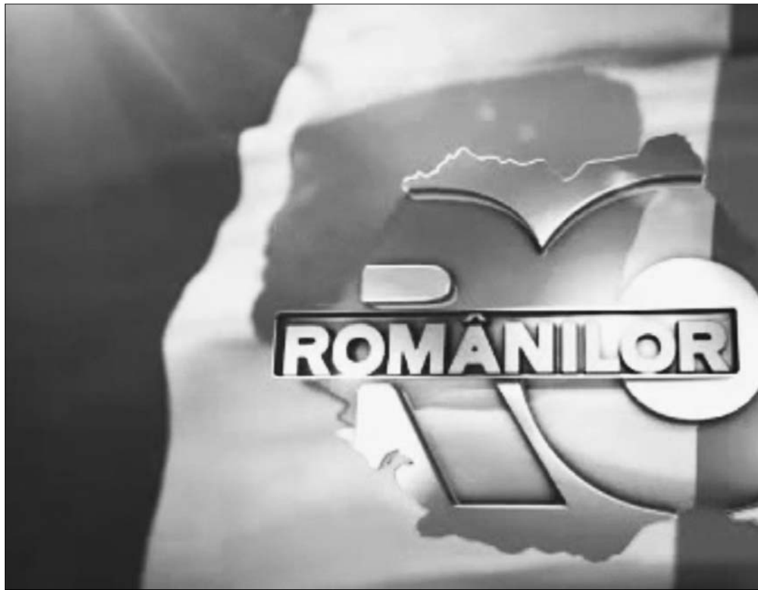
A hírtelevízióban óránként elhangzó felhívás szövege: Románia a MIÉNK, NEM az ÖVÉK. Románia a románoké!”