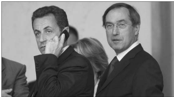
Claude Guéant (jobbra) Sarkozy Francia elnökkel. Politikai vitát kavart

Az internetes oldalakon felháborodással kommentált mondatokat elítélte a Szocialista Párt.