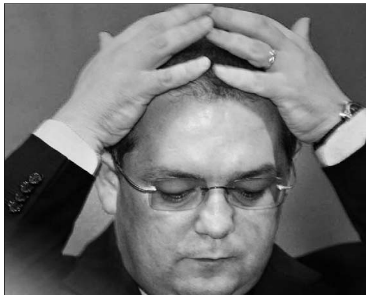
Porba hull Emil Boc feje? A kormányfő miniszterelnök-cseréjére készül