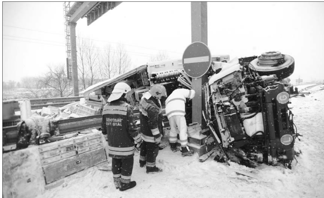
A tél „örömei”. Tűzoltók dolgoznak az M5-ös autópályán, ahol felborult egy kamion, miután összeütközött egy autóval

Tegnap Pristinában is bejelentették, hogy 10-éig szünetel a tanítás a koszovói iskolákban.