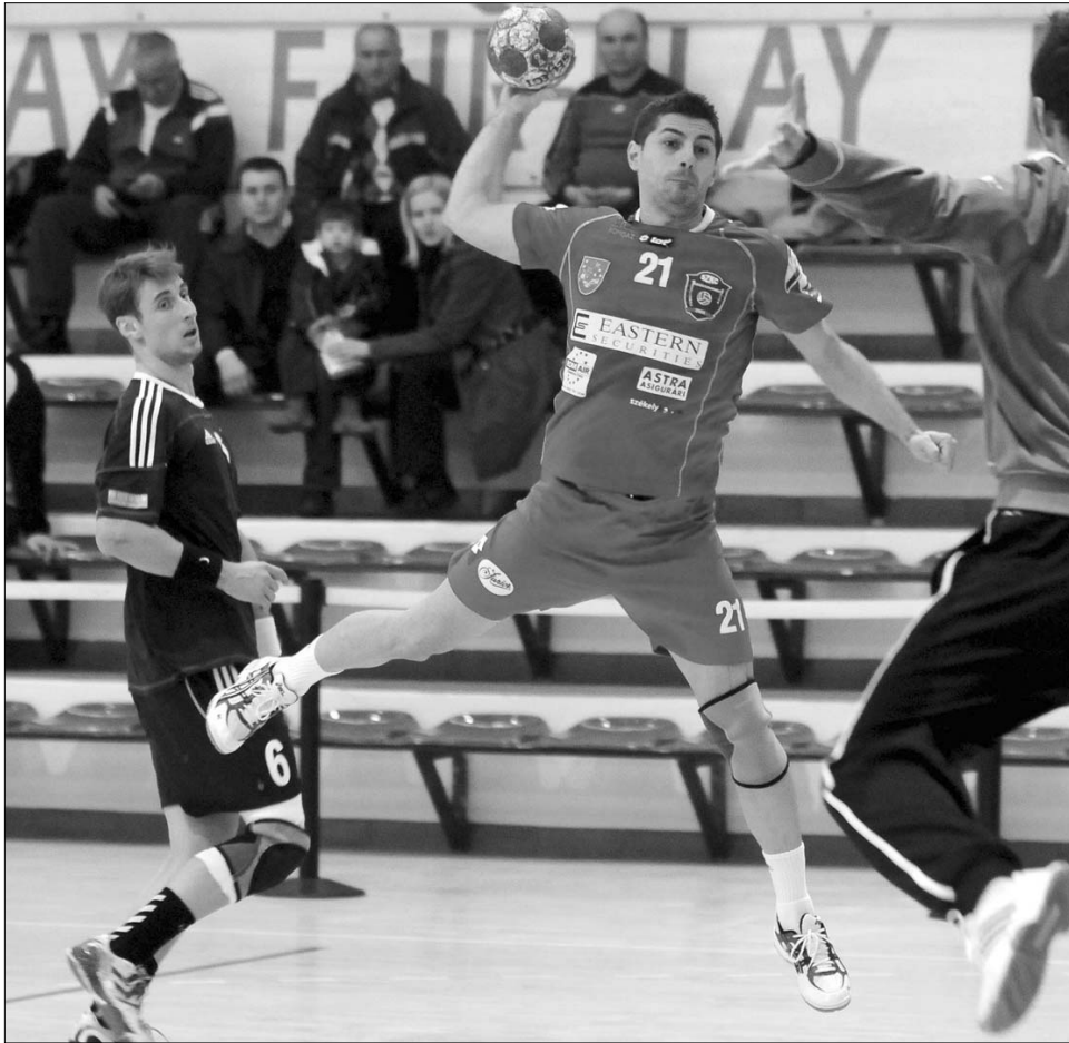
A székelyudvarhelyi KC magabiztosan győzött Bukarestben a Steaua ellen

Bár két mérkőzéssel kevesebbet játszott, az Oltchim (24) vezet a Zilah (21), a Galac (19) és a Kolozsvár előtt. Az Oltchim holnap a Romant fogadja, a Kolozsvár pedig szerdán a Galacot. ◀