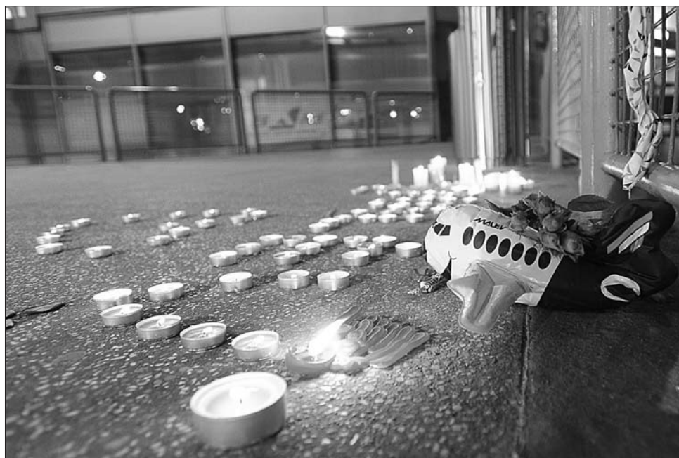
Rövid szenvedés után, 66 éves korában „elhunyt” a Malév. Dolgozói és utasai egyaránt gyászolják