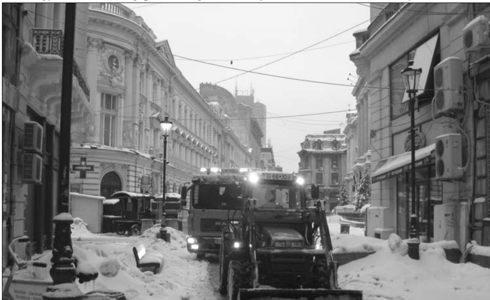
A Lipszani behavazva. Bukarestben egész hétvégén akadt bőven dolga a hókotróknak

Az Országos Meteorológiai Szolgálat tegnap 18 órától az ország déli-délkeleti megyéiben sárgáról narancssárgára változtatta a figyelmeztetés besorolását. Az erdélyi megyékben továbbra is a havazás, hófúvás miatti sárga figyelmeztetés marad érvényes. ◀