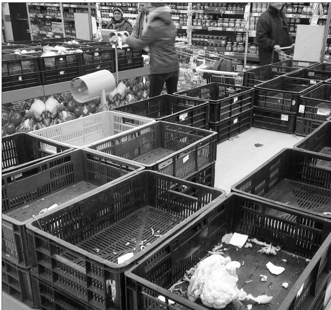
„Kifosztott” zöldséges részleg egy bukaresti hipermarketben. A fővárosiak pánikszzerűen vásároltak a hét végén

látásával is gondok lesznek. A „szibériai” időjárás Magyarországon is fennakadásokat okozott mind a közúti, mind a vasúti közlekedésben. Montenegró északi területei a hótorlaszok miatt gyakorlatilag el vannak vágva az ország többi részétől. 2. és 7. oldal ◀