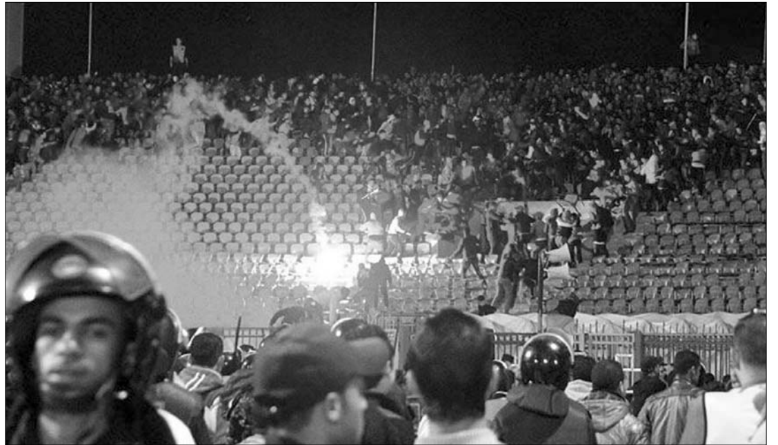
Port Szaídban lángba borult szerda este a futballstadion. A halálos áldozatok többnyire megfulladtak

A parlament tegnapi ülését egyperces néma csenddel kezdte meg. Mohamed Szada al-Katarni szóvivő szerint az egyiptomi forradalom „veszélyben van”. A Kairóban a Tahrír teret elfoglaló tü-