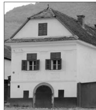
Hagyományos torockói ház

mányosi listájára felvette, és erről az UNESCO Világörökségi Bizottságát tájékoztatta 2011. február 1-én. A várományosi listára való felkerülés a tulajdonképpeni világörökségi jelölés előfeltétele. Torockó értékeinek hosszú távú védelme szempontjából a világörökségi jegyzékre való felkerülés igen fontos előrelépést jelentene. Ezáltal Románia Kormánya az országos védelmen felül nemzetközi egyezményekben is vállalná az itteni építészeti örökség megőrzését. Ugyanakkor a világörökségi státusz biztosíthatná a település gazdasági fellendülését is. Számítalan példa igazolja, hogy a világörökség részét képező helyszínek turisztikai látogatottsága folyamatos. A torockói közösség fennmaradásának alapját az ezredfordulón a most fejlődő faluturizmus jelentheti, a világörökségi státusz ennek a folyamatnak a méltó kibontakozását biztosíthatja. ◀