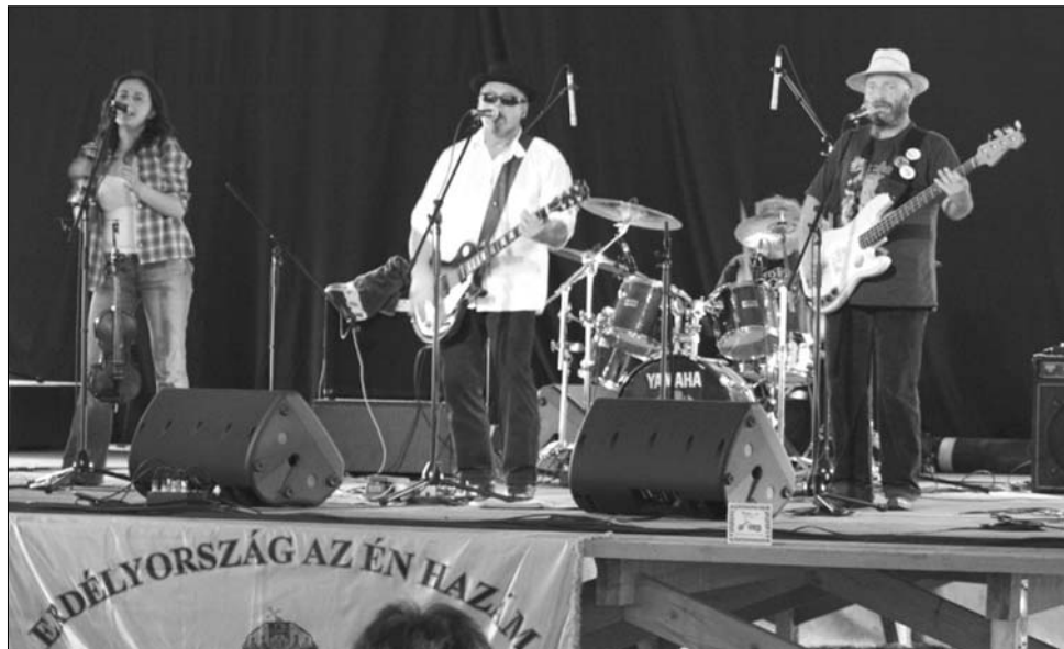
A Knock Out zenekar tagjai remélik, hogy kedden jelentős összeg folyik be a diáklány megsegítésére