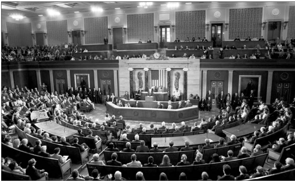
Az amerikai kongresszus republikánus többségű alsóházának vízumpolitikáját bírálta Barack Obama

Az új amerikai ígéretekről természetesen a romániai sajtó is beszámolt. Az országot különösen kényesen érint mindenféle beutazási könnyítés, hiszen az Európai Unió belülről érvényes schengeni határok a Brüsszel által kilátásba helyezett különböző határidők sorra lejártak, és Bulgáriával egyetemben ma sem lehet tudni, hogy mikorra várható Románia felvétele a rendszerbe. Az unió erre hivatott intézménye ugyanis „csomagban” kezeli az új tagokat, s bár esetünkben az összes szükséges feltétel adott, Bulgária még mindig nem kaphatja meg a jeles osztályzatot. Szakértők szerint ez az egyik ok; a másik pedig egyfajta „megtorlás” a vétót mondók részéről.