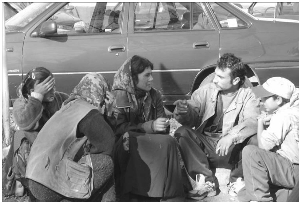
Az etnikai kisebbségek közül csak a romák aránya nőtt a népszámlálási adatok szerint.

A fővárosban az ország lakosságának 8,8 százaléka él,