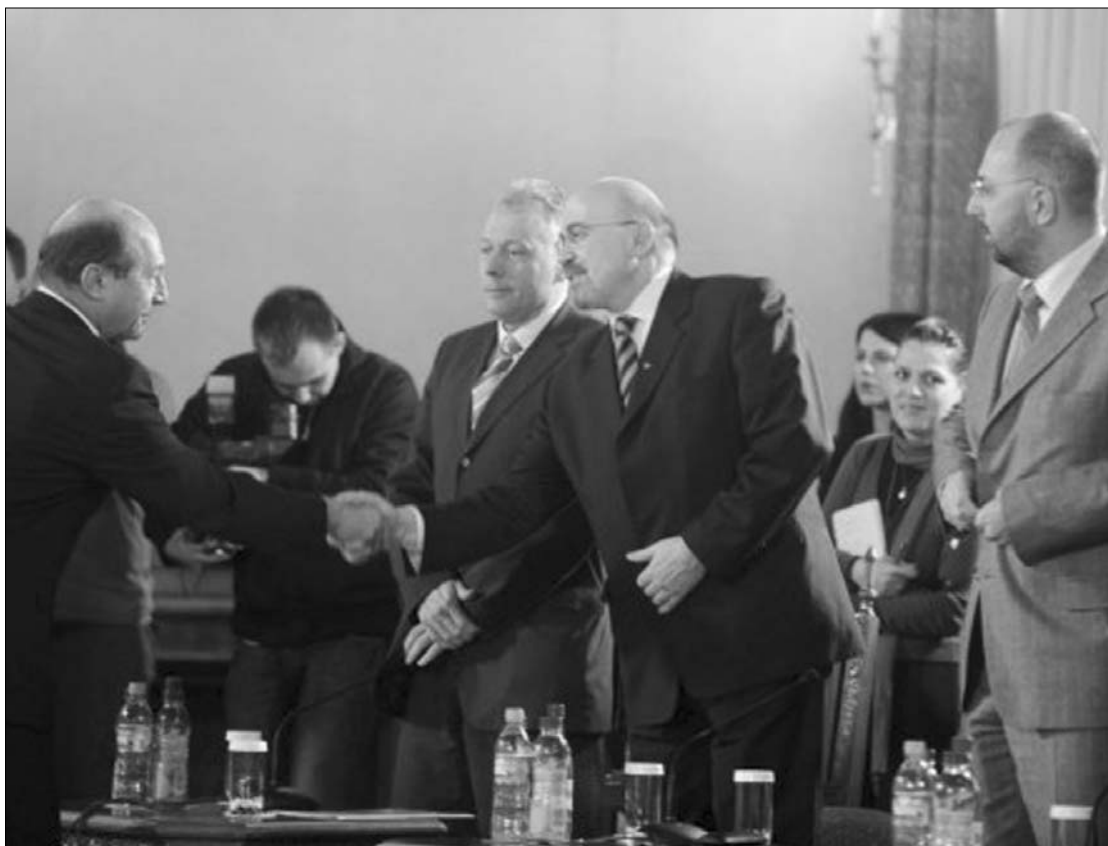
Nem kizárt, hogy államfő meglepő bejelentéseket tesz majd a pártokkal való jövő hétfői konzultáción

A lap szerint a PDL parlamenti frakciói jövő kedden szólítják fel távozására Emil Bocot. Addig szeretnék megbiztosítani azt a parlamenti többséget, amely megszavazna egy esetleges technokrata miniszterelnök vezette kormányt. Ebben számítanak az