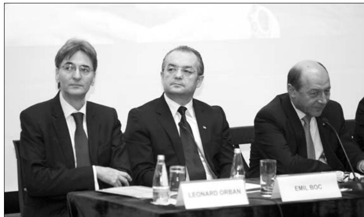
Öt éve az Európai Unióban: Leonard Orban, Emil Boc és Traian Băsescu

Leonard Orban európaügyi miniszter arról számolt be, hogy a közhiedelemmel ellentétben Románia 5,6 milliárd euró hasznot húzott az uniós tagságból. Számításai szerint az utóbbi öt év alatt az ország 11,91 milliárd eurót hívott le, miközben csak 6,24 milliárdot kellett befizetnie a közös kasszába. ◀