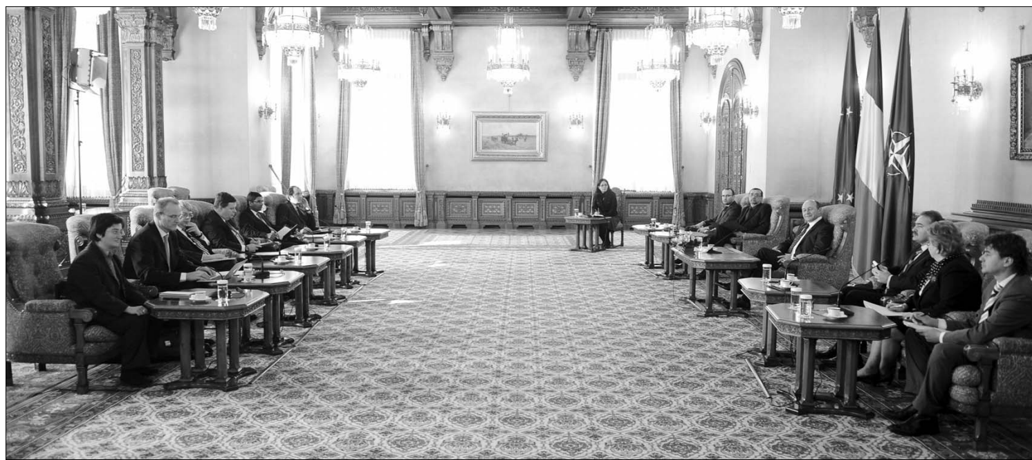
Traian Băsescu államfő tegnap jó hírként közölte a Cotroceni-palotába látogató IMF-küldöttséggel az előző napi EU-szerződés létrejöttét