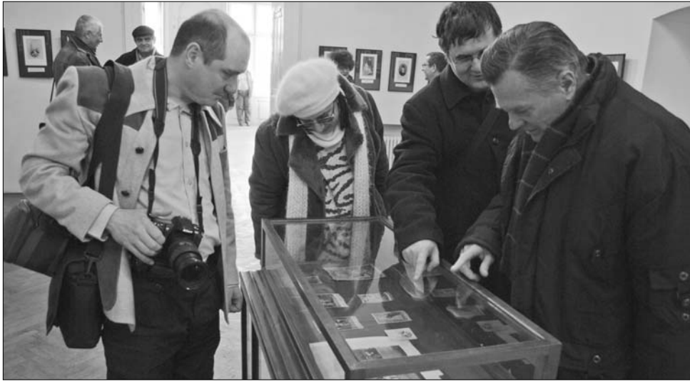
Tegnap, a Fotográfia Hónapjának első napján négy tárlat is nyílt a kincses városban

A 200 éve született Szathmári Pap Károly, a világ első hadifotósa digitalizált és eredeti munkáit világviszonylatban is premierként a Bánffy-palotában mutatták be. „Vissza kell utaznunk az időben 150 évet, és az akkori technikai kontextusban kell megértenünk Szathmárt: úgy tudott fényképezni, hogy a fényképek modelljei természetesen viselkedtek a kamera előtt, ami egy mai fotós számára is kihívás” – mondta el Tóth István, a Romániai Fotóművészek Szövetségének elnöke a megnyitón. A több teremben kiállított, összesen 150 Szathmári Pap Károly-alkotás digitalizált változata mellett egy napig a műfaj „ínyencei” is megtalálhatták a maguk kedvtelését: Ördög Róbert csíkszeredai magángyűjtő jóvoltából kizárólag tegnap meg lehetett tekinteni a fényképész eredeti munkáinak pár darabját, és egy korabeli fényképalbumot is. „Ma már biztosan tudható, hogy elmentmondásos személyiségű alkotó volt, aki egyrészt fel-