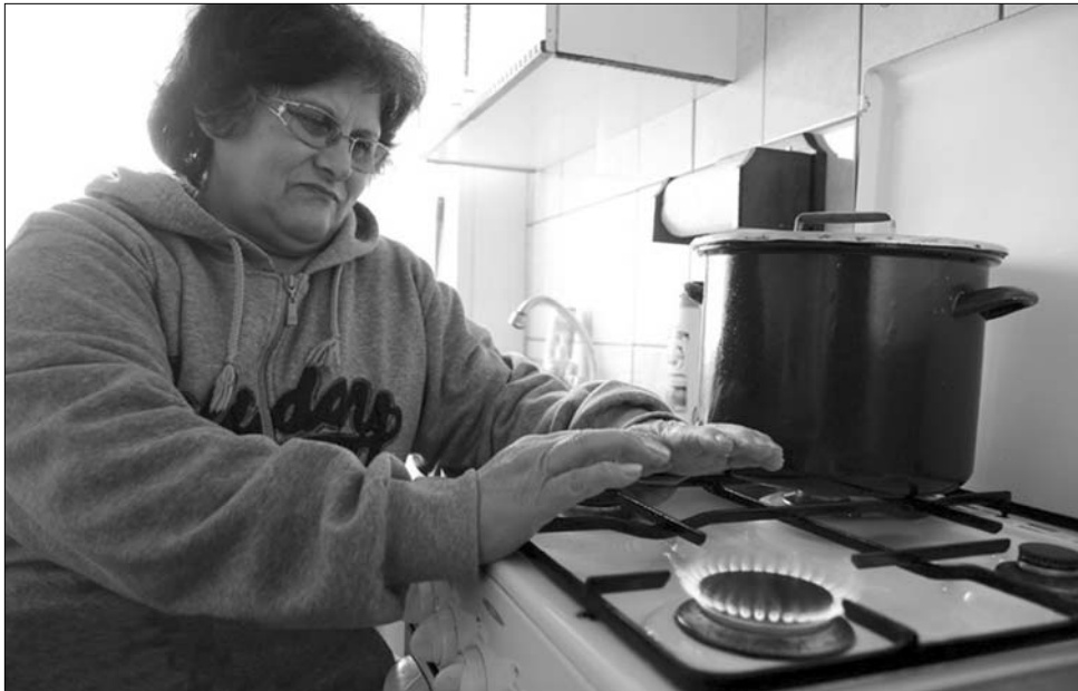
„Fellobbanó” gázfogyasztás, csökkenő nyomás. A kormány szerint elég a román gáztartalék

Az újságíróknak válaszolva Claudiu Stafie gazdasági államtitkár kijelentette: csupán elszórt esetekről van szó, a kormány gondoskodott a szükséges készletek beszerzéséről. „A Transgaz meghozta a kellő intézkedéseket, a minisztérium állandó kapcsolatban áll a vállalattal” – fogalmazott az államtitkár, aki elmondta, hogy a tegnapi 17,5 millió köbméter után, ma újabb 20