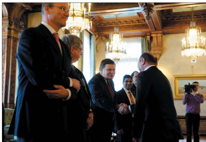
Traian Băsescu a Cotroceni-ben fogadta az IMF küldöttségét

▶ „Dühös leszek, ha a politikai osztály nem méri fel az EU új stabilitási szerződésének fontosságát és a paktum ratifikálása ellen dönt” – figyelmeztetett tegnap Traian Băsescu államfő az Európai Tanács előző napi ülésén elfogadott dokumentum Romániára vonatkozó vetületeit kommentálva. 2. és 3. oldal ▶