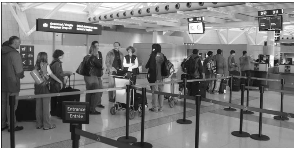
Last-minute check-in? A Malév-utasok foglalásai egyelőre nincsenek veszélyben, de kérdés, hogy meddig