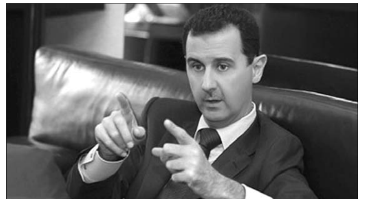
Egyre többen követelik Bassár el-Aszad szíriai elnök rendszerének bukását