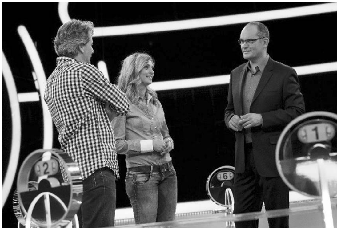
Gundel Takács Gábor (jobbra), a 2011-es év mediaszemélyisége sportkommentátorként kezdte pályafutását

1991–1997 között a Rádió Bridge munkatársa volt. 1993–1998 között ő vezette a Játék határok nélkül című vetélke-