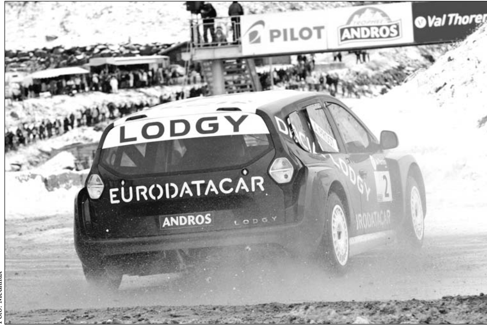
A négyszeres Forma-1-es világbajnok Alain Prost Dacia Lodgyjával megnyerte a Trophée Andros díjat

A mostani mezőny olyan korábbi F1-es pilótákat vonultatott fel, mint az összetett