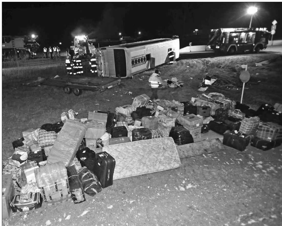
Olasországból tartottak laji-ba. A jeges útról a busz előbb az útról a mezőre szaladt, majd felborult

Romániába, hazafelé tartott, amikor a baleset történt. Az utasokat a ceglédi rendőrség épületének aulájába szállították, hogy amíg a mentesítő járat odaér Budapestről, fűtött helyen legyenek. ◀