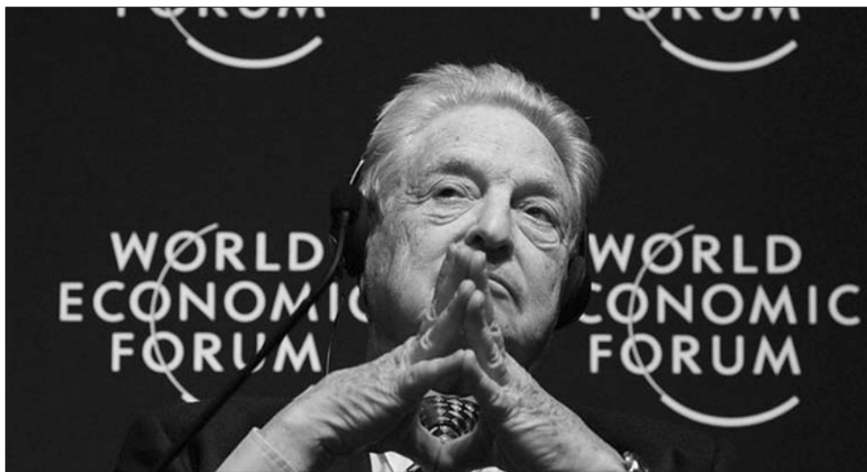
Út az adósságspirálba? Soros György erőteljesen bírálja a német válságmenedzselést

A kormányok arra is igyekeztek kihasználni a Davos adta alkalmat, hogy segítsék vállalataikat a külföldi üzletkötésben, amint azt Rafael Roncagliolo perui külügyminiszter tette, amikor ausztrál kollégájával, Kevin Rudd-dal találkozott. Rudd egy májusra tervezett konferenciát készít elő ausztrál és latin-amerikai politikusok és üzletemberek között. Roncagliolo hangsúlyozta, hogy Peru nagy figyelmet szentel a Csendes-óceán medencéje körül fekvő országoknak, s közülük is különleges érdekük fűződik a kapcsolatok fejlesztéséhez, a befektetésekhez és kereskedelemhez Ausztráliával. Az ausztrál befektetők elsősorban a perui bányakincsek iránt érdeklődnek. A múlttal ellentétben a befektetők érdeklődése Latin-Amerika iránt sok politikus és vállalatvezető kijelentései szerint most lehetővé teszi, hogy kiválaszthatassák azokat a befektetéseket, amelyek megfelelnek a kormányok ökológiai és társadalmi követelményeinek, különösen a nem megújuló nyersanyagokat, ércet és szénhidrogént kitermelő iparban. ◀