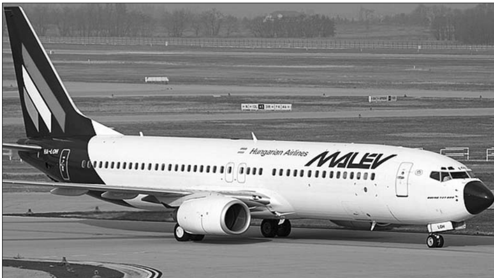
A rosszul elsült privatizáció „szegte szárnyát” a Malév légitársaságnak

Nem biztatta túl sok jóval Romániát a világgazdaság fellendülését illetően Jeffrey Franks, a Nemzetközi Valutaalap (IMF) bukaresti küldöttségének vezetője, ugyanakkor sietett leszögezni: az ország makrogazdasági helyzete javult az elmúlt évben. Pozitívként emelte ki, hogy az elmúlt évben az infláció csökkent, míg a lakosság vásárlóereje nőtt, illetve azt, hogy a 2010-es stagnálást követően a magánszférában is látható növekedés ment végbe. A washingtoni pénzügyminiszter azonban biztatóan nyújtott 2,5 százalékos gazdasági fellendülés örvendetes ugyan, de közép- és hosszú távon nem elég ahhoz, hogy a romániai polgárok számára a nyugat-európai életszínvonalat biztosítsa. Mint Jeffrey rámutatott, más uniós országokban a lakosság és a pénzpiacok egyaránt büntetik azokat a kormányokat, amelyek nem tudták ellenőrizni az inflációt a helyzetet, és gazdasági-politikai-társadalmi instabilitást váltottak ki – Románia számára pedig óriási kihívás, hogy bele ne essen ugyanebbe a csapdába. Az IMF-szakember figyelmeztetett, hogy az ország fejlődése azon múlik, hogy lakóinak van-e lehetőségük dolgozni. ◀