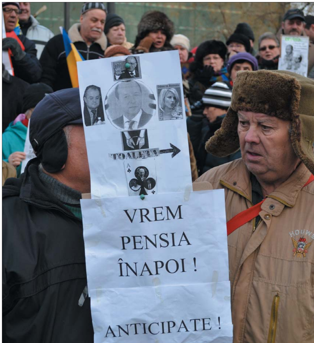
A követelések nem teljesültek: nincs nyugdíjmelés, nem hozták előre a választásokat sem.

Csupán egyetlen kérdésben jutottak konszenzusra tegnap a koalíciós pártok vezetői: „a levágások után ideje adni is egy kicsit”. Ennek ellenére nem tudták meggyőzni a miniszterelnököt, hogy alkudja ki a Nemzetközi Valutaalap küldöttségével a nyugdíjak és a közalkalmazotti bérek áprilisi emelését. A nagyobbik kormánypártnak sem sikerült meggyőznie tegnap az RMDSZ-t arról, hogy hagyjon fel az előrehozott választások gondolatával. Az ellenzék parlamenti sztrájkjal siettetné a választásokat. 3. oldal ▶