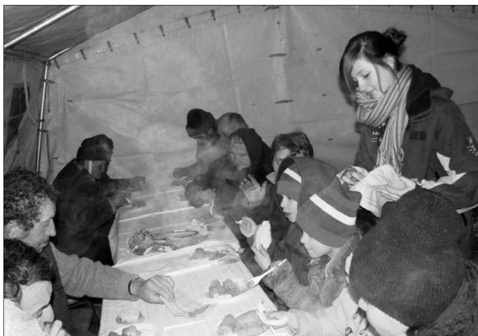
A Máltai Szeretetszolgálat önkéntesei meleg teát és ételt adnak a háromszéki hajléktalanoknak

Az ország 14 megyéjéből jelentették, hogy a hideg, illetve a havazás miatt nem nyitottak ki az iskolák. Daniel Funeriu a tanfelügyelőségek közreműködését kérte ahhoz, hogy pontosan fel lehessen mérni: mely iskolákban akadozik a fűtés. Ott, ahol a zavartalan közlekedés nem biztosított, a tanároknak folyamatosan tartaniuk kell a kapcsolatot a szülőkkel, hogy egyetlen diák se maradjon a havas úton, mindenki, aki elindult otthonról, eljusson az iskolába. A hideg miatt több település víz nélkül maradt. Főként ott fordult elő ez, ahol az ivóvíz felszíni vízből származik, amely a hideg miatt megfagyott. Galați lakosságának mintegy fele maradt ivóvíz nélkül hétfőn reggel, miután a folyóban levő szivattyúk eljégesedtek. Az utak tisztítása sem halad zökkenőmentesen, több cég is azzal az indoklással utasította el a munkát, hogy megbízása nem terjed ki a rendkívüli időjárási viszonyokra. Mint utólag kiderült, ilyen jellegű probléma merült fel a több napig behavazott A2-es autópályát karbantartó Romstrade és Straco cégek esetében is. A két vállalat 2009-ben nyert megbízást az autópálya tisztítására, idén azonban csak bérautók bevetésével tudták járhatóvá tenni a jelzett útszakaszt. ◀