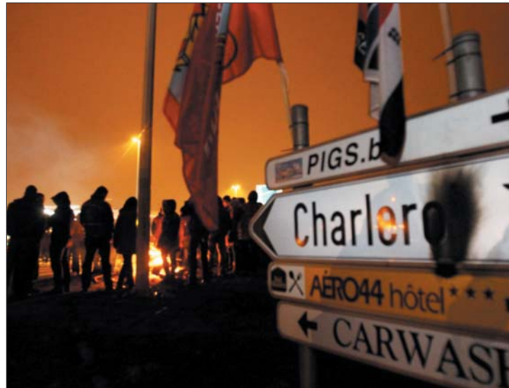
Vendégvárás. Az EU-csúcs napján általános sztrájk volt Brüsszelben

▶ A foglalkoztatás és a gazdasági növekedés élénkítéséről igen, a görög helyzetről nem esett szó tegnap az uniós tagországok vezetőinek csúcstalálkozóján. Az állam- és kormányfőket kísértetváros fogadta Brüsszelben, mert a közalkalmazottak általános sztrájkot tartottak. 2. oldal ▶