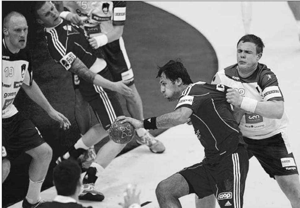
A szlovénok keményen védekeztek, a magyarok (piros mezben) erőteljesen támadtak

„Összességében csalódtok vagyok. A szlovénok irányították a játékot, mindenben jobbak voltak. Mi sem védekezésben, sem támadásban nem tudtuk megvalósítani, amit elterveztünk. Azzal a kapusteljesítménnyel, amit ma mutattunk, nem lehet