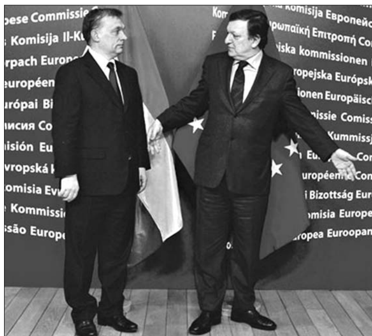
„Tudod, hova állj...?” Orbán és Barroso csaknem három órán át tárgyalt

Az IMF-fel és EU-val folytatandó tárgyalásokról Orbán Viktor úgy fogalmazott: Magyarország gyors tárgyalásban és gyors megállapodásban érdekelt. A legtöbb kérdésben az álláspontok közeledtek, néhányban megoldódtak, másokban pedig világossá tette, mi az, amiből jogi eljárás nélkül nem enged Magyarország. Vannak olyan kérdések is, amelyekben az ország szuverenitása miatt nem áll módjában a kormánynak elmozdulnia. Ilyen pél-