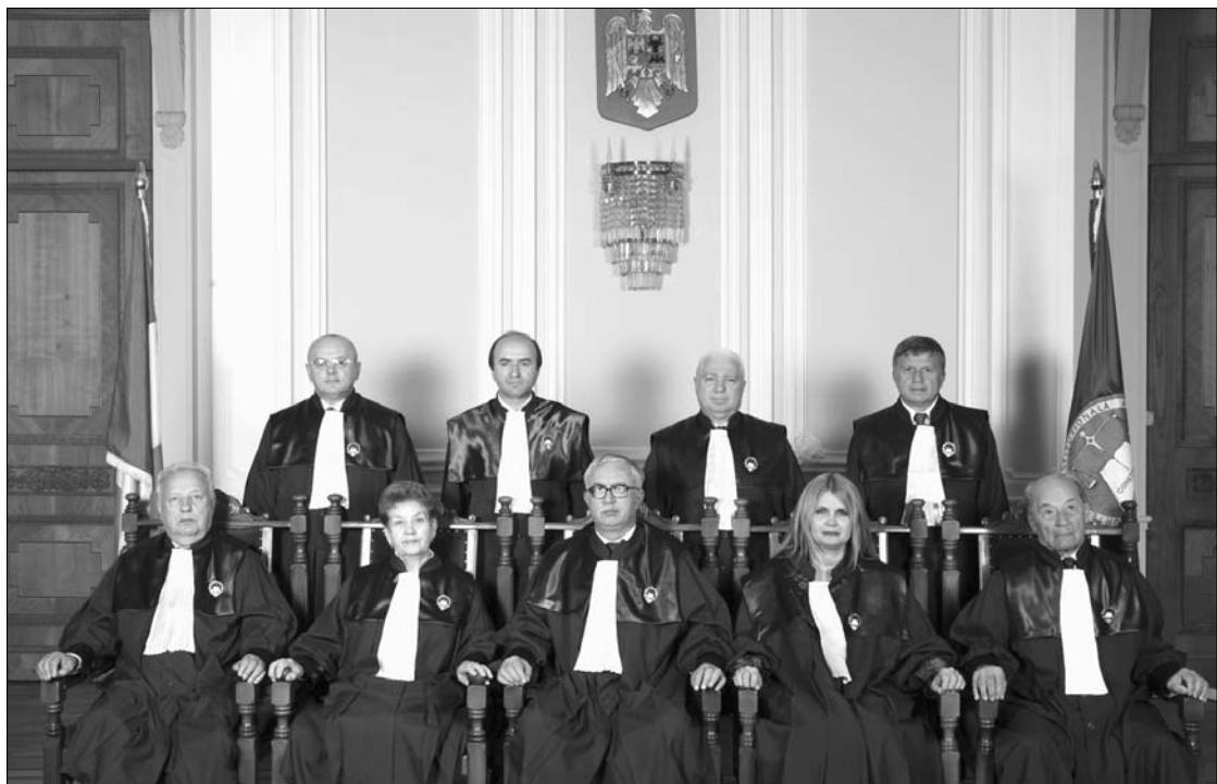
„Családi fotón” a taláros testület. Az Alkotmánybíróság tagjai keresztülhúzták a koalíció számításait

Az alkotmánybírók mostani döntése nyomán az ellenzék talán valamit visszaszerez megtevéstől hitelességéből, ám semmivel sem jut közelebb céljaihoz. Az államfő felügyeltetése – a kormánypárti parlamenti többség miatt – továbbra is lehetetlen, lemondása pedig elképzelhetetlen, még ha egyenesen a szociáldemokraták nőszervezetének elnöke kérte is fel az államfő nejét, vegye rá férjeurát a távozásra. Kivételzetlenülnek tűnnek az előrehozott választások is – egyébként is, ebben az esetben csak a parlament menne, Traian Băsescu nem – így aztán mandátuma végéig „játékos államfő” marad.