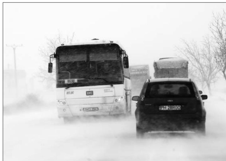
A román közúti hatóságok húsz országotat zártak le tegnap

miatt. A zord időjárás főként Románia déli és keleti részét érintette. Este a kormányfő válságtanácskozást hívott össze. 7. oldal ▶