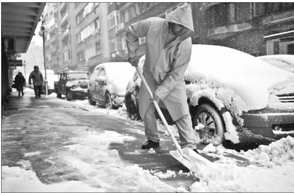
A főváros hó alá került, az autósoknak nehéz volt kiszabadítani járműüket