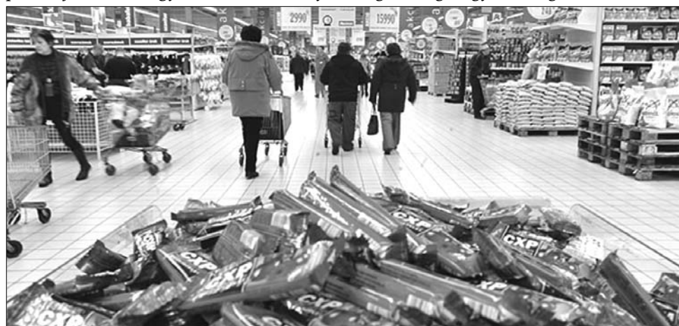
Az üzletmenetet is fellendítheti az anyanyelven szóló címke

A vizsgálat szerint legnagyobb számban a csokik és cukros üdítőitalok termékkörében hiányzott a magyar felirat. Spaller negatív példaként említette a Nestlé-t, míg a Procter and Gamble vagy a Rauch gyártókat dicsérettel illette amiatt, hogy termékeiken minden esetben megtaláltni a magyar szöveget. ◀