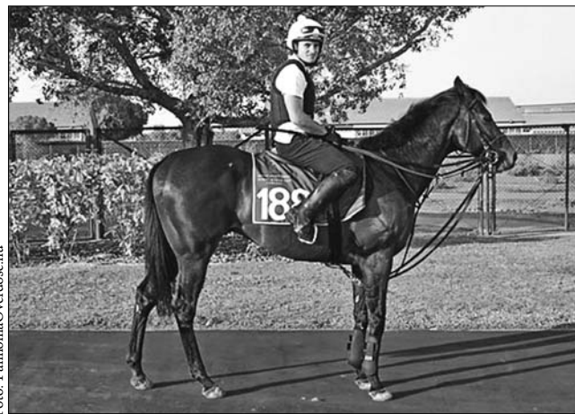
Overdose a pályára menet (Meydan Racecourse, Dubai)