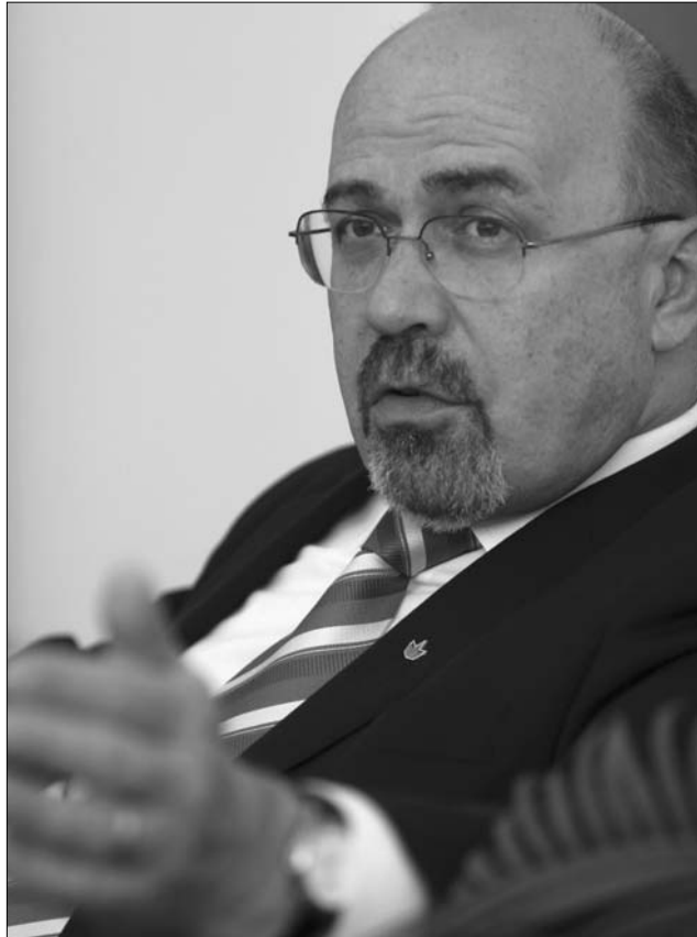
Markó Béla miniszterelnök-helyettesével Bukarestben beszélgettünk

– Valamivel többet tudok lenni a családommal, de nem eleget: a családom Marosvásárhelyen van, én pedig a hét egy részében itt vagyok, Bukarestben. Írni is többet tudok, de azt sem eleget. Igaz, két verses könyvet írtam meg ebben az évben, ami nagyon sok. Egyesek neheztelnek is, hogy Markó az egész közönség életét érintő problémákkal az irkálást-firkálást állítja szembe, de számomra a kultúra, az irodalom fontos dolog, bár készséggel elfogadom, hogy sokkal kevesebb embert érdekel.