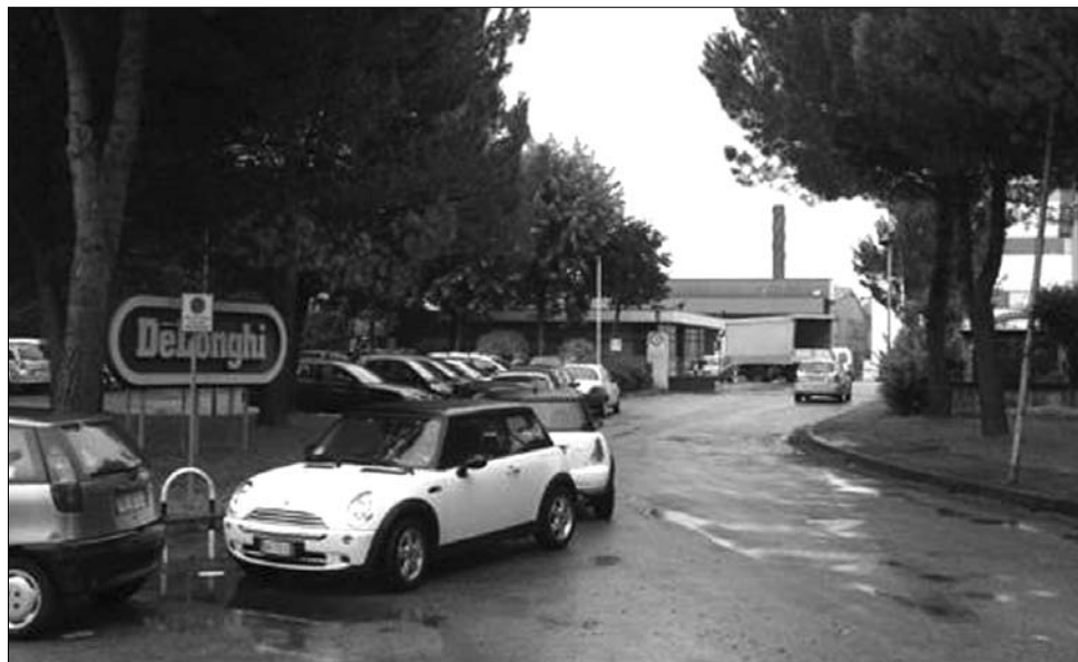
Nyugati terjeszkedés. Kína és Oroszország után Romániában erősíti európai jelenlétét a De'Longhi