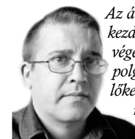
Cseke Péter Tamás

Az államfő olyan lendülettel kezdte az évet, mintha 2012 végén nem tanácsosokat, polgármestereket, képviselőket és szenátorokat, hanem államelnököket választanánk. Már január első hetében világossá tette, hogy a politikai élet főszereplője