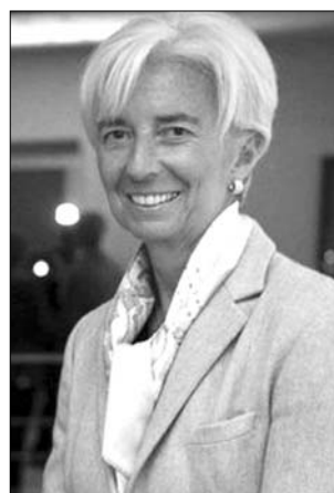
Christine Lagarde IMF-vezér