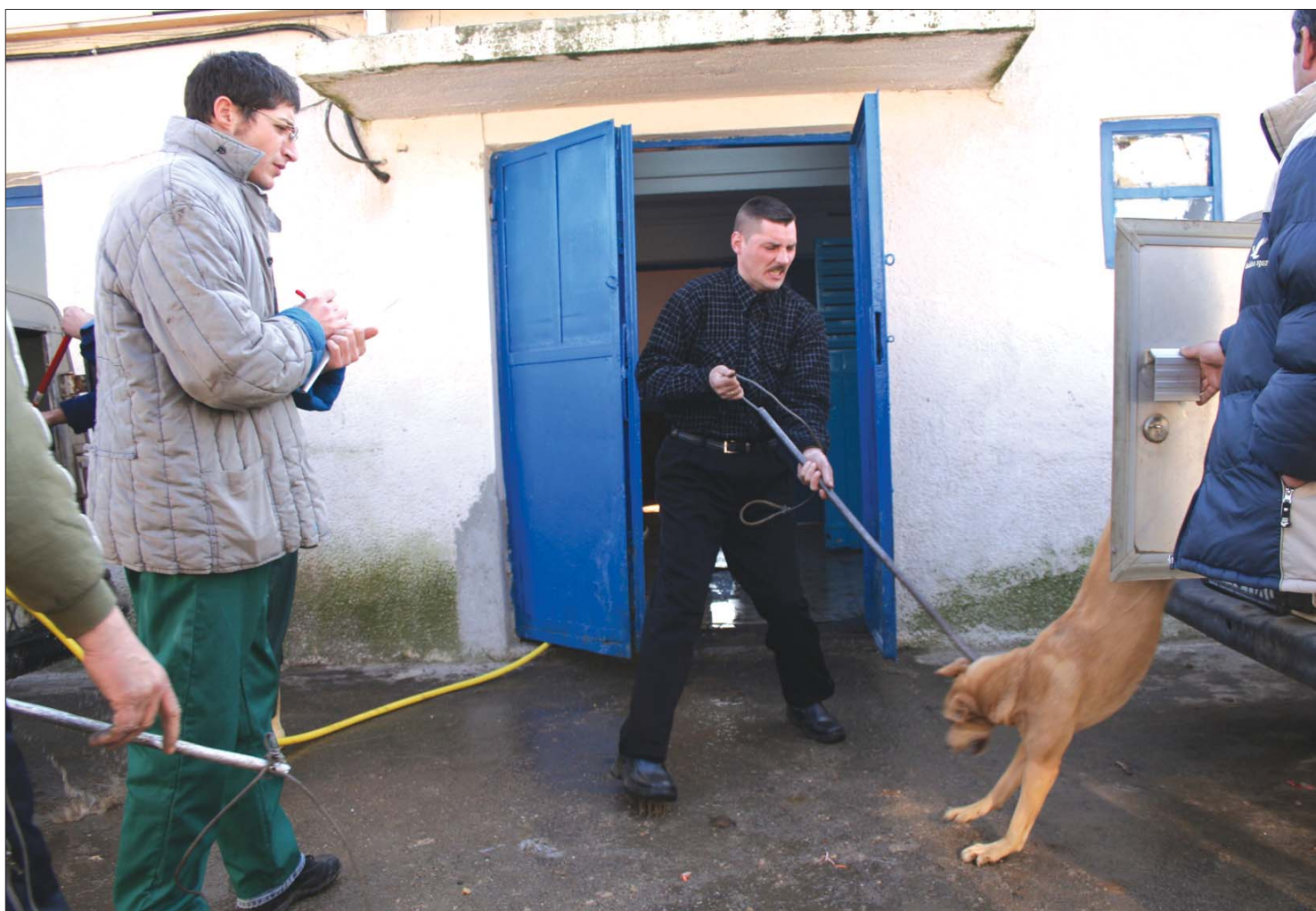
Sintérek munka közben. Az Alkotmánybíróság szerint az ebek elaltatása ellentmond az állatok jogairól szóló nemzetközi egyezménynek.

Alkotmányellenesnek nyilvánították a kóbor kutyák elaltatására vonatkozó tervezetet