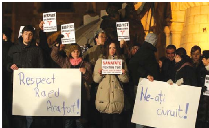
Arafat melletti szimpátiatüntetést tartottak tegnap Kolozsvár főterén

lyettes államtitkárnak tegnap az utódját is kinevezte a kormányfő, Traian Băsescu pedig sajtótájékoztatóján újra védelmébe vette a törvényt. 3. oldal ▶