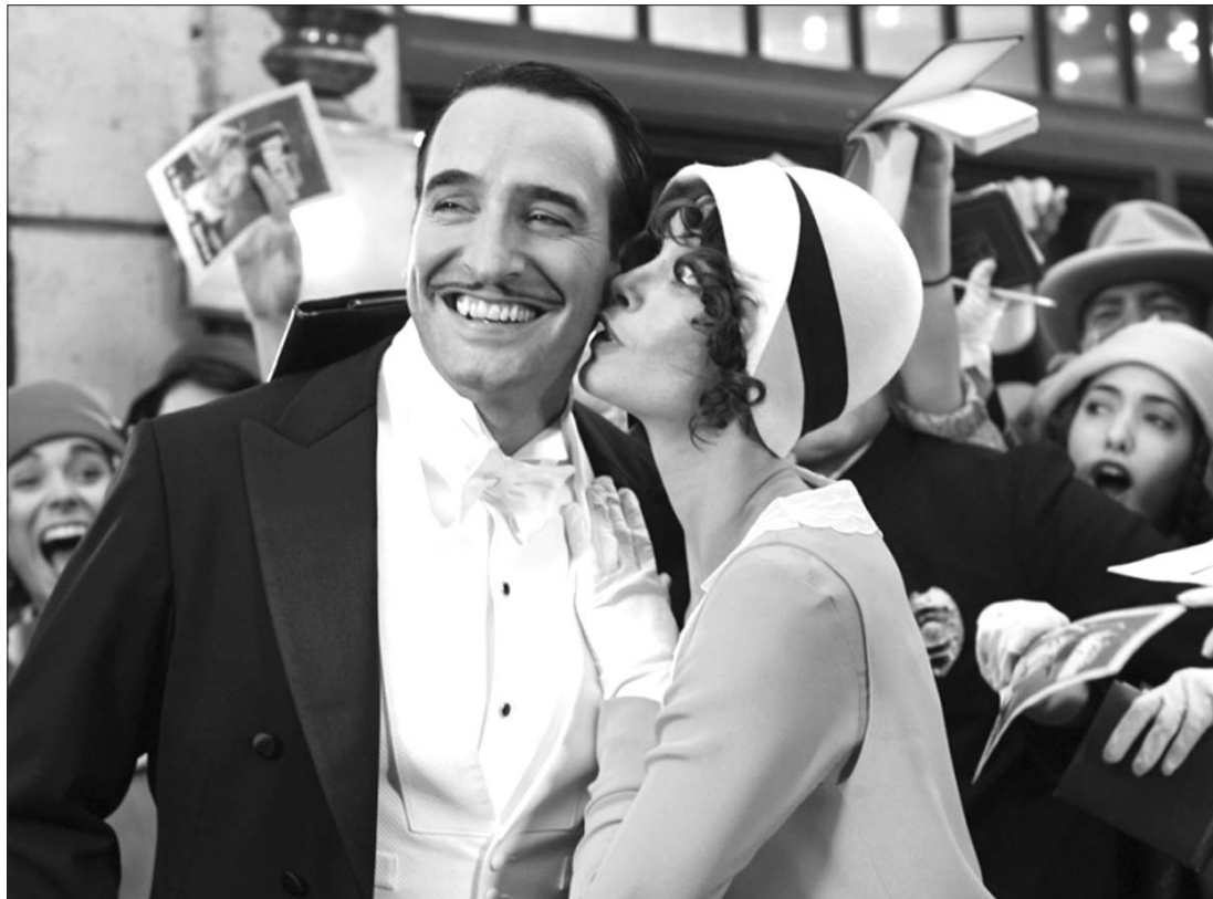
Michel Hazanavicius The artist című némafilmjét tartják a filmkritikusok az idei Arany Glóbusz legnagyobb esélyesének

A legjobb drámáért járó díjat a George Clooney főszereplésével készült Utódok című filmnek veti-