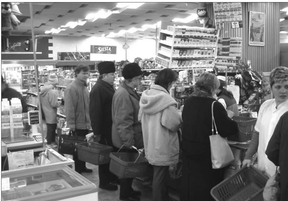
Inflációs kisokos: több kerül a kosárba vagy többre kerül a kosár?

Mint ismeretes, a kormány a megszorító intézkedések keretében tavaly júniusban öt százalékponttal, 19 százalékról 24 százalékra emelte az áruforgalmi adót (áfát) – ennek inflációs hatása azonban 2011 közepétől már nem érződik. Azóta folyamatosan csökkent az éves infláció, ami nemcsak azt tette lehetővé, hogy a Román Nemzeti Bank 2011-re megállapított célinflációs előrejelzése teljesüljön, hanem azt is, hogy az inflációs célt tovább csökkentse.