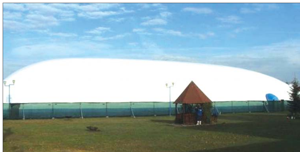
A 2800 négyzetméteres területre felhúzott, túlnyomós sátor 700 ezer lejbe került

Egyébként az uszoda a vízilabdázóknak és az úszóknak biztosított program mellett a nagyközönség előtt is nyitott, másfél órás alkalmakkal, hétfő kivételével. ◀