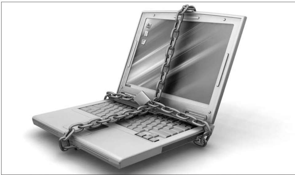
Veszélyben a világ(háló)szabadság? Január 23-án tiltakozásképpen megbénulhat az élet a világhálón

A szakértők az internet atombombájának nevezik a törvényt, ugyanis várhatóan soha nem látott mennyiségű tartalmat tüntethet el, miután minden olyan weboldalt törölnének, amelyről azt feltételezik, hogy szerzői jogot sért vagy ezt lehetővé teszi. A törvény homályos megfogalmazása miatt sokan attól tartanak, hogy olyan oldalakat