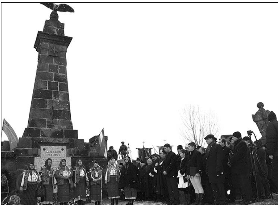
Egymásra utalva 248 év után is: csángók és székelyek a Siculicidium madéfalvi emlékművénél

megőrzését tűzte ki célul, megtorlásnak volt az áldozata” – hangsúlyozta beszédében az RMDSZ elnöke. Kelemen Hunor szerint a madéfalvi veszedelem egyben bizonyítéka is annak, hogy a térség közössége mindig képes volt újrakezdeni az építkezést mind közösségi, mind egyéni szinten. Kijelentette: hisz benne, hogy ennek a földnek a huszonegyedik századi lakói is örökölték ezeket a tulajdonságokat, így az örökségbe kapott értékeket meg tudják őrizni. „Még akkor is, amikor ma nem ágyúval lőnek ránk, hanem szavakkal, tettekkel próbálják meg elvenni a történelmünket. És azt üzenjük azoknak innen Madéfalváról, akiknek a csíkszeredai Márton Áron Főgimnázium homlokzatán lévő címer szúrja a szemét, hogy ne zavarja őket a mi történelmünk, ne zavarja őket az, ami a mi értékünk, a mi múltunk. És akkor lehet egyetértés, akkor lehet építkezés. A történelmet nem lehet eltörölni, a történelmet nem lehet meghamisítani. A történelmet nem lehet zárójelbe tenni, csak ideig-óráig, ahogy azt sokszor és sokan megpróbálták. Azt üzenjük innen, Madéfalváról, hogy a székely emberek, az erdélyi magyarok szabadságszerető emberek. Tisztelik azt, aki tiszteli őket, szeretik a szabadságot, és szeretnek a saját sorsukról dönteni. Madé-