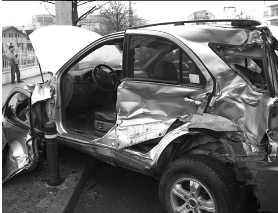
A román sztáredző feleségének Kia Sorento gépkocsija rípiyára tört a Bukarestben történt balesetben