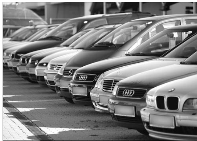
Az újabb autók tulajdonosai vélhetően jól járnak majd

Hogy országos szinten hányan lehetnek ilyen helyzetben? Ezt nehéz megbecsülni, Transindex.ro például 2,3 millióra teszi azoknak az autótulajdonosoknak a számát,