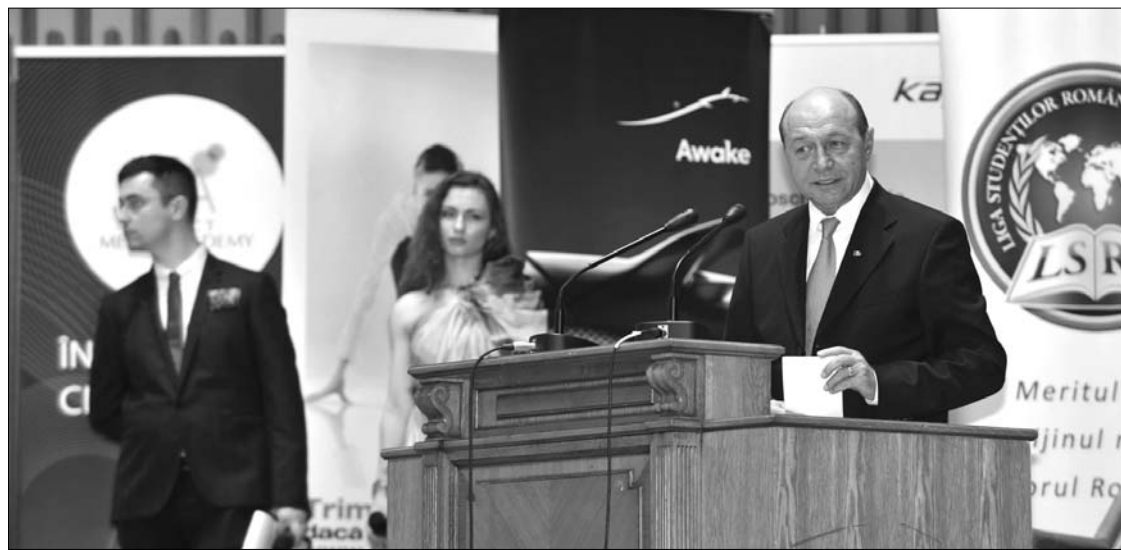
Traian Bănescu államfő szeretné novemberig dűlőre vinni az ország közigazgatási átszervezését

Ioan Oltean, a Demokrata Liberális Párt főtitkára a hétvégén elismerte, nem közeledett a koalíciós pártok álláspontja a területi-adminisztratív újjászervezés kérdésében. Ugyanakkor az államfő egy nappal korábbi felvetésére reagálva nem zárta ki, hogy idén megszavazzák az idevágó törvényt. Hozzátette: nem tart attól, hogy a megyésítés miatt alakulata hátrányba kerülne. ◀