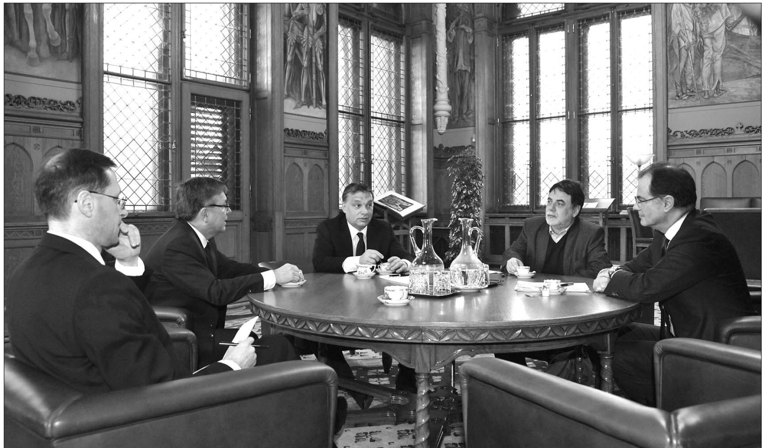
Orbán Viktor miniszterelnök közepén, Simor András a jobbszélen. Hiába áll szóba egymással a kormányfő és a jegybankelnök, a bizalom megingott

A harmadik hitelminősítő is a bóvli kategóriájába sorolta Budapestet