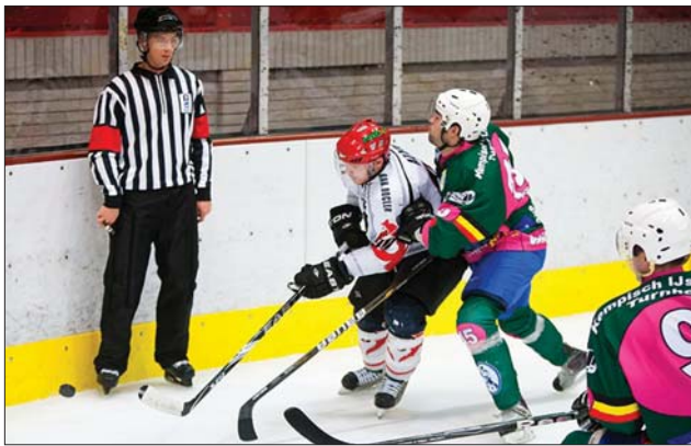
A Dab.Docler (fehérbent) győzött Székesfehérváron

A címvédő csíkiak és a dunánújvárosiak is már az elő-