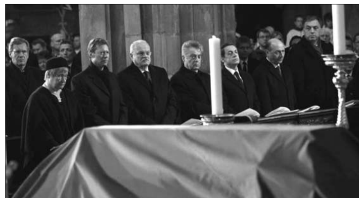
Államfők a prágai ravatalnál. A kép jobb szélén Traian Băsescu

A gyászmisét Dominik Duka, prágai érsek celebrálta. A mise elején felolvasták XVI. Benedek pápa részvétlétvirátát, amelyben