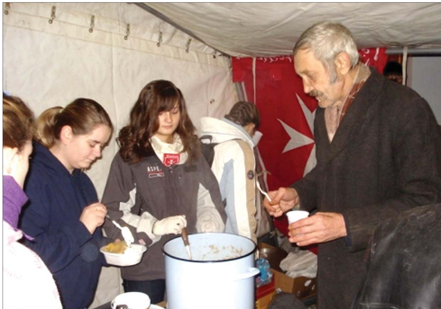
A Máltai Szeretetszolgálat sepsiszentgyörgyi önkéntesei a szemerjai plébánián osztottak idén töltött káposztát a hajléktalanoknak

Karitatív szervezetek gondoskodtak idén is az erdélyi hajléktalanok ünnepéről