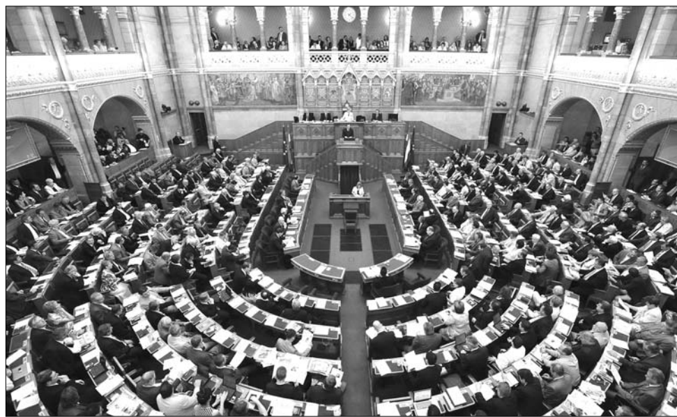
A magyar Országgyűlés díszes ülésterme. A „történelmi” Magyarországra méretezték

Közben a Duna partján fölépült az Országház, amelyet Vörösmarty Mihály már 1848-ban ezekkel a szavakkal hiányolt: „A hazának nin-