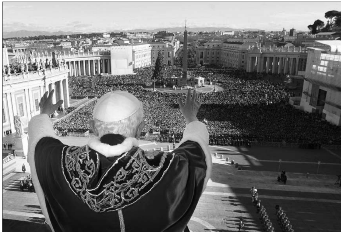
XVI. Benedek pápa karácsonyi Urbi et Orbi áldását adta Róma városára és az egész világra

Beszéde második részében a pápa azokhoz fordult, akik a világ különböző részein „rendkívül nehéz helyzetben élnek”. Elsőként az Afrika szarván élőket említette, akiknél az éhínséget a stabilitás örök hiánya súlyosbítja. A nem-