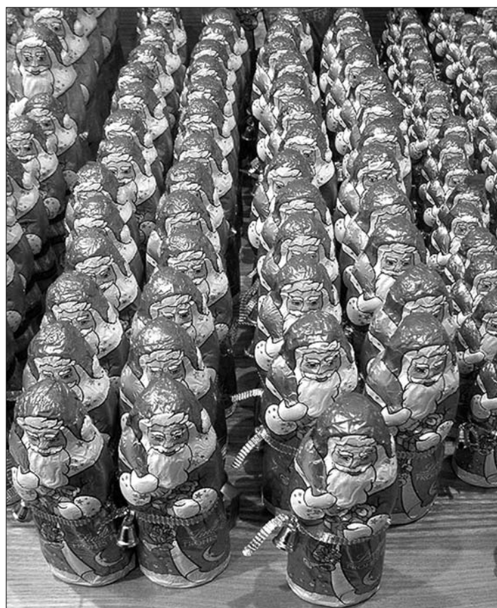
Édes küldetés. A világ csokimikulások millióit nyeli el év végén

A német édesipari szövetség adatai szerint ugyanis évi 10 kilót meghaladó csokifogyasztással a romániaiak élén járnak