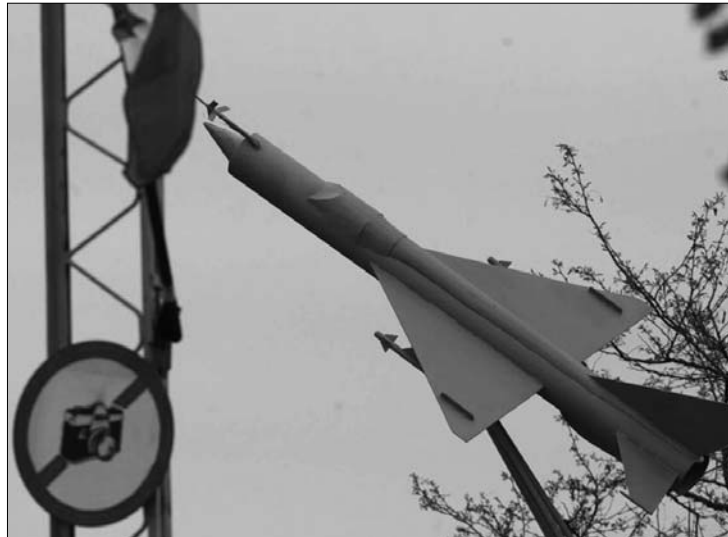
A deveselui légi bázison hamarosan amerikai támaszpont létesül

A deveselui légi támaszpont a román légierő parancsnoksága alatt működik majd. „Nem amerikai bázisról van tehát szó, hanem a román légierő támaszpontjáról, amelynek egy része befogadja a rakétaelhárító rendszert” – magyarázta Basescu. A bázisra az első lépésben kétszáz amerikai katonát vezényelnek, ez a létszám a következőkben legfeljebb ötszáz fő lesz. Az Egyesült Államok 2010 februárjában keres-