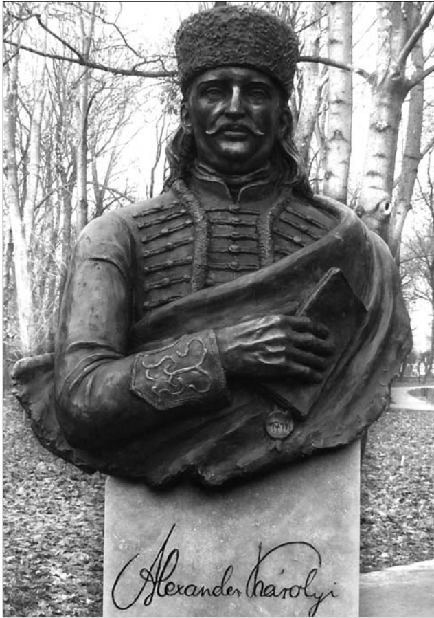
Károlyi Sándornak, a szatmári béke létrehozójának szobra

Az a tény, hogy az elmúlt években az Erdődön emelt mellett a kurucgenerálisnak ez már a második szobra Szatmár megyében, bizonyítja, hogy mennyire változott Károlyi megítélése. Korábban még Petőfi is árulónak nevezte a császári udvarral „lepaktáló” arisztokrata főtisztet a majtényi fegyverletételért. Később tisztázó-