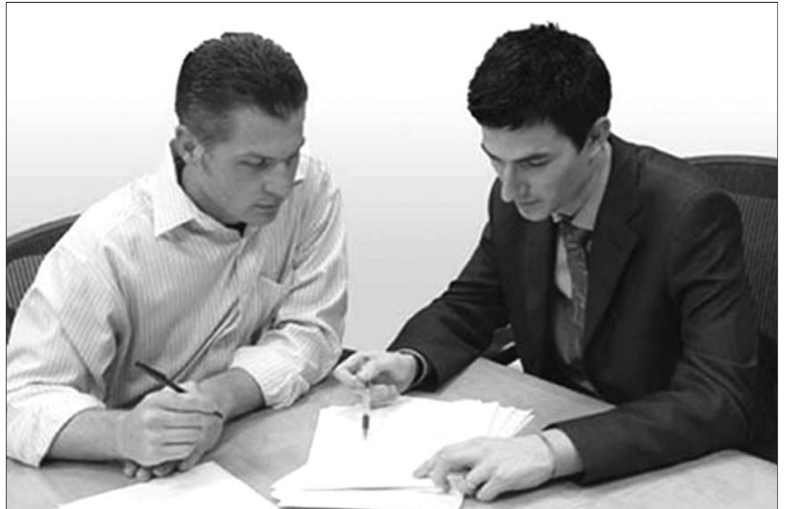
Lejben hitelesebb? Az ügyfelek a jövőben euró-kölcsöneiket lejalapúra válthatják át

Ősz elején emelkedtek ugyan a lejben felvett hiteleknek a kama-