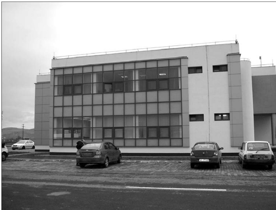
Minden egy fedél alatt. Teljes infrastruktúrával és adókedvezményekkel csalogatnak az ipari parkok