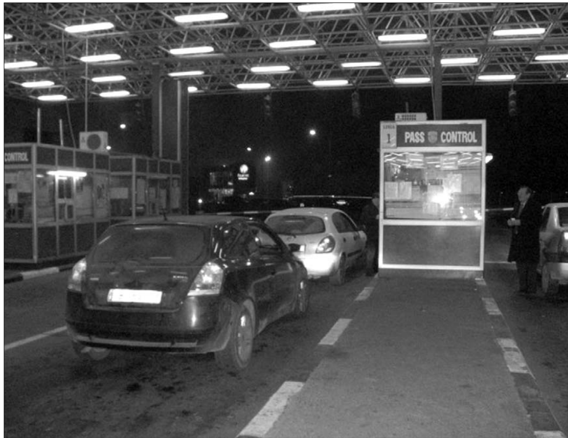
A légi és a tengeri csatlakozás után, július 31-én a határátkelőknél kellene felszámolni az ellenőrzési pontokat

mondta az EP-képviselő. Traian Băsescu egyébként a brüsszeli EU-csúcs utáni sajtótájékoztatóján már hevesen támadta a holland kormányt, amely szerinte megszegi az uniós szerződéseket. Megjegyezte: a csempészárúk és a kábítószer nem a romániai Albița határállomáson, hanem hollandiai Rotterdam kikötőn keresztül jutnak be az Európai Unió területére. „És nem Románia törvényesítette tehetetlenségéből a prostitúciót és a kábítószer-fogyasztást, hanem Hollandia” – fogalmazott az államfő. ◀