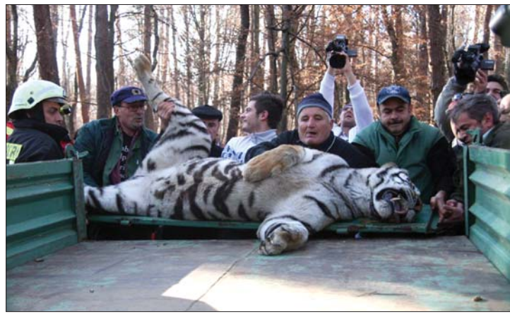
A vadállat az állatkertből szabadult ki, és egy erdőben lőtték le.

▶ Halálra rémisztette a nagy-szebenieket tegnap egy szibériai tigris, amelynek sikerült kiszabadulnia a helyi állatkert-