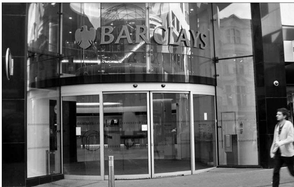
Az egyik legnagyobb londoni, citybeli befektetési bankcsoport, a Barclays Capital székháza

rint ez a kockázat leginkább Magyarországot, Horvátországot, Ukrainát és Bulgáriát érinti.