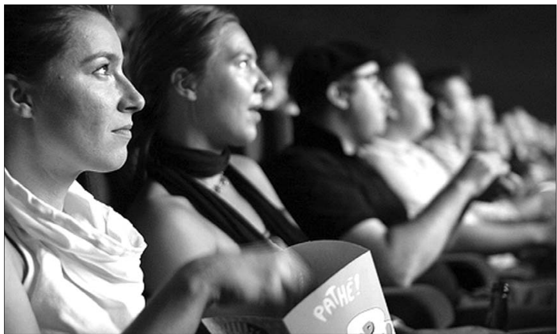
Romániában egyre nagyobb a mozifilmek iránti kereslet, míg más országokban csillapodni látszik a filméhség.