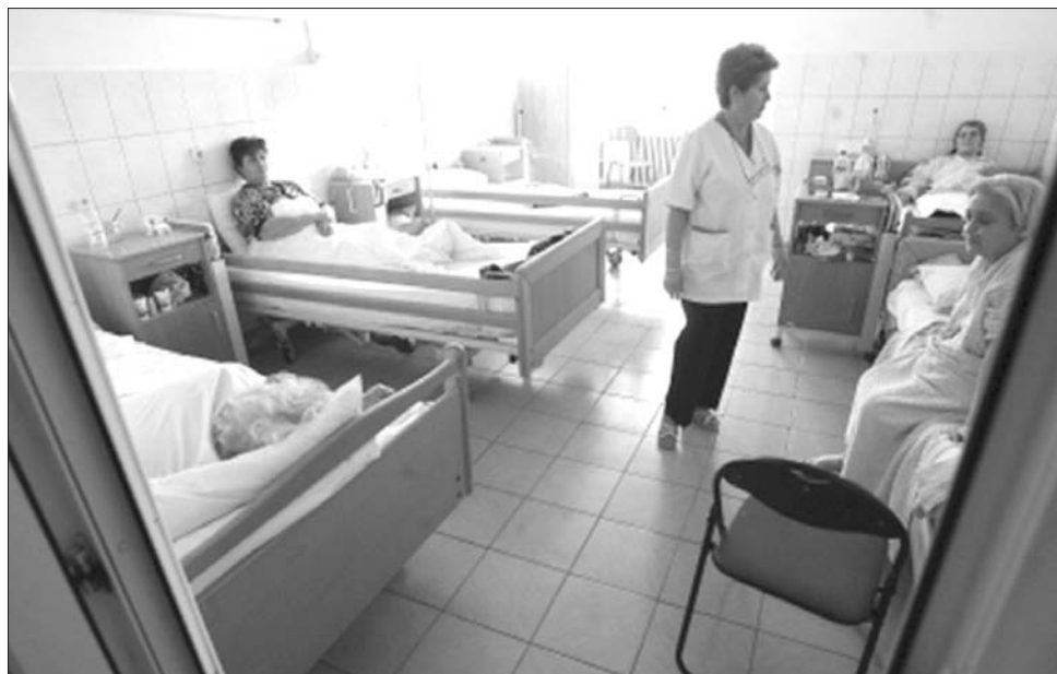
Szigorúan ellenőrzik jövőre a hazai hatóságok, hogy valósak-e a kórházi kiadások

Eredetileg „átlagolt” tarifákkal számolt az Egészségügyi Minisztérium. Vagyis egy háziorvosi vizsgálatért 5,