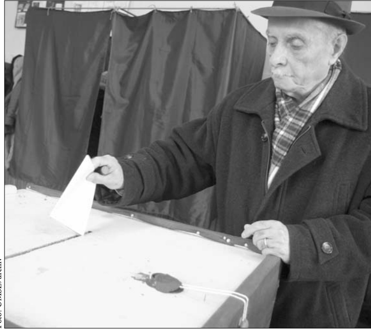
A kormány tervei szerint egy napon hat cédulára kell majd pecsétet ütni

Újságíró kérdésre válaszolva az RMDSZ elnöke elismerte: csupán a Demokrata Liberális