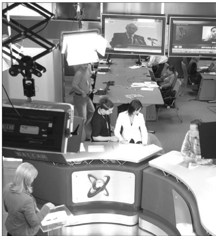
A Realitatea TV tíz év alatt nemcsak híreket adott, azok főszereplője is volt

A jelenleg a Realitatea Media sajtótröszt birtokában lévő adó évtizedes története alatt legalább annyira volt maga is a híradók szereplője, mint amennyire hírforrás. Ritka volt az olyan időszak, amikor a csatorna háza tája ne szövevényes üzletkötésektől, átláthatatlan tulajdonosváltásoktól, pénzmosások híréből, média és politika összefonódásától lett volna hangos. A „szemétbáróként” emlegetett Silviu Prigoană üzletember által 2001-ben alapított Realitatea TV történetében 2003-ig túl nagy port felkavaró események nem történtek. A tízéves évforduló alkalmával adott interjújában Prigoană a