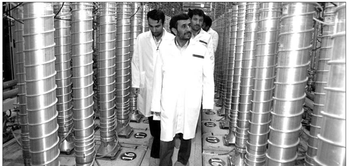
Ahmadinezad iráni elnök 2007-ben a natani atomerőműben. A NAÜ bírálta a perzsa atomprogramot

A NAÜ hiteles információk alapján azt állítja: Irán olyan kutatásokat és kísérleteket is végzett titokban, amelyeknek csak egy céljuk lehet, és ez nem más, mint atomfegyver kifejlesztése. A BBC szerint ugyanakkor a jelentés nem szól arról, hogy Irán atombombát