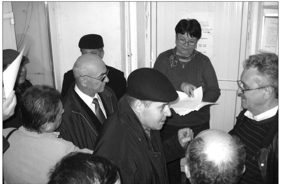
A tanárok a minisztériumba bejutottak ugyan, Daniel Funeriu irodájába azonban nem

A pedagógusok végül írásban kérvényezték a miniszteri meghallgatást – az autók motorháztetőjén írták meg a hivatalos kérést, majd az eljárásnak megfelelően iktatták a minisztérium titkárságán. „A bérfagyasztás és az oktatásügy alacsony költségvetése mellett a legszomorítóbb, hogy senki nem hajlandó párbeszédet folytatni ve-