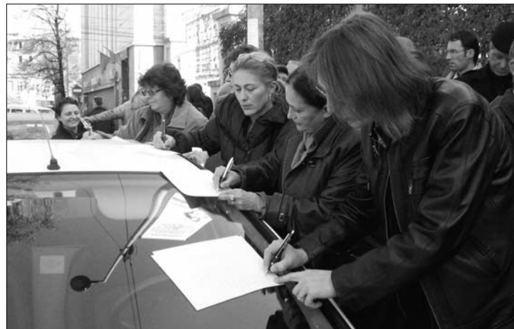
A tanárok egyenként kérvényezték személyes meghallgatásukat

▶ Spontán megmozdulást szervezett tegnap a Szabad Tanügyi Szakszervezetek Szövetsége az oktatási minisztérium épülete előtt, miután a képviselőház kedden megszavazta a közalkalmazotti béreket jövőre befagyasztó sürgősségi kormányrendeletet. A pedagógusok személyes meghallgatást követeltek Daniel Funeriu tanügyminisztertől. 7. oldal ▶