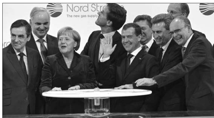
Merkel és Medvegyev mosolyog. Európa nem örül a vezetéknek

Az Északi Áramlat már a tervezés idején nagy vitákat váltott ki, mivel ezzel az Európai Unió által elgondolt Nabucco, amely függetlenítene a részes országokat az orosz gázellátástól, ismét hátrányba került. Németország mondhatja ugyanis a magáénak Európa legnagyobb gazdaságát,