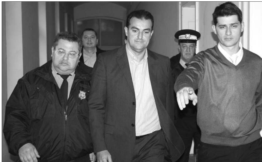
Sorin Apostu polgármestert délben a városházáról a DNA székházába kísérték a korrupcióellenes ügyészek

Sajtóinformációk szerint Sorin Apostu százezer euró csúszópénzt fogadott el két cégtől, amelyek szerződésben álltak a városházával. Más értesülések arról szóltak, hogy egy 140 millió eurós aszfaltozási szerződésből kapott kenőpénzként jutalékot. Feleségét – aki ügyvédi irodát működtet a városban – állítólag azért hallgatták ki, mert kapcsolatban áll Kolozs megye tanácsának letartóztatott alelnöke, Radu Bica ügyével. ◀