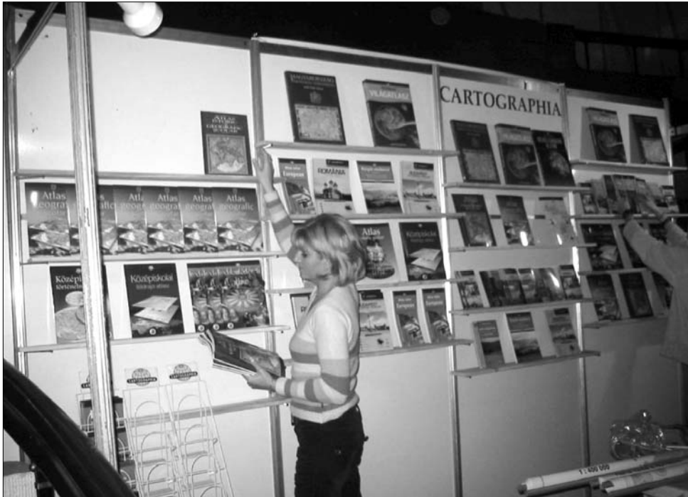
Ma rajtol a 17. marosvásárhelyi könyvvásár. A standokat már tegnap délután berendezték