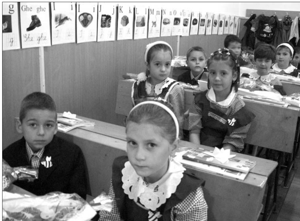
Zsúfoltak lesznek jövőre az általános iskolák, több váltásban tanulhatnak majd a legkisebbek