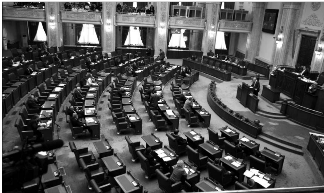
A foghíjas szenátusi padosorok miatt tulajdonképpen leállt a felsőház törvényhozói munkája