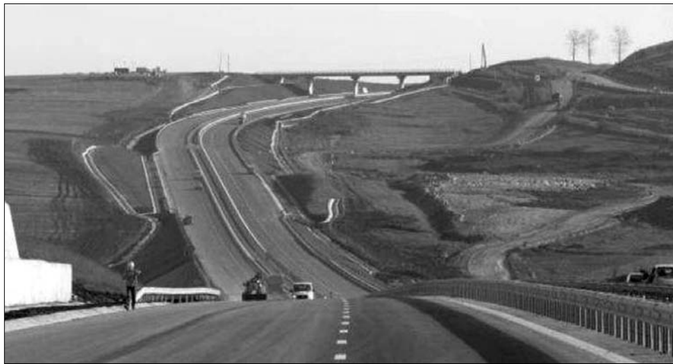
Nem túl nagy lendülettel, de dolgozik a Bechtel. A román illetékesek olcsóbb struktúrát akarnak

A bukaresti illetékesek pontos árat ugyan nem mondanak, de meggyőződésük, hogy a sztráda olcsóbb lesz,