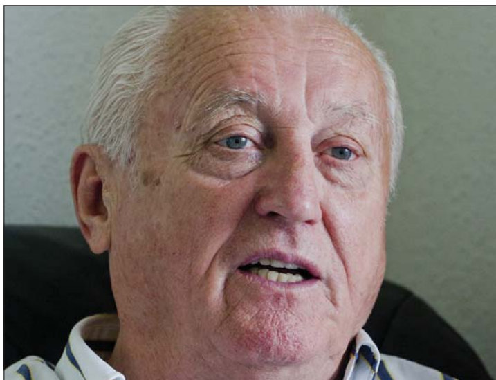
Az egykori aranylabú magyar futballistát gyászolja a sportvilág

gólt szerzett a Ferencváros színeiben, a nemzeti csapatban 31-szer volt eredményes, s 1967-ben kapta meg az Aranylabdát. A Ferencvárossal 1965-ben megnyerte az UEFA-kupa elődöntjét, a Vásárvárosok Kupáját. Az 1960-ban olimpiai, 1964-ben Európa-bajnoki bronzérmes Albert Flórián 2004 óta volt a Nemzet Sportolója, szeptemberben még barátai társaságában ünnepelte hetvenedik születésnapját, s átvehette a Magyar Köztársasági Érdemrend középkeresztjét. ◀