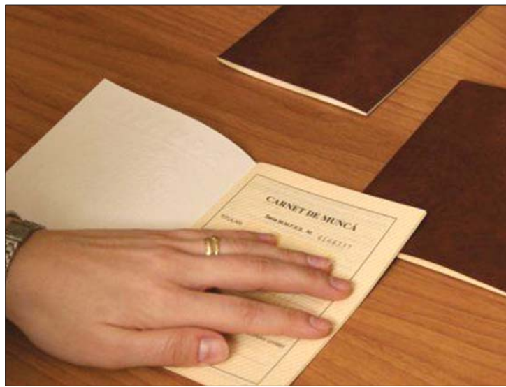
A hagyományos munkakönyvet annak digitális megfelelője váltja fel

Habár ma lejárt a digitalizált munkakönyvek, az úgynevezett Revisal frissített változatának leadási határideje, az országban nem mindenhol történt meg zökkenőmentesen az átállítás. A munkaügyi felügyelőségek minden embertől telhetőt megtettek, és az elmúlt napokban hosszabbított programmal várták a hivatalokban az utolsó percben intézkedők ostromát, a számítógépes rendszer ugyanakkor több ízben működésképtelenné vált a megnövekedett igénybevételtől. A könyvelési szakemberek viszonyulása a digitalizáláshoz különböző, ám többnyire örülnek a sorban állás megszűnésének. Legtöbbször azt kifogásolják, hogy nem lehet