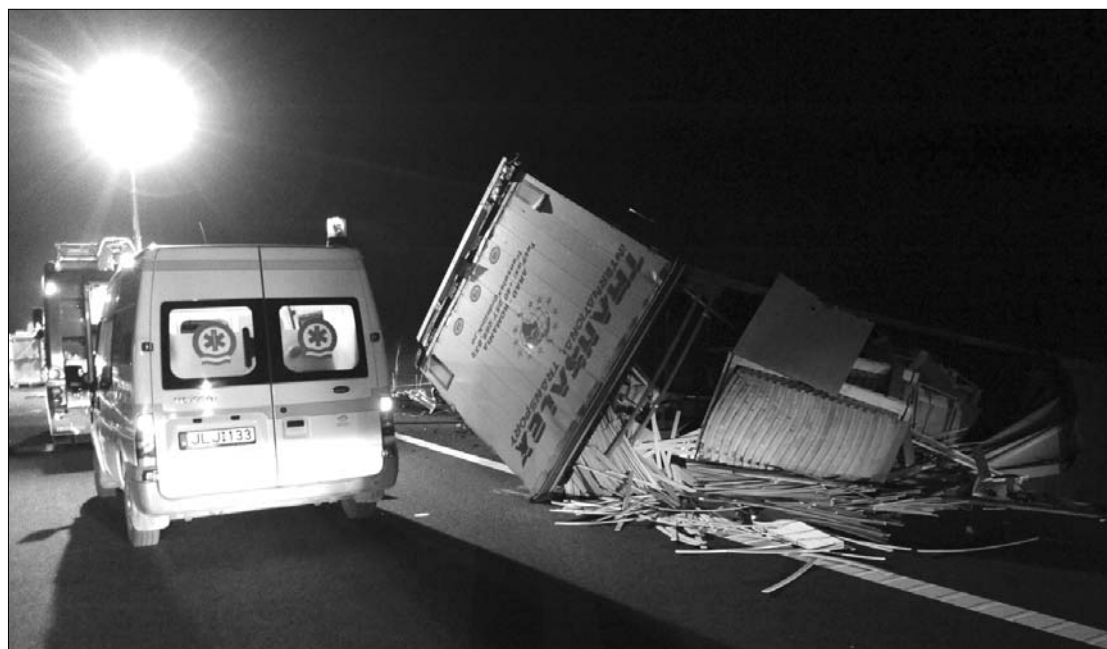
A mentők egy utast és a később őrizetbe vett kamionsofőrt szállították kórházba. A buszt kilenc utasra hitelesítették

A kisbuszban utazók közül tizennégyen – köztük három 7 és 14 év közötti gyermek, valamint négy nő – meghaltak; az áldozatok olyan súlyos sérüléseket szenvedtek, hogy esélyük sem volt a túlélésre. Egy utas túlélte a balesetet, de ő is életveszélyes sérüléseket szenvedett, lapzártánkról az állapota kritikus volt. A magyar rendőrség megerősítette azokat a romániai sajtóhíreket, hogy a műszaki engedély alapján kilen-