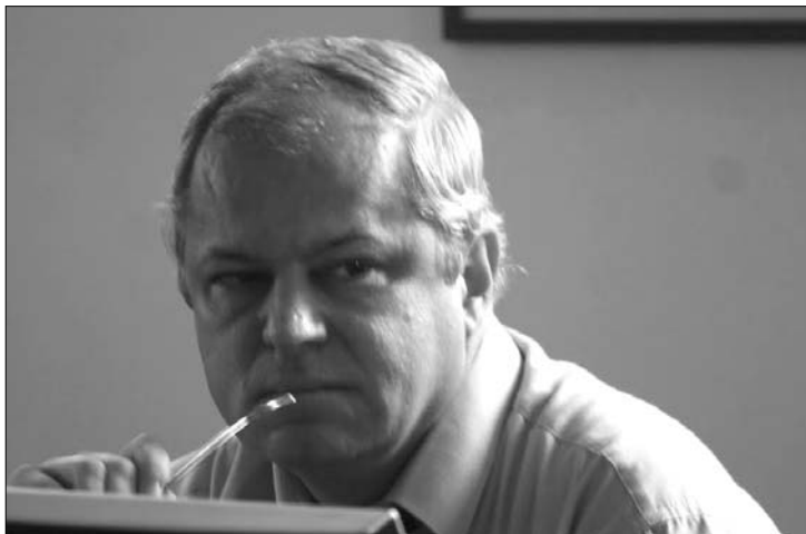
Răsvan Popescu CNA-elnök nem mond le Elena Udrea „parancsára”

► „Nem fogok lemondani Elena Udrea felszólítására” – jelentette ki a Jurnalul Național -nak adott nyilatkozatában Răsvan Popescu. Az Országos Audiovizuális Tanács (CNA) elnöke a központi napilapnak hangsúlyozta: az, ami most a Realitatea TV körül történik, csak egy átmeneti állapot, amit az váltott ki, hogy két médiabefektető úgy döntött, elválnak útjaik. „Az audiovizuális tanács nem foglalkozhat váloperekkel” – fogalmazott. Elena Udrea turisztikai és fejlesztési miniszter múlt hét végén követelte Răsvan Popescu lemondását a B1 TV műsorában, azt róva fel a CNA-elnöknek, ő a felelős a „sajtó lesüllyedéséért” minthogy nem tisztítja meg a Realitatea TV -t, annak ellenére, hogy köztudott, Elan Schwartzberg mögött Sorin Ovidiu Vântu áll. „Meglátásom szerint a CNA elnökének be kellene nyújtania lemondását, hisz a sajtó lealacsonyításáért egyértelműen ő a felelős, az ő ve-