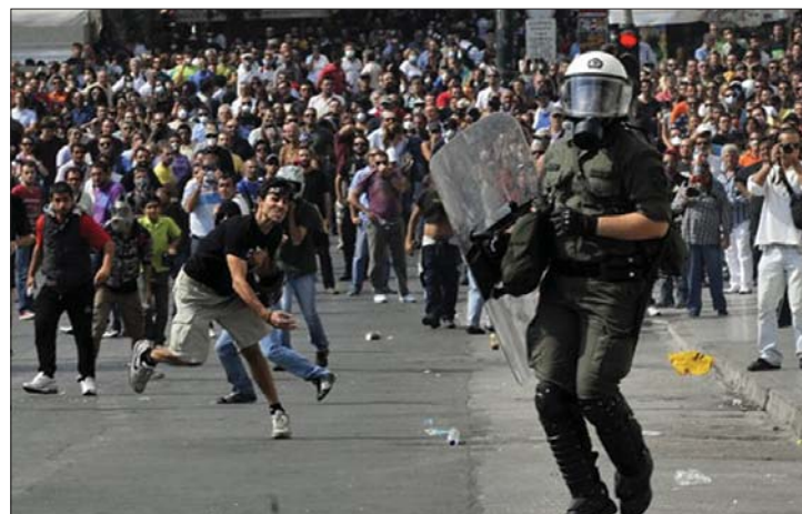
Utcai harcok Athénban. Ismét egy teljes napra lebénult Görögország

lános sztrájk kezdődött tiltakozásul a költségvetési megszorítások újabb hulláma ellen. A görögök szerint a kormánynak nincs terve a válságból való kiútra. 2. oldal