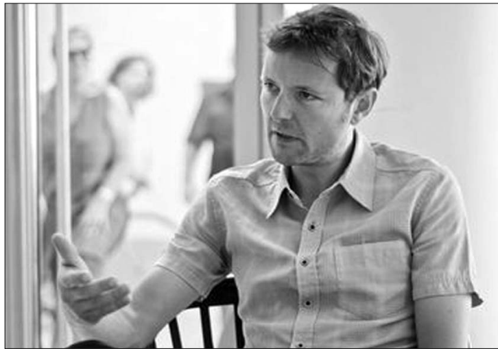
Marc Gruber szerint a magyar médiatörvény a „rossz eljárások gyűjteménye”

► A média sokszínűségének érvényesülése miatt fejezték ki aggodalmukat az Európai Újságíró Szövetség (EFJ) rádiós és televíziós szakértői csoportjának tagjai keddi, budapesti sajtótájékoztatójukon. A résztvevők szerint nem szabad, hogy a magyar médiatörvény például szolgáljon más európai országok számára. A csoport kétnapos magyarországi tanácskozásán a magyar médiában zajló folyamatokról tájékozódott. Az MTI beszámolója szerint olaszországi képviselőjük, Roberto Natalie elmondta: Európa szinte egyetlen országában sem érvényesülnek maradéktalanul a demokratikus értékek a médiában, de úgy vélte: Magyarország rossz példát mutat, amelyet más országoknak nem szabad követniük. Marc Gruber, az EFJ társigazgatója a „rossz eljárások gyűjteményének” nevezte a magyar médiatörvényt. Hangsúlyozta: nem az a lényeg, hogy egyenként nézve más európai országok