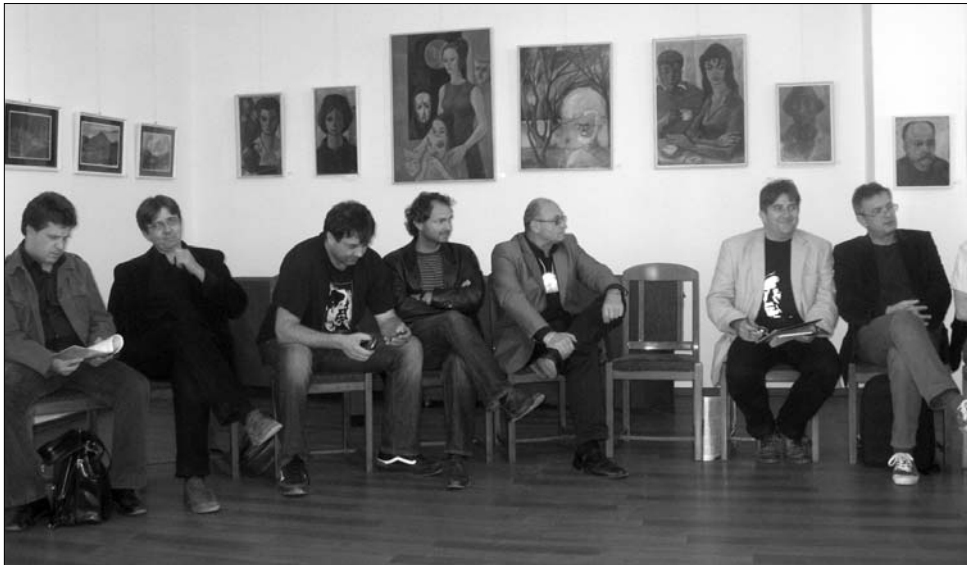
Erdélyi magyar szakmai színházi szövetséget alapítanak a magyar színházigazgatók

Amint az a sajtó számára is nyilvánossá tett átiratban szerepel, céljuk egy olyan erdélyi magyar szakmai színházi szövetség alapítása,