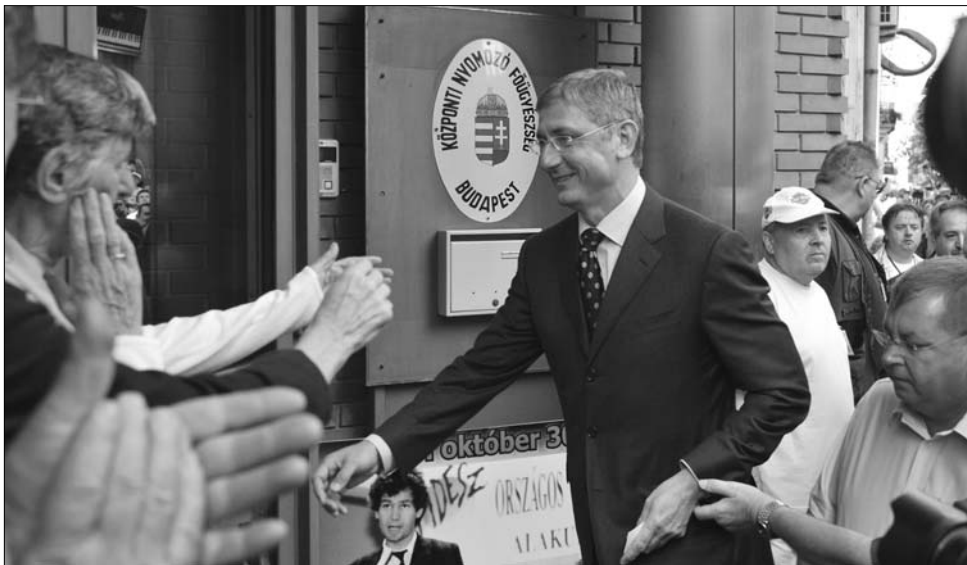
Híveivel érkezik Gyurcsány az ügyészségre. Vallomást nem tett, hanem gyanúsítóit vádolta

Gyurcsány Ferenc kihallgatását – az ő kérésére – négy kamera rögzítette, a volt kormányfő először egy rövid nyilatkozatot tett közé belőle az általa létrehozott www.sukoroper.hu internetes oldalon, de már ekkor közölte, hogy szakértőivel és tanácsadóival azt vizsgálják, miként van mód a teljes – 38 perces – felvétel nyilvánosságra hozatalára. Alig huszonnégy órán belül ez is megtörtént. „Hadd mond-