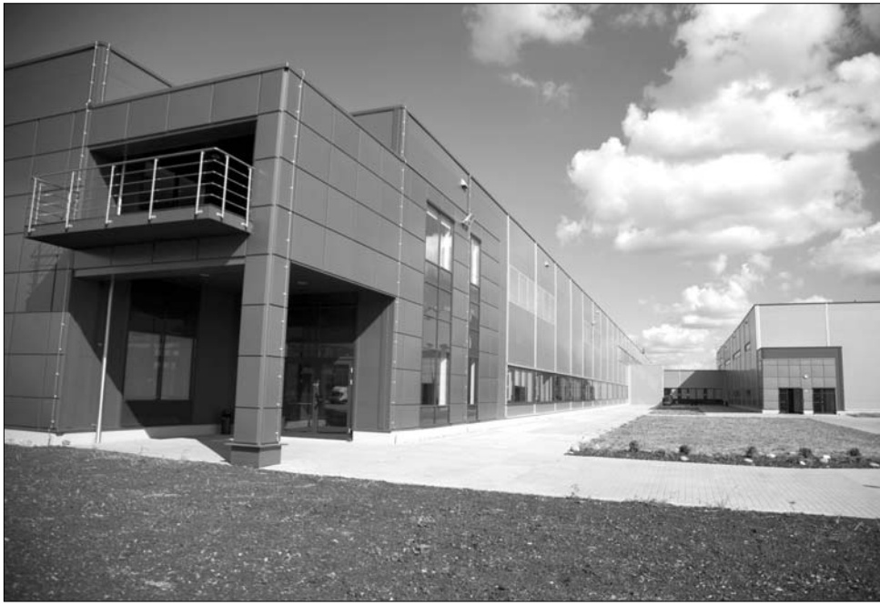
A mai egyeztetések során sok minden eldőlt a nemeszukai Nokia-gyár dolgozóinak sorsáról

„Nem kis összeget fektetünk be a szóban forgó ipari park közművesítésébe, valamint az infrastruktúra megvalósításába. Nem titkolt célunk volt akkor is, akárcsak ma, hogy különböző cégeket vonzzunk a megyébe. Ezen folyamatosan dolgozunk, már több cég érdeklődést mutatott a megüresedő ipari park iránt” – tájékozta-