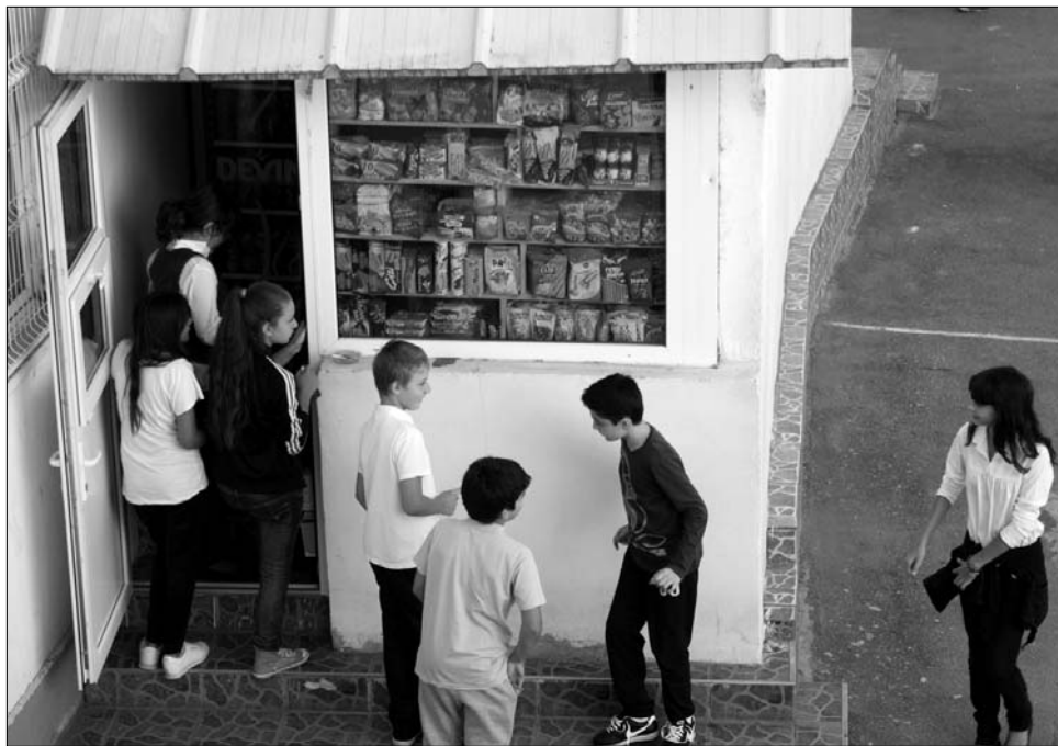
Jobb mint az uzsonna: könnyű becsokizni az iskolai büfé kalóriában is gazdag kínálatában.

Andrássy Árpád, a 2-es számú iskola tanára ellenben azt állítja, nagyon szigorúan ellenőrzik és büntetik is a büfét. Ezt viszont a gyerekek úgy próbálják kijátszani, hogy máshonnan veszik meg a tiltott nassolnivalót. A 7-es számú iskola tanuló példaként a szomszédos napi piacon működő gyorsbüfékben vásárolják meg a