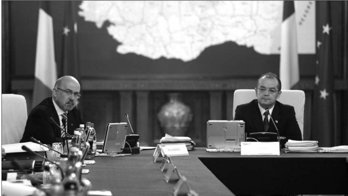
Markó Béla és Emil Boc egyetértenek abban, hogy a kormány átalakítása egyelőre nem időszerű

előző napi hivatalos közleményt, leszögezve, hogy nem tárgyalta erről az államfővel. A miniszterelnök kitérő választ adott arra a kérdésre, elégedett-e minisztereivel, mondván, ezt megválaszolta azzal, hogy nem kezdeményezte a kormányátalakítást. ◀