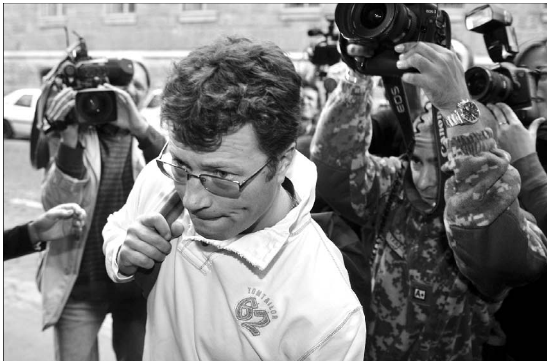
Stohl András megkezdte tíz hónapos börtönbüntetését. Jó magaviselet esetén öt hónap múlva szabadulhat

► Megkezdte tíz hónapos börtönbüntetését Stohl András szerda reggel. A színésznek a Nagy Ignác utcai büntetés-végrehajtási intézetben kellett jelentkeznie. Az MTI információi szerint a színészt később átszállítják arra a helyre, ahol büntetését tölti majd; sajtóhírek szerint ez a tököli börtön lesz. A színész legkorábban – jó magaviselet esetén – öt hónap múlva szabadulhat. Stohl András szeptember elején ítélte jogerősen tíz hónap letöltendő börtönbüntetésre a Pest Megyei Bíróság ittas vezetés miatt. A színész 2010. május 8-án hajnalban a Budapestről Fót felé vezető úton gépkocsijával áttért a szemközti sávba, és ott összeütközött két szabályosan közlekedő autóval. A balesetben négyen sérültek meg, egyikük súlyosan. A baleset után a színész elhagyta a helyszínt, ezért a rendőrök, még aznap, otthonából előállították. Stohl András véreben később alkoholt, vizeletében tiltott pszichotróp anyagot is kimutattak. Mint kiderült: nemcsak alkoholt, hanem kokaint is fogyasztotta balesete előtt. A bírónő azzal indokolta a börtönbüntetést, hogy Stohl nem először követett el hasonló bűncselekményt, és azt is mondta, nem bi-