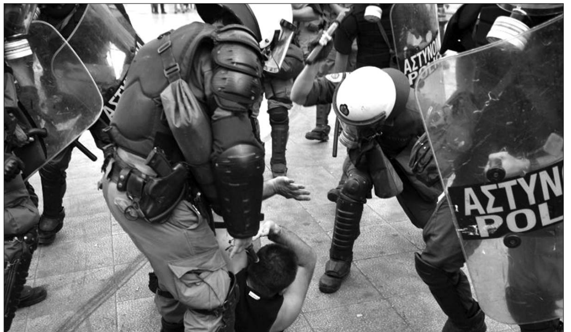
Csuklyás fiatalok utcakövekkel dobálták a rendőröket. Az egyenruhások sem kímélték a tiltakozókat

A tüntetések idejére az iskolák és a közintézmények bezártak,