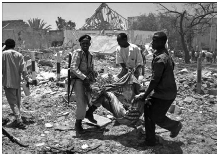
Öngyilkos merénylet Mogadishuban. Akadályozzák a segélyosztást

tették el a detonációban. Számos gépkocsi kiégett. A robbanás után több száz méteres körzetben szóródott szét a törmelék. A merénylet elkövetőjeként az al-Shabaab iszlamista milícia jelentkezett. Az al-Kaida nemzetközi terrorhálózattal szövetséges csoport fegyveresei augusztus elején kivonultak Mogadishuból, de továbbra is jelentős területeket tartanak az ellenőrzésük alatt Szomália középső és déli részén. Céljuk, hogy megdöntsék az ENSZ által támogatott átmeneti kormányt. Az iszlamisták szerint a kabinet a nyugati országok bábja. Az általuk kirobbantott polgárháború megnehezíti az éhezők megsegítésére küldött nemzetközi adományok célbajuttatását. ◀