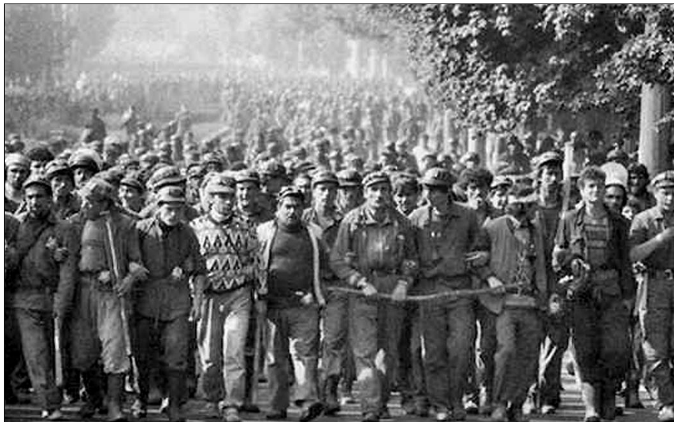
1991. szeptember 26: tömör sorokban vonul Bukarest utcáin a „rendteremtő munkásosztály”

Petre Roman lemondásának körülményei még ma sem tisztázottak. Nem bizonyítható, de valószínűsíthető, hogy nem a bányászok akciójában áldozata volt. Petre Roman gazdasági reformjai befolyásos politikai köröket zavartak Bukarestben, a kormány tevékenységével a szenátus elnöke, Alexandru Bărlădeanu, de a frissen megalakult Román Hírszerző Szolgálat igazgatója, Virgil Măgureanu is elégedetlen volt, a kormányfő ellentétbe került korábbi pártfogójával, Ion Iliescuval is. Feltehetően tehát az ő kezük volt benne a kormány megbuktatásában. ◀