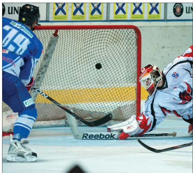
Veszélyben van az Acélbikák (fehérben) vezető pozíciója

Tegnap este Dab.Docler-Miskolci JJSE-mérkőzést rendeztek, ma Brassói Corona Fenestela-Buk. Steaua Rangers és Újpesti TE-Ferencvárosi TC-találkozók vannak műsoron. ◀