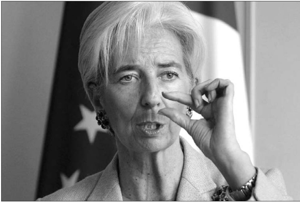
Christine Lagarde: az IMF forrásai eltörpülhetnek a hitelgények mellett

A The Sunday Times nak nyilatkozó illetékesek szerint a körvonalazódó terv három fő eleme a portfólióikban görög államadósságot tartó – és így görög törlesztési leállás esetén sebezhetővé váló – euróövezeti bankok feltökési-