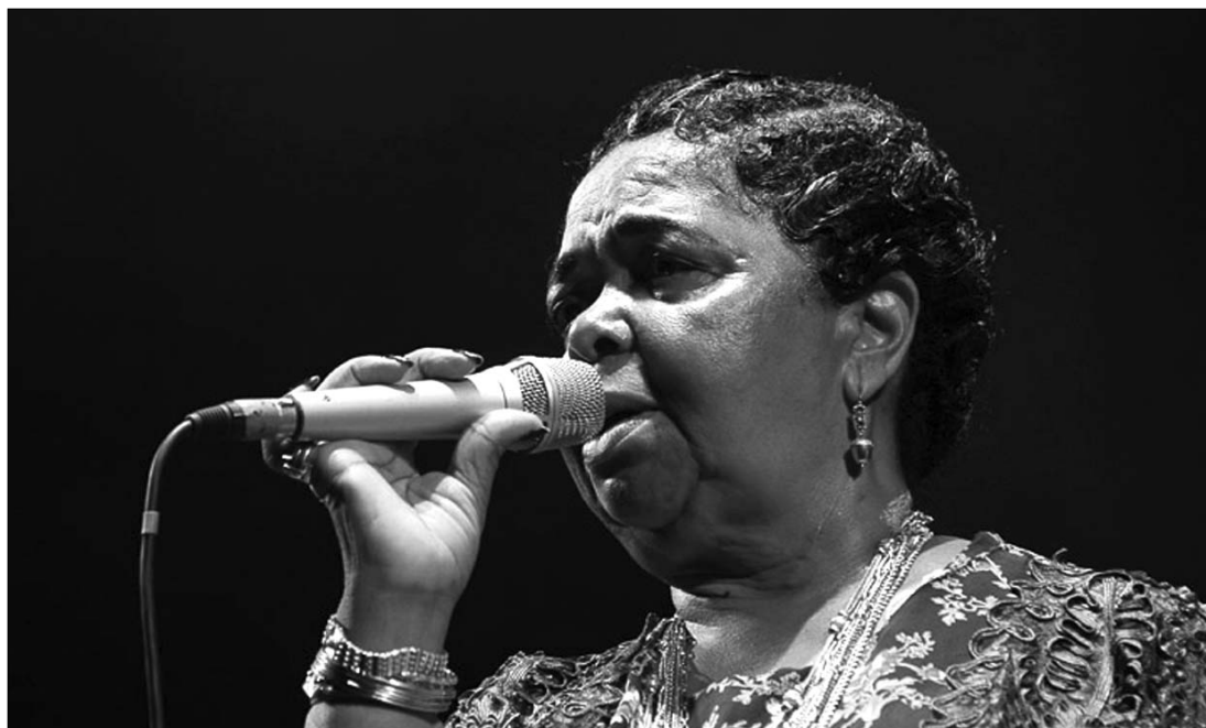
Cesaria Evora, a szomorkás-sanzonos hangulatú morna stílus legismertebb előadója végleg kivonult a zenei életből

több válogatás- és koncertlemeze, valamint egy remixelbuma jelent meg. 2008-ban infarktust kapott egy melbourne-i koncert után. Párizsban gyógyult, de még kedvezőtlen egészségi állapota mellett is felvette új lemezét, amely a Nha Sentimento címet kapta. ◀