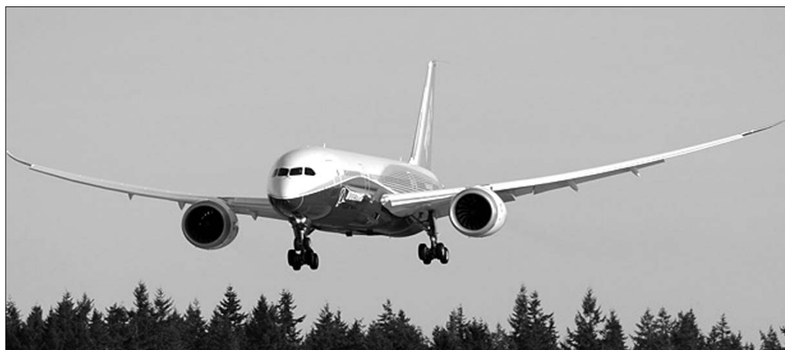
Leszálláshoz készülődik a Boeing 787-es. Végleg megérkezett a légiforgalomba

A kétfolyosós, széles törzsű gépet az iparág eddigi legnagyobb ablakaival szerelték fel, magasabb lesz az utastér páratartalma, ezáltal tisztább a fedélzet levegője is. Iparági elemzők szerint a 787-es technológiai áttörést jelent a repülőgépgyártásban. A késés ellenére a Boeing valaha volt legsikeresebb repülőgép-bevezetésének számít a Dreamliner. A cég 56 ügyfelétől összesen 821 megrendelést kapott a repülőgépre. A gépek az Airbus A350-eseivel állnak versenyben, amelyek 2013-ban állnak majd forgalomba. Annak a gépnek a törzse és szárnyának nagy része is főként kompozitanyagokból készül majd.