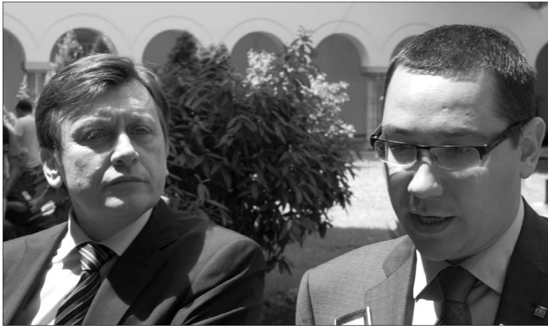
Crin Antonescu és Victor Ponta közös frontot alkottak a Konzervatív Párt „zsarolásával” szemben

Az ellenzéki pártszövetség vezetői utólag megpróbálták szónyeg alá seprni a nézeteltérést. Daniel Constantin PC-elnök az azal indokolta küldöttségük gyors