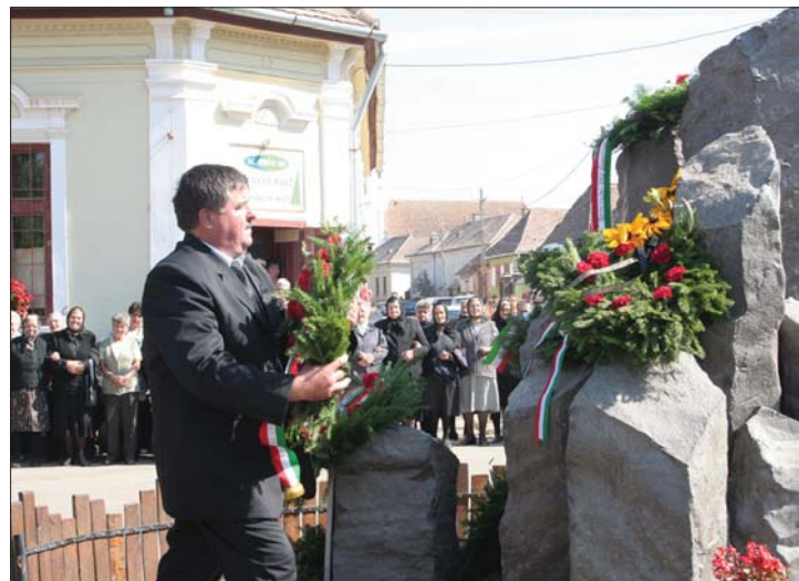
A megemlékezésen megkoszorúzták a szárazajtai emlékművet

egyesület átvette a Magyar Művészetért díj kuratóriuma által Szárزازajtának ítelt Ex Libris díjat. 8. oldal ▶