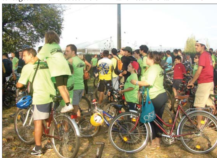
A biztonságosabb közlekedésért bicikliztek Vásárhelyen is

► A környezetvédelem jegyében telt el a hétvége országsszerte: a kerékpárosok a tisztább és biztonságosabb közlekedésért bicikliztek a Critical Mass rendezvényein, a természetvédők pedig a Let's do it Romania akciósorozathoz csatlakoztak. 7. oldal ►