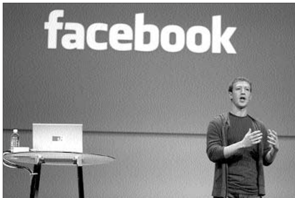
Mark Zuckerberg a Facebook digitális naplójával duplázná meg a megosztott információk mennyiségét

A szeptember 30-án bevezetendő Timeline a jelenlegi profiloldalak továbbfejlesztésén alapul, ám a már megszokott kép- és videomegosztás helyett lehetővé teszi különböző élethelyzetek megosztását is – a leírásokat pedig lokalizációs és életrajzi adatok teszik kerekkebbé. Az egyfajta digitális naplóként is elképzelhető új profil lényegében életutunk lekövetésére épít: segítségével megoszthatók a szerelemmel, új családtag születésével kapcsolatos történetek, de az is, éppen merre kocogunk a parkban. A fontos pillanatok ráadásul rendezhetővé, szerkeszthetővé, kapcsolhatóvá válnak. (Ha a szülők gyermekük szüle-