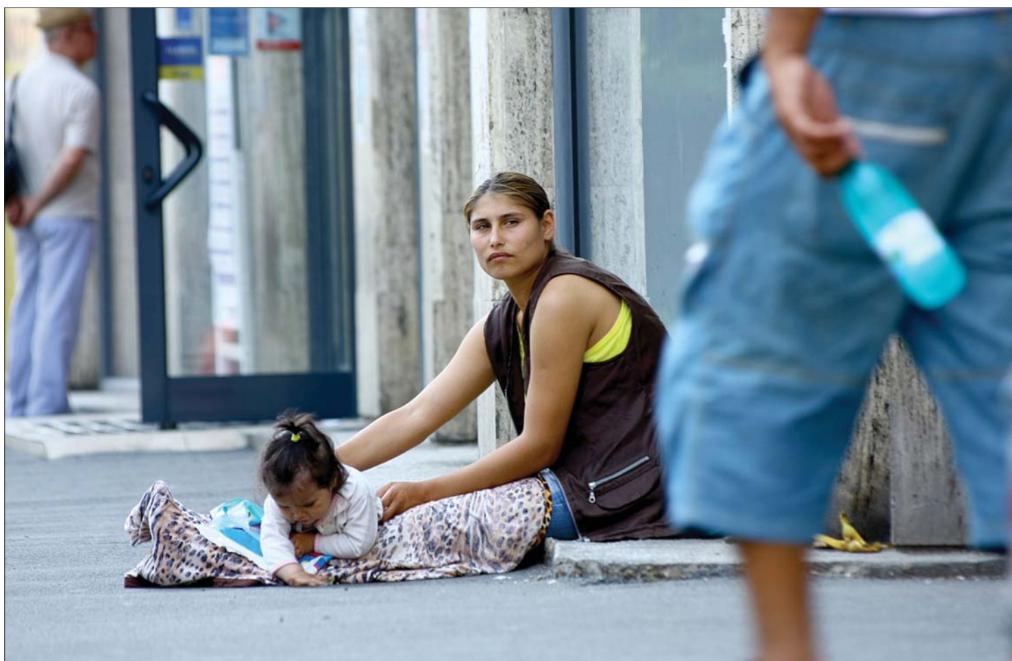
A törvényjavaslat szerint 500 lejes bírságot kaphat az a személy, aki kéreget, és börtönbe kerülhet a gyermekét koldulásra kényszerítő szülő

Törvényben tiltaná meg a kéregetést a hazai romák parlamenti képviselője