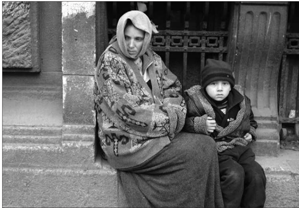
Akár börtönnel is büntethetik azt a személyt, aki gyermekét koldulásra kényszeríti

„Egyetérték azzal, hogy be kell tiltani a koldulást, azzal azonban nem, hogy a kor-