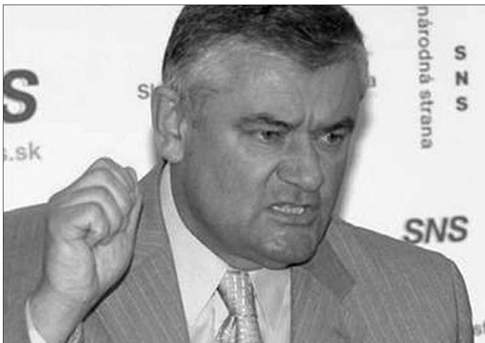
Ján Slota, a Szlovák Nemzeti Párt elnöke. Öklöbe szorul a keze, ha a magyarokról hall

Néhány nappal korábban Ján Slota arra szólította fel a szlovák pártokat, hogy szaksítsák meg kapcsolataikat a szlovákiai magyar pártokkal. A szélsőségesen nacionalista politikus szerint ugyanis „a Magyar Koalíció Pártjának (MKP) és a Hídnak a képviselői a magyar kormány és