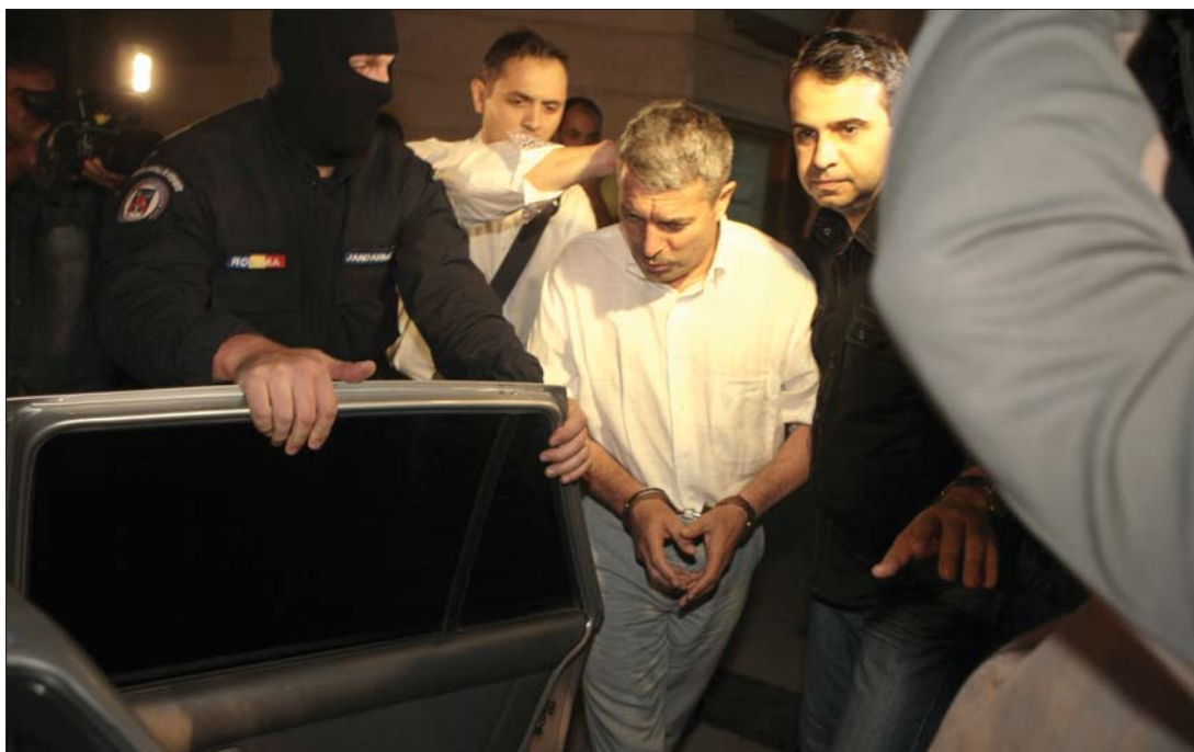
Bilincsben a „főbíró”. Vasile Avramot kenőpénz elfogadásával gyanúsítják a korrupcióellenes ügyészek.

Ha a vádak beigazolódnak, Vasile Avram akár háromtól 15 évig terjedő börtönbüntetést is kaphat, míg Țerbea hat hónaptól öt évig terjedő elzárással sújtható. ◀