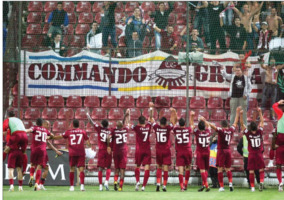
A Vaslui elleni győzelmükkel a kolozsvári vasutasok a táblázat második helyére léptek

veni (21:30 óra, DigiSport 1), szombat: Kolozsvári U–Ceahlăul Piatra Neamţ (19 óra, DigiSport 1), Buk., Rapid–Kolozsvári CFR 1907 (21:30 óra, DigiSport 1); vasárnap: Buk. Sportul Studenţesc–Buk. Steaua (17 óra, DigiSport 1), FC Vaslui–Szebeni Voinea (19 óra, DigiSport 1), Petrolul Ploieşti–Buk. Dinamo (21:30 óra, DigiSport 1); hétfő: Pandurii Tg. Jiu–Astra Ploieşti (19 óra, Dolce Sport és TVR 1), Medgyesi Gaz Metan–Marosvásárhelyi MFC (21:30 óra, DigiSport 1). ◀