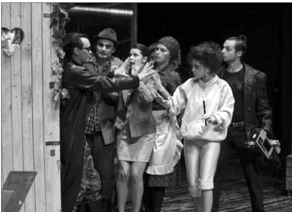
A csíkiak a tavalyi évadban sikerrel játszott Fintóval emlékeztek Az ember tragédiája ősbemutatójára