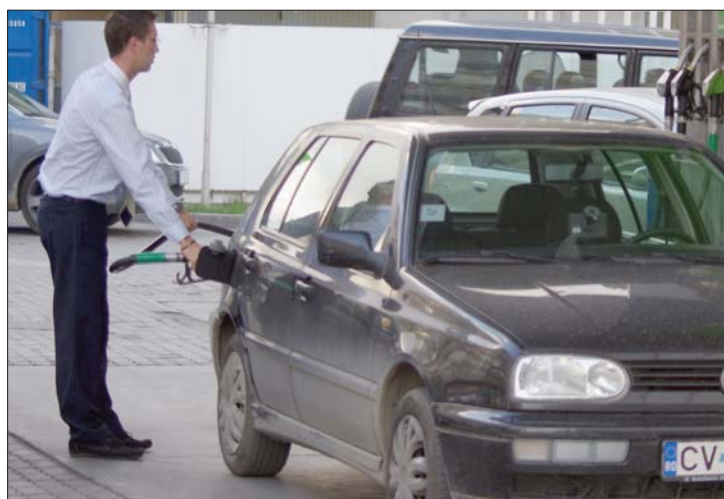
Székely krumpliból készült üzemanyaggal lehet majd tankolni.

▶ Zöldmezős beruházással biotanol- és biogázgyárat létesít Gyergyóremetén a Technical Trade Kft., amelynek működése közvetlenül és közvetve több száz embernek ad majd munkát a környéken. A hat és fél millió euró értékű befektetés közel felét, hárommillió eurót vissza nem térítendő támogatás formájában a mezőgazdasági minisztérium állja – az erről való megállapodást ma írják alá Gyergyóremetén. „Az üzlet ötletét a vidék alacsony mezőgazdasági művelése és az egyre nagyobb