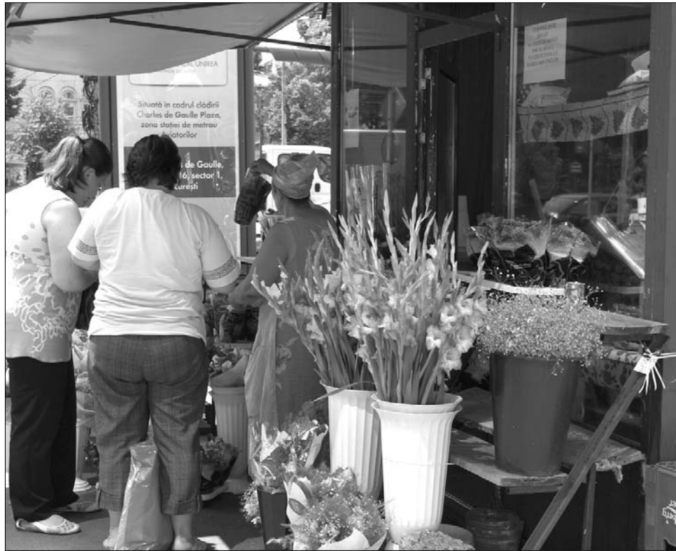
A román hatósági ellenőrzések az erdélyi virágkereskedőket is negatívan érintik

A román hatósági intézkedések azonban a hazai kertészeket és virágkereskedőket