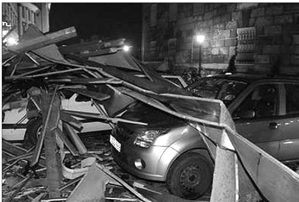
Budapesti tájkép – tűzijáték után. A hatóságok azóta szigorú biztonsági intézkedéseket vezettek be

A tűzijáték ugyan időben megkezdődött, de hamarosan látni lehetett, hogy nagy baj készülődik. Az ötödik-hetedik percben rövid időre meg is szakadt a petárdák indítása, majd mintha mi sem történt volna, folytatódott a parádé. Ekkor azonban már a rakpart fáit tépázta a vihar, az esőfüggöny itt is leszakadt, s bár még a nagy homályban a távolból látszódtak a rakéták roppe- nése, a pánik a hatalmas tömegben már kitört. Kezdetben a tévében még mutatták a menekülő, összevissza futó embereket – becslések szerint mintegy másfél millióan –, idővel azonban az operatőr is menekülőre fog-