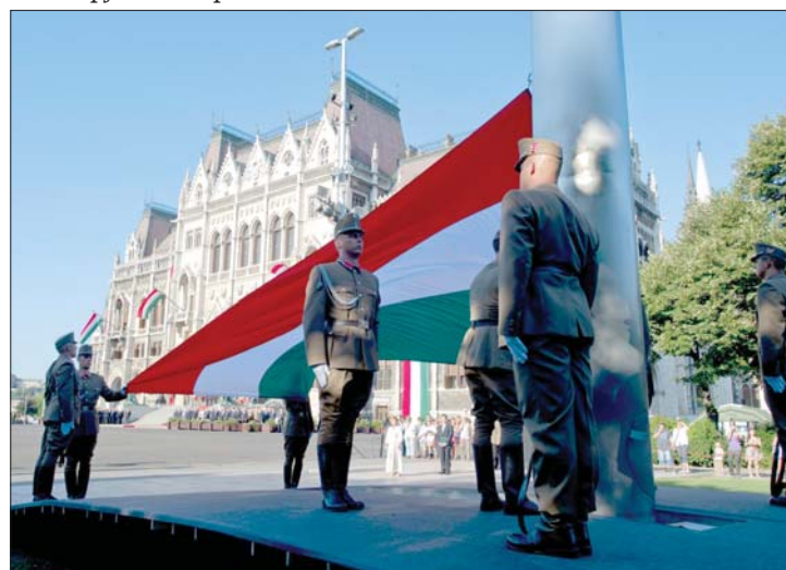
Szombaton az Országház előtt felvonták a magyar lobogót

délyi személyiség és egyesület részvételével a Kisebbségért elnevezésű kitüntetésben. 2. és 7. oldal ▶