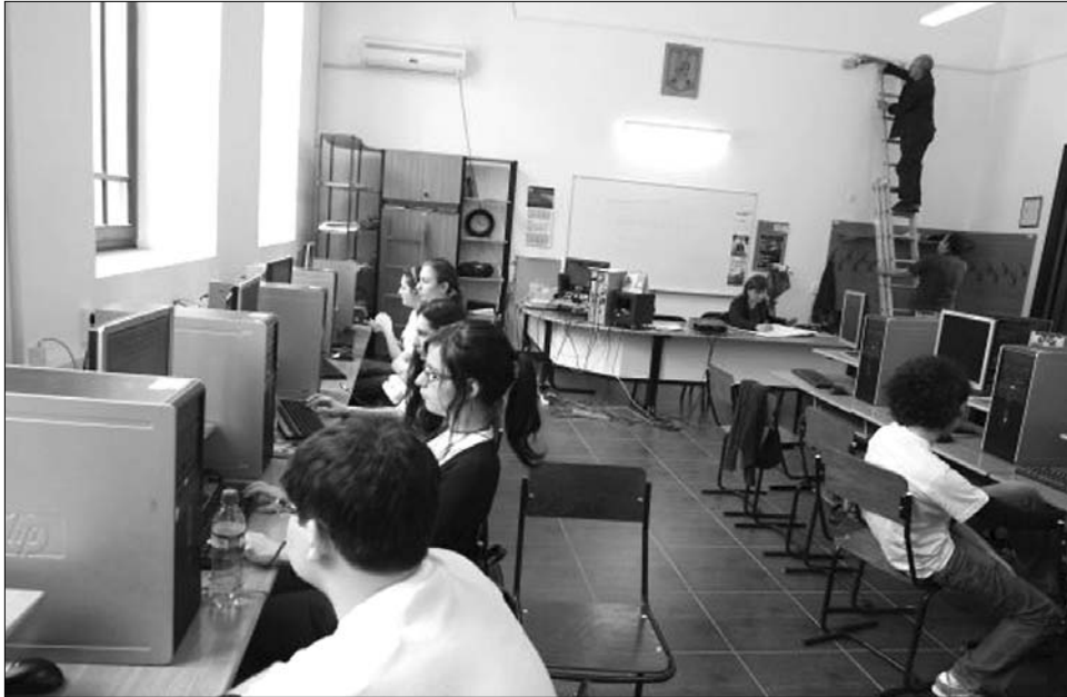
Nincs kivétel: mára valamennyi vizsgaközpontot elláttak kamerával a tanfelügyelőségek