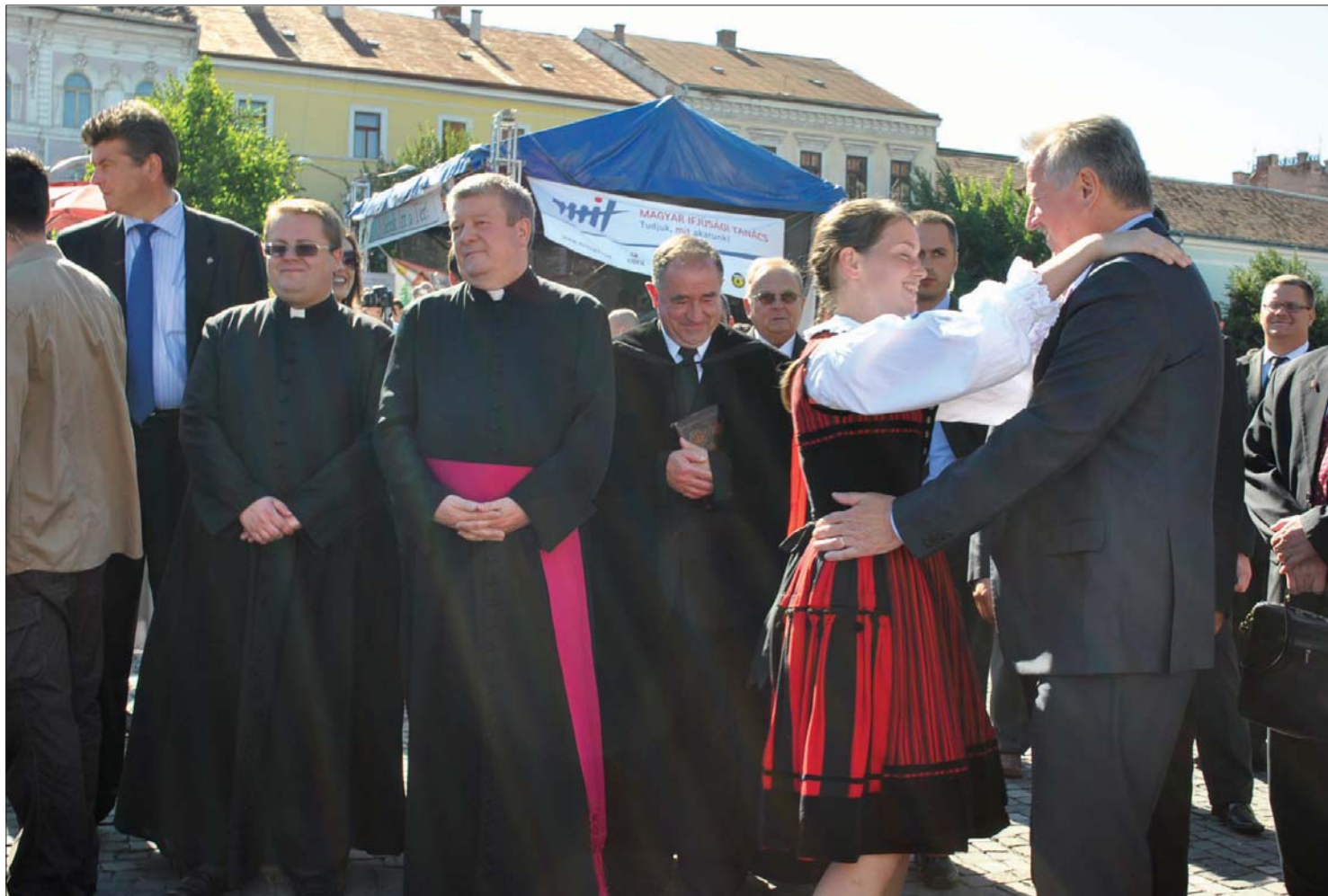
Táncos kedvű elnök. A magyar államfő a Szent István-napi Néptánctalálkozó résztvevőit is meglátogatta Kolozsváron

Schmitt Pál államfő részvételével értek véget a magyar napok a kincses városban