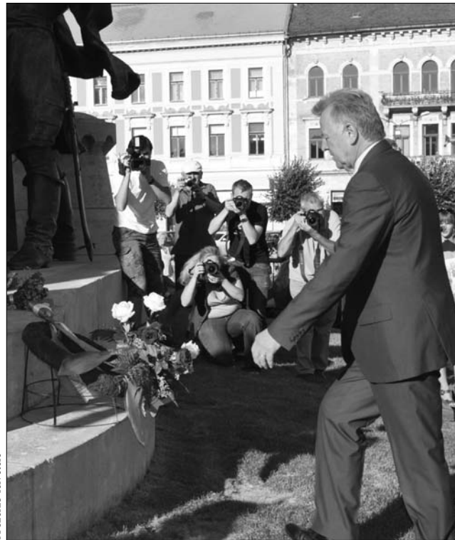
A magyar államfő tegnap a Mátyás-szobrot is megkoszorúzta

A hétfőn a kolozsváriak és a magyar napok kedvéért