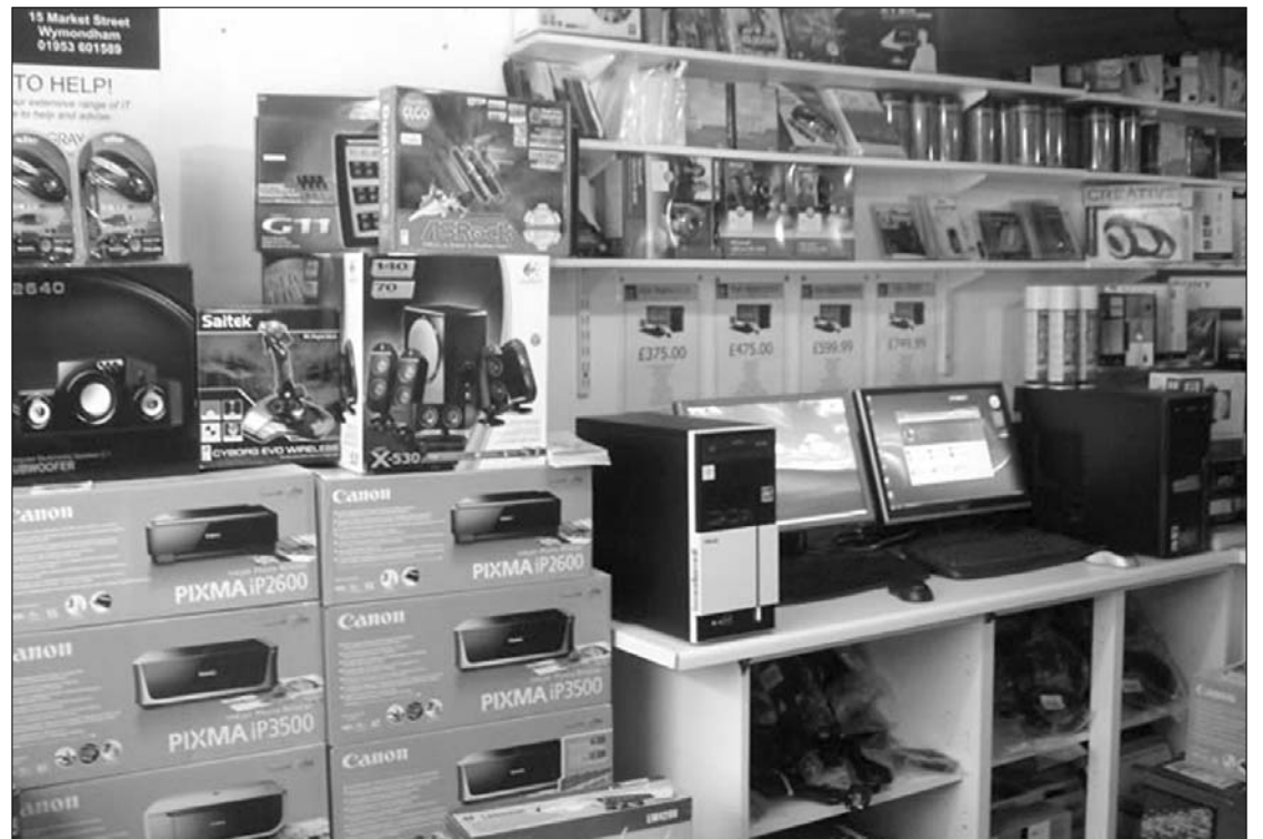
A jelek szerint nem kelendők többé sem az asztali gépek, sem a laptopok és notebookok

A netbookok fogyasztói piaca mintegy 27 százalékos visszaesést mutatott, a legnagyobb vesztes pedig az Acer lett. A szegmens összeomlása által leginkább érintett tajvani gyártó 44