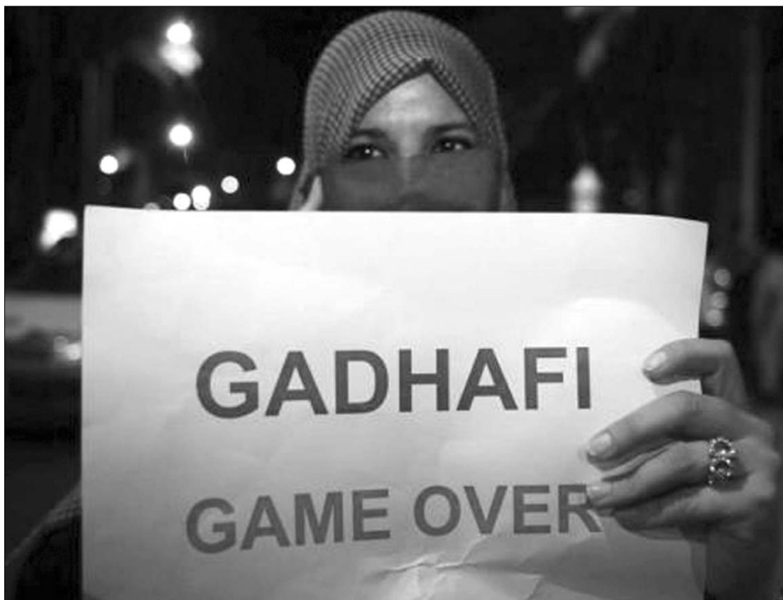
„Kadhafi, a játszma vége”. A líbiai felkelők már ünneplik a győzelmet és a diktátor elmenekülését

A kormányellenes erők mindenesetre még nem erősítették meg a diktátor távozását. A felkelő csapatok a hírek szerint szombat éjjel hatoltak be Tripoliba, ahol még tegnap is véres harcok folytak, amelyek során Kadhafi 31 katonája meghalt, 42 pedig fogságba került. A szombat este elindított, Szirén nevű akcióba a NATO-t szintén bevonták, és a Tripoli környékén harcoló láza-