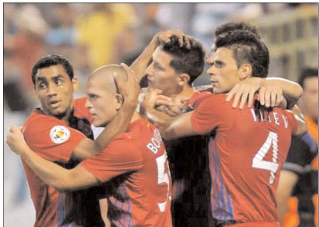
A Steaua továbbjutást ünnepelte a szófiai visszavágó után

A magyar férfi válogatott kikapott csütörtökön Portugáliától az Európa-bajnoki pótszelejtezőben Szolnokon, így harmadik vereségével (57-66) már biztosan nem juthat ki a litvániai Eb-re. Ott lesz viszont Portugália és Finnország, a pótszelejtező csoportosítása szerdán dől el előbbieket otthonban. ◀