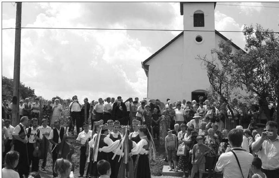
Ünneplők serege Asszonynépén. A falu egykoron Gizella királynő birtoka volt