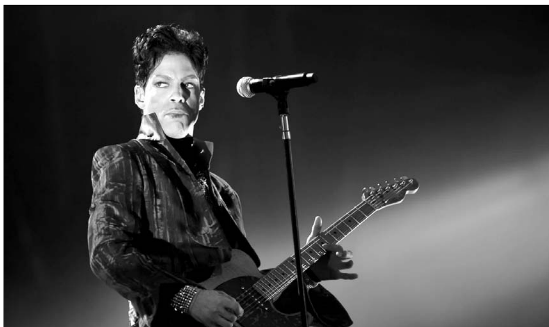
Az afroamerikai Prince sokak szerint az „év koncertjét” tartotta a Sziget fesztivál nulladik napján