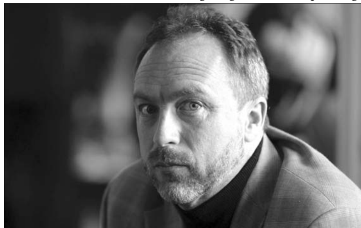
Jimmy Wales Wikipédia-alapító a borúlátó jóslatok ellenére bízik a lexikonban

lehetősen bonyolult szerkesztési felületet használ, a feltöltött anyagoknak pedig egy úgynevezett szerkesztőségi szűrőn is keresztül kell menniük, ami eltántorítja a szerzőket a cikkírástól. Jimmy Wales, a Wikipédia alapítója azonban úgy véli, továbbra is életképes az internetezők által fenntartott és az őket szolgáló média gondolata. Meglátását azzal támasztja alá, hogy az online lexikont továbbra is az olvasók tartják el. A hiba tehát valószínűleg valahol a „rendszerben” van. Kilátásba helyezte, hogy egyszerűsíteni fogják a portál adminisztrációs felületét, illetve tudatosan bővíteni fogják a szerzők és szerkesztők körét. Elmondása szerint egyetemekkel fogják felvenni a kapcsolatot, és olyan egyetemi oktatókat keresnek, akik hallgatóiktól dolgozatként elfogadják a Wikipédia bővítésében való részvételt. ◀