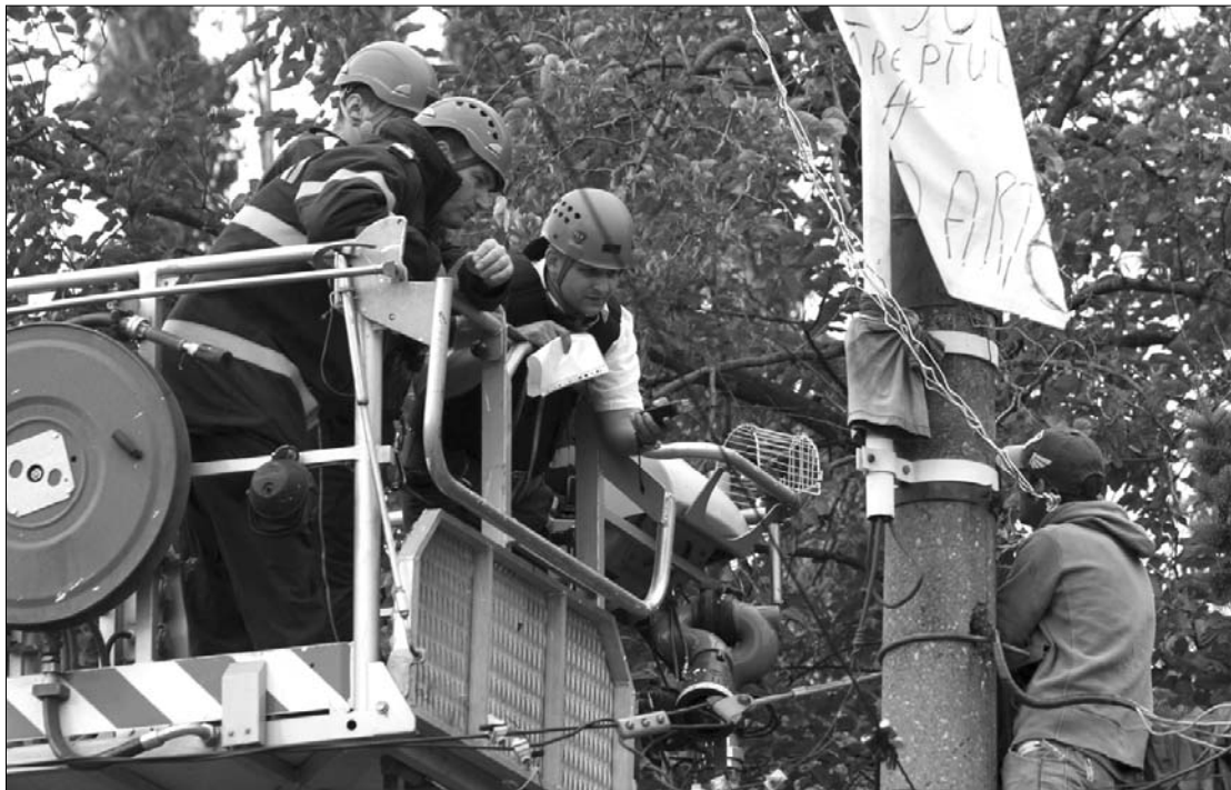
A pszichiátriai bántalmakban szenvedő férfivel órákig alkudoztak a rendőrök, végül a hashajtó hatott

Mint kiderült, ugyanarról a fiatalemberről van szó, aki június 8-án felmászott ugyanerre az oszlopra az államelnöki hivatal előtt. A nála talált iratok szerint súlyos pszichikai bántalmakban szenved. ◀