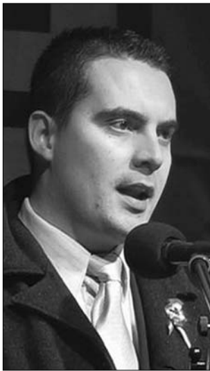
Vona Gábor a Jobbik elnöke

Az Erdélyi Magyar Ifjak táborában évek óta helyet kapnak a szélsőséges politikai eszmék és jelképek, tavaly felsorakoztak a Magyar Gárda tagjai is. Bár a szervezők több koncertet is meghirdettek a vasárnap estig tartó rendezvénysorozaton – többek között olyan szélsőjobb oldali ismert együttesek is fellépnek, mint a Hungarica és Kárpátia –, az idei