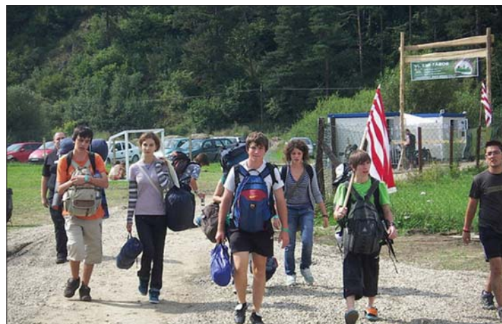
Az EMI-tábor egyik kelleke: az árpádsávos lobogó

pítvány illetékesei azzal érvelnek, hogy kulturális jellege miatt finanszírozták a rendezvényt, és nem ismerték a magasbükki eseménysorozat teljes programját. 7. oldal ▶