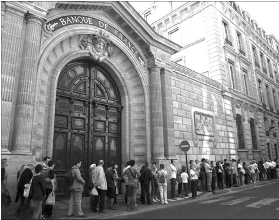
Világszerte „lehubta” a tőzsdéket a hír, hogy Franciaország is elveszítheti AAA-hitelminősítési besorolását

A félelemre további olajat öntöttek a pletykák, miszerint a Standard&Poor's leminősítene Franciaországot. Habár a befektetési ház szakértője a Reuters szerint piacnyugtató üzenetben közölte, hogy megmarad Franciaország AAA-besorolása, stabil kilátással, a befektetők büntették a francia pénzügyi intézetek kötvényeit – elsősorban amiatt, hogy portfóliójukban 350 milliárd eurót az olasz államadósság tesz ki. A Société Générale értékpapírjai 16 százalékkal, a BNP Paribasé 13,2