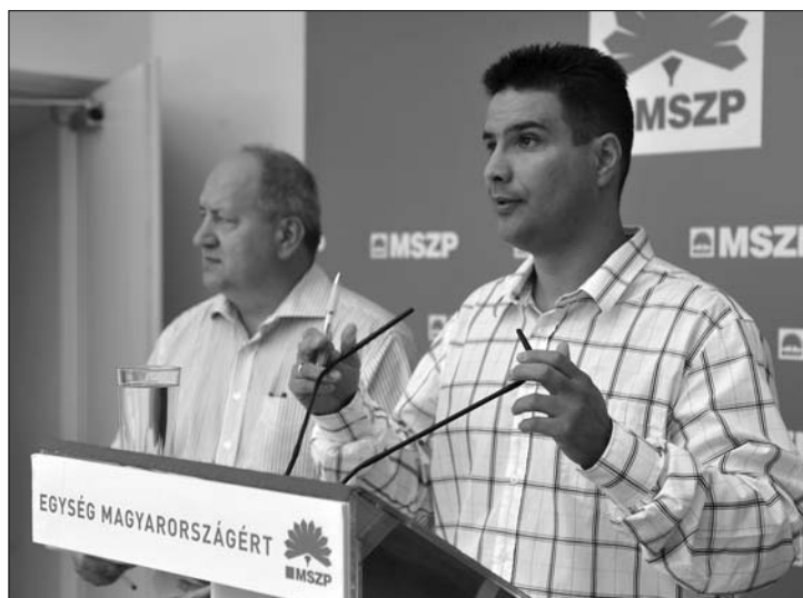
Mesterházy aggódik a devizaadósokért. A svájci frank rekordokat döntöget