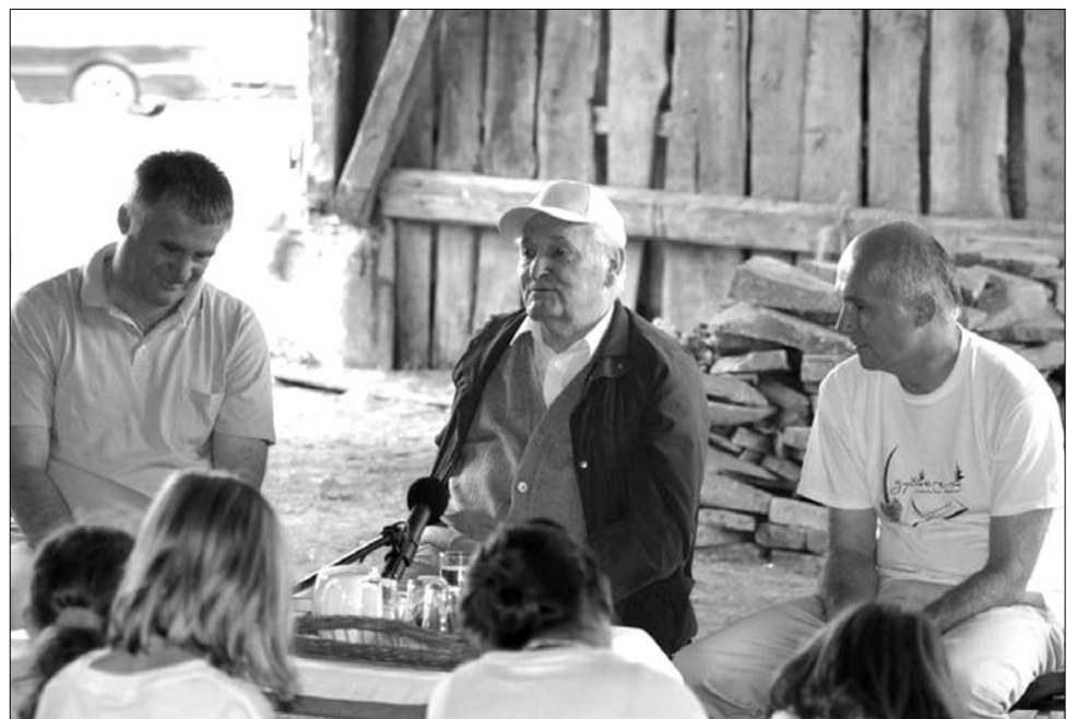
Kányádi Sándor (középen) verseiről és életéről mesélt Bójte Csaba (balra) gyerekeinek