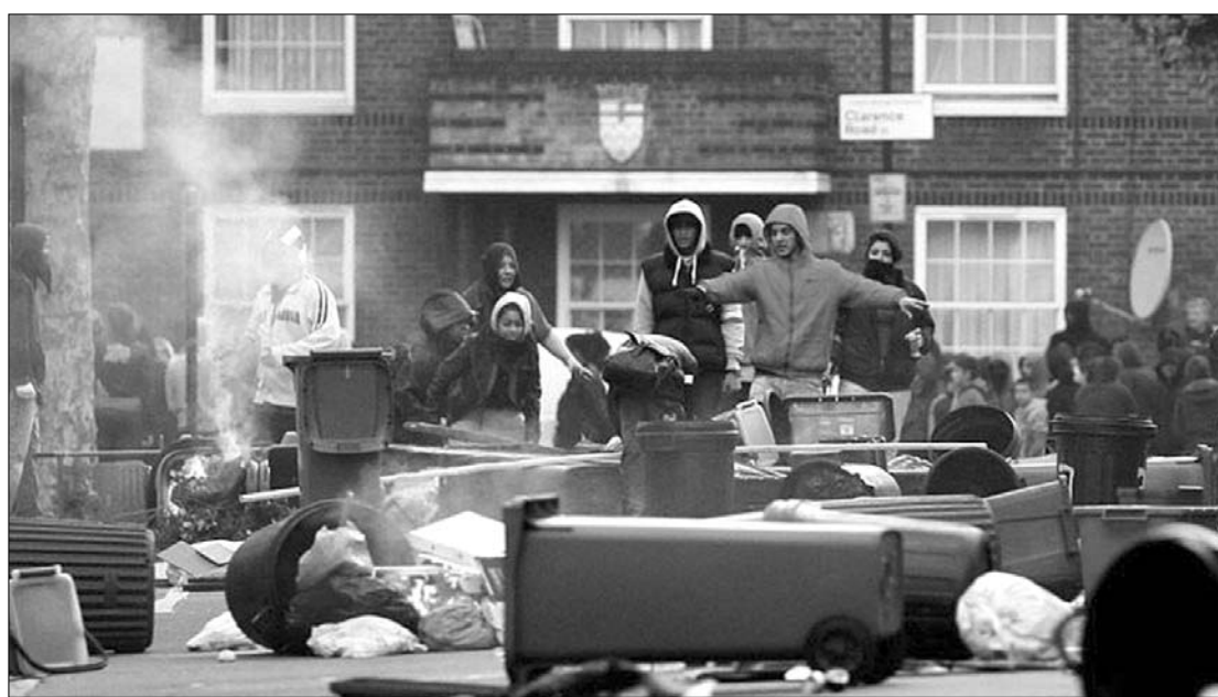
Az etnikai zavargások áterjedtek Londonról több nagyvárosra. A miniszterelnök súlyos következményeket ígér

Londonban ugyanakkor viszonylagos nyugalomban telt az éjjel, miután a korábbi 6 ezerrel