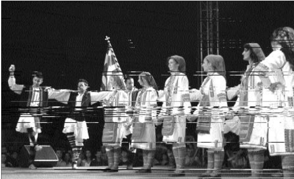
A Nagyenyedi Nemzetközi Folklórfesztivál fő célja a különböző kultúrák bemutatása volt.

Kilenc ország közel kétszáz énekes, zenésze és táncosa lépett július 21-e és 24-e között az I. Nagyenyedi Nemzetközi Folklórfesztiválon. A helyi néptáncosok mellett magyarországi, görög, horvát, olasz, bolgár és török csoportok is bemutatkoztak a közönségnek. Két görög táncospart, több mint hatvan tagja, illetve a magyarországi Siklós hagyományörzői a magyaralapádi gála díszvendégeként magyarországi, horvát, dráva-közi valamint mezőségi táncokat mutattak be, a nagyenyedi piactéren fellépő táncosok pedig táncukat rögtönözték. A négy na-