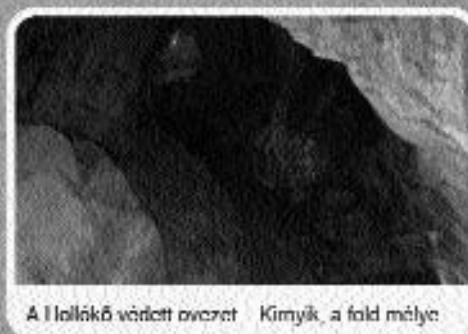
A Iollókő vörösvérvérvet Kímyk, a föld mélye

A Verespataki Bányaterv. Arany Romániának.