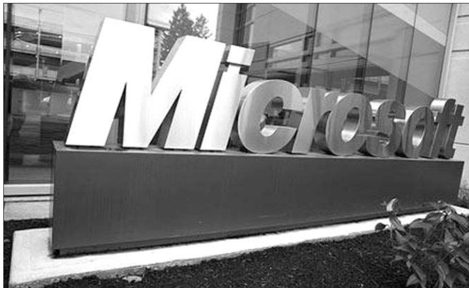
A következő két év alatt félezerre emelné romániai alkalmazottainak számát a Microsoft

A Microsoft két központot működtet az országban: a bukaresti a felhasználók technikai támogatásáért felelős, a kolozsvári fejlesztési központban pedig a Bing keresőmotort tökéletesítik. A pozitív üzleti mutatók az alkalmazottak számának alakulásában is meg fog látszani: az országban jelenleg