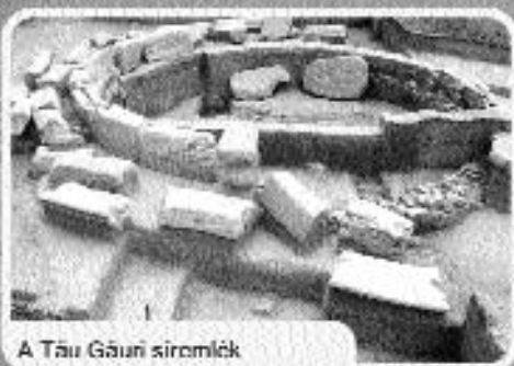
A Tau Gáusi síromlék

A kulturális hagyatékba fektetett egyik legnagyobb romániai magánberuházás révén a következő nemzedékek láthatják majd, miként építette Verespatakot a 2000 éves bányászati.