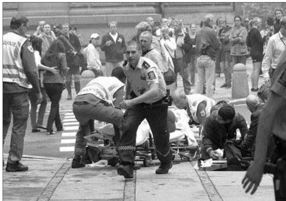
Autóbombára robbant Oslóban. Nemcsak a detonáció, hanem az ablacserepek is sokakat megsebesítettek

A bomba péntek délután robbant Oslóban a kormányzat központi épületénél. A belvárosban pánik tört ki, a kormány tizenhét szintes épületének egy része kigyulladt. A rendőrség megállapítása szerint egy utcán várakozó autóbombát rejtették el a pokolgépet. Egy amatőr felvételén az látszott, hogy az emberek tanácstalanul rohangálnak és nézelődnek. Az utca tele volt üvegszilánkokkal és törmelékkel. Több autó felborult a detonáció erejétől. A detonáció a főváros egyik legsűrűbben