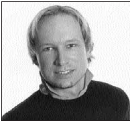
A tettes egy 32 éves – a leírások szerint magas, szőke, kék szemű – norvég férfi: Anders Behring Breivik, aki szélsőjobboldali nézete-

ket vall. Nacionalistának, a kulturális sokszínűség ellenségének írta le magát az interneten – írta internetes oldalán a VG norvég napilap szombat hajnalban. Az újság a gyanúsított egyik fiatalkori barátjára hivatkozva azt közölte, hogy a férfi régóta sokakat felháborító hozzászólásokat írt az interneten, és emiatt törölték is a profilját a Facebook közösségi oldalról. Ezért új profilt készített magának, majd ezután nyilvánosan már nem hangzottatva addigi, másokat megbotránkoztató véleményét. Breivik a rendőrségen tett vallomásaiban elismerte tetteit, amelyet azonban nem tart rossz cselekedetnek. Célját a muszlimok, a marxisták és a multikulturalizmus támogatói elleni küzdelemben jelölte meg. Breiviktől a norvég szélsőjobboldali pártok is elhatárolódtak.