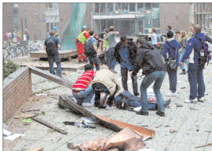
Mészárlás Oslóban. Az áldozatok teljes száma meghaladja a kilencvenet

soha nem ölt meg egyedül ennyi áldozatot: előbb autóbomba robbant Oslóban, majd egy árokfutó egy tábornak otthont adó szigeten kezdett el lövöldözni. 2. oldal ▶