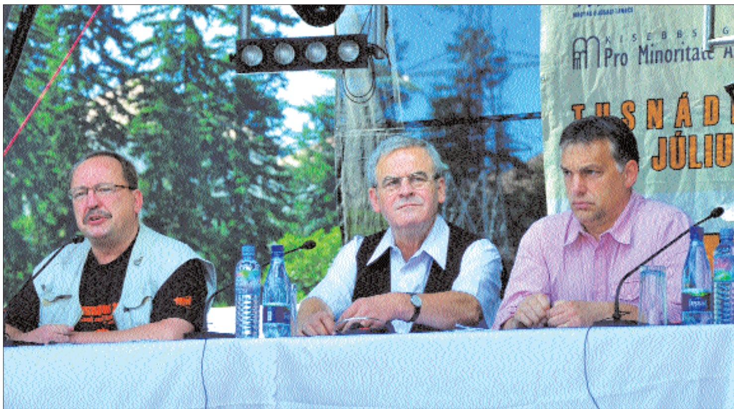
A Németh Zsolt államtitkár által moderált tusványosi fórumon Tökés László és Orbán Viktor vett részt. Traian Băsescu széke üresen maradt