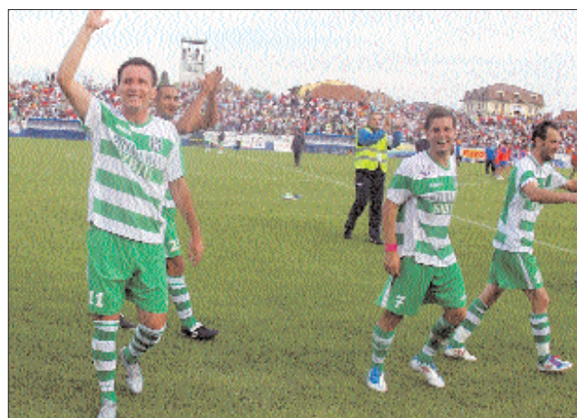
Az újonc nagyszoborai örültek a Steaua elleni reminek