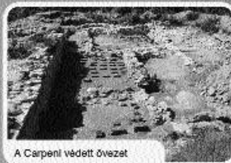
A Carpeni védett övezet