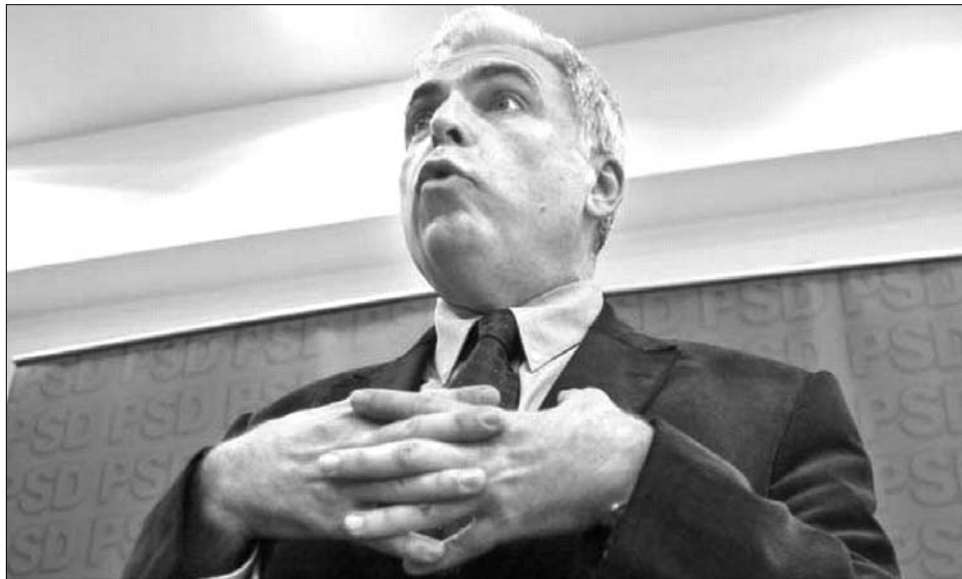
A kegyvesztett európai honatya. Az Európai Parlament fölfüggesztette Adrian Severin mentelmi jogát

2007-ben a szociáldemokraták akkori elnökével, Mircea Geoanával tűzött össze, miután a pártelnök Cristian Diaconescuval akarta leváltatni őt az Európai Szocialista Pártjának elnökségében elfoglalt tisztségéből. ◀