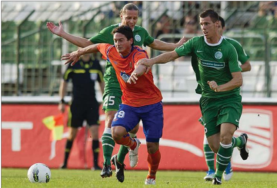
A zöldmezes FTC nem sok esélyt adott a norvég támadásoknak, egy vendéggől mégis beesett

Az UEFA nyoni székházában pénteken a harmadik selejtezőkör párosítását is kisorsolták. Továbbjutások esetén a Ferencváros a litván Suduva és a svéd Elfsborg párharcának győztesével, a Paks a skót Hearts of Midlothiannal, a Kecskemét pedig az orosz Alanyija Vlagyikavkazzal mérkőzhet. Ha túljut a finn KuPS-on, a Gaz Metan a német FSV Mainz 05-tel találkozik. Bekapcsolódik a küzdelembe a Dinamo is, a bukarestiek a moldovai Iskra-Stal és a horvát Varazdin párharc győztesével játszanak a harmadik selejtezőkörben.