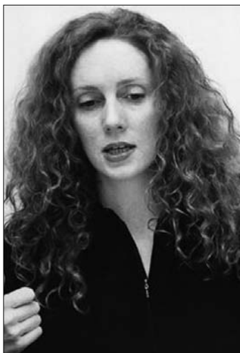
Rebekah Brooks bocsánatot kért

A 43 éves Rebekah Brooks huszonkét éve dolgozott a News Internationalnál. Egybehangzó információk szerint egyértelmű, hogy nem önszántából, hanem a cég igazgatótanácsának nyomá-