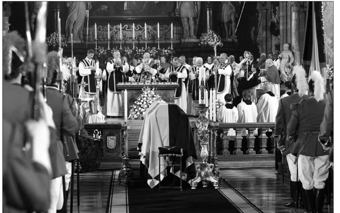
A Szent István székesegyházban gyászmisét mondtak az elhunytért mintegy ezer gyászoló jelenlétében

ladt. Mögöttük a gyászmise résztvevői és a menethez a dóm előtt csatlakozó gyászolók következtek. Több száz díszruhás, illetve történelmi egyenruhát viselő taggal képviseltették magukat lovagrendek és az egykori Osztrák-Magyar Monarchia területéről érkezett különböző katonai hagyományörző egyesületek. Habsburg Ottó koporsójával együtt Ausztriába szállították és szintén a kapucinusok kriptájában helyezték örök nyugalomra tavalay elhunyt felesége, Regina földi maradványait is. A kriptára XVII. század óta a Habsburgok fő temetkezési helye. ◀