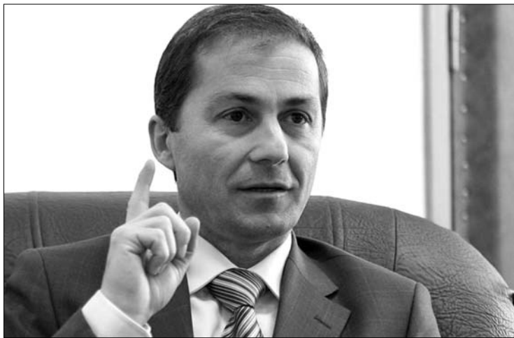
Daniel Morar, az Országos Korrupcióellenes Igazgatóság főügyésze

A főügyész kijelentésére reagálva az RMDSZ elnöke rámutatott: míg a DNA vezetője politikai jellegű nyilatkozatokat tesz, addig Daniel Morar ügyészi köntösbe bújt politikusként számít. Kelemen szerint az a különbség ügyész és politikus között, hogy előbbi bizonyítékokat keres, utóbbi pedig politikai jellegű nyilatkozatokat ad. A szövetségi elnök leszögezte: nyilatkozata nem számít politikai nyomásgyakorlásnak, csupán fel szeretne volna hív-