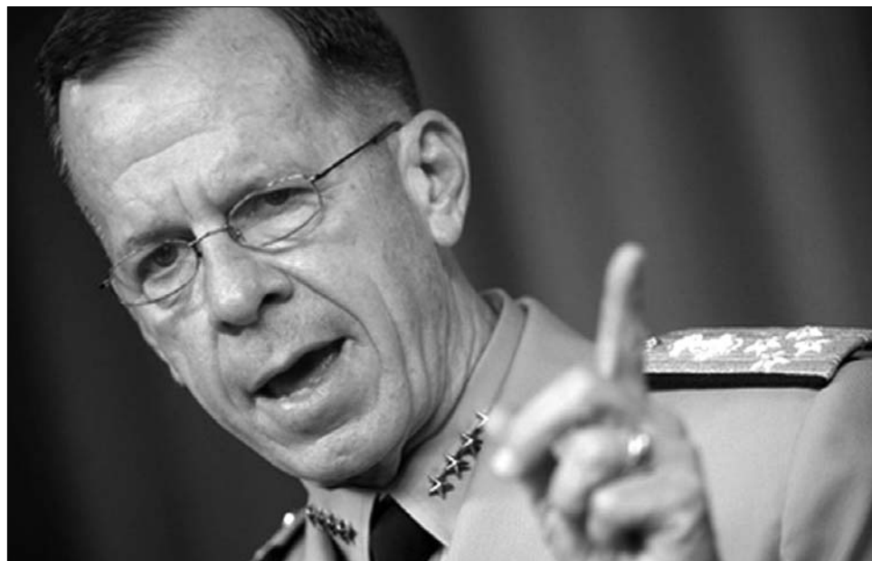
Mike Mullen amerikai vezérkari főnök figyelmeztetése Pekingnek: csínján a katonai fejlesztésekkel!

Mullen azonban erről nincs meggyőződve. „Túl korai megmondani, merre is tart Kína mindezzel. Ők azt mondják, védelmi természetű fejlesztések. Meglátjuk” – mondta. Szerinte a Dél-kínai-tengeren tapasztalt kínai mozgás aggodalomra adhat okot, különösen a szabad hajózás tekintetében. Mullen a kínai tengeri ambíciókat nem látja világosan, a külön-