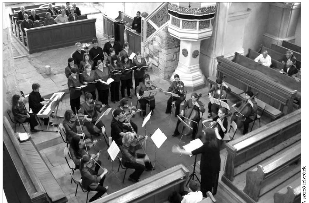
A dorogi Erkel Ferenc zeneiskola kórusa és zenekara tegnap a nagyenyedi vártemplomban lépett fel