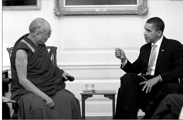
Peking figyelmeztetése ellenére Obama fogadta a dalai lámát

Kína – szintén a találkozó előtt – megerősítette korábbi álláspontját, miszerint határozottan ellenez minden találkozót a dalai láma és bármely külföldi politikus között. Egyúttal felszólította Washington, hogy mondja le a tervezett találko-