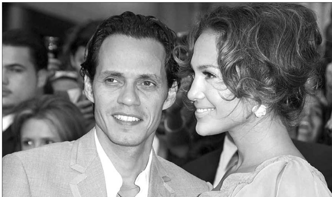
Itt még együtt. Marc Anthony és Jennifer Lopez hét év házasság után döntött úgy, hogy elválnak az útjaik

Rövid közös közleményükben Jennifer Lopez és Mark Anthony úgy fogalmazott: házasságuk befejezéséről közösen döntöttek. „Nagyon nehéz döntés volt. Minden ügy tekintetében baráti egyezsége jutottunk” – tették hozzá a felek, megjegyezve, hogy ezek „fájdalmas pillanatok minden érintett fél számára”, s hálásak lesznek magánéletük tiszteltetéséért ebben az időszakban.