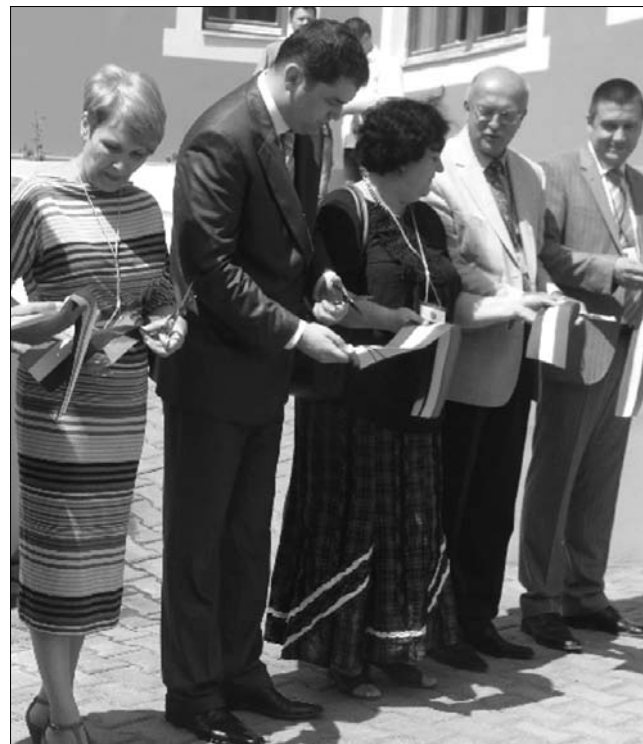
Egészségügyi intézményeket avatott Cseke Attila Marosvásárhelyen

adták a megyei kórház új adminisztratív székhelyét. A beruházás összértéke meghaladja az 1.900.000 lejt, ebből az Egészségügyi Minisztérium 1.600.000 lejt biztosított. Cseke Attila elismerő oklevelet adott át azoknak a kiemelkedő munkát végző orvosoknak és professzoroknak, akik hozzájárultak ahhoz, hogy a Marosvásárhelyi Orvosi és Gyógyászati Egyetem nemzetközi hírű felsőoktatási központtá váljon. Az ünnepélyes átadást követő sajtótájékoztatón a tárcavezető emlékeztetett: az egészségügyi költségvetés 4 milliárd lejes hiánnyal küzd. A politikus hangsúlyozta, hogy a hiány kétharmada az Országos Egészségbiztosítási Pénztár (OEP) terheli. „az egészségügyi miniszternek nem kellene aggódnia az Országos Egészségbiztosítási Pénztár költségvetése miatt, Romániában azonban a közvélemény még mindig a szaktárcát hibáztatja az OEP problémáiért. Mindent el fogunk követni a költségvetés-kiegészítéskor, hogy év végéig az országos programokban ne legyenek fennakadások” – válaszolta a válságkezelésre vonatkozó elképzeléseit Cseke Attila egészségügyi miniszter. ◀