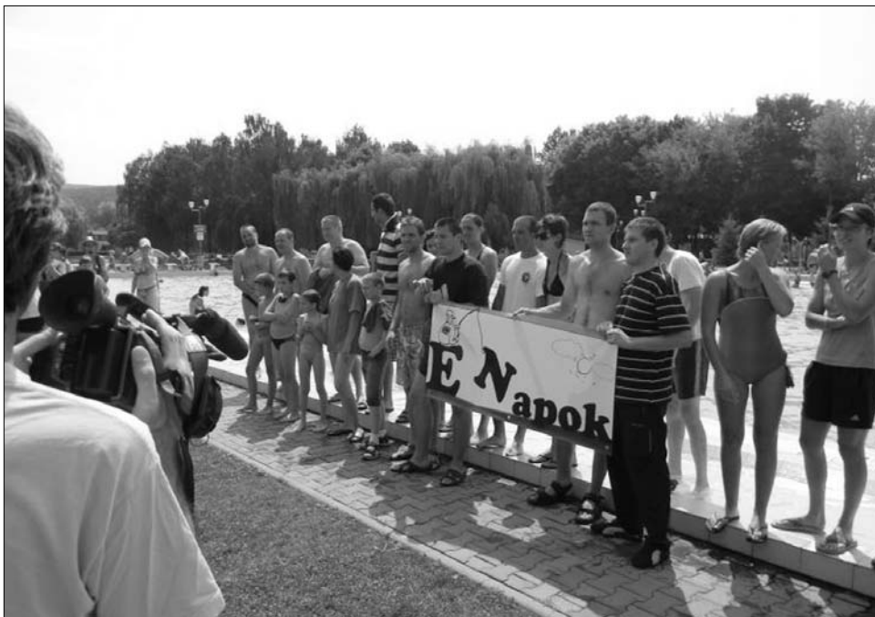
Támogatásért csobbantak. Marosvásárhelyen több civil szervezet is csatlakozott a Swimathonhoz

A hétvégi pályázati felhívással egy időben az alapítvány munkatársai kiértékelést is tartottak a tavalyi évről: ekkor 331 pályázatot iktattak, Hargita megye 78 településéről. Támogatásért folyamodott 18 árva, 70 félárva diák. „Bízom abban, hogy ennek a közösségnek akkor lesz igazán jövője, ha minden