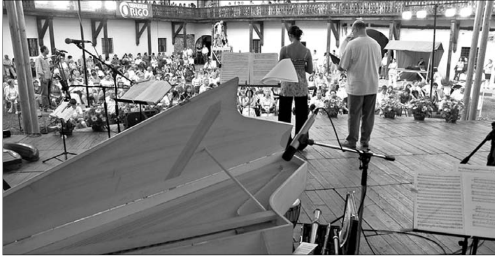
Az idő is velük tartott: a Csíkszeredai Régizene Fesztivál csak szombattól került zárt térbe.