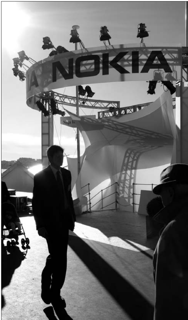
A konkurencia harsány marketingje és az olcsó utáztatok vetettek árnyékot az egykori mobiltelefonos piacvezetőre

Mátis emlékeztetett arra is, hogy a Romániába való költözés annakidején Németor-