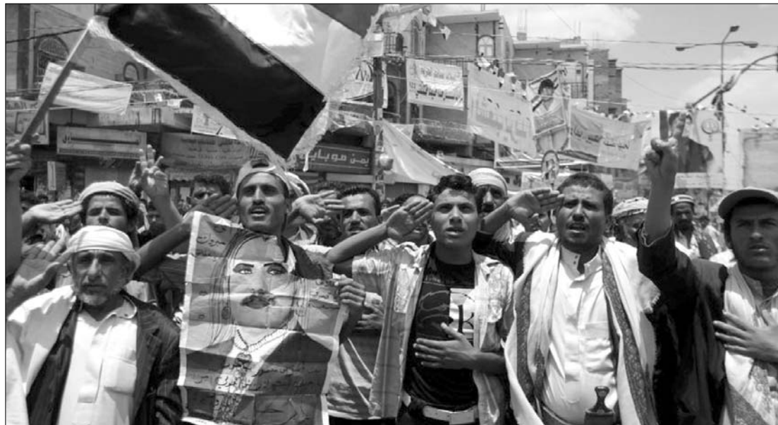
Tömegtüntetés Jemenben. Az al-Kaida igyekszik kihasználni és a maga javára fordítani a zavargásokat

Súlyos börtönbüntetésre ítélték tegnap Bahreinben ellenzéki vezetők; nyolcan közülük életfogytig tartó szabadságvesztést kaptak. Megfigyelők szerint tartani lehet attól, hogy az ítéletek felszítják a lappangó feszültséget a kőolajban gazdag királyságban. ◀