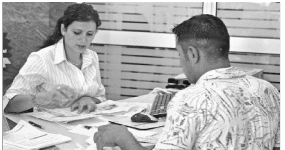
A hitelpiac pangása ellenére is tovább szigorodhatnak a kölcsönfolyósítás kritériumai