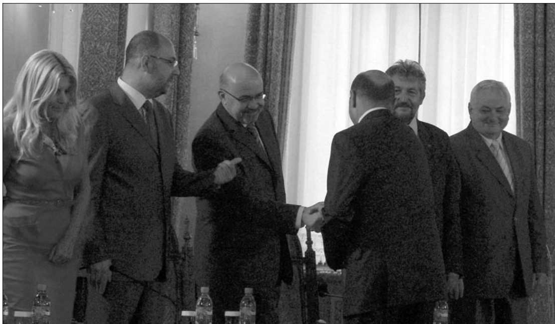
Az RMDSZ-delegáció azzal az ígérettel távozott Cotroceni-ből, hogy hétfőig elemzik az elnök javaslatát.

A képviselő tájékoztatása szerint az együttes frakcióülésen jelen lévő képviselők és szenátorok nagy többsége egyelőre nem látta megoldásnak a kormányból történő kilépést. „Egyet értettünk Kelemen Hunor szövetségi elnökkel abban, hogy a koalíció szakadása senkinek sem jó. Ha kormányval-