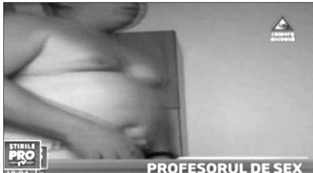
... illetve magából kivétközve

keressük itt meg a diplomát, és ezért ennyire borzasztó ez az eset. Nemcsak az egyetemi oktatók becsülete sérült, hanem a miénk is” – fogalmazott az egyik hallgató. Szerinte sokszor hátrányban vannak a nők az egyetemen, mert állandóak az ilyen-olyan jellegű szexuális zaklatások. „Nemcsak arról van szó, hogy a vizsgák sikerét vagy a felkészülésre befektetett munka minőségét megkérdőjelezzük, hanem a módról, ahogyan a diákok egymás között is beszélnek” – panaszkolt az egyik lány. Bevallása szerint saját diáktársai is zaklatták, kényelmetlen a bentlakás, nem biztosított az intimitás, rossz a légkör az intézményben. Az eset kapcsán a kollégiumi ellátás körüli vizsaszászágok is nyilvánosságra