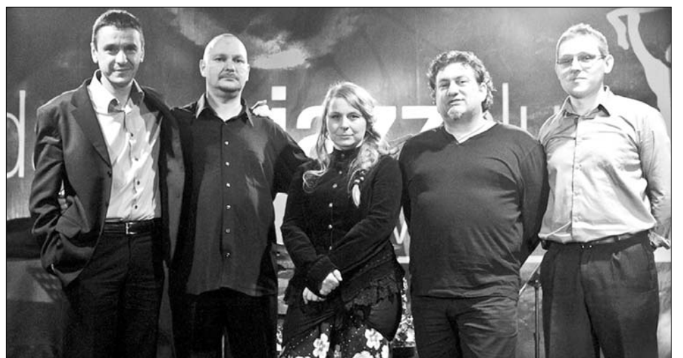
A különleges zenei hangzásokat ötvöző The New Soul Band is fellép szatmári dzsesszfesztiválon