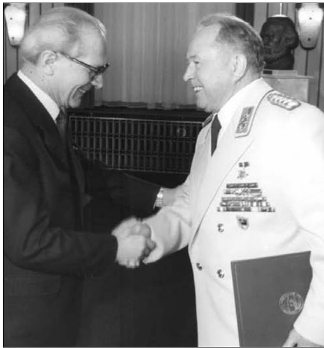
Erichék, ha találkoznak: Honecker és Mielke. A kémfőnök kezében még nem a titkos irat, hanem az államfőtől kapott kiténtetéses lapul

Régóta készülhetett erre, mert a német sajtó kiderítette, hogy már az 1970-es években, tehát a főtitkár hivatalba lépését közvetlenül követően elkezdte összegyűjteni a kompromittáló anyagokat: 1971-ben a központi kiértékelő és hírszerző csoport nevével elalakult két Stasi-ügynököt bízta meg a különleges feladattal. A szigorúan titkos hadművelet során Honeckerről már a hitleri Németország idejéből származó iratok is előkerültek, amelyek, ha korábban nyilvánosságra