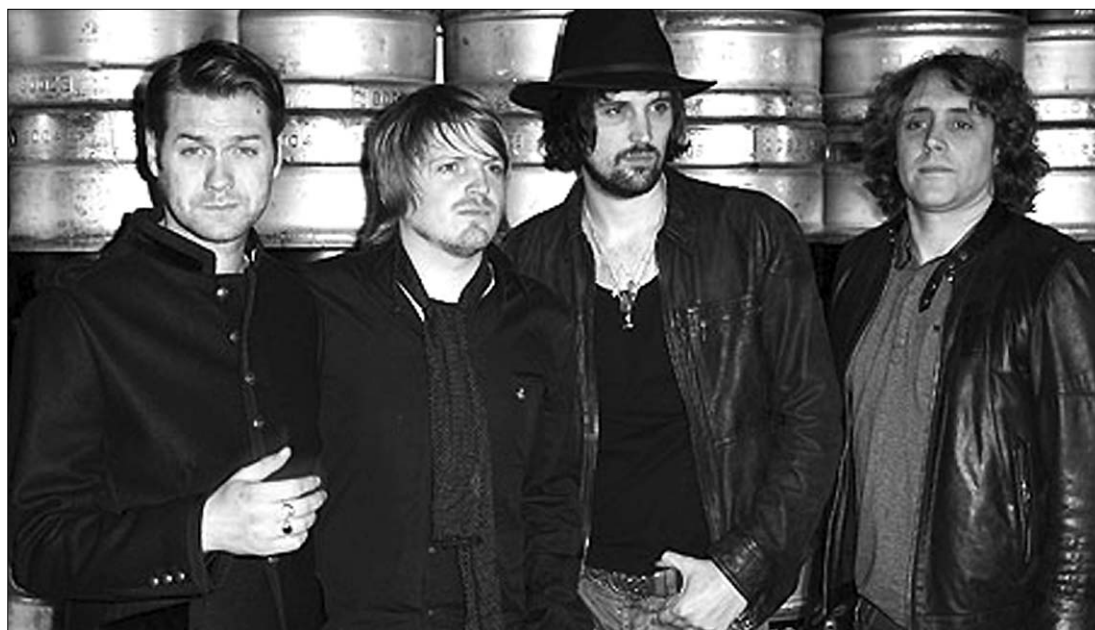
Az augusztus 25-én rajtoló Tuborg Green Fest Fél-szigeten a világ egyik legjobb zenekarának titulált Kasabian is fellép

A Tuborg Green Fest Fél-sziget első bejelentett előadói között olyan együtteseket találunk, mint a Kasabian, amelyet a legmagasabb brit zenei magazin, a Q által a világ legjobb zenekarának titulált, Marosvásárhelyen koncertezik a a legnépszerűbb holland zenei exporttermék, Within Temptation, Nick Warren, a brit house-keresztapa, illetve a montreali electro-guru: Tiga. Az izraeli Asaf Borger, ismertebb nevén Borgore lesz a fellelős azért, hogy a dubstep-rajongók számára emlékeztetés legyen a fesztivál utolsó estéje a Tuborg Green Fest Fél-szigeten. A sorban természetesen hamarosan újabb nevek jönnek, hiszen a Tuborg Green Fest Fél-