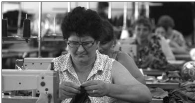
A megrendelések növekedésére számíthatnak a hazai varrodák

► A kínai munkabérek növekedése miatt egyre több spanyol textilipari cég költözteti vissza gyártását Délkelet-Európa és Észak-Afrika országaiba – számolt be az Expansion.com . A spanyol portál kiemeli, hogy a trend fő kedvezményezettjei – Marokkó, Tunézia, Törökország mellett – Románia és Magyarország lesznek.