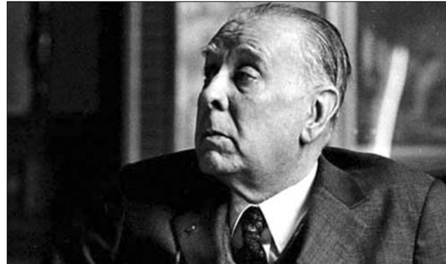
Jorge Luis Borges, a mágikus realizmus legjelentősebb képviselője

► 25 éve, 1986. június 14-én hunyt el Jorge Luis Borges argentini költő, író, a mágikus realizmus irányzatának egyik legjelentősebb képviselője, aki Buenos Aires egyik roszhírű városrészében született 1899. augusztus 24-én. Meghatározó élménye volt a mérhetetlen gazdagságú családi könyvtár és a nagy területű, labirintushoz hasonló kert. E két dolog, a könyvtár és a labirintus későbbi munkáinak jellegzetes motívuma lett. Olvasni a Brit Enciklopédiából tanult meg, kilencévesen spanyolra fordította Wilde A boldog herceg című meséjét, s ez meg is jelent az El País -ban. 1923-ban Fervor de Buenos Aires ( Buenos Aires-i láz ) címmel verseskötete is megjelent. Ugyanekkor több