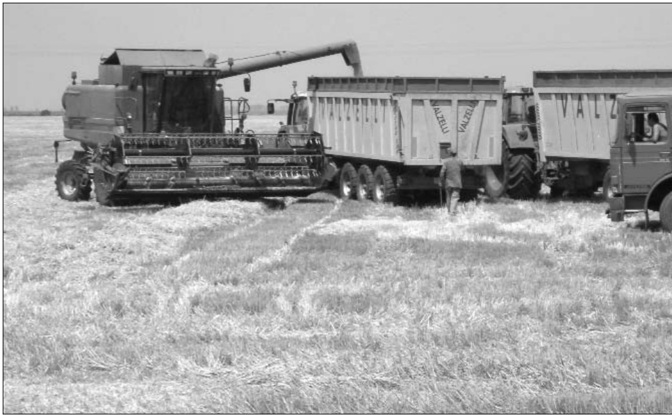
Még nincs minden „elvetve”. Ha az időjárás is úgy akarja, idén akár nagyobb is lehet a gabonatermés