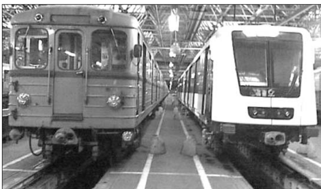
A retró- és a modern budapesti metrókocsi

Csakhogy közben a Fidesz és koalíciós partnerei vették át az irányítást – a szerződést felmondták. Újabb fordulat-