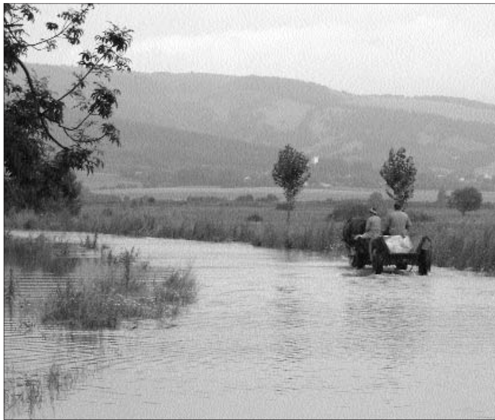
Kiáradt patak Oltszemen. A háromszéki elöljárókat nem érdekli az árvízvédelem