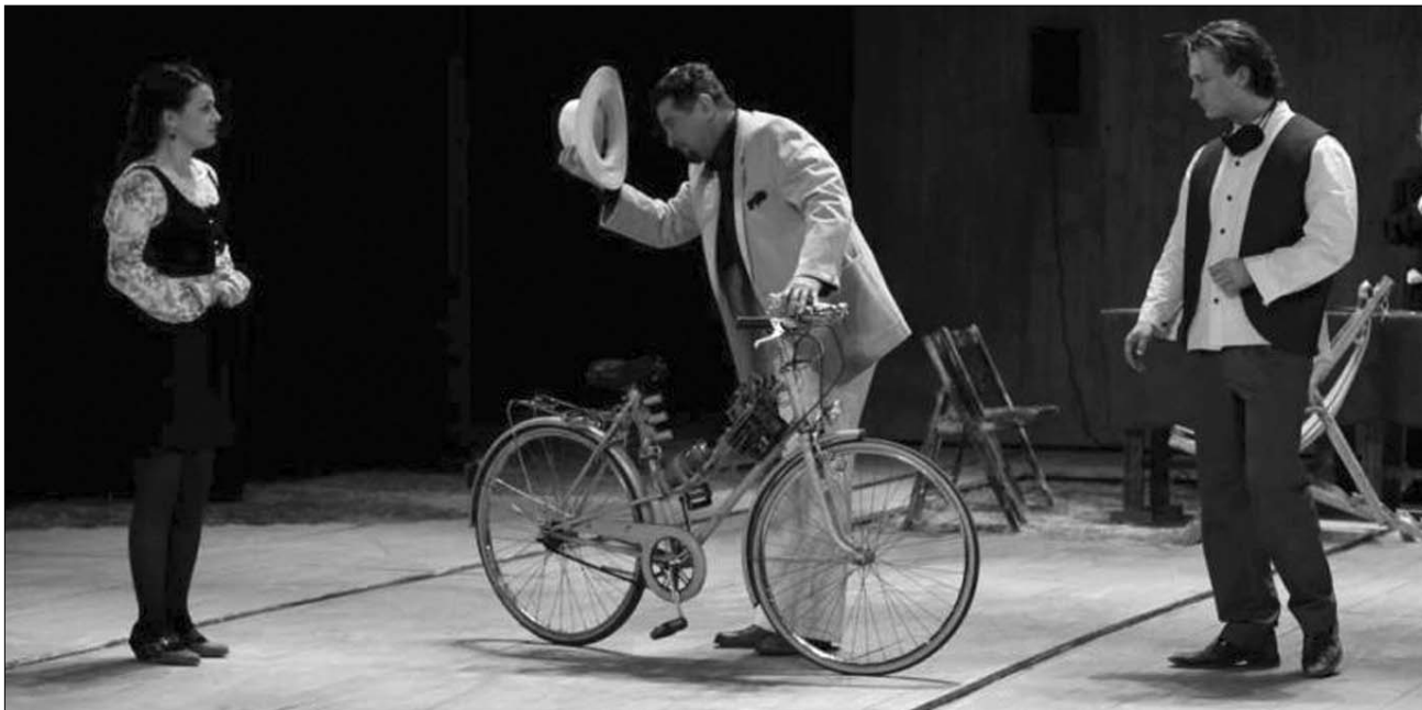
A marosvásárhelyi társulat Csehov-darabja, a Platonov a kisvárdai fesztivál versenyprogramjában is szerepel