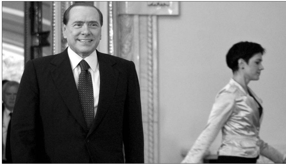
Zavar tükröződik Berlusconi arcán. „Az olaszoknak elégük lett belőle” – írták róla a tegnapi napilapok.

Az olasz lapok búcsúztatják a miniszterelnököt