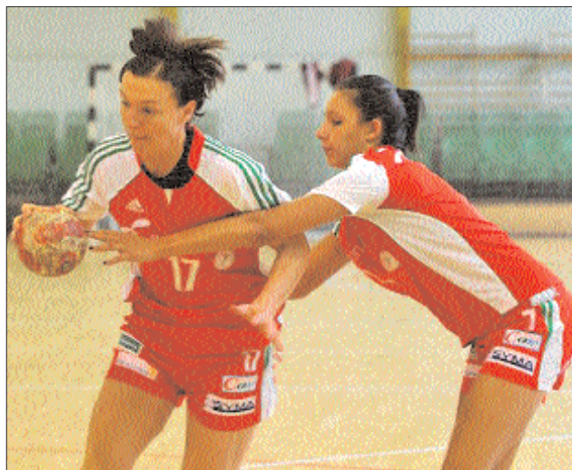
A magyar lányoknak parányi esélye van kijutni az olimpiára.

A címvédő oroszok, az Európa-bajnok norvégok, az Eb-második svédek és az Eb-harmadik románok már korábban kivívták a jogot a december 3. és 18. között sorra kerülő brazíliai vb-n való indulásra. Kijutott még a világbajnokságra Németország (26-24 és 27-22 Magyarországgal), Montenegró (42-26 és 33-26 Csehországgal), Spanyolország (37-22 és 21-24 Macedóniával), Hollandia (40-24 és 38-34 Törökországgal), Horvátország (36-25 és 30-31 Szerbiával), Franciaország (28-19 és 28-20 Szlovéniával), Izland (37-28 és 24-24 Ukrajnával) és Dánia (23-16 és 24-19 Lengyelországgal). ◀