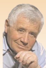
Székedi Ferenc sôhoz tartoznak. ▶

Akik azzal támadták az RMDSZ-t, hogy mit keres a kormányban, most egy kicsit magukba szállhatnak: ha a romániai magyarságnak nincs kormányzati és parlamenti képviselője, akkor