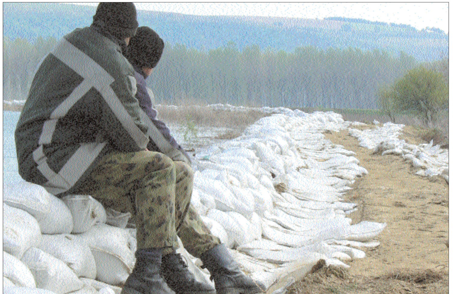
Tétlen székely legények a gáton. Az önkormányzatok mulasztása miatt jelentős árvízkarok érhetik a székelyföldi településeket

A támogatások ellenére a székely önkormányzatokat felkészületlenül érik az árvizek