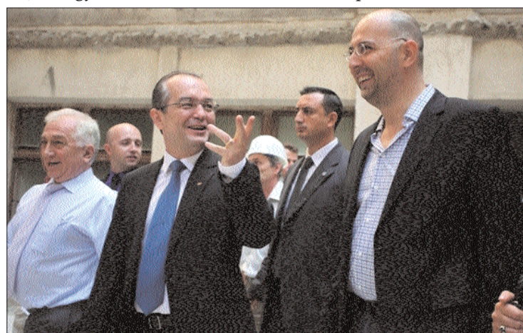
Tegnap már nem mosolyogtak. Kelemen Hunor és Emil Boc

ció felbomlásának veszélye, mert a PDL-nek nem áll szándékában parlament előtti felelősségvállalással érvényt szerezni „megyé- sítési” elképzeléseinek. 3. oldal ▶