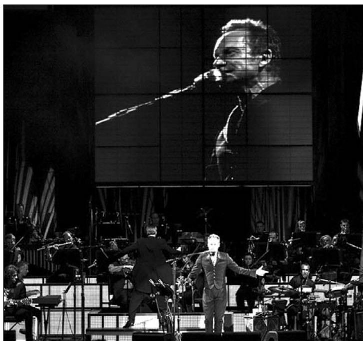
Sting ötvenfős csapattal énekelte legismertebb dalait a román fővárosban

Sting (Gordon Matthew Thomas Sumner) 1951 október 2-