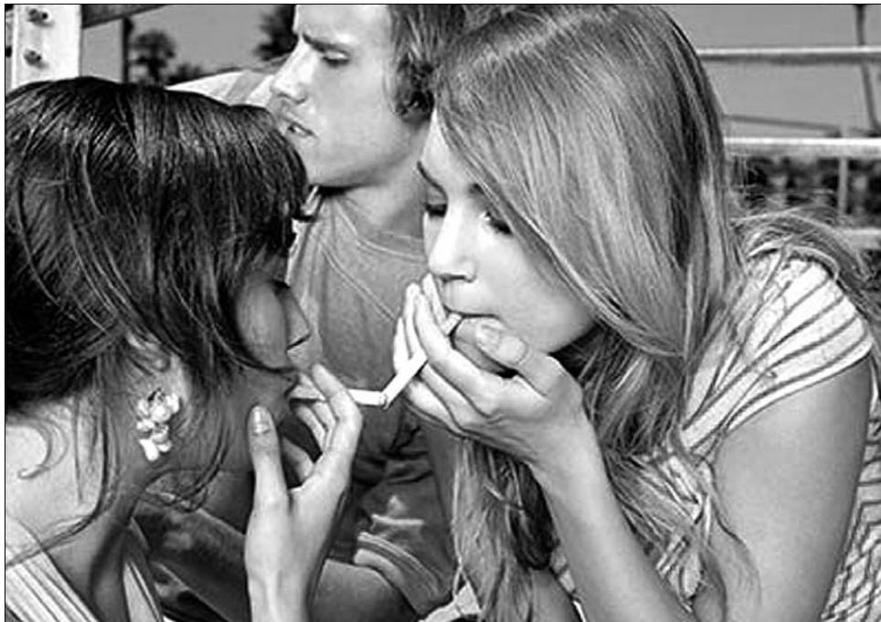
A 18 évnél fiatalabbak egyáltalán nem látogathatják azokat a helyiségeket, amelyekben füstölteni lehet

Manuela Mítrea javaslata értelmében teljesen kitilthatják a nyilvános helyekről a dohányzást. „Füstbarát” helyek ugyan lesznek, de ezeknek az alapterülete nem lehet nagyobb 150 négyzetméternél, az előterjesztő ugyanis így szeretné elérni, hogy minél kevesebben gyűjthassanak rá egy légtérben, a cigarettázás ne lehessen közösségi élmény. A 18 évnél fiatalabbakat pedig, az elképzelések szerint, távol tartják a „dohányvilágtól” – ez a korsztály egyáltalán nem látogathatja azokat a helyiségeket, amelyekben füstölteni lehet. A szabálysértők pénzbírságra számíthatnak, az így