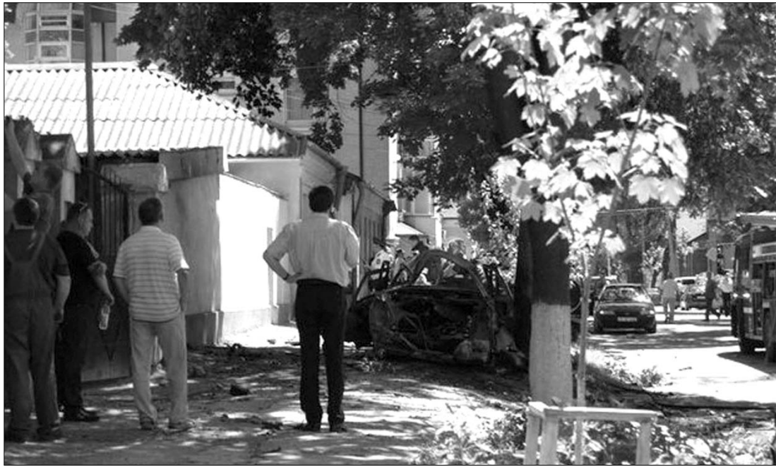
A személygépkocsi a moldovai főváros központjában, a kínai nagykövetség épülete előtt robbant fel