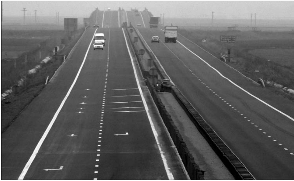
„Célegyenesben” a pályadíj. Az optimisták szerint ez felgyorsíthatja a hazai sztrádaépítést

A hatóságok szerint a lépest európai uniós nyomásra kell megtenniük, mivel a romániai sztrádaépítési projekteket finanszírozó Európai Bizottság meg kíván bizonyosodni afelől, hogy a pályahasználati díjból fedezni lehet a karbantartási munkákat. Az autópályadíj összegéről még nem tudni konkrétumokat, a szállításiügyi miniszter szerint erről jelenleg folynak az elemzések és tárgyalások. A jelek szerint ugyanakkor az autópályadíj megjelenésével egy időben nem fog eltűnni az úthasználati adó sem, mi