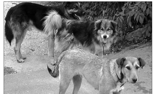
A kóbor kutyákról való gondoskodást az önkormányzatokra bízák

Sepsiszentgyörgyön nem várják meg a törvényt, a helyi önkormányzat illetékesei tegnap jelentették be: több intézkedést is terveznek a kóbor ebek ügyének rendezése érdekében. Pluszilletéket rónak ki például a tömbházban lakó