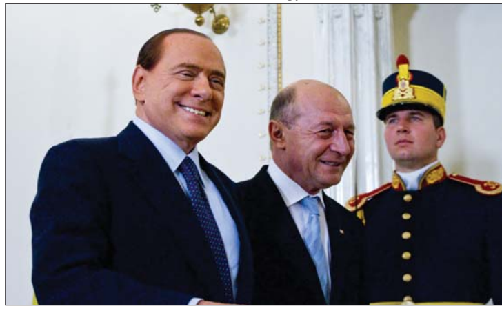
Silvio Berlusconi olasz kormányfő és Traian Băsescu államfő

tegnap Traian Băsescu államfő fogadott hivatalában. A két politikus Románia schengeni csatlakozásáról és a románok kérdéséről tárgyalt. 3. oldal ▶