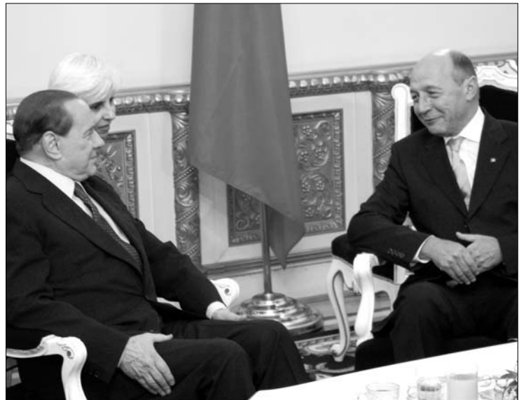
Traian Băsescu (jobbra) hivatalában fogadta Silvio Berlusconit

ságírók előtt, hogy lefotózhassák a román elnökkel. A két politikus ezt megelőző négyezemközi tárgyalása több mint egy órát tartott. Silvio Berlusconi részt vett a román államfő által adott villásreggelin is. Az olasz miniszterelnök a római kormány több tagjával érkezett hétfőn Bukarestbe kétnapos látogatás keretében, hogy tárgyaljanak egyebek között Románia schengeni csatlakozásáról, valamint a románok kérdéséről. ◀