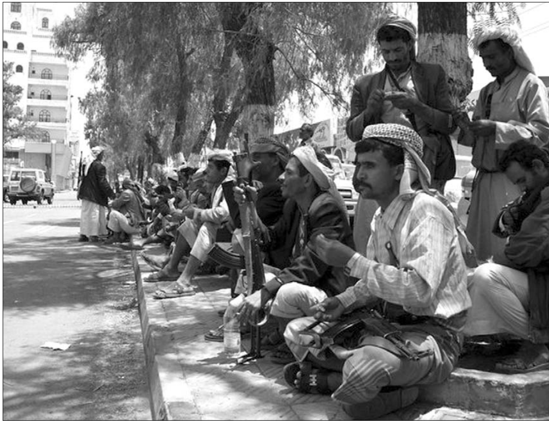
Fegyvert fogtak tegnap Taizz városában. Jemenben egyre jobban elhatalmasodik az erőszak

„Felszólítom Száleh elnököt, hogy tegyen eleget a jemeni népjogos követelésének a politikai át-