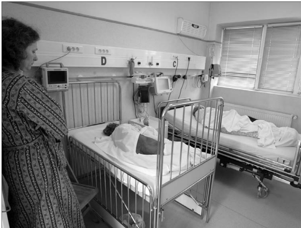
Az új kritériumrendszer drákói feltételekhez köti a kórházi beutalások lehetőségét.

Cseke Attila közleményben reagált a dokumentumra: az egészségügyi miniszter úgy véli, a feltételrendszer megnehezíti az orvosok munkáját, a szigorítás a betegellátás rovására mehet, és az elkövetés „a gyakorlatban megvalósíthatatlan”.