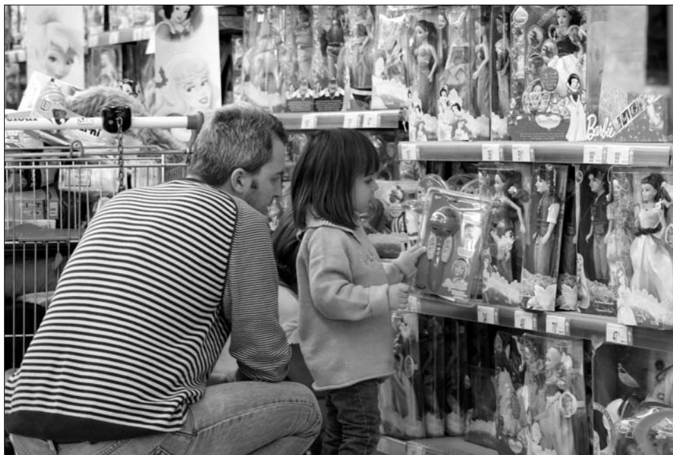
A játékszerek kínálata óriási, csak minőségben és pénzben van hiány a romániai piacon

A szakértők elmondásából kétféle trend rajzolódik ki: a gyerekek egyrészt még mindig a klasszikusnak számító kisautókhoz és babához hűségesek, ugyanakkor egyre nagyobb figyelemmel fordulnak a modern találmányok felé, aminek népszerűsítésében jelentős szerepet játszik a tévéreklám. Mivel az ágazat szereplői szerint a hazai fogyasztók játékvásárlási kultúrája még igen kiforratlan, gyakorlatilag a tévés gyerekprogramból ismert „ikonok”, illetve az adások közé iktatott reklámok diktálják a divatot. Ez a reklámpiac működésére is pozitívan hat ki, hisz a nagy gyártók már régóta felismerték: a könnyen befolyásolható kiskorúak egész életük során hűségesek maradnak gyermekkori preferenciáikhoz. ◀