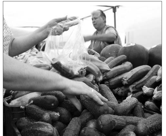
Ausztriából több spanyol terményt is kitiltottak

A madridi kormány nem zárja ki annak lehetőségét, hogy felelősségre vonja Németországot, amiért bizonyítékok hiányában ekkora presztízs- és bevételvesztést okozott a hazai agrárium számára. Josep Puxeu spanyol vidékfejlesztési miniszter kifogásolta az európai országok – köztük Ausztria – azon eljárásait is, amellyel akadályozzák az Ibériai-félszigetről származó termékek kereskedelmében való jutását, pusztán Berlin „megalapozatlan” gyanújából kiindulva. ◀