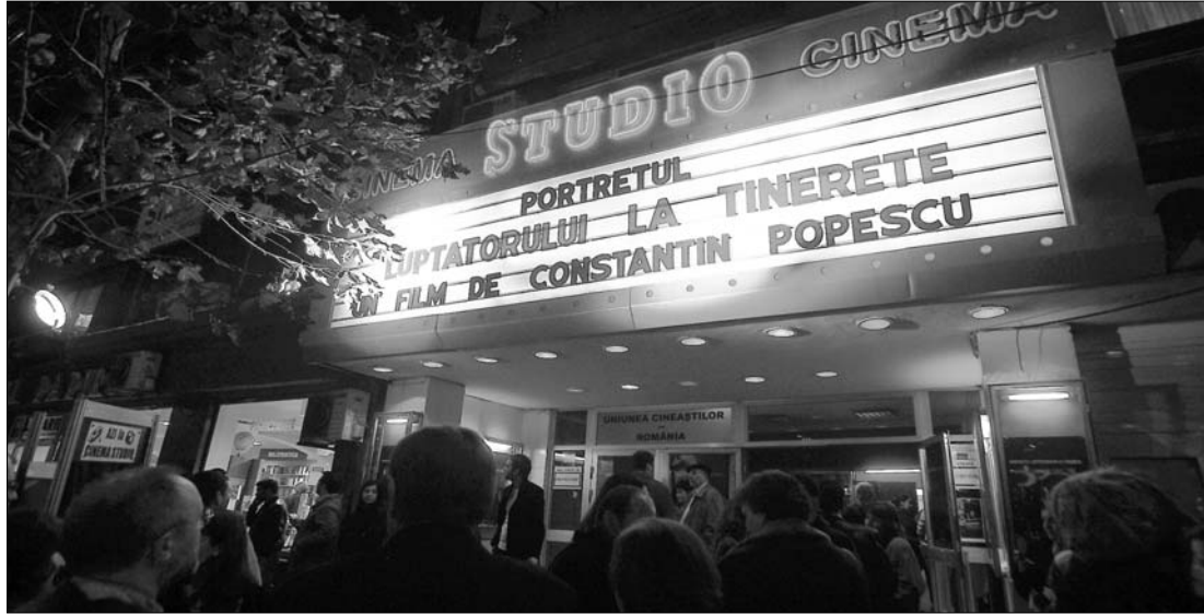
Tavaly mintegy 6,5 millióan váltottak jegyet a mozik pénztáraitban, ami ötéves rekordnak számít