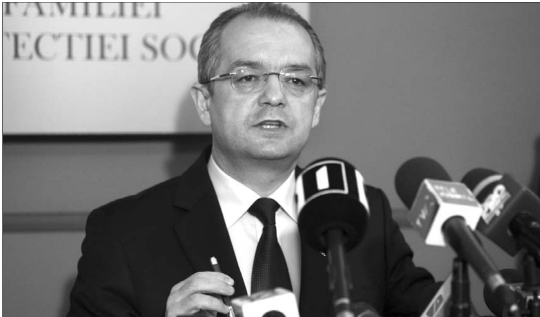
Emil Boc csak a munkaügyi tárca igazgatásától válna meg, miniszterelnökként még maradna

► Kacsának bizonyultak azok a hírek, miszerint Emil Boc kormányfő már a tegnapi nap folyamán lemond tisztségéről. A feltételezések azt követően röptek fel, hogy a miniszterelnök kora délután négyszemközt tárgyalásra ment Traian Băsescu államfőhöz, és a parlament két házának állandó bizottsága rendkívüli ülést tartott. A helyzetet maga az érintett tisztázta órákkal később, amikor a sajtó türelmetlen érdeklődésére ismételtlen leszögezte: „Romániának van kormánya, miniszterelnöke, a koalíció stabil, a dolgok a normális mederben mennek tovább.” Arra az újságírói kérdésre, hogy ezt a nyilatkozatát úgy kell értelmezni, hogy nem hajlandó lemondani mandátumáról, Emil Boc csak annyit jegyzett meg, hogy ami mondandója volt ezzel kapcsolatban, elmondta. A munkaügyi minisztérium élén ideiglenesen betöltött tisztségével kapcsolatban közölte, hogy hamarosan, a törvényes 45 napon belül megnevezi Ioan Nelu Botiș utódját. A román sajtó információi szerint Sulfina Barbu, a demokrata libe-