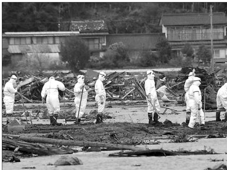
Nukleáris katasztrófaelhárítás. Csak „adagolják” a fukusimai híreket

A japán kormány tegnap jóváhagyta, hogy független szakértőkből álló bizottság alakuljon a fukusimai nukleáris válság okainak kivizsgálására. ◀