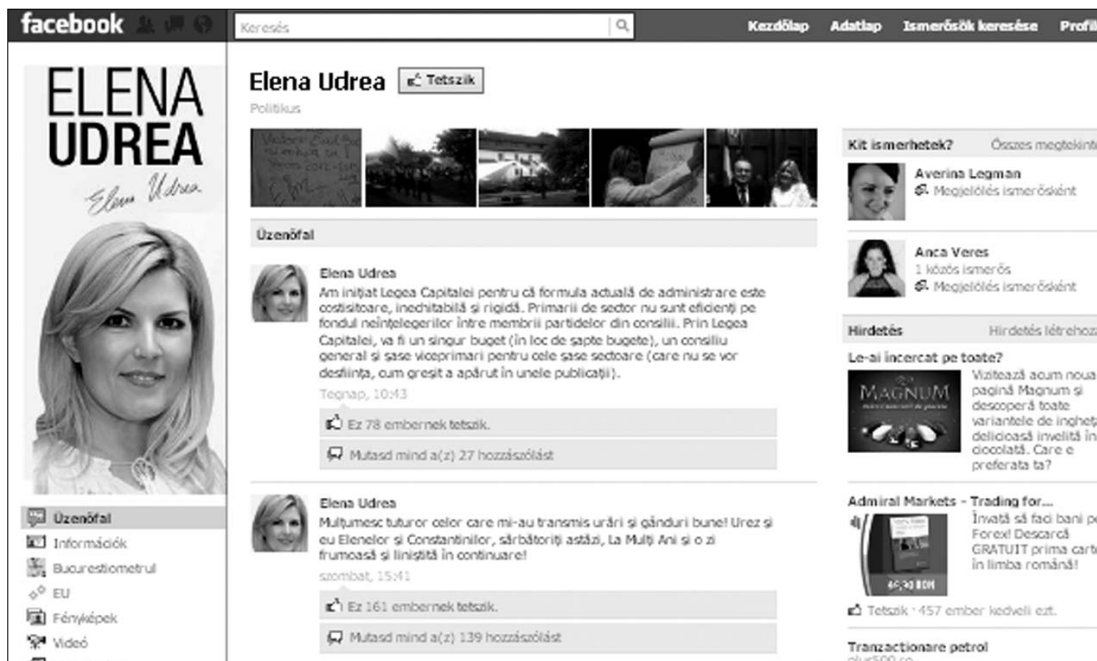
Elena Udrea a második legtöbbet emlegetett politikus a facebookozók üzenőfalán. A népszerűségi listán csak harmadik