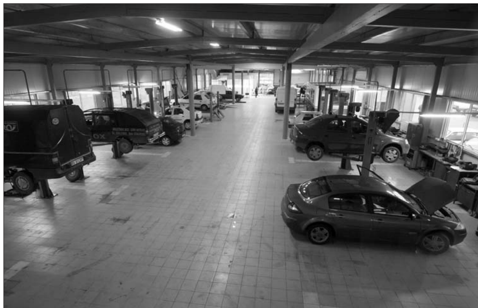
A tervek szerint térfényképező kamera rögzíti a jövőben az autószerelés minden mozzanatát.

„Átvilágítják” a jövőben az autószerelők munkáját: a szenátus illetékes szakbizottsága is pozitívan véleményezte azt a törvényjavaslatot, amely követhetővé tesz minden, a személygépkocsikon végzett beavatkozást. A törvényhozók abban bíznak, hogy így megelőzhetőek lesznek visszaélések, a szakszerűtlen javítások és alkatrészcsere, illetve az alkatrészekkel való visszaélések. A tervek szerint térfényképező kamera rögzíti a jövőben az autószerelés, az autóbontás minden mozzanatát, a műhelytulajdonosok kötelesek térfényképező kamerával rögzíteni a munkafolyamatokat.