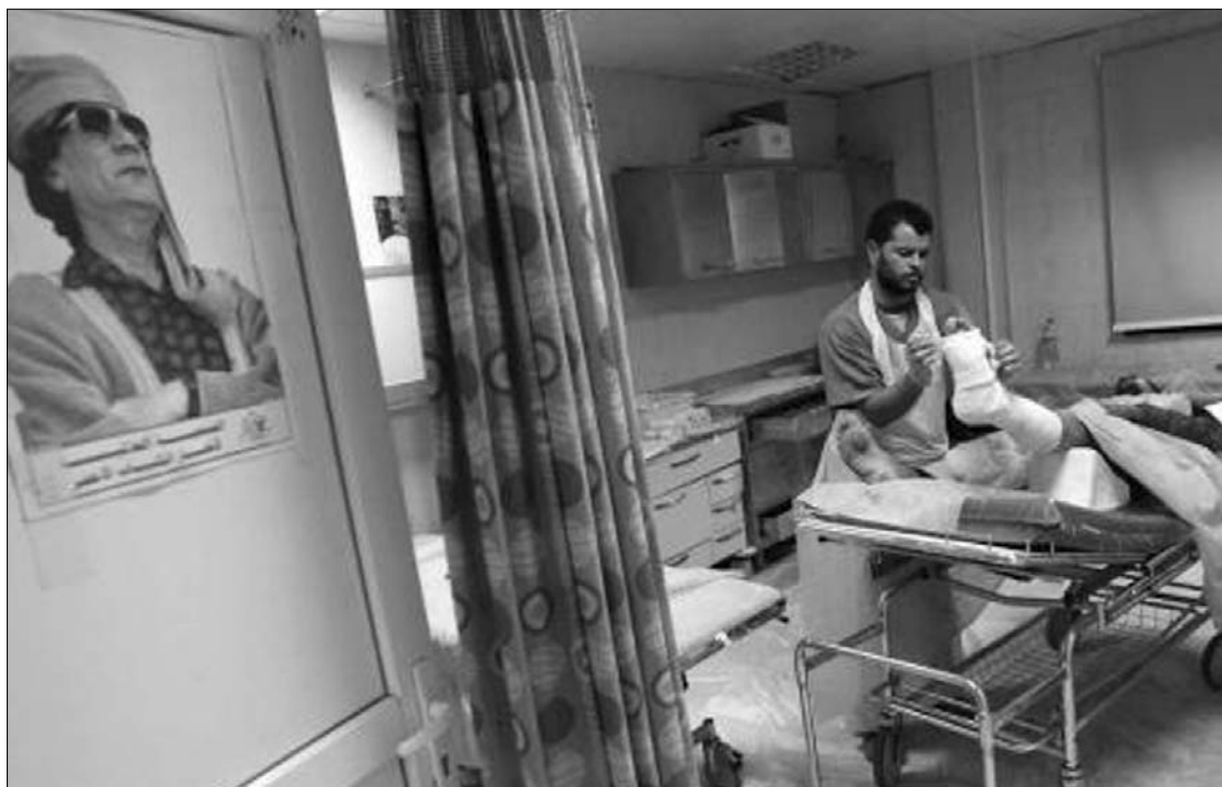
Csúcsgorgalom Tripoli kórházaiban. Moammer el-Kadhafi fényképét még a műtőkben is kihelyezik

Bengázi képviselői nem azt kérik, hogy őket fogadják el a líbiaiak egyetlen törvényes képviselőjeként a rendezési tárgyalásokon, hanem tekintsek őket is legitím partnereknek – válaszolta Szergej Lavrov orosz külügyminiszter tegnap az Interfax hírügynökség kérdésére. Lavrov, aki hétfőn találkozott a líbiai ellenzék képviselőivel, hozzátette: Bengáziban pontosan értik, hogy a líbiai válság rendezését célzó tárgyalásokon másoknak is részt kell venni, például a hivatalos Tripoli és az ország további régiói képviselőinek.