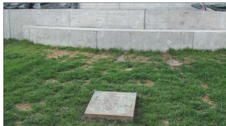
A szobor előtti tábla a Funar-korszakot idézi Kolozsváron

elő. A plakett hasonlít a Gheorghe Funar polgármester idején elhelyezett táblához. 8. oldal ▶