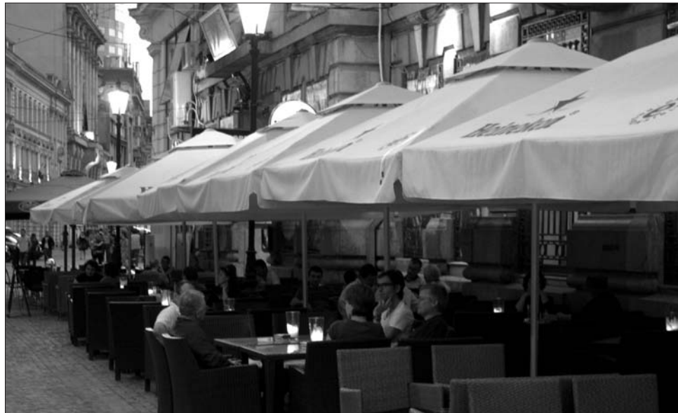
Ha életbe lép a törvény, este tíz után már nem szólhat a zene az utcai teraszokon

Ha a törvényhozás elfogadja a jogszabályt, akkor a jövőben este tíz után csak akkor lehet zenés rendezvényt szervezni, ha ahhoz a közelben élők írásos beleegyezését adták. Ha a családi rendezvényeken hangos zenéléssel mulatják az időt a résztvevők, akkor az ünneplés módjához a szomszédok beleegyezésére is szükség lesz. A szigorítás kiterjed a szabadtéri alkoholfogyasztásra is: az elképzelés szerint a közterekről teljesen kitiltanák az italozást, így nem lehet majd kocintani a parkokban, stadionokban sem. Azt, aki nyilvános helyen önvédelmi eszközzel „felfegyverkezve” jelenik meg (vagyis konyhakést, gázsprayt tart magánál vagy a tulajdonában lévő gépkocsiban) a jogalkotó hat hónaptól öt évig terjedő sza-