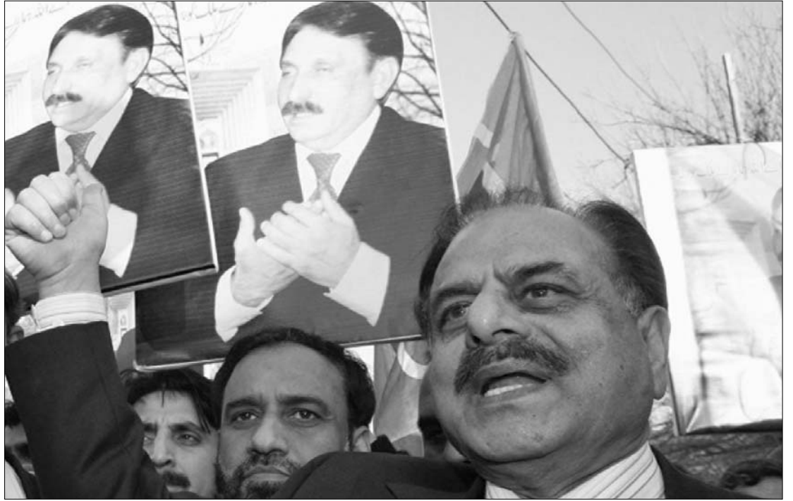
Hamid Gul korábbi pakisztáni titkosszolgálati vezető cáfolja a hírt. Cinikus vélemények szerint legalább Gul életben van

Az afganisztáni kormány megdöntéséért harcoló tálib mozgalom egy szóvivője azonban cáfolta és minden alapot nélkülözö-