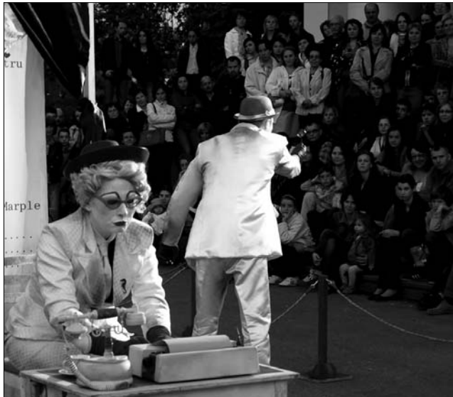
A fesztivál „sztárvendége” a Masca társulat volt