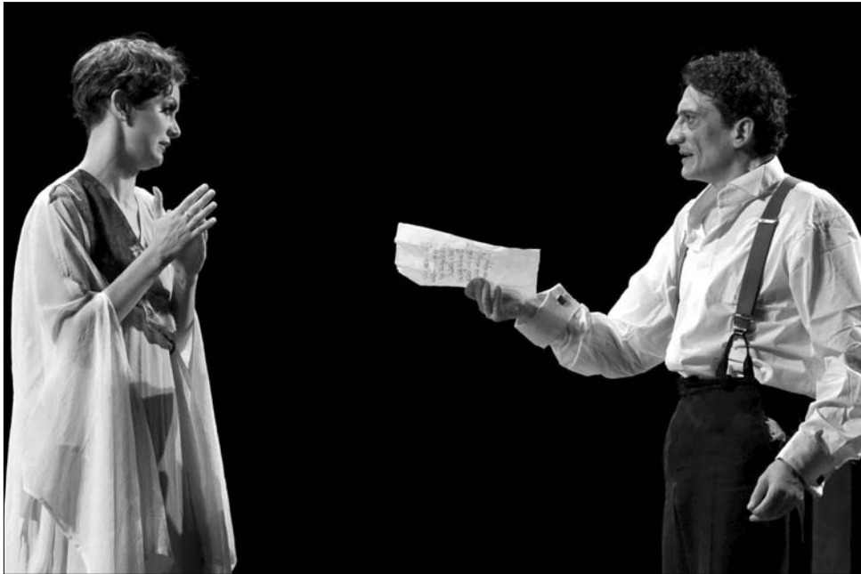
A sepsiszentgyörgyi társulat Moliér Mizantropia című emlékeztető színpadi változatát mutatta be