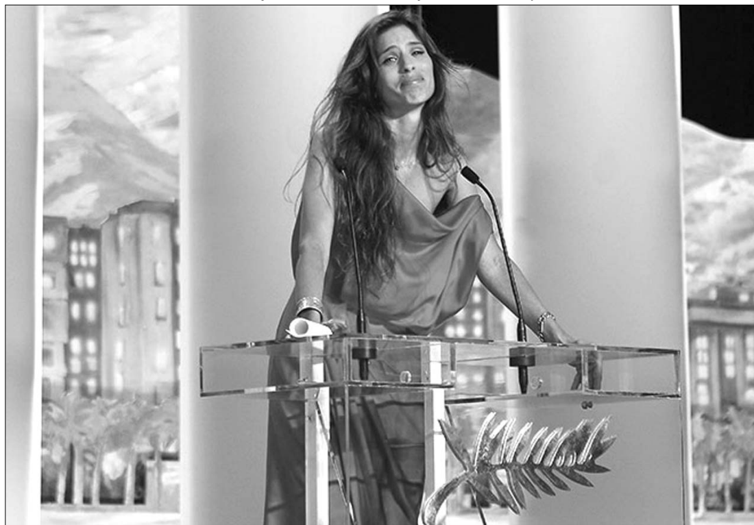
Maiwenn Le Besco francia színész-rendezőnő a zsűri díját vehette át a 64. Cannes-i Filmfesztiválon.

A féltékenységéről ismert rendező nem jelent meg a díjátadón, az Arany Pálmát producere, Bill Pohlad vette át Jane Fonda ame-