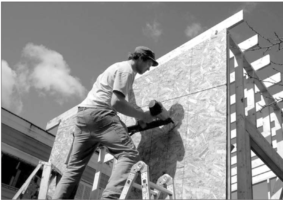
Jelenleg az építőipar az alkalmazások bajnoka, de kérdés, meddig tart a szezonális hatás a szektorban

Mint ismeretes, az új jogszabály mindenekelőtt a feketemunka felszámolását célozza meg, amelyet a kormány úgy kíván elérni, hogy tekintélyes pénzbírságot, bizonyos esetekben pedig börtönbüntetést helyezett kilátásba illegális foglalkoztatás esetére. Hogy a törvénynek még nagyobb nyomtatékot szerezzenek, a munkaügyi felügyelőségek május elején nagyszabású ellenőrzéseket indítottak országszerte. Bár nem tagadják, hogy az ellenőrök határozott fellépése, illetve a szankcióktól való félelem sarkallt sokakat arra, hogy munkamegállapodásukat „kifehérítse”, a közgazdászok óvnak attól, hogy a szédületesen növekvő szerződéskötésekben a fellendülés jegyeit vagy a feketegazdaság visszaszorulását lássuk. Az adatok szerintük elsősorban