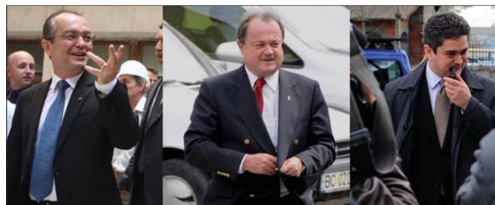
A PD-L elnökaspiránsai: Emil Boc, Vasile Blaga és Theodor Paleologu

Emil Boc kormányfő és Vasile Blaga főtítkárr, volt belügyminiszter között dől el, a harmadik induló, Theodor Paleologu volt művelődésügyi miniszter csak színesíti a mezőnyt. 3. oldal ▶