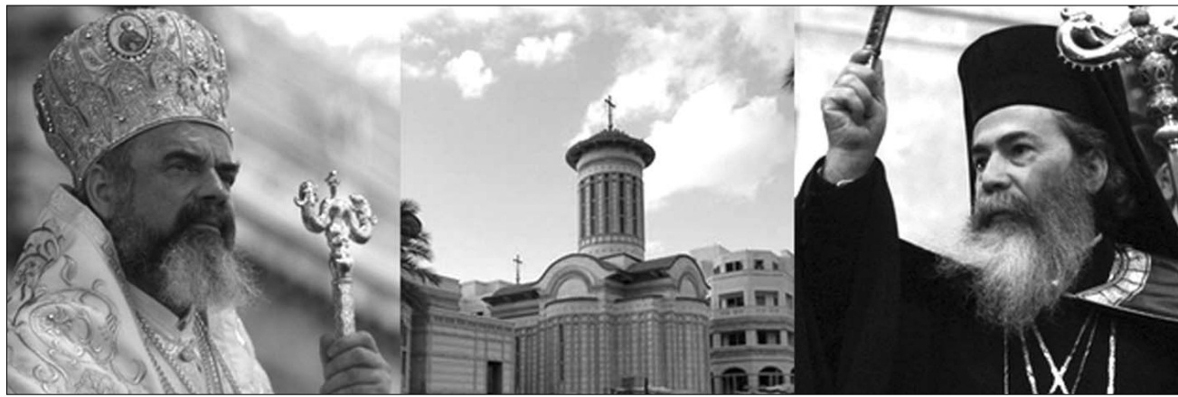
A szembenálló „ortodox testvérek”: Dániel és III. Theofil patriárka – közöttük a vita tárgyát képező jerikói román templom