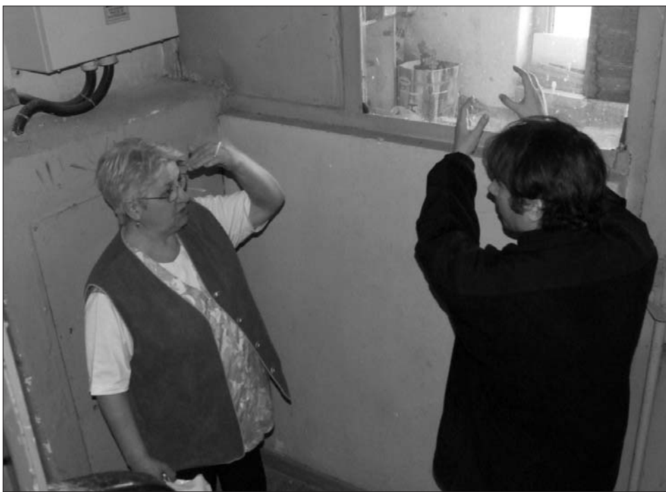
Akna helyett kamra. A kolozsvári tömbházak egy részében „befalazták” a szeméttárolókat