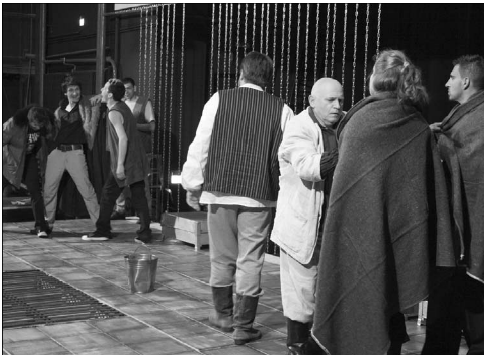
A Közellenség című előadást mutatják be holnap a felújított nagyváradai színházban

Heinrich von Kleist Kohlhaas Mihály című elbeszélésének egy újabb átíratát készítette el Tasnádi István Közellenség címmel. Kleist művéből többben is készítették színpadi darabot, többek között Sütő András Egy lócsi-szár virágvasárnapja címmel. Tasnádi Csaba a Nyíregyházi Móróc Zsigmond Színház igazgatója és főrendezője életének egyik felemelő és fontos pillanataként határozta meg, hogy a régi ragyogását visszanyert nagyváradai színházban elsőként rendezhetett. Dimény Levente, a társulat művészeti vezetője úgy nyilatkozott, hogy a társulat jól megtalálta magát ebben a produkcióban, a színészek is maximálisan telje-