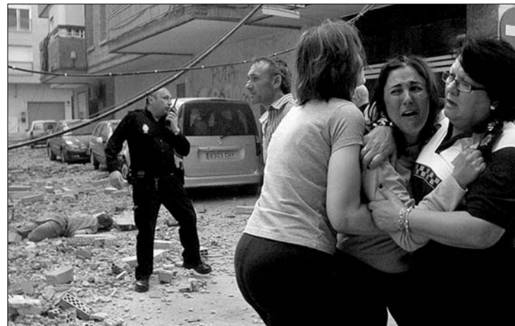
Rémületben Spanyolország. Öt és fél évtizede nem volt arrafelé földrengés

A mentési munkálatokban mintegy ezerkét száz katona, rendőr és polgári védelmis vett részt. A csaknem százezer betegét számláló Lorca kórházát is ki kellett üríteni, a betegeket egy tábori kórházban, sátrakban helyezték el. Ramón Luis Valcárcel Murcia tartomány főnöke kezdeményezte, hogy a vidéket nyilvánítsák katasztrófásüjtöttnek. ◀