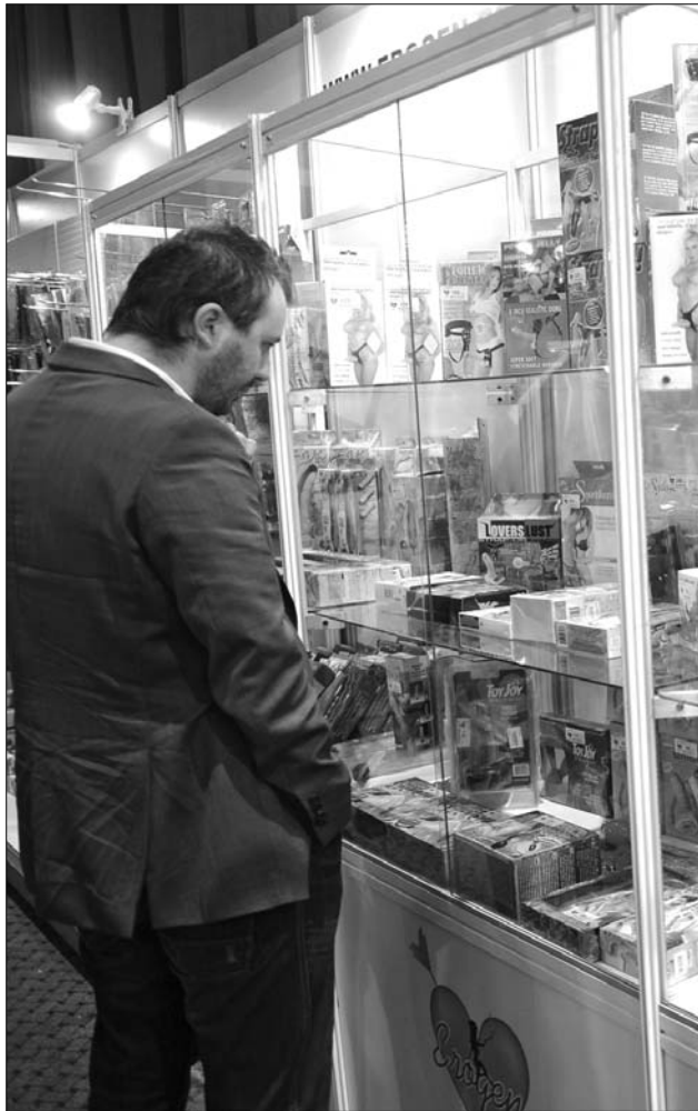
Az érdeklődők szexuális segédeszközöket is vásárolhatnak

Egy belépőjegy ára a rendezvényre 40 lej.