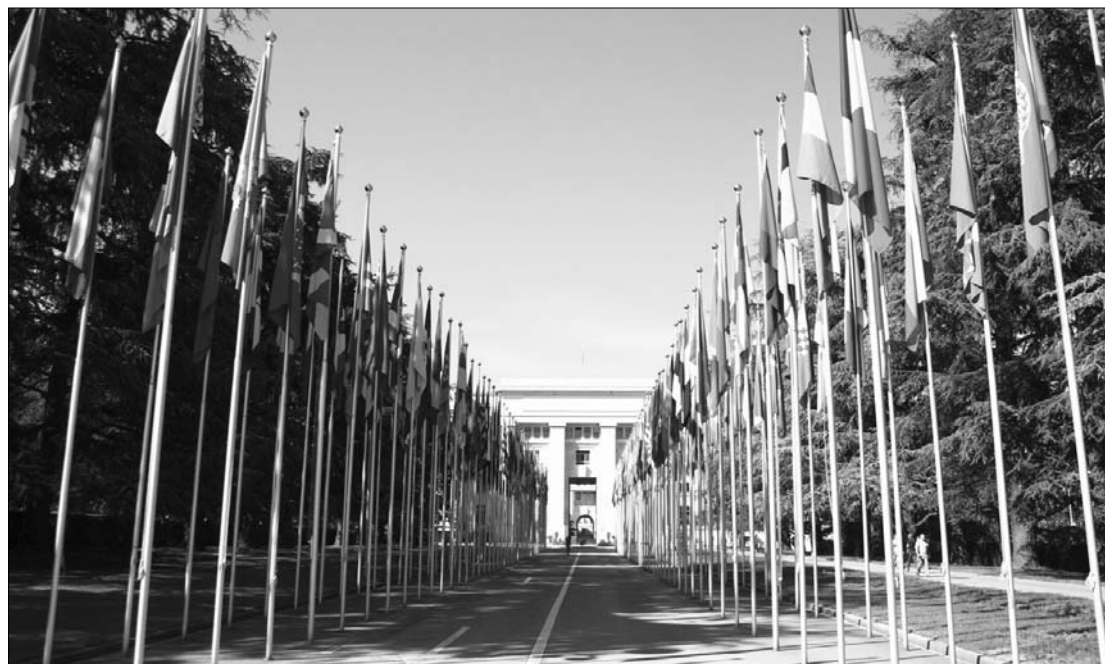
Eredetileg a Népszövetség számára épült az ENSZ genfi otthona. Magyarországot most kérdőre vonták

Svájc képviselője elfogadhatatlannak nevezte a romák megfélemlítését és azokat az erőszakos cselekedeteket, amelyeket egy szélsőjobb oldali milícia követett el Gyöngyöspatán. Elismerve, hogy az Orbán-kormány már tett lépéseket ez ügyben, ennek ellenére azt javasolta, Budapest vizsgálja felül büntetőjogi szabályozását a nemzeti, vallási és etnikai kisebbségek védelme érdekében. Franciaország küldötte is üdvözölte, hogy Magyarország lépéseket tett a roma kérdés kezelésére, de kijelentette, aggodalmat kelt, hogy romák a közelmúltban is szélsőséges félkatonai csoportok