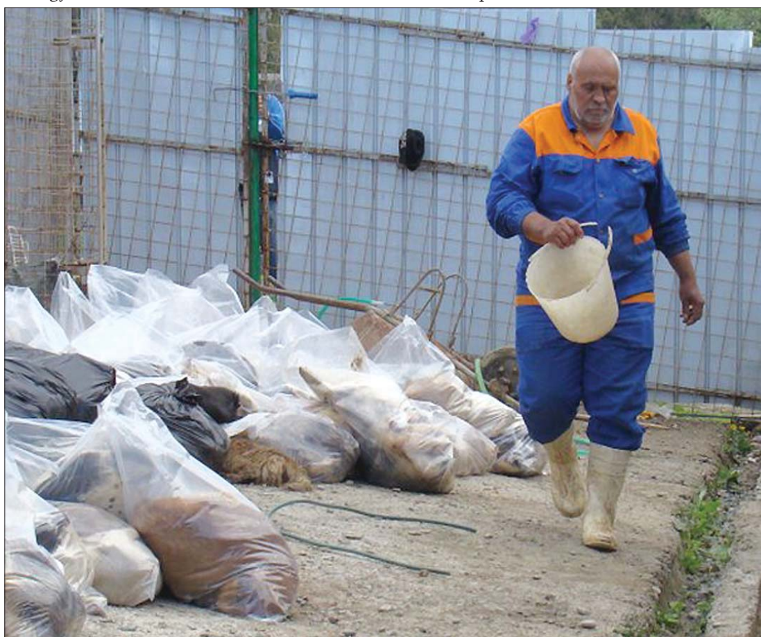
A menhely gondnokai azt állítják, fertőzés terjedését akarták megakadályozni az öldökléssel

városban is kivégeztek már olyan ebeket, amelyekről nem tudtak vagy nem akartak gondoskodni az illetékesek. Kelemen Atilla RMDSZ-es képviselő, kinológus azt állítja: uniós botrány a romániai kóbor kutya probléma, amelynek megoldásáért szerinte az önkormányzatok a felelősek. 7. oldal ▶