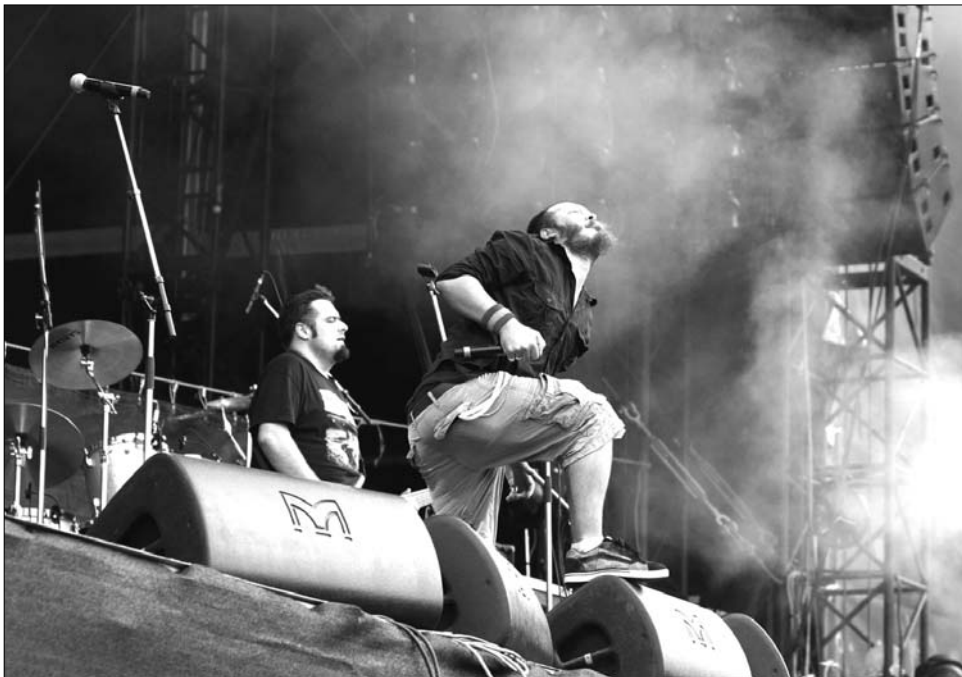
A Kolozsvár Napok egyik sztármeghívottja a Luna Amară együttes lesz

„A Kolozsvár Napok hiánypótló rendezvény, szinte minden hazai városnak van már hasonló rendezvénye, ez eddig a városunk életéből hiányzott. A szervezőcsapat igyekezett olyan programot összeállítani és ezeknek megfelelő tereket választani, hogy valamennyi korosztály megtalálja a számára leg-