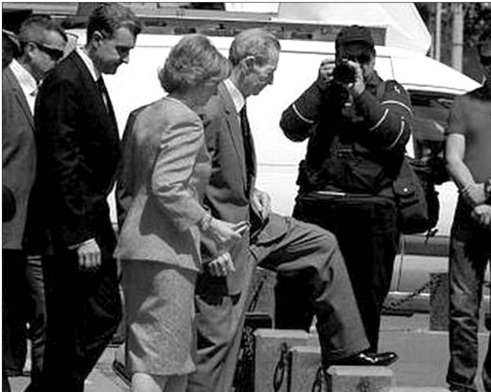
Mihály király határozott fellépését május 10-re, a királyság napjára időzítette

A királyi házhoz közelálló személyek, avatott történészek szerint I. Mihály döntését leginkább az magyarázza, hogy a férfi utóddal nem rendelkező ex-uralkodó így próbálja megnyitni az utat a trónra lépés felé lánya, Margit hercegnő előtt. A száli törvények értelmében ugyanis a trón csakis férfiágon öröklhető. ◀