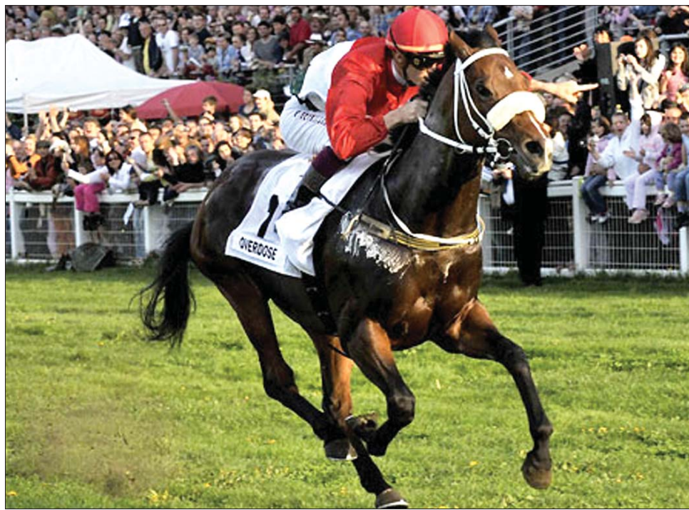
Overdose nagyon rangos mezőnyben bizonyíthatja erejét a következő versenyein

ből. A Temple Stakesen kiváló sprinterek, többek között Markab, Sole Power, Borderlescott, Kingsgate Native és