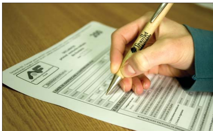
Idén az ívek kitöltése bonyolultabb a tavalyi eljárásnál

A tavalyi jövedelmek bevallásának hétfői, május 16-i határideje egyre jobban sűrgeti a bérlemből élő, mezőgazdasági alkalmazásban álló, valuta-tranzakciókkal vagy értékpapír-forgalmozással tevékenykedő, illetve szabadfoglalkozású magánszemélyeket. Az érintetteknek mindössze három munkanapnyi idejük maradt arra, hogy az Országos Adóhatósághoz (ANAF) eljuttassák az úgynevezett 200-as jövedelembevallási ívet – ellenkező esetben 10 és 100 lej közötti büntetéssel