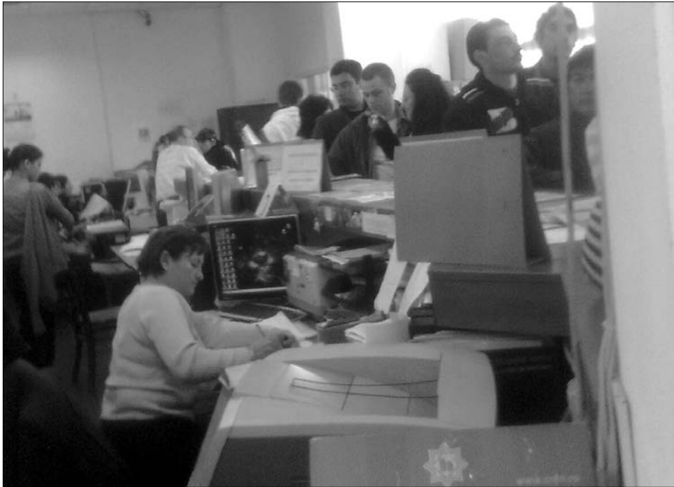
Bár az adóhivatalok felkészültek az ostromra, tavaly is legtöbben postai úton „vallottak” jövedelmükről