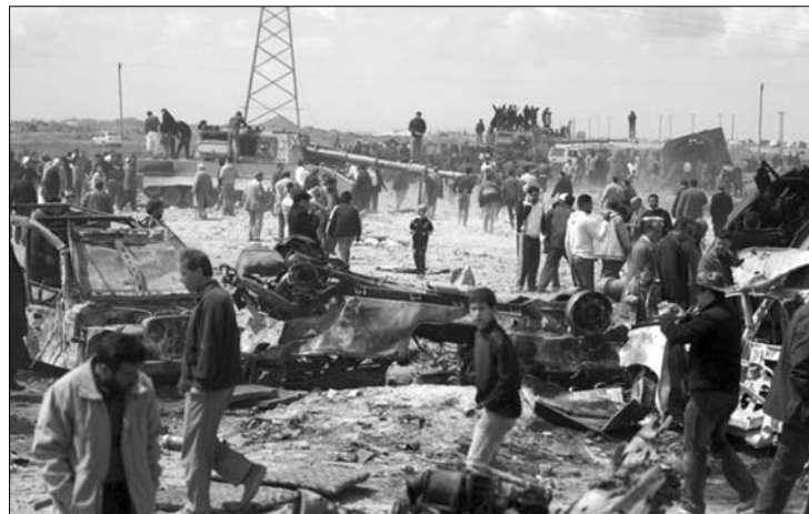
Zarándokhely Bengáziban. Körbejáráják a Kadhafi erők kilőtt tankjait

politikai főképviseletje. Catherine Ashton hozzátette: az EU ezután is nyújt katonai támogatást a líbiai lakosságot célzó humanitárius akciókhoz. Közben Washingtonba érkezett a líbiai felkelők által létrehozott nemzeti átmeneti tanács két vezetője, hogy segítséget kérjen, illetve tájékoztatást nyújtson a líbiai helyzetről. A külügyekkel megbízott Mahmúd Dzsibril tegnap megbeszélést folytatott John Kerry szenátorral, az amerikai szenátus külügyi bizottságának elnökével, és az amerikai fővárosba várják Ali Tarhúni pénzügyi felelőst is, aki az amerikai pénzügyminisztériumban és a kongresszusban a felkelők hitelkérelméről tárgyal. Nehéz harcok után a felkelők tegnap elfoglalták Miszráta repülőterét, és sok zsákmányt ejtettek a viszályos kormánycsapatoktól – jelentették a hírgyűnőségek. ◀