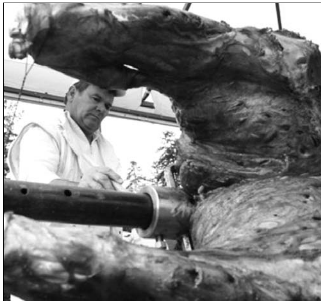
Az esős idő miatt kevesebbet árultak a laci-konyhák.

– Ezt a darabot olyan színházakba tudjuk elvinni, ahol rendes nagyszínpad van, mert szükségeltetik a nézőtér is. Reményeink szerint elvisszük Székelyudvarhelyre, Csíkyszeredába, tehát a környékre, de bejelentkeztünk egy fesztiválra is és valószínű, hogy a továbbiakban is játszani fogjuk, átvisszük majd a következő évadba is.