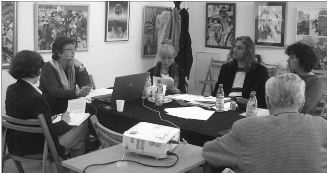
Médiaműhely Marosvásárhelyen. A Divers Egyesület szerint a hazai sajtó nyelvezete nem gyűlölködő A szerző felvétele

A romániai újságcikkek zömében objektívek, ha cigányokról vagy zsidókról van szó, az utóbbi két évben sokat változott a sajtó viszonyulása ezekhez a kérdésekhez. Figyelnek a nyelvezetre, a különböző megnevezésekre, a kifejezések használatára. A kommenteket viszont rasszista, antiszemita nyelvezet jellemzi – derült ki a Holokauszt oktatása az iskolában című marosvásárhelyi műhelybeszélgetésen.