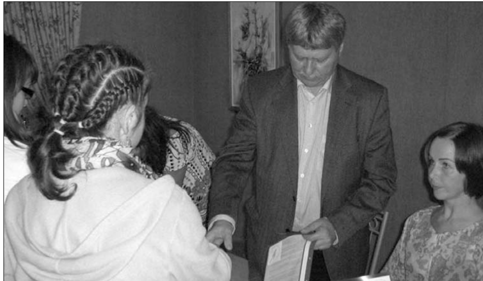
A Dr. Verestóy Attila Alapítvány kezdeményezésének mottója: „Segíts, hogy változzon! Légy önkéntes!”