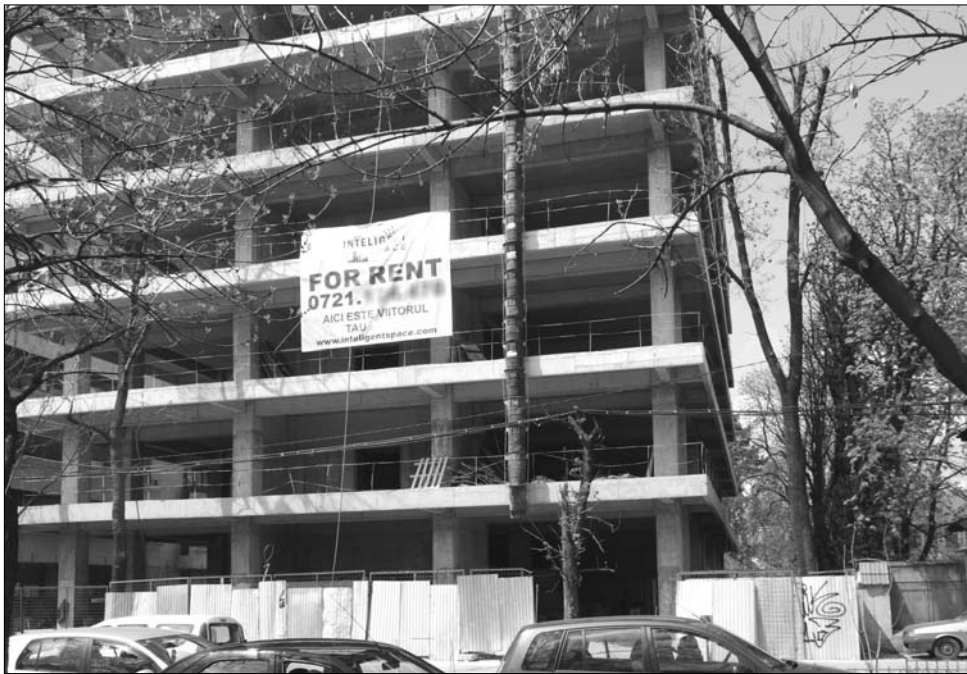
A foghíjas infrastruktúra nemcsak az ingatlanpiacot, de az építőipart is pangásra ítéli

Mindennek ellenére – mint kiderült – a kolozsvári lakásügynökségek sincsenek jelenleg irigylésre méltó helyzetben. „Az utóbbi időben nagyon kevés lakást sikerült eladni, ennek köszönhetően enyhe árcsökkenés érezhető: az idei év első három hónapjában az ingatlanokat általában 4,7 százalékkal olcsóbban lehetett megvásárolni tavalyhoz képest” – tudtuk meg a kolozsvári Maxintermedia egyik munkatársától. Az árzuhanás lakónegyedről, az ingatlan típusától, illetve építési évtől függetlenül minden lakásra érvényes. Az ingatlanpiacot az elmúlt években