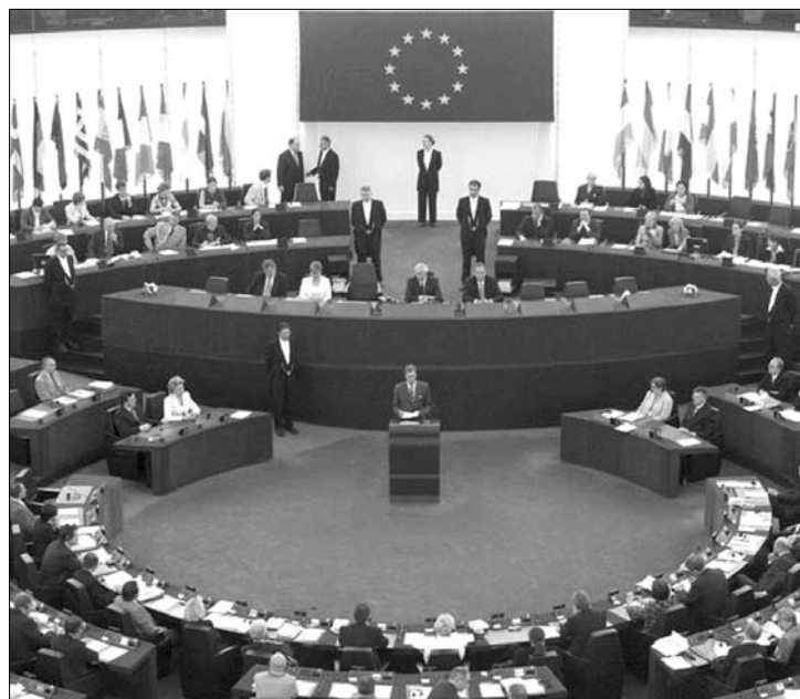
Az Európai Parlament Strasbourgan. Állandó napirenden van Magyarország

A magyar szocialista Göncz Kinga szövé tette, hogy az uniós végrehajtó testület nem szólalt meg akkor, „amikor Magyarországon heteken keresztül paramilitáris csoportok tartották félelemben a roma lakosokat Gyöngyöspatán és a magyar kormány csak akkor lépett, amikor a feszültség és a provokáció erőszakba torkollott”. Göncz szerint „most még nem késő változtatni” és kérte Viviane Reding igazságügyi EU-biztos megszólalását ezekben az ügyekben. ◀