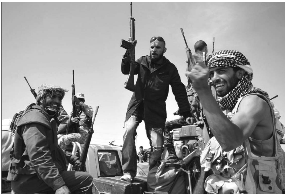
Felkelők ünnepelnek Adzsábijában. Sokat jelent Moammer el-Kadhafi ellenzékének a NATO légi támogatása

A NATO a líbiai elnök tripoli főhadiszállását bombázta