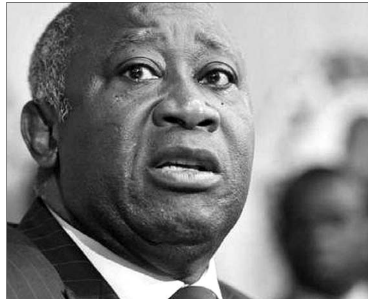
Laurent Gbagbo elrejtőzött. A leváltott államfő állítólag a távozásról tárgyal

Oroszország sürgős tájékoztatást kért az ENSZ Biztonsági Tanácsától, hogy az ENSZ-békefenntartók miért avatkoztak be az elefántcsontparti harcokba – jelentette ki tegnap Moszkvában Szergej Lavrov. A külügyminiszter újra állást foglalt amellett, hogy az afrikai problémákat, így a líbiai és az elefántcsontparti helyzetet külső beavatkozás nélkül maguknak a közvetlenül érintetteknek kell megoldaniuk. ◀