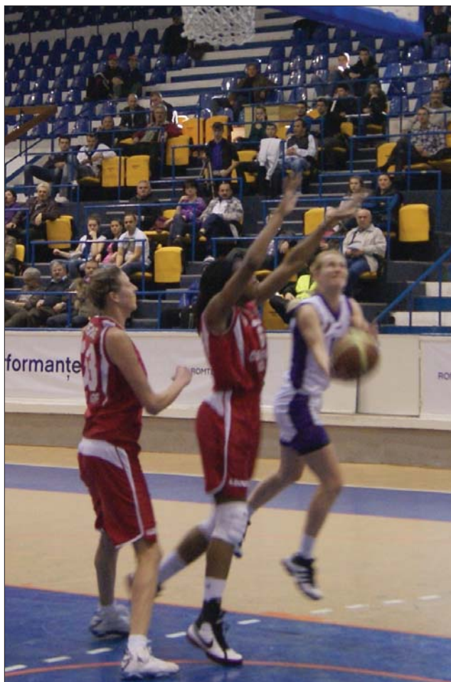
A szatmári lányok (fehér mez) kétszer is legyőzték a Temesvárt

Csütörtökön és pénteken a marosvásárhelyi sportcsarnok látja vendégül a férfi-Román Kupa négyesdöntőjének résztvevőit. A Final Four első napjának programja a Steaua-Turabo–CSU Asesoft Ploiești-találkozóval indul (18 óra) és a BC Mureș-