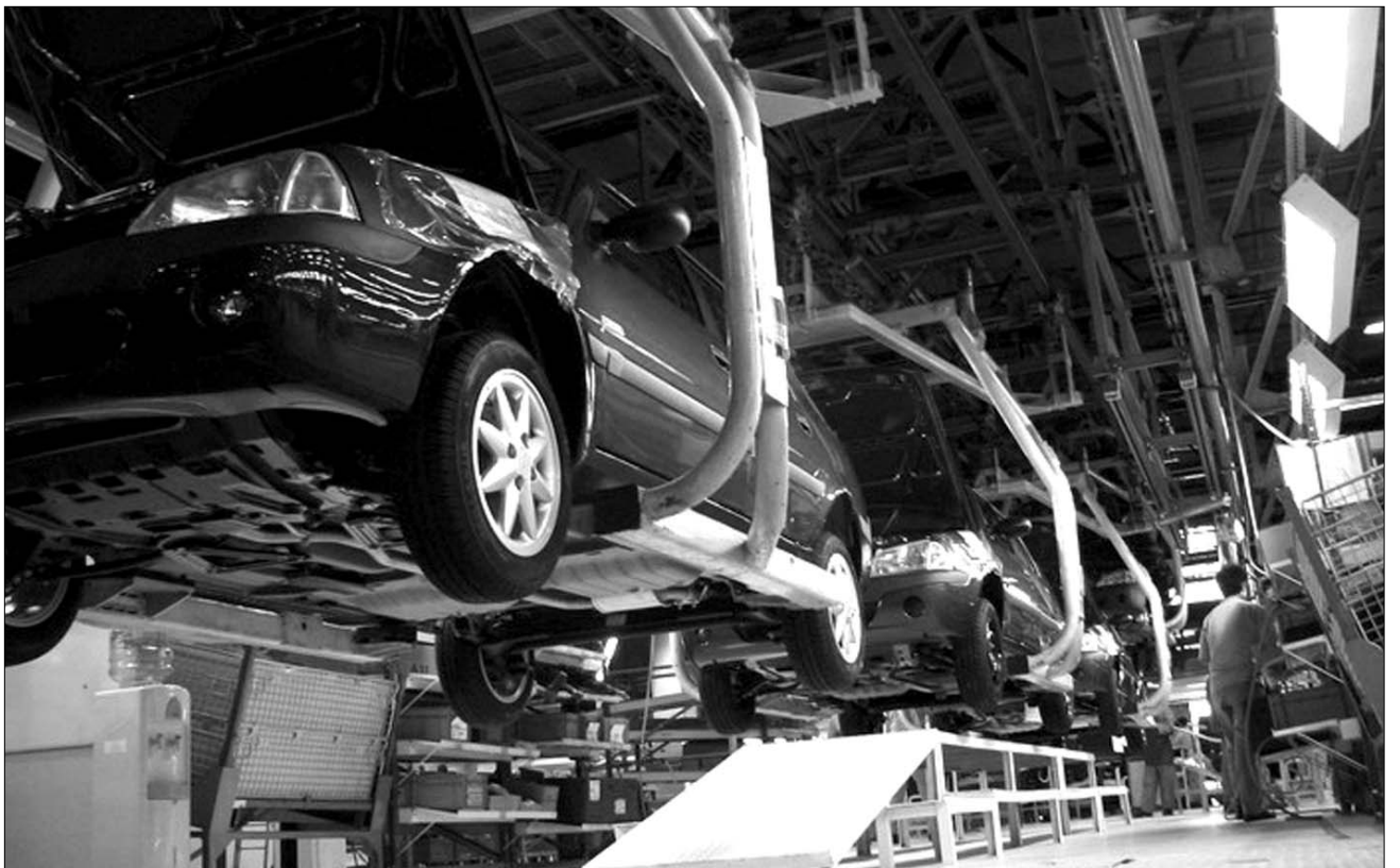
Nem kizárt, hogy hamarosan környezetkímélő autók is legurulnak a mioveni-i gyártószalagról