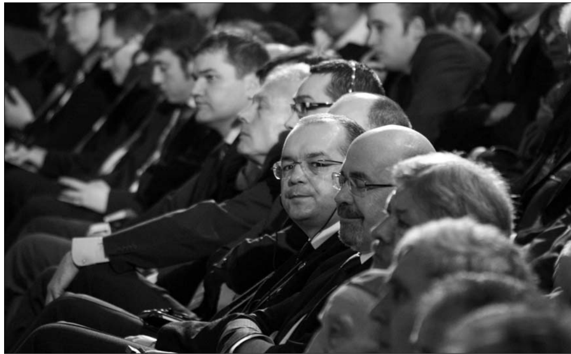
Harcosban. Emil Boc kormányfő az RMDSZ-es honatyákat is „megszerezte” a felelősségvállaláshoz

Daniel Funeriu oktatásügyi miniszter tegnap válaszolt a lemondását kérő honatyáknak, szerinte akkor kell felállni a bársonyszékből, amikor „nem tudod megoldani a problémákat”. Hozzátette: ez az ő esetében nem áll fenn, ugyanis a tanári béreket szabályozó törvénytervezet „az utolsó száz méteren van”. A bírósági úton megnyert fizetésemelésekkel kapcsolatban megjegyezte, hogy ezeket részletekben folyósítják majd 2012-től kezdődően. A Demokrata-Liberális Párt (PD-L) honatyái a miniszterelnöktől kérték Daniel Funeriu menesztését, szerintük a tárcavezető megnyilvánulásai rossz fényt vetnek a pártra. ◀