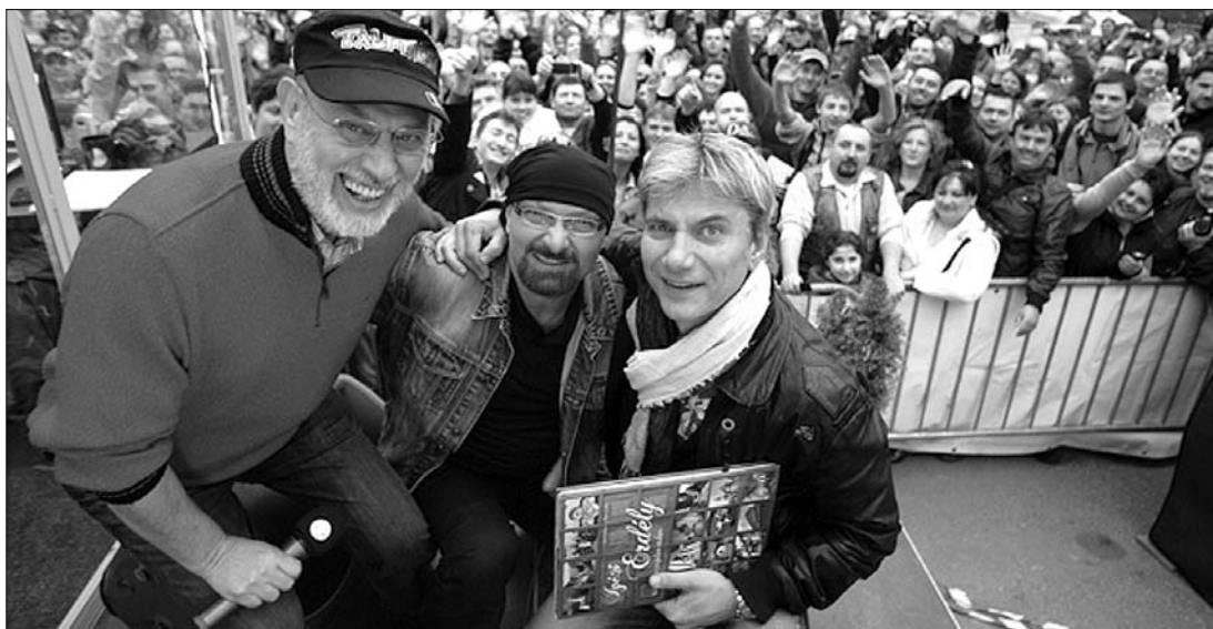
A Bumeráng sztárjait és reggeli műsorát lelkes közönség fogadta Nagyváradon. Állításuk szerint az első nem az utolsó

„Lelkesebbek, őszintebbek, vidámabbak erre az emberek, kevesebb a panasz, itt nem ciki szeretni egy produkciót, míg a magyarországi közönség valahogy mindent fásult apátiával szemlél” – dicsérték meg délelőtti sajtótájékoztatójukon a nagyváradi rajongókat a bumerángosok. A sajtótájékoztatón elhangzott: a magyarországi kereskedelmi rádió műsorai Nagyváradon is foghatók, így rengeteg SMS érkezett az idők fo-