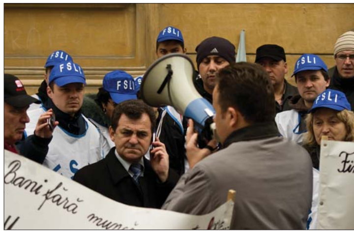
A tanárok a bíróságon és az utcán is követelték jogaikat

báltak érvényt szerezni jogaiknak – döntött tegnap a legfelsőbb bíróság. A kormányfő szerint a hátralekötök folyósítása a gazdasági helyzet javulásától függ. 3. oldal ▶