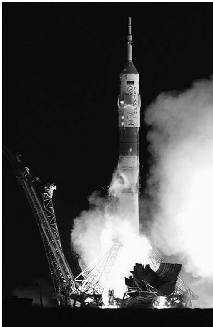
Rajt Bajkonurból. Először neveztek el személyről egy orosz űrhajót

A szovjet-orosz kozmoszkutatás történetében először neveztek el űrhajót: a közép-európai idő szerint tegnap hajnalban Bajkonurból újtárra indult Szojuz TMA-21 űrhajó oldalára az április 12-én fél évszázada a Vosztok-1 fedélzetén első emberként az űrbe indult Jurij Gagarin nevét festették. A Gagarin űrhajó két nap alatt éri el az ISS Nemzetközi Űrállomást, fedélzetén Alekszandr Szamokutyajev és Andrej Boriszenko orosz, valamint Ron Garan amerikai űrhajóssal. Szamokutyajev és Boriszenko először jár a világűrben, Garan pedig 2008-ban a „forgalomból” nemrég kivont Discovery űrrepülőgépen már tett űrutazást. A három űrhajós az ISS 27. expedíciójának három tagjához, az orosz Dmitrij Kondratyevhez, az olasz Paolo Nespolihoz, az Európai Űrügynökség űrhajóssához és az amerikai Catherine Colemanhoz csatlakozik, hogy 164 napot töltsön az űrállomáson, hogy szeptember 16-án visszatérjen a Földre. A Gagarin szokatlan megbízást is teljesít majd: április végén körülrepüli az űrállomást, hogy fényképeket készítsen róla, amikor hozzá van kapcsolódva az Endeavour amerikai űrkomppal. Az űrhajó rakományában van egyebek között egy ikon, amelyet Kiriill pátriárka, orosz ortodox egyházfő küld az űrállomásra. ◀