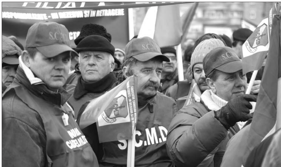
A szakszervezetek 50 ezer embert várnak holnapra a parlament épülete elé