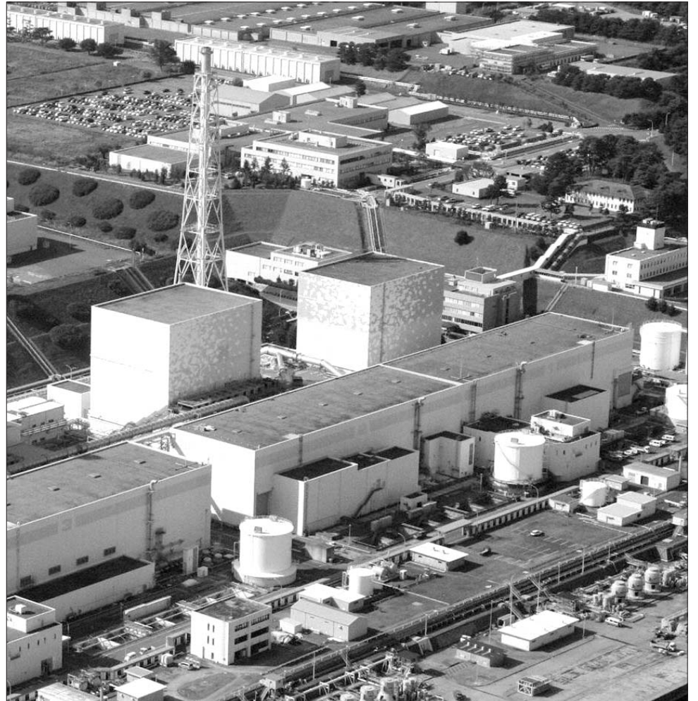
A gazdaság hamar talpraáll, de az atomerőművekre örök árnyékot vethet a japán katasztrófa

Japán túlnyomórészt iparra támaszkodó gazdaságát jelenleg az áramkiesés sújtja leginkább, így még azok a gyárak sem tudnak teljes kapacitással dolgozni, ahol nem történt pusztítás. Tegnap a Nissan, Toyota, Mitsubishi és Honda autógyárak bejelentették, hogy a következő napokban szüneteltetik összes japán egységükben a termelést. Az ipar egyik legnagyobb vesztese a Sony: értékpapírjai 9,1 százalékot estek tegnap a börzén. Nem kizárt, hogy az elektronikai felszerelések piacán az okostelefonok és táblagépek is megsínylik a