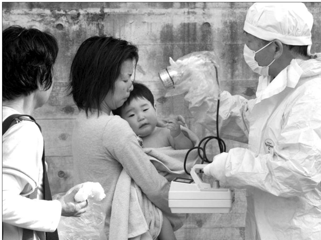
Hirosima országában nagy a félelem a nukleáris szennyezéstől. Az emberek még a gyerekekre is maszkot adnak

A kínai kormányfő részvételt fejezte ki a japán népnek, és további támogatást ígért az országnak tegnap az Országos Népi Gyűlés zárónapjának nemzetközi sajtókonferenciáján. Ven Csia-pao utalt arra, hogy Kína is olyan területen fekszik, ahol gyakoriak a földrengések, ezért megérti azt a nehézséget, amelylyel most Japán küzd. Tokió ugyanakkor arra kérte az Európai Uniót, hogy egyelőre ne küldjön több szakértőt, felszerelést vagy segélycsapatot a földrengés és cunami sújtotta szigetországba. ◀