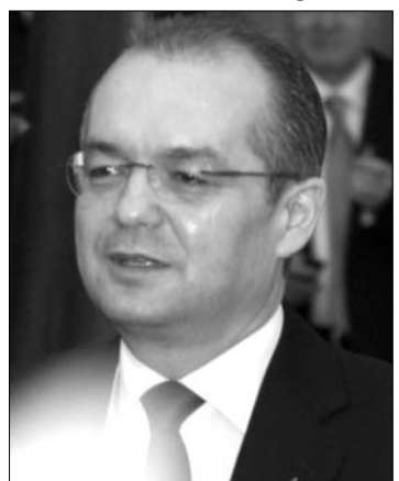
Emil Boc jelenlegi pártelnök kihívója Vasile Blaga főtítkár lehet

A PD-L választási szabályzata szerint a pályázóknak a tisztújítás előtt egy hónappal 35 aláírással megtámogatott programtervet kell benyújtaniuk. Blaga már jelezte, hogy ösztöregyűjtötte a támogatásokat, legismertebb közülük Radu Berceanu volt közlekedési miniszter. Emil Boc indulását az alakulat számos vezető politikusa támogatja. ◀