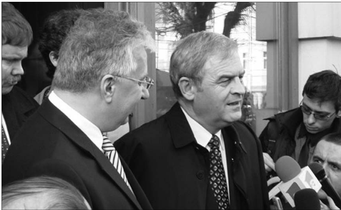
Semjén Zsolt és Tőkés László (középen) immár ugyanazon ország állampolgáraiként nyilatkoztak.

„2007-ben Unió Erdéllyel jelszó alatt indultam EP-képviselői mandátumért. Arra gondoltam, hogy Erdély lépjen Unióra Európával, de ugyanakkor a magyar-