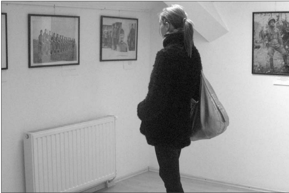
A kiállított fotók a katonák és hozzátartozóik életszeretéről is árulkodnak

A gyűjtemény létrejött egy állandó, rendszeres és következetes munkát jelentett, mondta el lapunknak Ádám Gyula fényképész, a