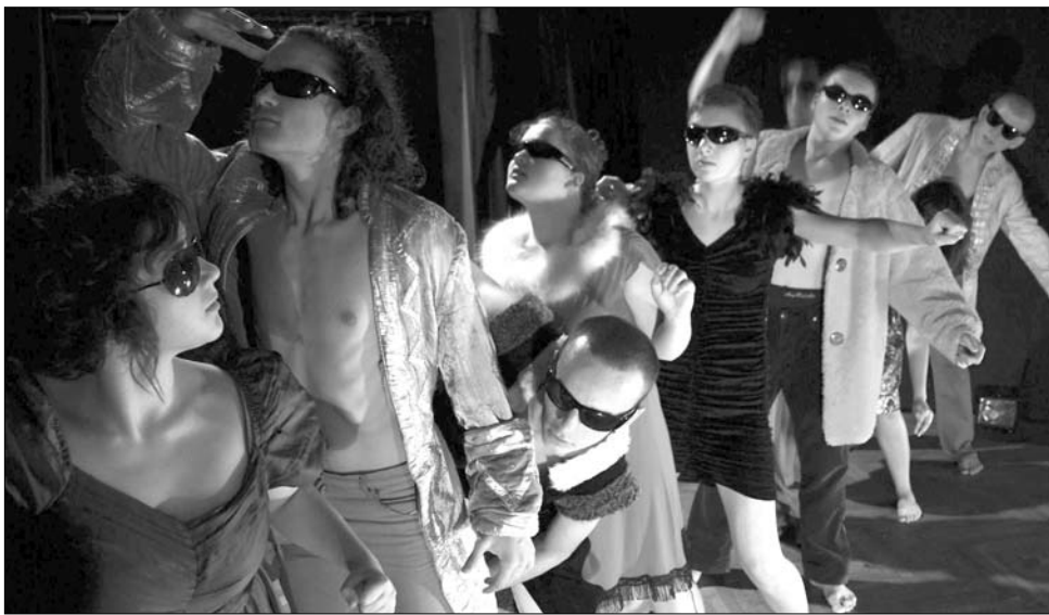
Az amatőr csoportként induló társulat 17 hazai és nemzetközi díjat gyűjtött be.