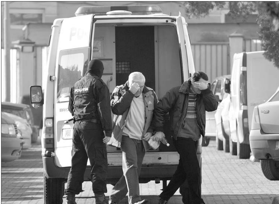
A korruptióellenes ügyészek tegnap több mint száz vámost tuskoltak rabszállító autóbá

A tegnapi hajnali akció ideje alatt a teljes határfogalom leállt néhány órára Temes-