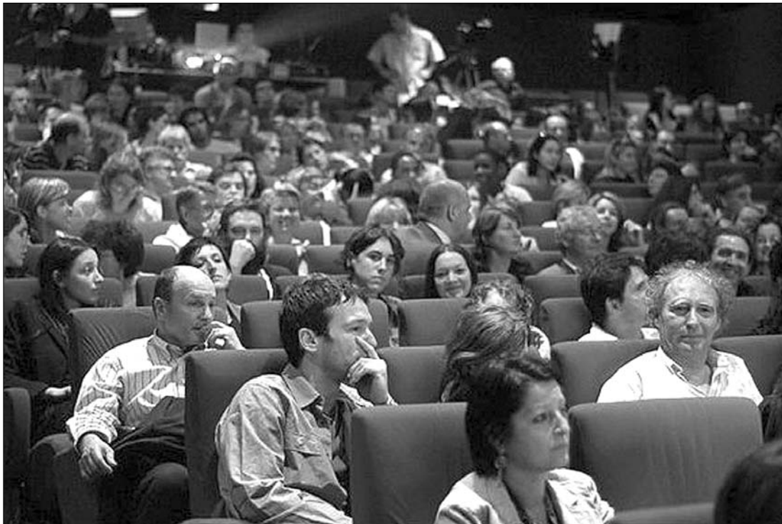
Tavaly a 3D-s vetítések hatmillió nézőt ültettek a mozik bársonyszékébe. Idén még több nézőre számítanak

Tavaly a gazdasági válság ellenére több háromdimenziós látványt nyújtó multiplexet adtak át Romániában – Bukarest mellett Petroszén, Arad és Nagybánya is modern moziot kapott, ezzel az országban több mint száz 3D-s mozi van. A látogatókat kétségkívül ezek vonzzák, a Cinema City kilenc multiplexében (összesen 88 terem) tavaly 3,1 millió néző fordult meg, kétszer több, mint 2009-ben, a Hollywood Multiplex 15 terme pedig 834 207 filmbarátot vonzott. De emellett a CinemaPRO és a hagyományos mozik is jól teljesítettek, közel hatmillióra duzzasztva a mozi-