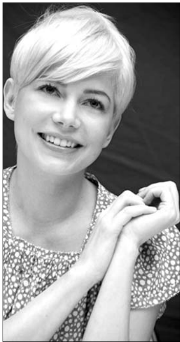
Michelle Williams

Williams jegyese volt (a három éve tragikus hirtelenséggel elhunyt) Heath Ledger ausztrál színésznek és 2005. október 28-án világra jött New Yorkban közös