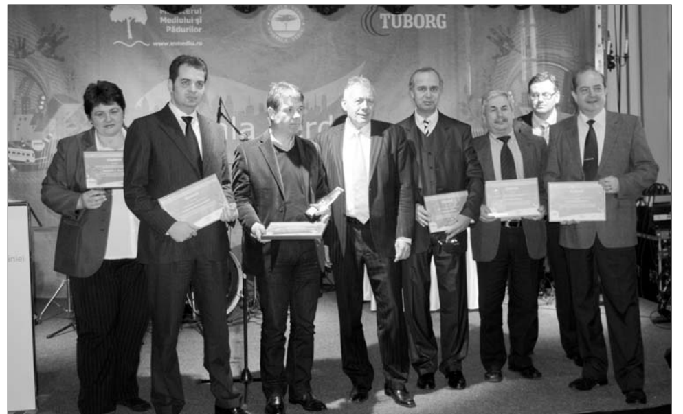
Borbély László miniszter (középen) a díjazott polgármesterek társaságában

Ház program, amely szintén átütő sikert aratott. „Polgármester urak, ne feledjék: az önkormányzat vezetett városoknak ökostratégiára van szükségük” – figyelmeztette az önkormányzati vezetőket a miniszter, aki megjegyezte: Kovászna megye a legmagasabb szinten képviselte magát a rendezvényen, hiszen Antal Árpáddal együtt Tamás Sándor megyei tanácselnök is jelen volt a tegnapi bukaresti ünnepségen. Borbély gratulált a nyerteseknek, és felhívta figyelmüket, hogy a vetélkedőt 2011-ben is megszervezzék. ◀