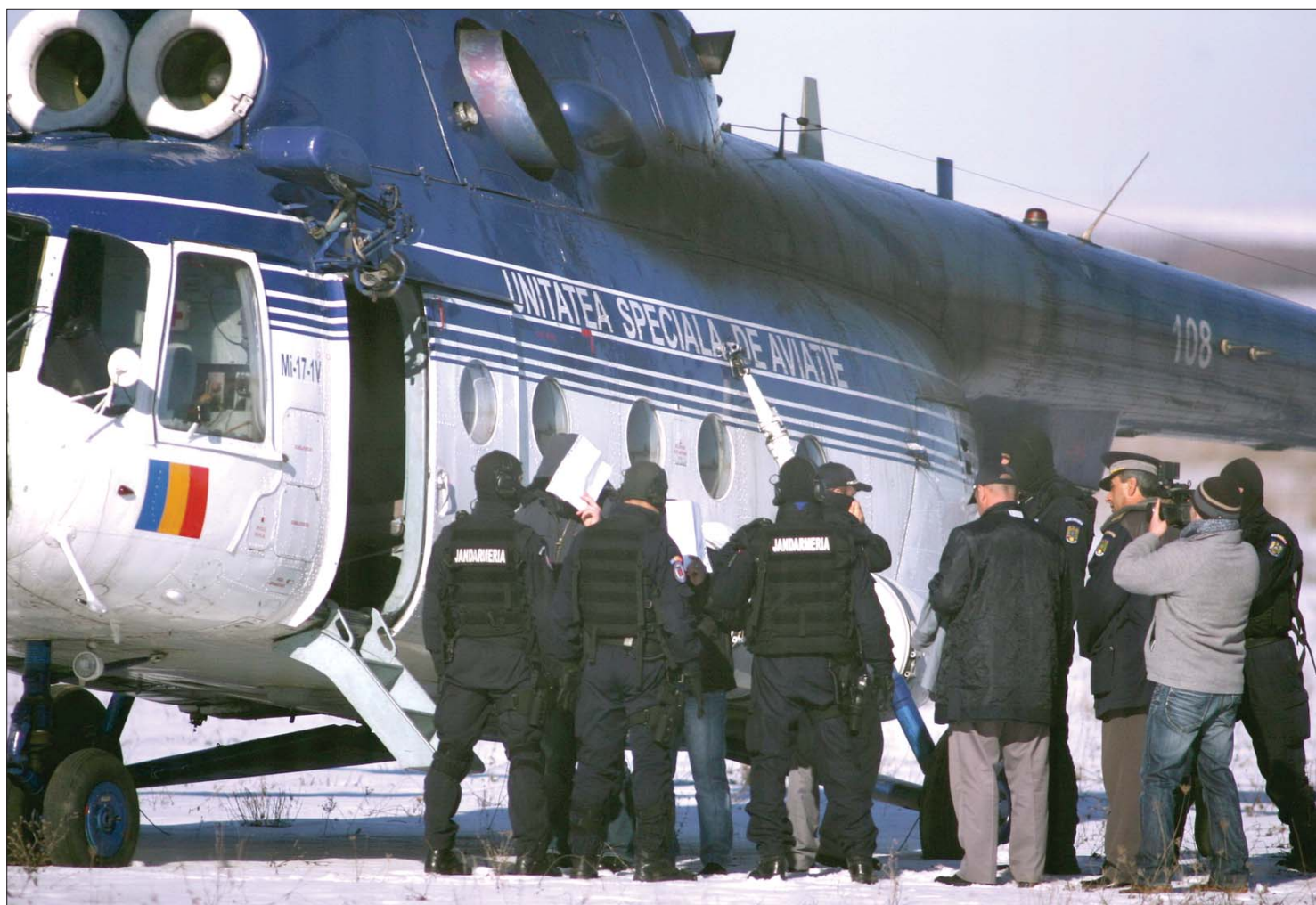
Demonstratív leszámolás? A rajtaiütésben 1200 rohamrendőr vett részt, a határőröket és vámosokat helikopterekkel szállították Bukarestbe

Rajtaiütésszerű akciót hajtottak végre a román–szerb határon a cigarettacsempészek ellen