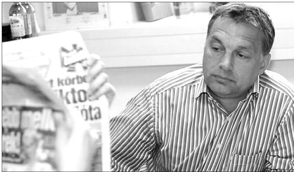
Orbán Viktor. Mit ír rólam az újság?

„A magyar miniszterelnök a rá jellemző magabiztossággal mondta el országértékelő beszédét” – írja a brit Financial Times , amely főként az alkotmányozást és a foglalkoztatás növelésének szándékát emelte ki az Orbán-beszédből. A gazdasági-politikai napilap Orbán gyors változások