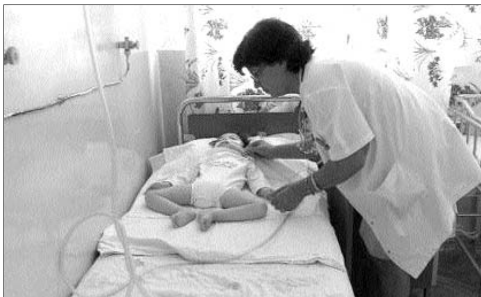
Az ötödik fertőzött gyermeket is átszállították a sloboziai kórházból a bukaresti Matei Balș intézetbe

▶ Az ötödik, rotavírussal megfertőződött gyermeket is átszállították tegnap a sloboziai kórházból a bukaresti Matei Balș járványtani intézetbe, miközben – szintén tegnap – a szaktárca vizsgálatot indított a sloboziai egészségügyi intézménynél. Mint arról hírt adtunk, a dél-romániai Slobozián a helyi kórházban karanténba helyezték el, miután öt gyerek megfertőződött a rotavírussal; közülük négyet már korábban a Matei Balș intézetbe szállították. Az Egészségügyi Minisztérium tegnap arról tájékoztatta lapunkat: nincs nyilvántartás arról, mennyire gyakori az ilyen jellegű megbetegedés.