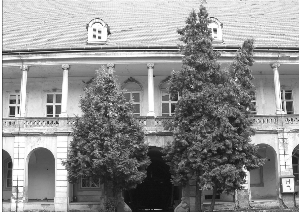
A Kolozsvár központjában álló reprezentatív épület restaurálásra szorul