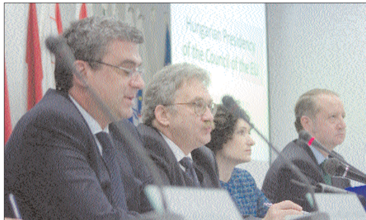
Teodor Baconchi külügyminiszter és Füzes Oszkár nagykövet

▶ „Bízunk Magyarország támogatásában Románia schengeni csatlakozása tekintetében” – fogalmazott tegnap Teodor Bacon-