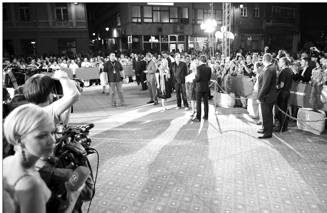
A hétfői Arany Glóbusz-díjak átadásával hivatalosan is elkezdődik a sztárok idei menetelése a vörös szőnyegen

lámokat. Az ősz legnagyobb zenei eseménye kétségkívül a szeptemberi MTV Video Music Awards, mely az 1980-as évek közepén a Grammy-díj mellett új alternatívaként jelent meg, az év legjobb videoklippjeit díjazza. Azóta igen jelentős presztízst tett szert, évről évre hatalmas érdeklődés övezi, ami nem csoda, hisz a Grammy díjátadók tele vannak meglepetésekkel, itt láthattuk például az emlékeztető csókot Madonna és Britney Spears között vagy legutóbb Lady Gaga tehénhúsból készült ruhakollekcióját. A televíziós produkciók legfontosabb eseménye a szintén szeptemberben esedékes Emmy-díjkiosztó, amelyben a legnagyobb hatású televíziós műsorokat ismerik el. Az első Emmy szobrokat 1949. január 25-én osztották ki a Los Angelesben található Hollywood Athletic Club-ban, ekkor még a csak az amerikai nagyváros területén sugárzott műsorok kaphatták meg az elismeréseket. ◀