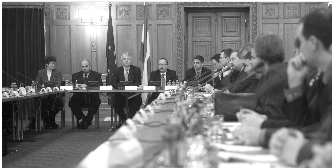
A tárcaközi bizottság a Bethlen Alapról és az egyszerűsített honosítás tapasztalatairól tárgyalt Budapesten

Mint ismert, a Bethlen Alap a korábbi Szülőföld Alap jogutódja, és idén 13 milliárd forint felett rendelkezik. Tevékenységét egy múlt év végén sebtében elfogadott, január elsejétől életbe lépő törvény szabályozza. A jogszabály a „megváltozott nemzetpolitikai szemlélet” jegyében fogant. Kezdeményezői szerint jogelődjétől eltérően a Bethlen Alap egységes döntéshozatali és nyilvántartási rendszerben nyújtja az összes határon túliaknak szánt támogatást. A Szülőföld Alaptól eltérően azonban a Bethlen Alapnál nem a határon túli szervezetek képviselőiből álló szakkollégiumok