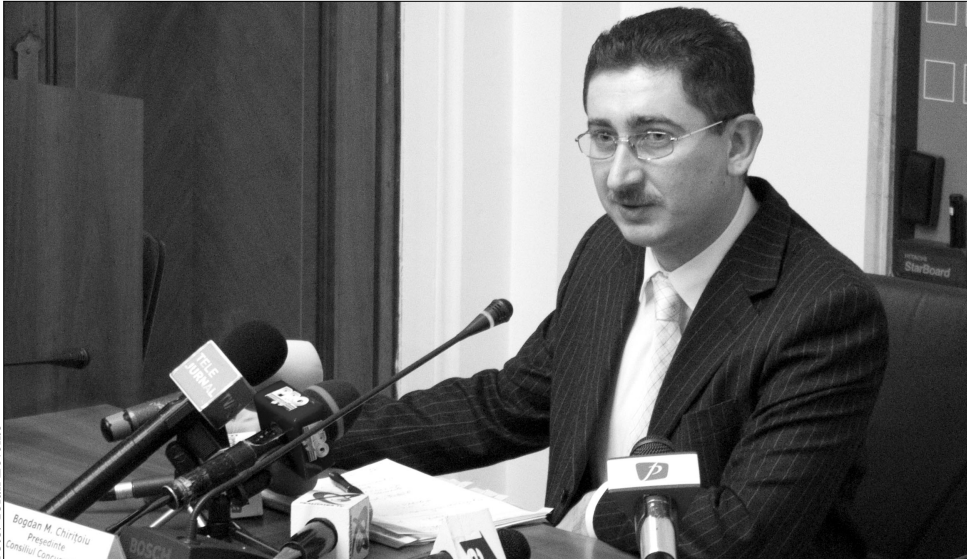
Bogdan Chirîtoiu szerint nem törvénytisztaság az olcsó benzin az uniós legszegényebb országában

Chirîtoiu téves elgondolásnak nevezte, hogy mivel az Európai Unió második