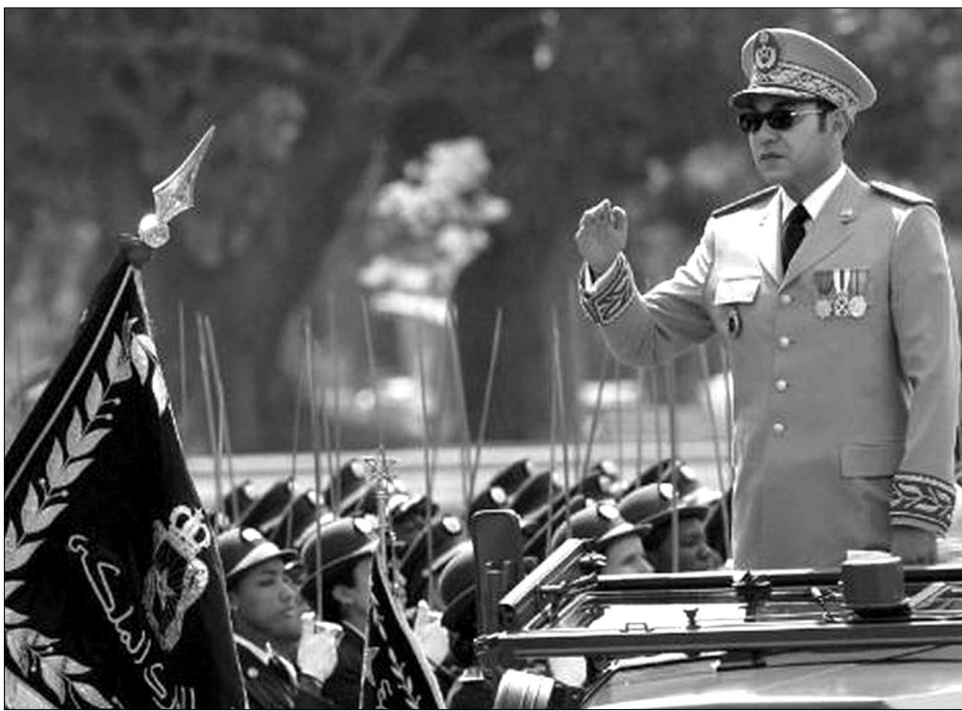
VI. Mohamed, Marokkó királya. Az igazhítűek reformer ura?

Marokkó be nem gyógyult sebét Nyugat-Szaharának hívják. Az egykori spanyol gyarmatot II. Hasszán király, a jelenlegi uralkodó apja akkor kebelezte be, amikor Franco spanyol diktátor éppen haldoklott. A probléma