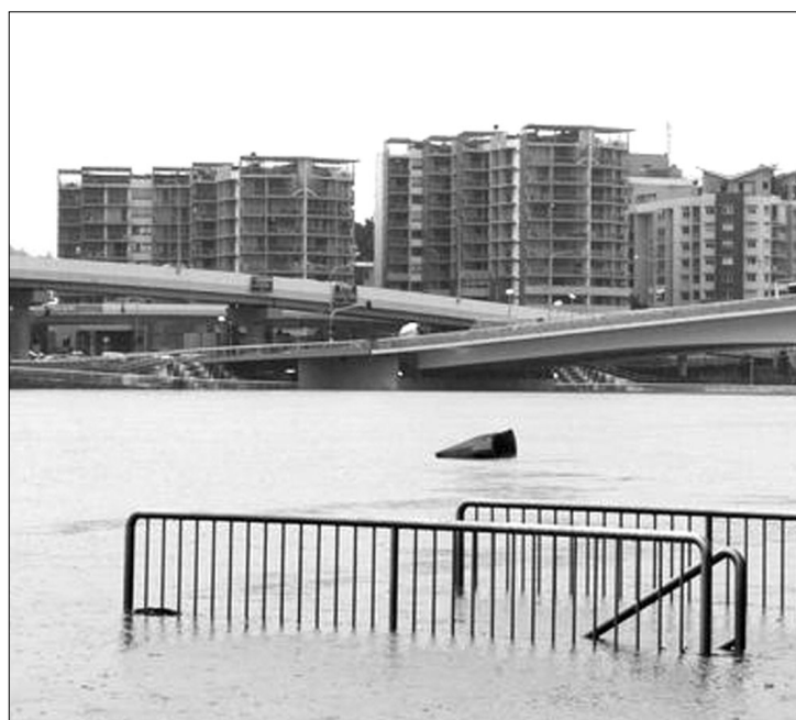
A Brisbane folyó már a belvárost fenyegeti. A halottak száma nyolcra emelkedett