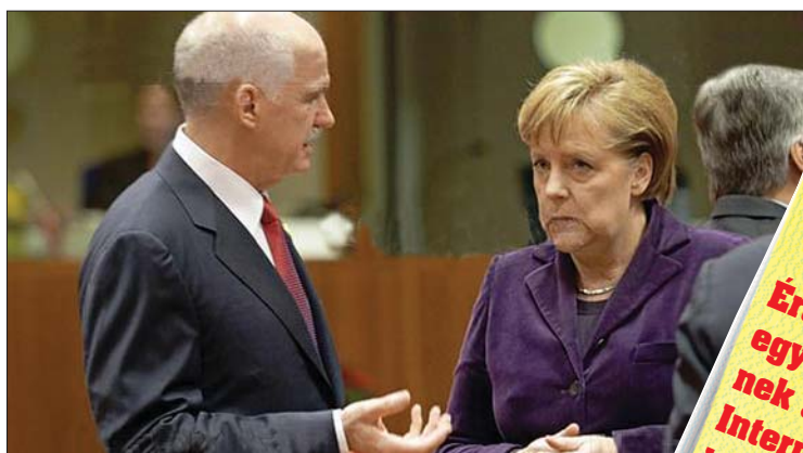
Georgios Papandreu és Angela Merkel az EU-csúcson

Az euróvezet stabilitásának tartós növelését eredményező döntéseket várnak az EU-tagországok állam- és kormányfői tegnap kezdődött brüsszeli kétnapos találkozójukon. 2. oldal