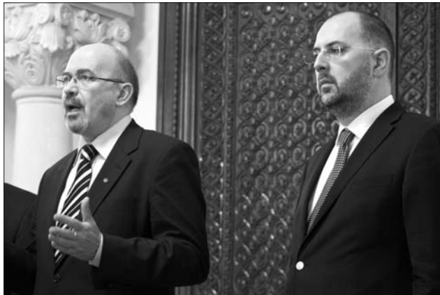
Markó Béla és Kelemen Hunor – mögöttem az utódom?

zel, mert nem lehet kapni élelmiszert, vagy mert nem engedheted meg magadnak, hogy megvásárolj. Függetlenül attól, hogy az állam szünetelteti a fűtést, vagy olyan drágán szolgáltatja, hogy te magad csatlakozol le a hálózatról, a hideget egyformán nehezen lehet kibírni. Akárcsak húsz évvel ezelőtt, az ország vezetői egyre elrugaszkodottabbnak tűnnek a valóságtól. Ahogy mélyül a válság, szónoklataik úgy válnak mind triumfalistábbá. Félteglával verik a mellüket, és nyilvánosan ájuldoznak a rendszer „nagyserű megvalósításai” előtt. A hatalom retorikája, úgy tűnik, egyenesen a proletkult propaganda klasszikus forrásaiból ihletődik. A minap Elena Udrea-t hallottam, amint büszkén jelent ki, hogy „az egész ország egy építőtelep”, és hirtelen az ötvenes évek slágerének híres refrénje jutott eszembe: „Ezüst toronydaruk nevetnek a napba...” Ceaușescu korában a szocialista versenyben elért nagyserű sikerekről, termelési rekordokról és a terv szűdtületes túlteljesítéséről szóltak a jelentések. A mai miniszte-