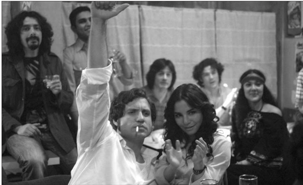
Carlos című filmjében Olivier Assayas jó érzékkel rajzolja meg az egyik legkeresettebb terrorista portréját

A fikciót és a valóságelemeket jól egybeszövő forgatókönyv öntudatos embernek festi le Carlos, aki nem szolgálja az általa követett elveknél, hanem azok aktív megvalósítója. Sőt: a film megengedi azt is, hogy Carlosban egy, a mi világfelfogásunkkal összeegyeztet-