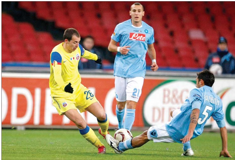
A Steaua játékosai (sárga mez) az utolsó percben lőtt góllal kaptak ki Nápolyban

A L jelű négyesben már korábban eldőlt, hogy az FC Porto (16 pont) és a Besiktas (13) a két továbbjutó. Az utolsó eredmények: Besiktas–Rapid Bécs 2-0 és FC Porto–CSZKA Szófia 3-1. ◀