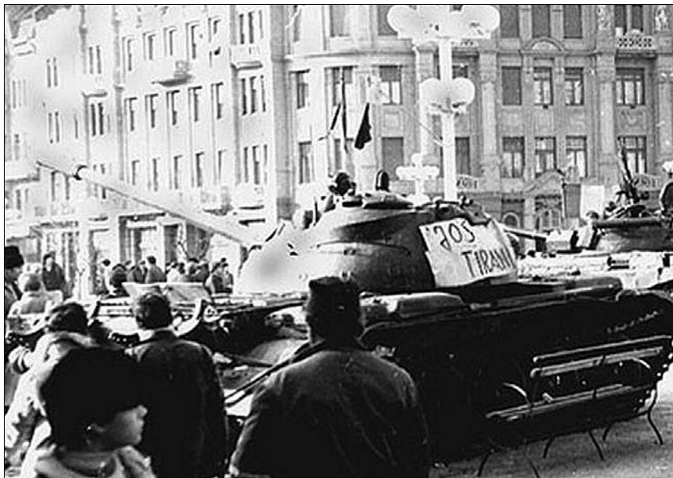
Temesvár, 1989 decembere. A szabadság első pillanatai: fraternizálnak a tüntetőkkel a katonák

mester is, aki felvetette a kilakoltatás felülbírlásának lehetőségét, erre azonban nem volt hajlandó írásos garanciát adni. A tiltakozás fokozatosan tüntetéssé alakult át, így a helyszínen megjelentek a rendőrség és a Szekuritáté egységei. A megmozdulás ennek ellenére csakhamar átfogta az egész várost, a főbb utcákon végigvonuló tüntetőkhez lumpen elemek, provokátorok csatlakoztak, akik bezúzták az üzletek kirakatai, ürügyet szolgáltatva ezzel a hatósági erőszakhoz.