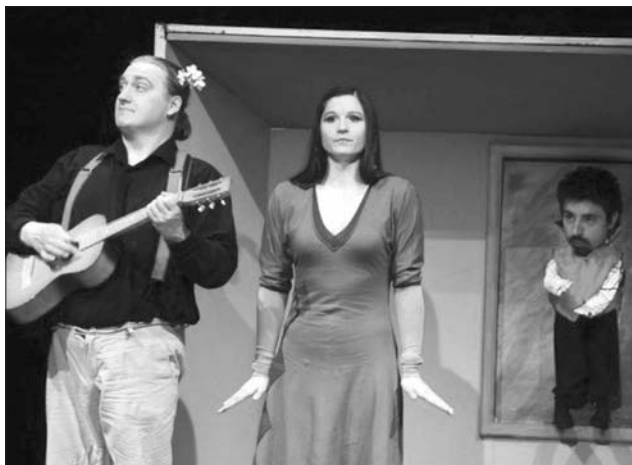
Látszatok játéka: Valère Novarina darabja egyszerre épít az operettre és írja át annak műfaját

– Már jó évtizede tanítok a Babeş-Bolyai Tudományegyetem szatmári magyar pedagógusképző tagozatán, és némi tapasztalat után úgy gondoltam, a rajzhoz külön készítek egy módszertani könyvet, ami egy kicsit meg is szeretheti a diákokkal ezt a tantárgyat. Mert az a cél, hogy lehetőleg szeressék is, amit tanulnak, s akkor könnyebben befogadják. Sok jó és értelmes diák van, megérdemlik, hogy törődjünk velük. Igyekszem arra is külön rávezetni őket, hogy inkább felkeljenek a szűkebb életterület értékeit. Mert az önbecsülés, a jó értelemben vett lokálpatriotizmus, s vele a nagyobb, ha úgy tetszik, nemzeti közösségünk értékeinek tisztelése valahol itt kezdődik. Így arra kérem őket, hogy sablonos iratsomók gyűjtése helyett inkább mérjék fel, írják és fényképezzék le a falu és szűkebb életterület értékeit. A templomtól és az iskolától kezdve a régi csűríg, istállóig, présházig, érdekes kapuig vagy fejfáig. Már eddig annyi anyag jött be, hogy alig győzőm átnézni, csak fotóból több ezer. Ahogy látom, néhány diákom máris falumonográfiát akar írni, aminek nem csak én örülhetek!