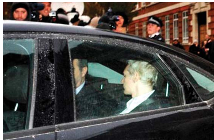
Őrizetbe vették a WikiLeaks-botrány főhősét, Julien Assange-t. 2. oldal ▶