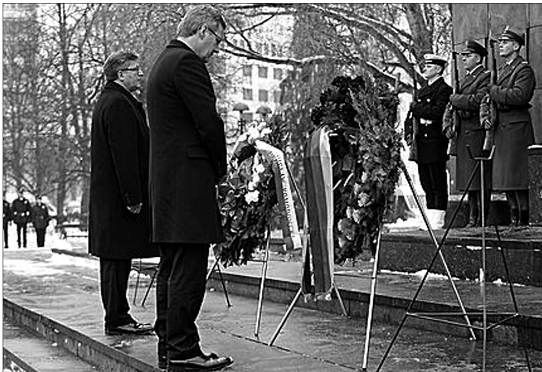
Christian Wulff (jobbra) és Bronislaw Komorowski közösen koszorúzott a varsói gettóbéli emlékműnél

Negyven év után is időszerű a térdre borulás gesztusa