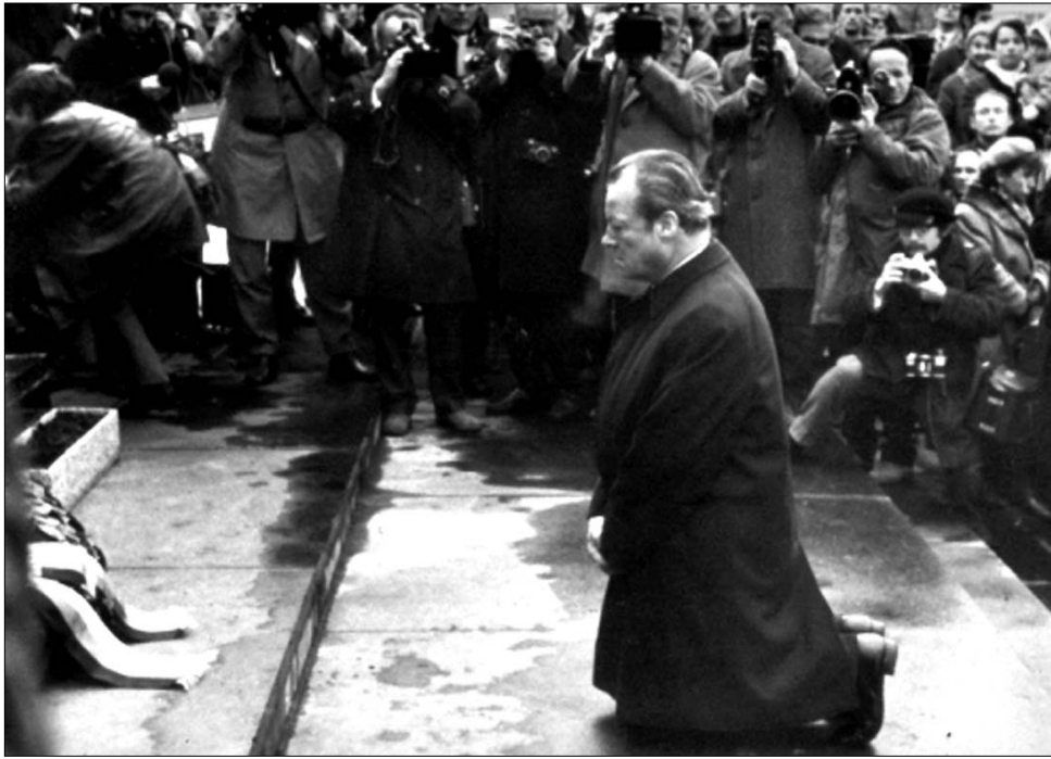
Willy Brandt volt nyugatnémet kancellár „történelmi térdeplése” Varsóban

Wladyslaw Gomulka, a kommunista pártfőnök azonban, aki a cselekedetet a saját számlájára könyvelhette volna el, Cyrankiewiczsel együtt még karácsony előtt megbukott. Az élelmiszerárak drasztikus emelése következtében mindenekelőtt a gdanski hajógyár munkásai körében zavargások törtek ki az ifjú Lech Walesa vezetésével. A biztonsági erők leverték a tüntetéseket, halottak tucatjait hagyva hátra. Lengyelországban egyik pillanat-