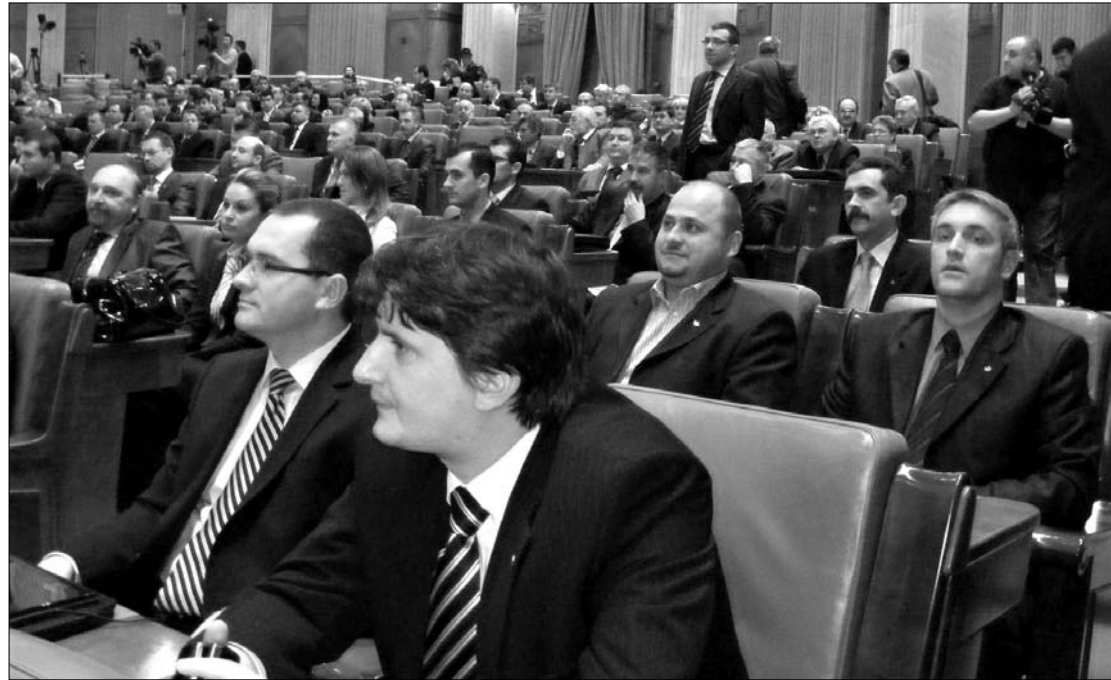
Nem ültek tétlenül. Az RMDSZ képviselőházi frakciója visszakoázásra kényszerítheti a kormányt

Emil Boc miniszterelnök hétfőn este a kormányülést megszakítva tartott rendkívüli sajtótájékoztatót, ahol bejelentette: 2011. január 1-jétől kettőről egy évre rövidül a gyermeknevelési szabadság. Továbbá a gyes összege változatlan maradna: legkevesebb 600, legtöbb 3400 lej. A kismamák a második évben egy év fizetés nélküli szabadságra lesznek jogosultak, a munkahelyükre visszatérő nőket pedig egy éven keresztül 500 lejes fizetéspótlék illeti meg. Az intézkedések nem érintenék a jelenleg gyermeknevelési szabadságukat töltő személyeket. ◀