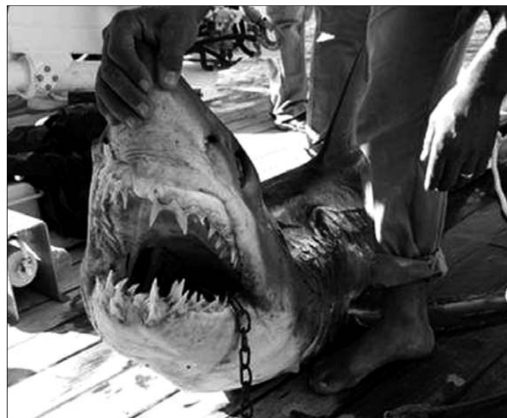
Két cápát sikerült kifogni, de egy társuk folytatta a támadásokat

ez csalogatta oda a ragadozókat. A búvárparadicsom turistaiparáért aggódók a helyi hivatallóságok részéről még olyan földtől elrugaszkodott elméleteknek is hangot adnak, hogy a cápákat az izraeli titkosszolgálat, a Moszad engedte szabadon a partoknál. ◀