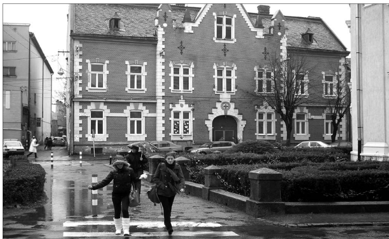
A volt szatmárnémeti zeneiskola épületében működik tegnapról a Bartók Béla Hagyományörző Művelődési Egyesület

► Filozófiaesszé-pályázatot hirdet a kolozsvári Babeş-Bolyai Tudományegyetem filozófia tanszékcsoportjának magyar tagozata. A pályázaton éssz vehetnek a 2010-2011-es tanév XI. és XII. osztályos tanulói. A 3-5 oldal terjedelmű, kinyomtatott és jelígelvel ellátott pályaműveket postai úton a Bolyai Társaság címére április 29-ig (postai bélyegző dátuma) küldhetik a diákok. A pályamunkákat kidolgozott szabályzat alapján a tagozat oktatóiból álló bizottság 1-től 100-ig terjedő ponttal értékeli. Az elbírálás szempontjai között egyaránt szerepel az íráskészség, valamint az, hogy a pályázó hogyan gondolja végig a környező világgal kapcsolatos megfigyeléseit, hogyan tudja érvényesíteni a rendelkezésére álló filozófiai ismereteket a mindennapi tapasztalatok elemzése és értelmezése során, mennyire képes egy világos, összefüggő gondolatmenetet felépíteni és érvekkel alátámasztani. A pályamunkákat díjazták; a legalább 70 pontot elért íráskészítői a felvételi versenyen kívüli beiratkozási lehetőséget kapnak a BBTE-re, a filozófia szak magyar tagozatán meghirdetett, államilag támogatott (tandíjmentes) helyekre, a rendelkezésre álló helyszám, valamint a kapott pontszám sorrendje függvényében. ◀