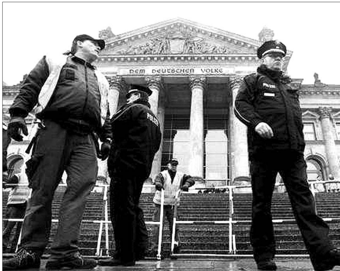
A Reichstagot állítólag terrortámadás fenyegeti, ezért rendőrök vigyáznak a hírneves berlini épületre

A pánikot egy hamis bombariadó váltotta ki, amelyet az Air Berlin járatán felfedezett gyanús csomag miatt rendeltek el az elmúlt héten Münchenben. Namíbia fővárosában, Windhukban a repülőtéri rendőrség őrizetbe vette annak a részlegnek a vezetőjét, ahol egy bőrönd szíjára a riadót kiváltó bombautárat erősítették. ◀