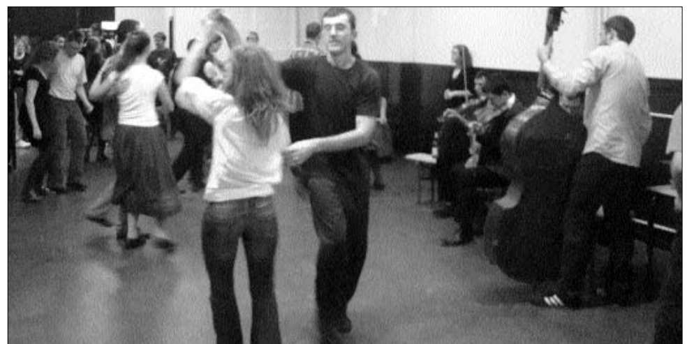
Fesztiválozott az Ördögtérge. A fiatal táncosok azt tanítják, amit az adatközlőktől tanultak

Munkásságát a színházi szakma is értékelte: 1978-ban a Brassói Kortárs Színházi Fesztiválon, Fügedes (Sütő András: Vidám sirató) egy bolyongó porszemért szerepével a legjobb férfi alakítás díját érdemelte ki, 1999-ben az Erdélyi Magyar Közművelődési Egyesület Bánffy Miklós díjat adományozott neki. Kisvárdán a Határon Túli Magyar Színházak Fesztiválján Életműdíjjal jutalmazták pályafutását. ◀