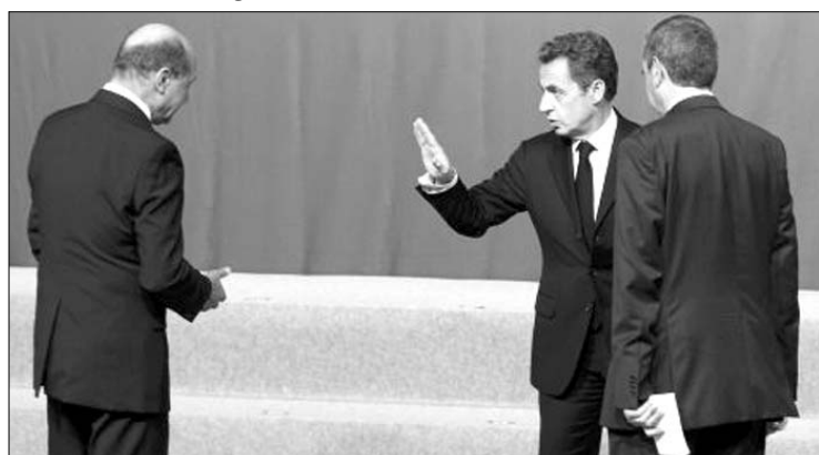
NATO-csúcs. A felvételek tanúsága szerint a francia elnök kikoszorázta a románt

zás előtt Romániának és Bulgáriának „rendezni kell a keleti határainál fellelhető problémákat”, valamint a két országnak sikeresen le kell zárnia az Európai Bizottság által beindított együttműködési és ellenőrzési mechanizmust. „Franciaországnak az az álláspontja, hogy Románia és Bulgária helye a Schengen-övezetben van, viszont be kell bizonyítaniuk, hogy képesek felügyelni az EU keleti határait” – fogalmazott Sarkozy. A francia államfő hangsúlyozta: véleménye szerint a román–moldáv határ nincs kellőképpen „biztosítva”. „Nem igaz, hogy fakép-nél hagytam Bănescut”. Sarkozy ugyanakkor a fotózás előtti heves vitát illetően magyarázkodott: „Aznapi több mint tizenöt-ször beszéltem a román elnökkel, akit nagyszerű embernek tartok és nagyon tiszteltem” – mondta. ◀