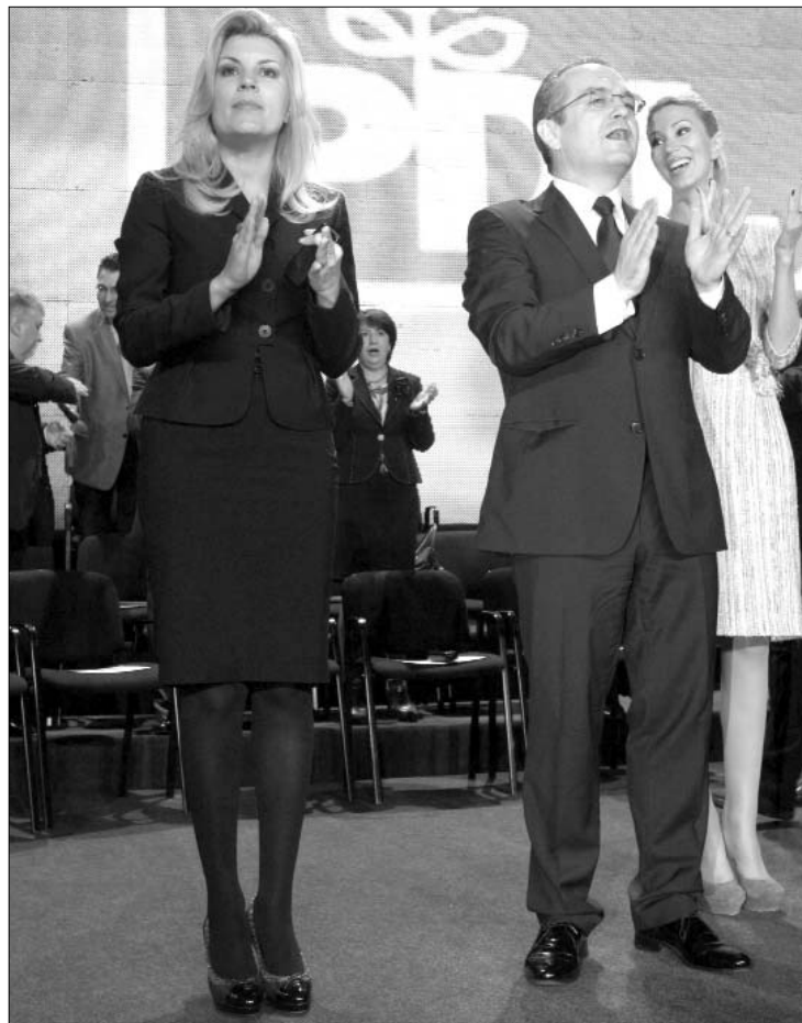
Elena Udrea megválasztását Emil Boc kormányfő is megünnepelte.

A borítékolható sikerre való tekintettel sokkal érdekesebbek voltak küldöttgyűlésen elhangzott politikai nyilatkozatok. Mivel a kormánypárt vezetői szinte kivétel nélkül megjelentek, kongresszus-szerű hangulat jellemezte az ülést. A legtöbben Elena Udrea érdemeit taglalták. Ioan Oltean PD-L alelnök a felkelő naphoz hasonlította a jelöltet, Raluca Turcan pedig egy filmes hasonlattal élve arra biztatta Udreát, hogy Quentin Tarantino filmbeli hőséhez hasonlóan „valódi Kill Bill-ént” semmisítse meg a PD-L politikai ellenfeleit. Kissé furán hatott Emil Boc kormányfő, PD-L-elnök beszéde is, aki bemutatta kabinetje megvalósításait, mintegy előrevetítve az átalakulóban levő erőviszonyokat.