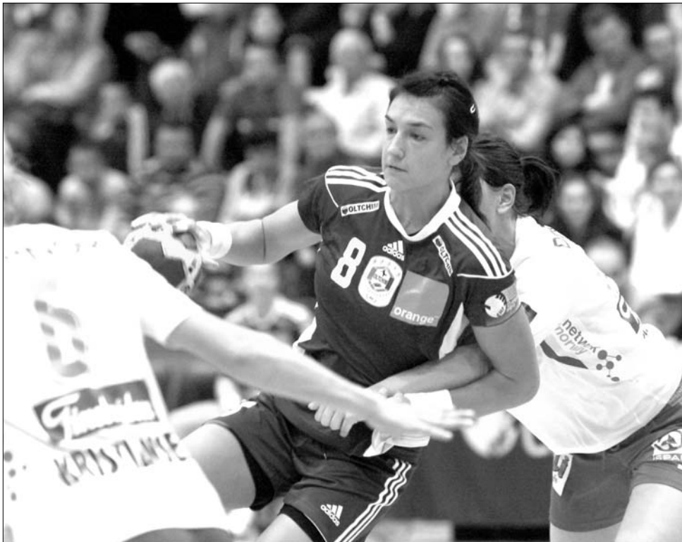
Az Oltchim 33-28-ra verte a már biztos csoportelső, cserejátékosaival kiállt norvég Larvikot.

Férfi Challenge Kupában a Shtiința Dedeman Bacău 33-25-re nyert a belga Initia Hasselt otthonában, így már a visszavágó előtt továbbjutónak számít. Ugyanazon harmadik selejtezőkör keretében a Steaua feladta a pályaválasztói jogát, így november 27-án és 28-án is Lisszabonban mérkőzik meg a portugál SL Benfica-val. ◀